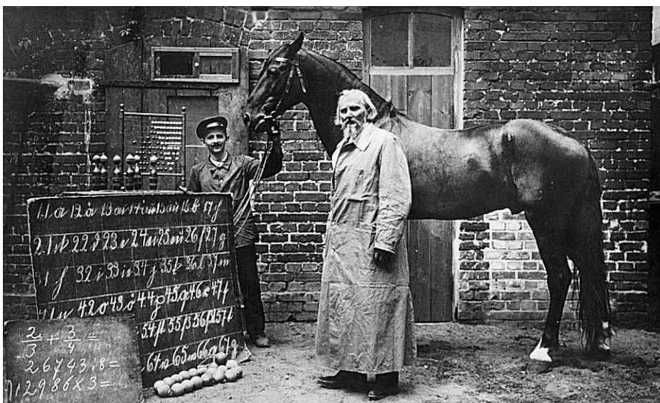
Wilhelm von Osten és Okos Hans

Az előbbi még csak-csak megmagyarázható az állatok kiváló memóriájával, de ugyan, hogy voltak képesek elvégezni mindenféle matematikai műveleteket? Erre a kérdésre talán a kor egy másik nemzetközi hírnévnek örvendő mutatványosa, Okos Hans adja meg a választ. Okos Hans, tudniillik, egy bizonyos német gimnáziumi matematikatanár, Wilhelm von Osten lova volt, aki az 1900-as évek elején számtantudományával az egész világot lázban tartotta, olyannyira, hogy arról még a New York Times is megemlékezett 1904-ben. Hans állítólag tudott összeadni, kivonni, szorozni, osztani, törtekkel dolgozni, ismerte az órát, képes volt naptár-feladványokat megoldani, különbséget tenni a zenei hangok között, továbbá olvasni és betűzni. Ha von Osten megkérdezte Hanstól: „ ha a hónap nyolcadik napja keddre esik, akkor mi lesz a következő péntek dátuma? ”, akkor Hans tizenegyszer a patájával koppintva válaszolt. A kérdéseket szóban és írásban is fel lehetett neki tenni. Von Osten kiállította Hans-t egész Németországban, és soha nem kért belépődíjat.