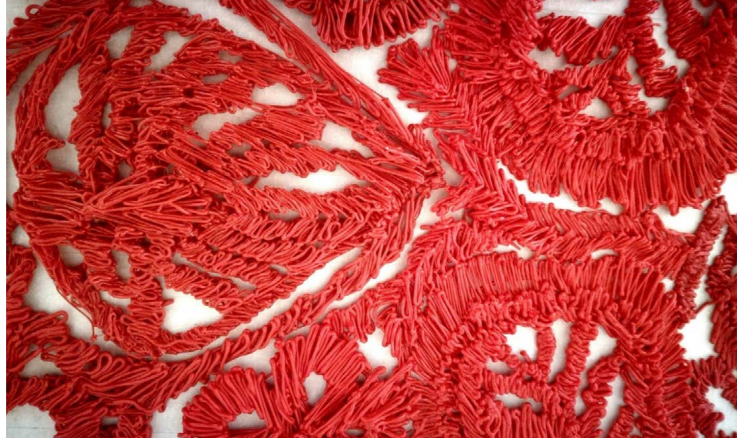
In-Organic (részlet) , 2017 3D print, PLA filament, kb. 70 x 50 cm