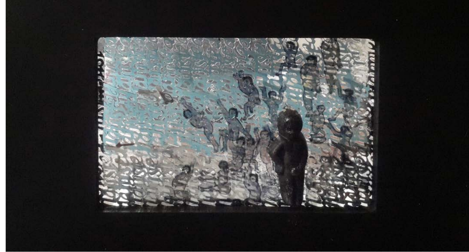
Salted Candy sorozat, No.5, 2015