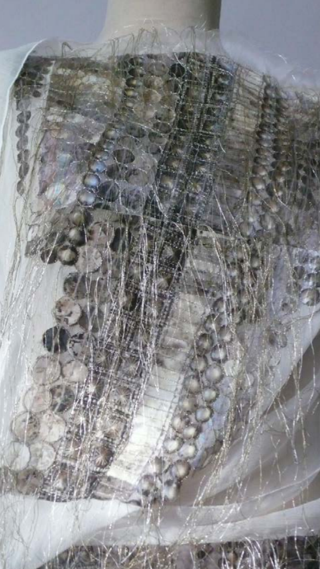
Viselések (részlet) , 2012