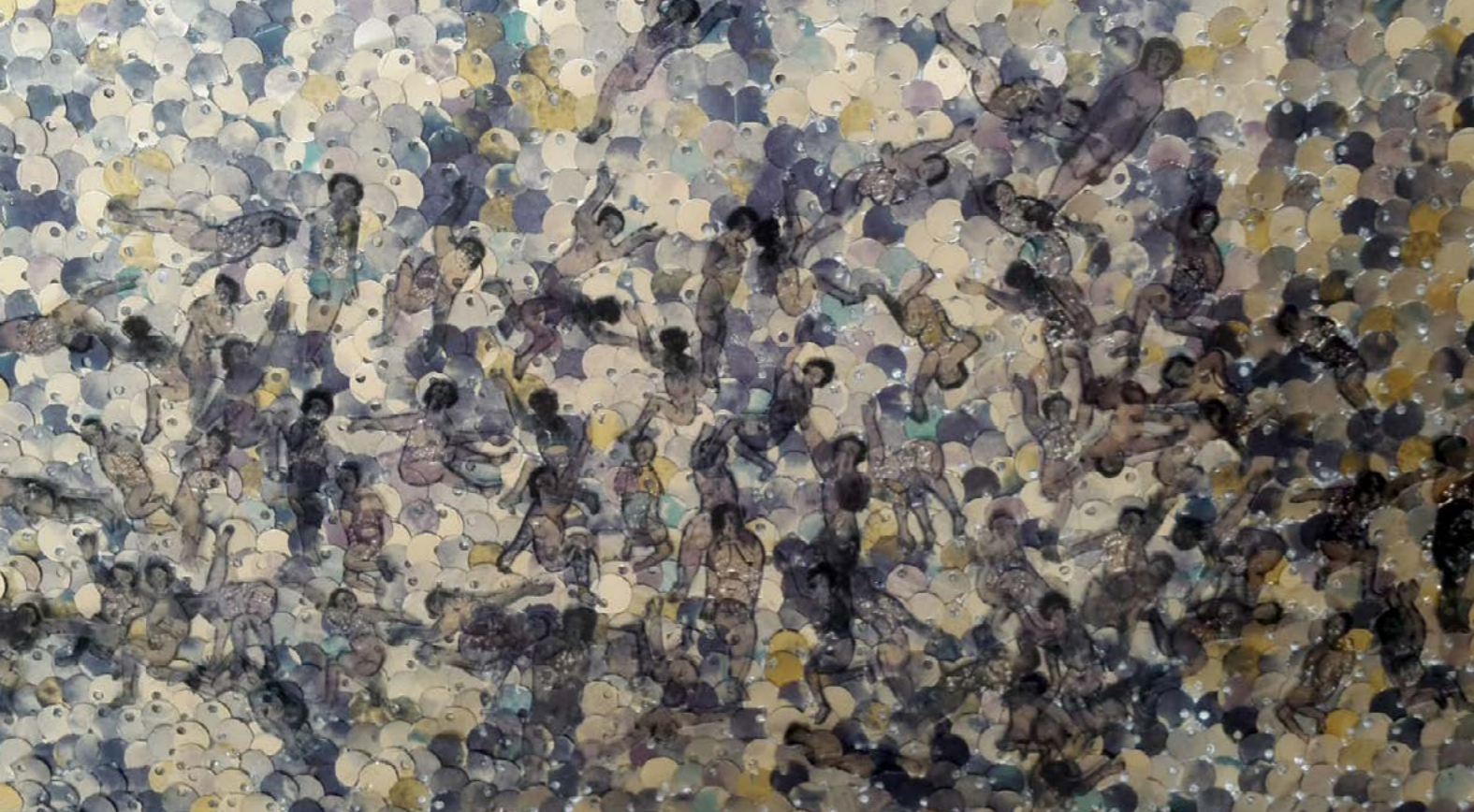
Treasure (részlet) , 2015