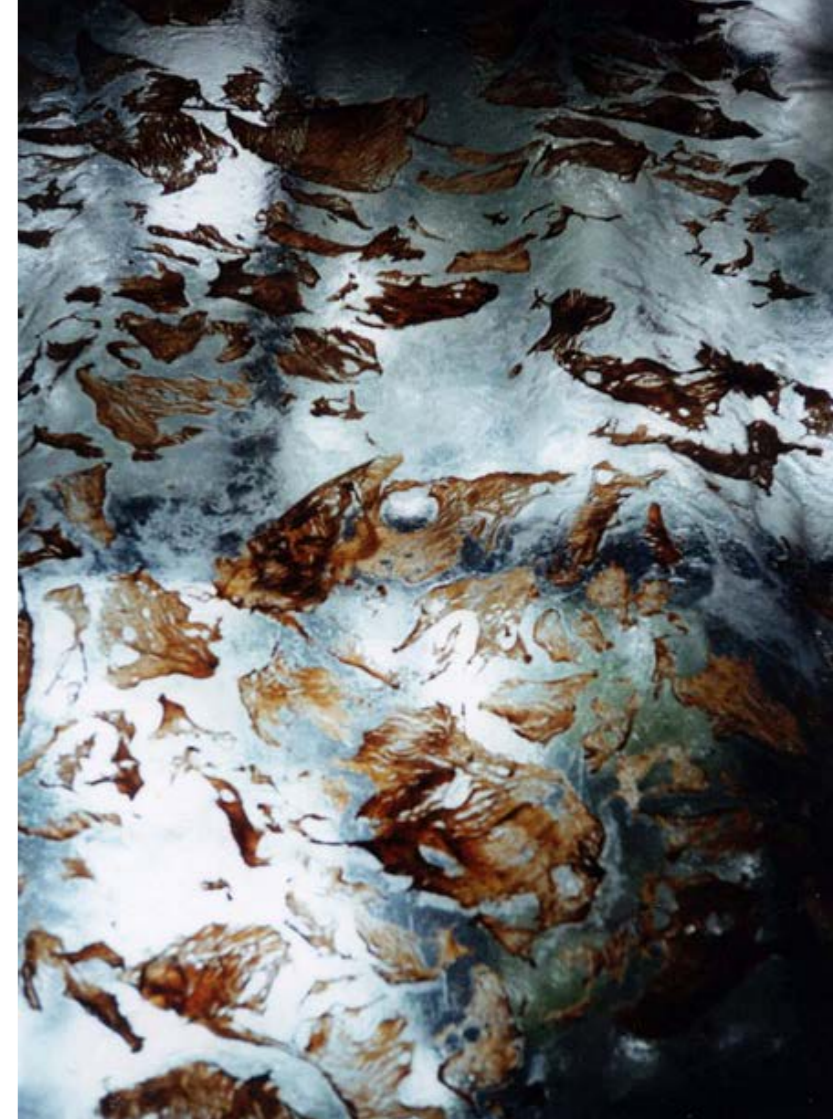
Feuille viande (részlet) , 2002 víztiszta ponyva, hús, 240 x 140 cm Magyar Képzőművészeti Egyetem