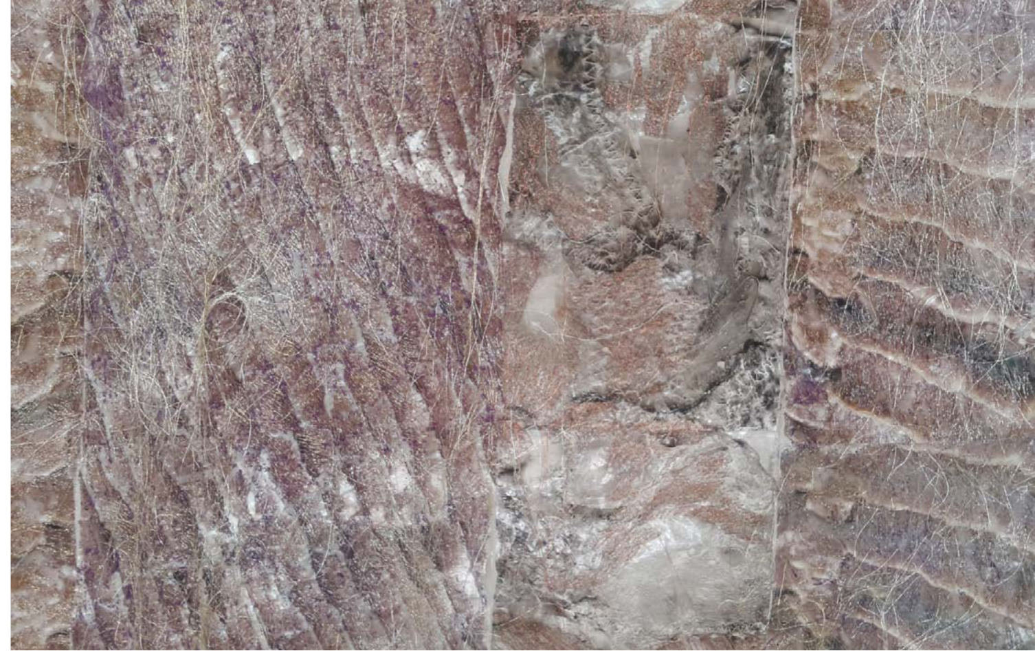
Natural Skin No. 1. (részlet), 2015