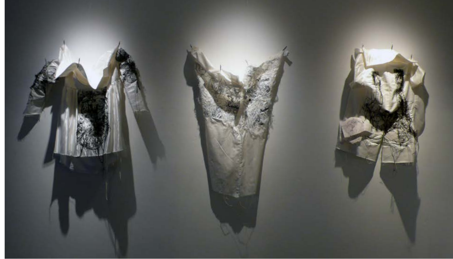
Medical Dress and Jacket, Dürer Wedding dress , 2005-2008

4. Textilművészeti Triennálé, Szombathelyi Képtár, 2012