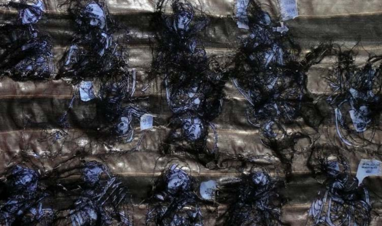
Deviáció variáns (részlet), 2006