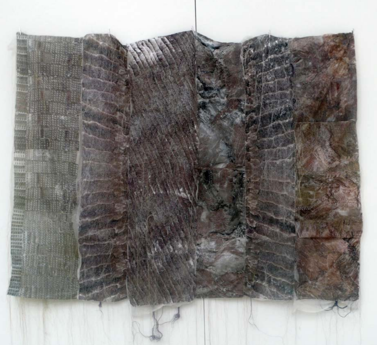
Natural Skin No. 1.