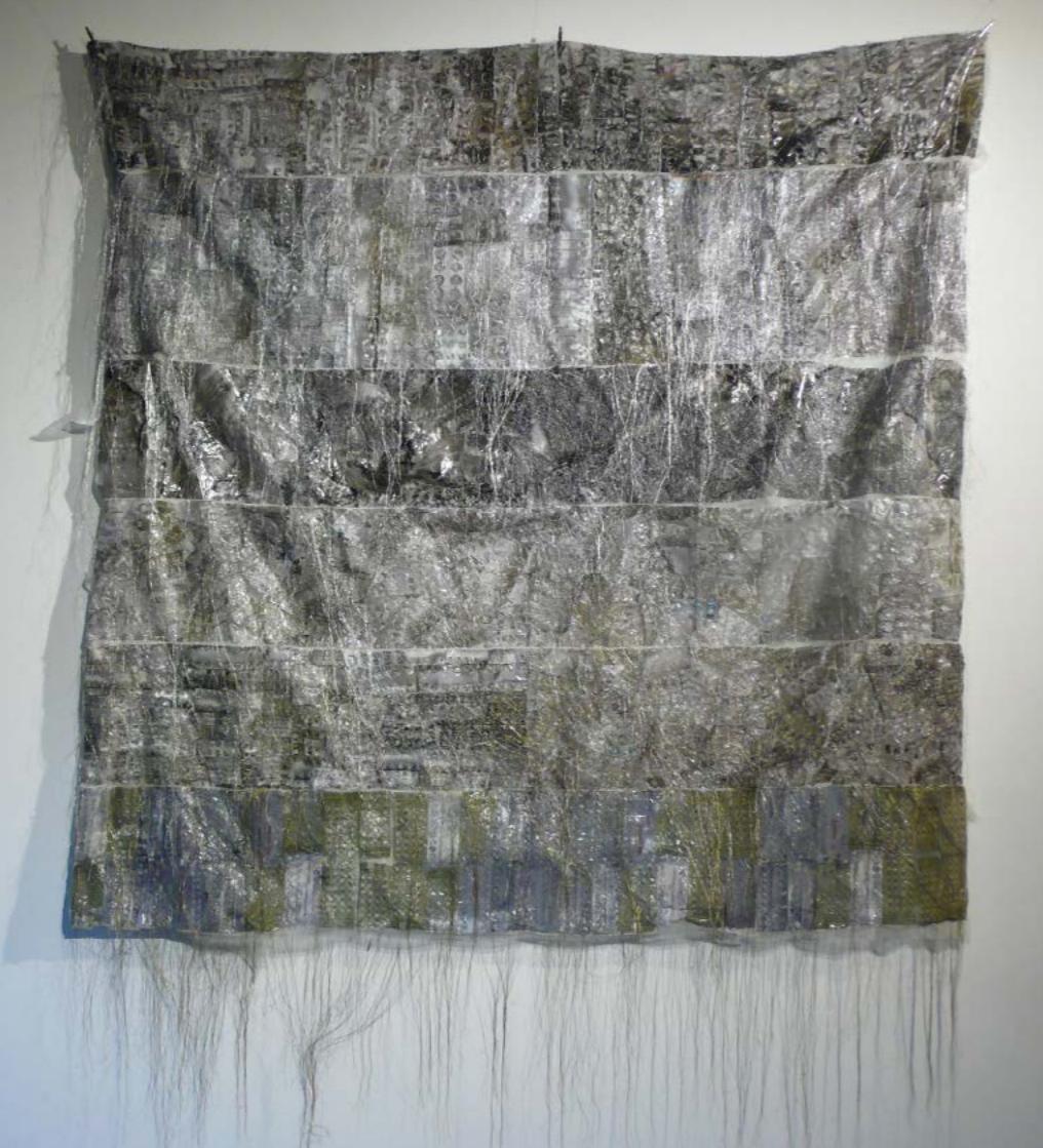
Natural Skin No. 2. , 2015 selyem, fólia, hímzés, 113 x 132 cm