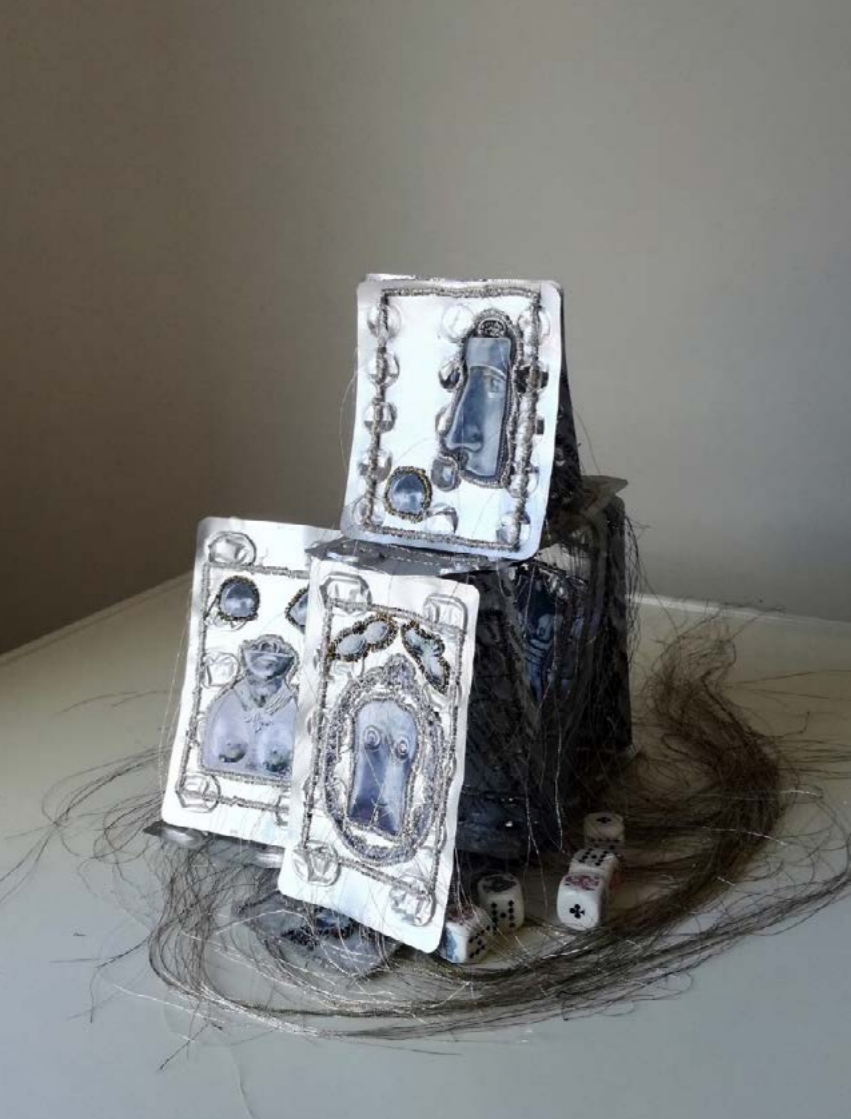
House of Cards , 2017 gyógyszeres fólia, papír, dobókocka, hímzés 20 x 20 x 20 cm Minitextil, Como No. 27.