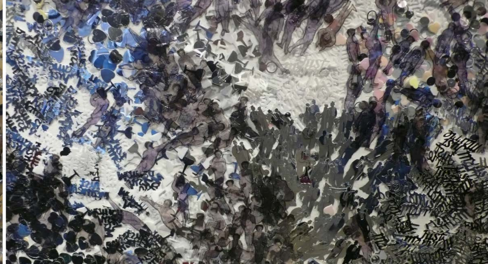
Just Married (részlet) , 2014

Galerij Notre Dame des Arts, Ubbergen, Hollandia, 2015