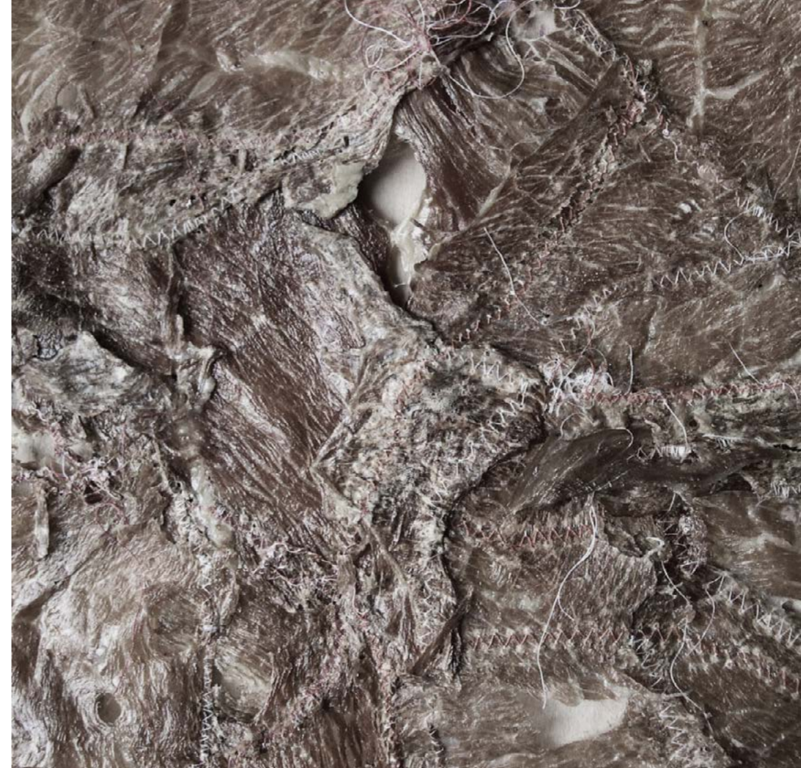
Wounds (részlet), 2005 hús, hímzés, 30 x 40 cm