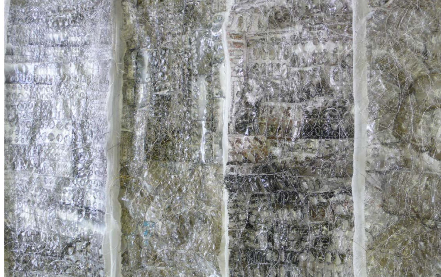
Natural Skin No. 2. (részlet) , 2015