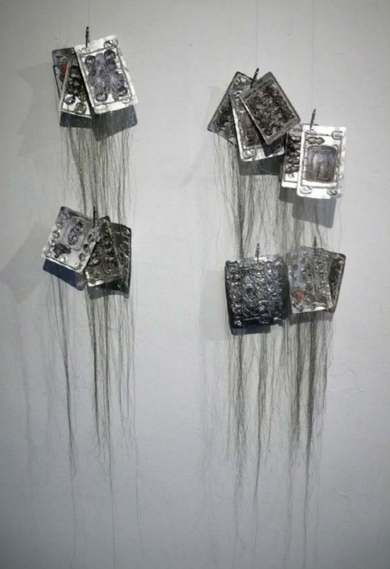
Card Game , 2012 blizster, hímzés Debuut, Expopodium, Lindenberg huis voor de kunsten, Nijmegen, 2014