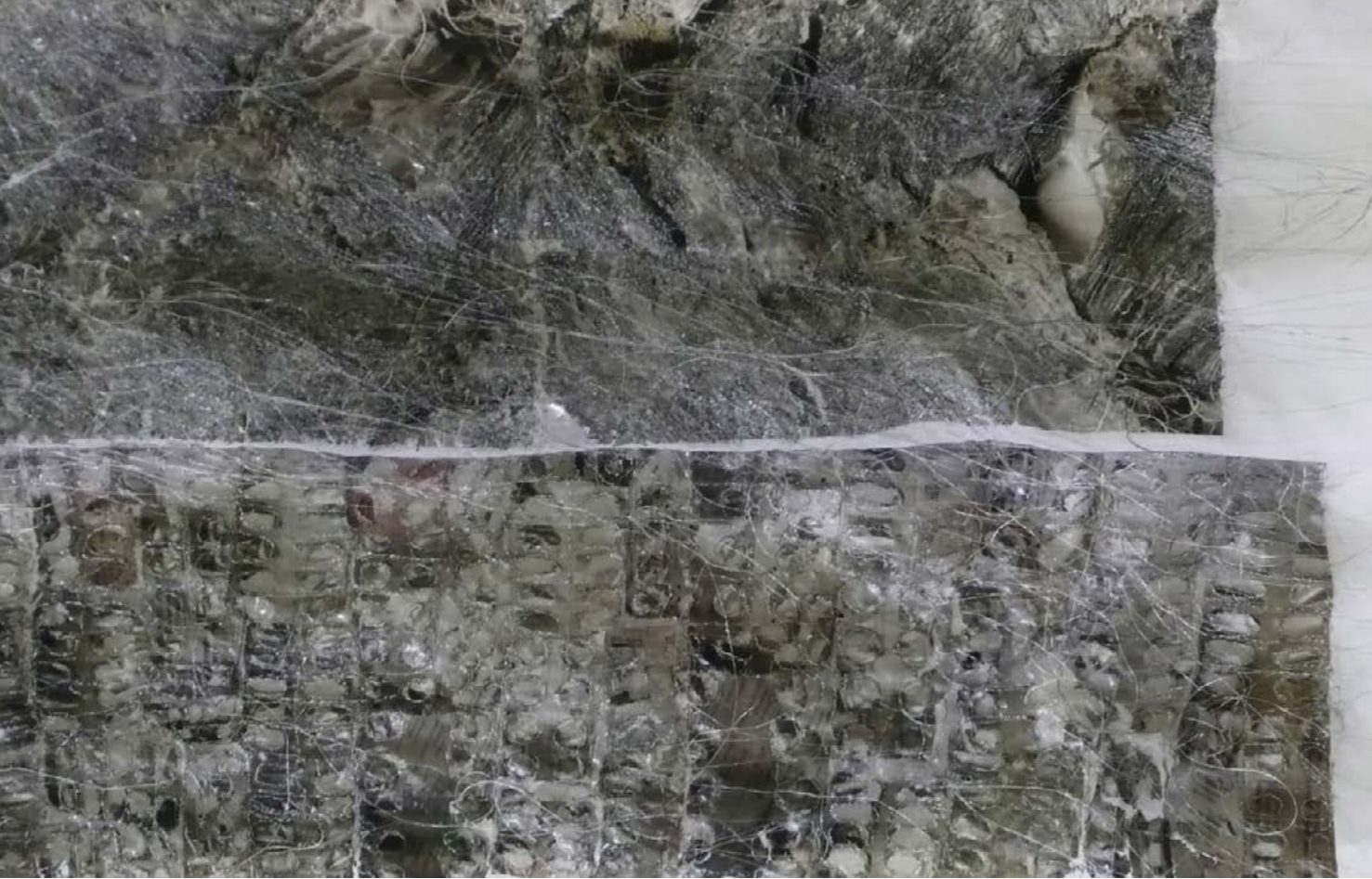
Natural Skin No. 2. (részlet), 2015