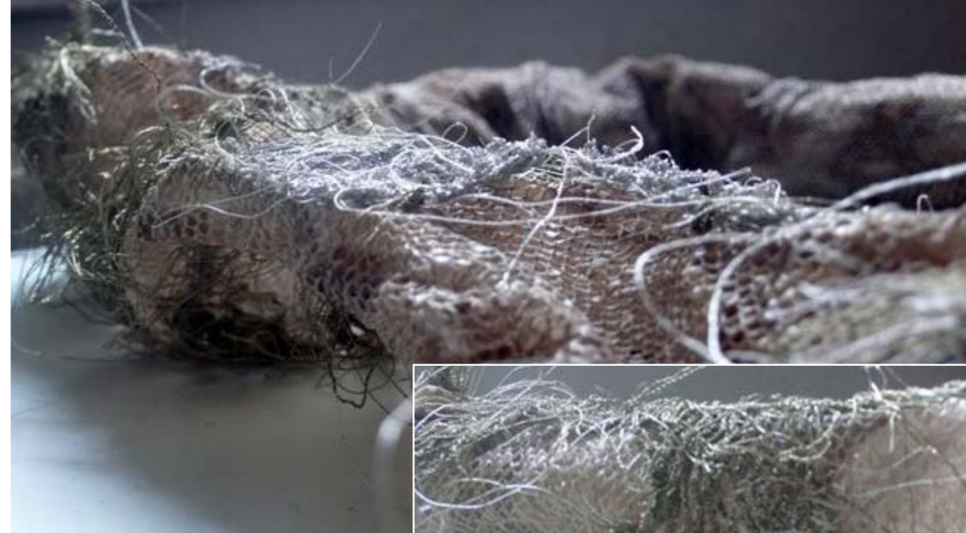
Snakebirds (részletek) , 2011 vedlett kígyóbőr, hímzés, 180 x 20 x 20 cm 4. Textilművészeti Triennálé, Szombathelyi Képtár Iparművészeti Múzeum, Budapest, 2012