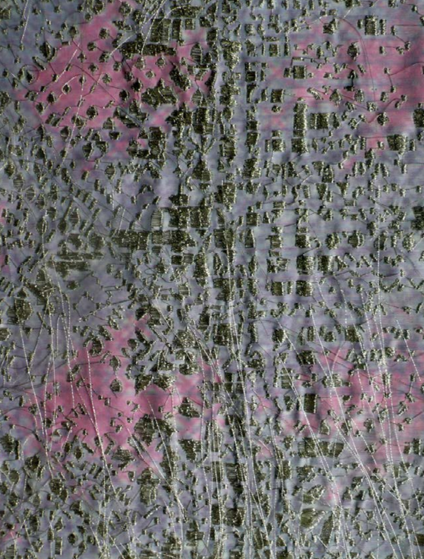
Taafelkleding sorozat, No.5, 2015