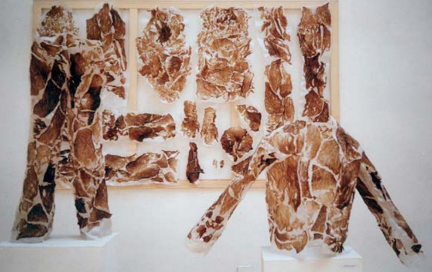
Diploma , 2002 hús, víztiszta fólia, pasz, Magyar Képzőművészeti Egyetem