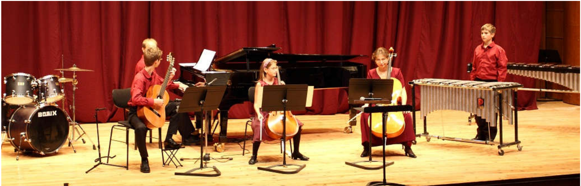
DominKoncert – azaz „Pillanatképek egy zenészcsalád életéből” – Győr, 2012