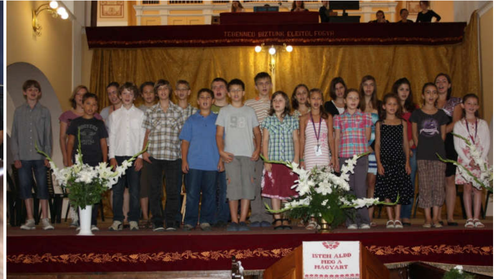
Gyermekkórusunk szereplése a Sárospataki Református Templomban

Alkalmanként mesterkurzusokon, zenei fesztiválokon, konferenciákon, nevezetes eseményhez, jubileumhoz kapcsolódó ünnepeken tartok előadásokat zenepedagógiai, zene- vagy művészettörténeti témákból , kiváltképpen két legfőbb kutatási területem, Robert Schumann és Farkas Ferenc művészetéhez kapcsolódóan (3-5. sz. dokumentumok).