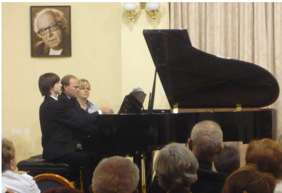
Közös fellépés Egerben az egyik mentorált tanítványommal

A zenei versenyekre és a továbbtanuláshoz szükséges felvételekre való felkészítés a pedagógiai munkám természetes része, azonban nem csak a saját tanítványaimhoz kapcsolódóan, hiszen sokan kérnek alkalmankénti meghallgatást, konzultációt illetve felzárkóztató programban való részvételi lehetőséget, vagy éppen ösztöndíjakhoz, versenyekhez, felvételekhez szükséges ajánlást más zeneiskolákban és középiskolákban tanulók közül is. Csupán az elmúlt néhány év alatt 10 növendékem nyert felvételt a Zeneakadémiára, illetve valamelyik vidéki felsőoktatási intézménybe.