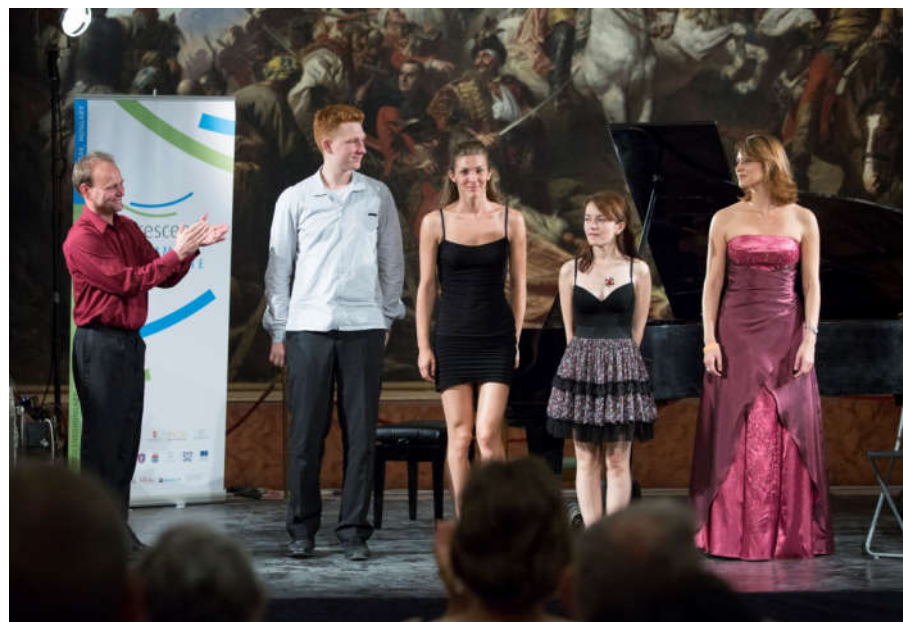
Főtárgyas és mentorált tanítványaimmal a Magyar Nemzeti Galériában