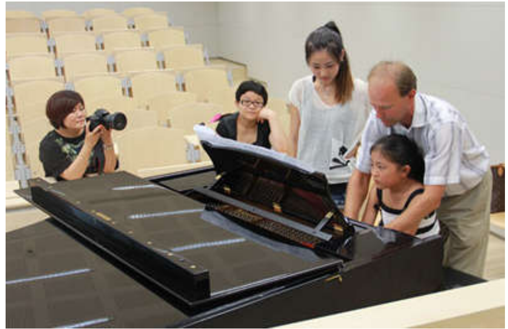
Mesterkurzus a Zeneakadémián – 2012. augusztus 2-5.

A világ közel 30 országából érkeznek ide fiatalok, hogy az intenzív kéthetes kurzus aktív résztvevői legyenek, sokukkal pedig még tanév közben is folytatom a mentori tevékenységgel járó munkát. A Nyári Akadémia elsősorban a pályára készülő fiataloknak nyújt nagyszerű lehetőséget tudásuk gyarapítására és művészi képességük kibontakoztatására, ezáltal főként középiskolás és egyetemista korú résztvevők érkeznek. 12. éve már annak, hogy egy szűk művésztanári csoporttal létrehoztuk az Ifjúsági szekciót, melynek keretében a 14 év alatti, zeneiskolás korú tehetséges növendékek fogadásának feltételeit is megteremtettük, ezáltal a velük való egyéni és csoportos foglalkozásra, tehetségkutatásra és tehetséggondozásra is lehetőség nyílt. Számos versenyre, koncertre, külföldi fellépésre készíthetem már fel növendékeket Sárospatakon és Tokajban, elsősorban hazai művészeti iskolákból érkezőket, de külföldieket úgyszintén, mivel a mesterkurzusok több nyelven folynak. A 2012-es Crescendo rendezvénysorozatáról írt beszámoló elolvasható a Parlando zenepedagógiai folyóiratban: http://www.parlando.hu/2012/2012-4/2012-4-16-Dominko.htm