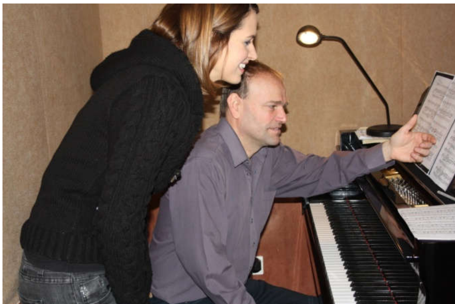
Instrukciók felvétel közben