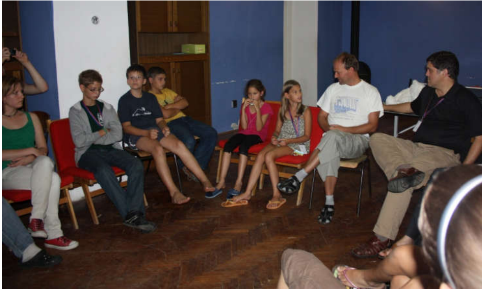
Kiscsoportos foglalkozás az Ifjúsági szekció diákjaival – Sárospatak

Tanári pályám kezdete óta részt veszek fiatalok részére tartott zenei és egyházi táborok szervezésében, vezetésében, ifjúsági körök és csoportok szakmai és lelki vezetésében. Minderre legfőképpen a Crescendo Nyári Művészeti Akadémián nyílik lehetőség, ahol a fiatalok szakmai képzésén kívül kiscsoportos foglalkozások vezetésével, közösségi programok szervezésével, lelki és szakmai tanácsadással is foglalkozom. De egyéb zeneiskolai, valamint egyházi szervezésű ifjúsági táborok szervezésében és vezetésében is részt veszek.