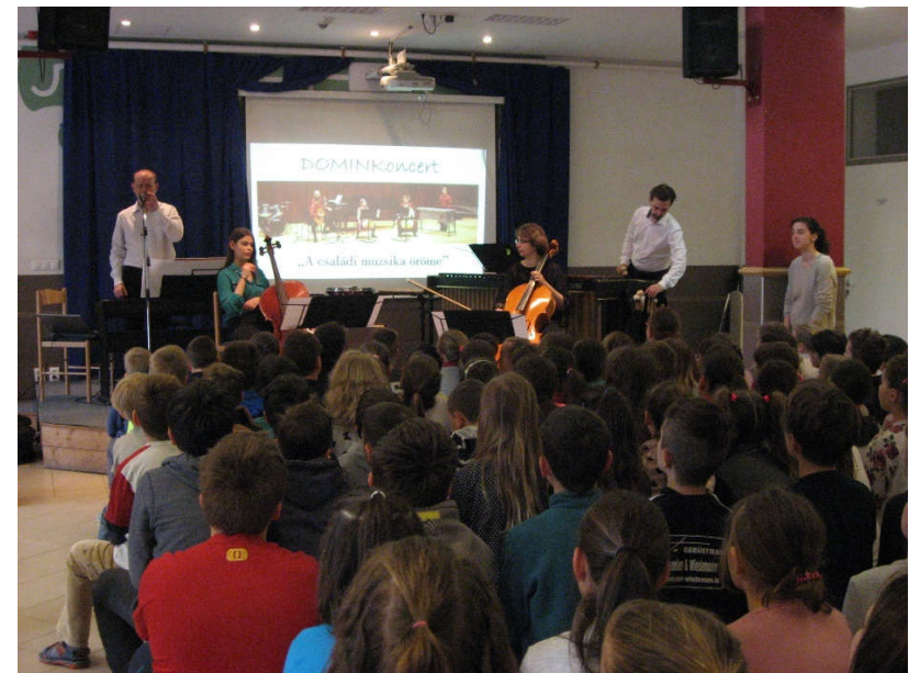
DominKoncert – NKA ifjúsági ismeretterjesztő koncertsorozat 2017/18