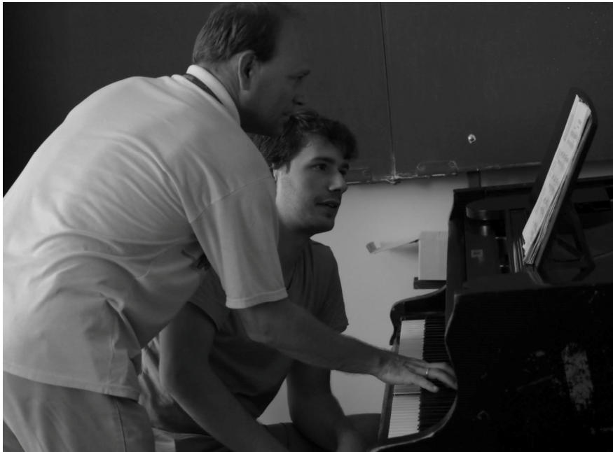
Mesterkurzus a Crescendo Nyári Akadémián