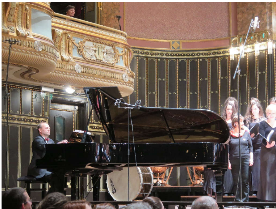
2016-os Tavasz Fesztivál zárókoncertje a Zeneakadémián