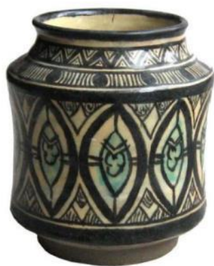
Szír albarello másolata (Szépművészeti Múzeum, Sigismundus Rex kiállítás, 2006)