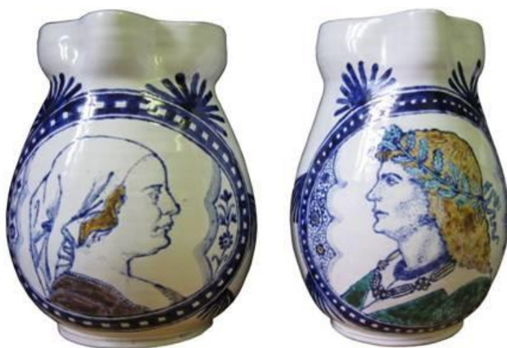
Beatrix és Mátyás király reneszánsz hangulatú kancsók (MNM Mátyás Király Múzeuma, Visegrád. 2008.)