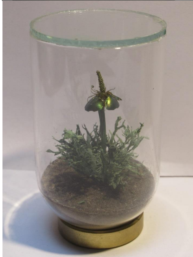
Fémes szirmú virág (2020)

A kortárs művészetben wunderkammer téma és a technika nem jellemző. Tisztában vagyok azzal is, hogy viszonylag sok amatőr készít kitalált állatokat. De ők jellemzően nem