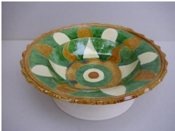
„Metélt-mázás” kerámiák másolata (Várpalota, 2017.)