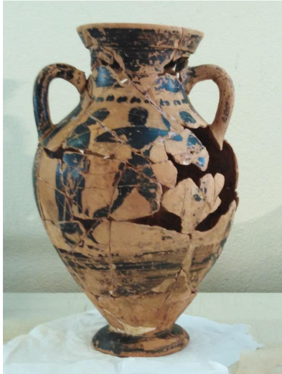
Ókori görög amphora összeállítása. Olaszország, Vibo Valencia, 2023.