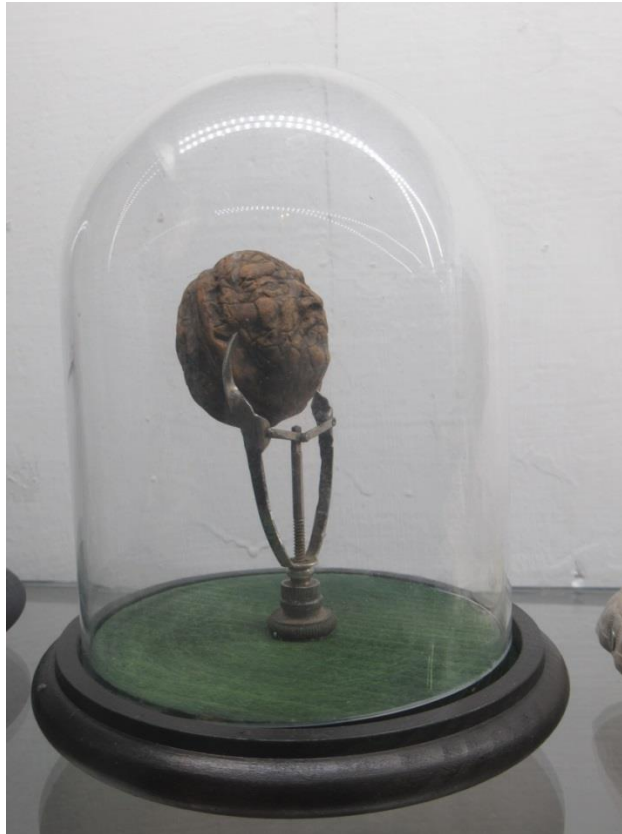
Emberarcú dió (2022)