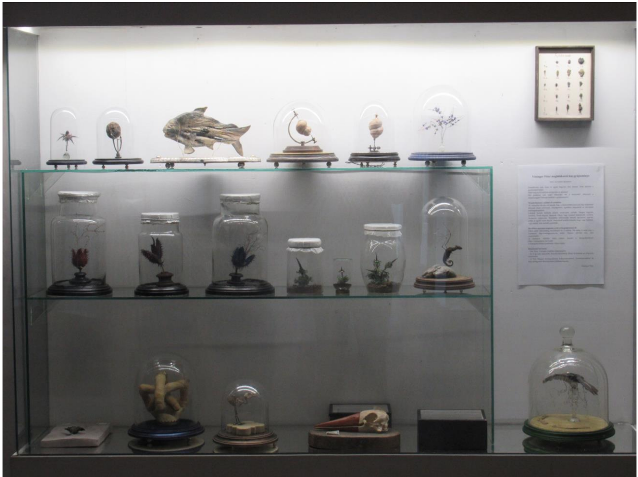
„Kisképző” kiállítása (2022.)

Eddig önerőből, támogatás nélkül dolgoztam. Ugyan „hobbiból”, de profi színvonalon készültek a tárgyak. Minden tárgy készítése nagyon idő- és munkaigényes volt. Sok kísérletezés, próbálgatás áll az elkészült tárgyak mögött. Hiszen olyan részeket kellett összeépítenem, amelyek soha nem voltak együtt. Mégis úgy kell tünnie, mintha mindig összetartoztak volna. Soha nem sajnáltam rájuk sem időt, sem munkát.