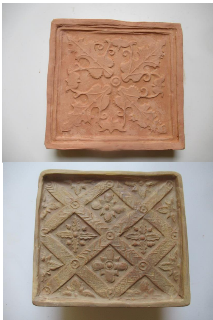
Füzéri várba készített középkori kályhacsempe másolatok. (2022.)