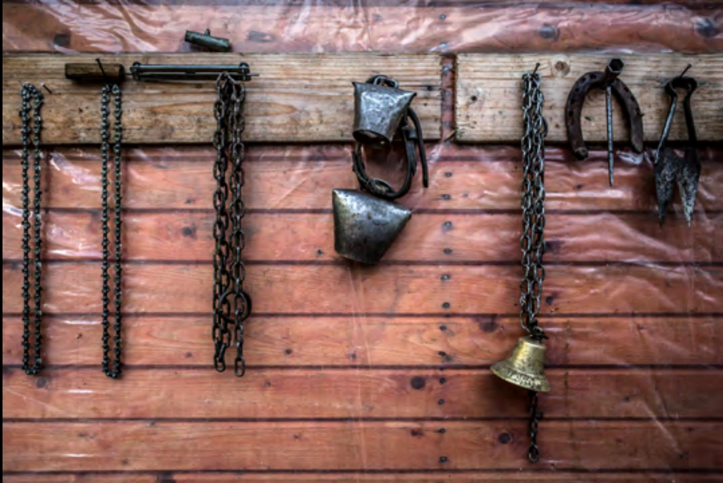
Kolompok és egyéb eszközök az esztenaház falán.