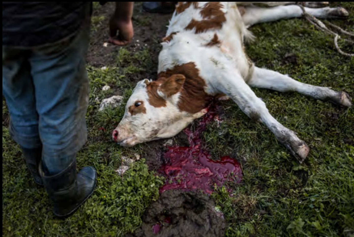
Az állat kivéreztetése.