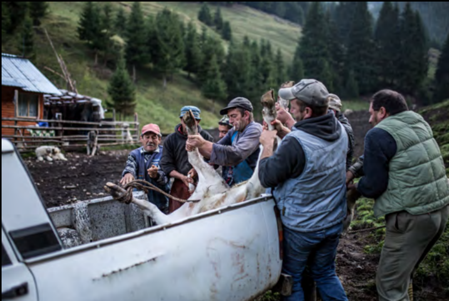
A borjút a pásztorok a szállítóautó platójára helyezik.