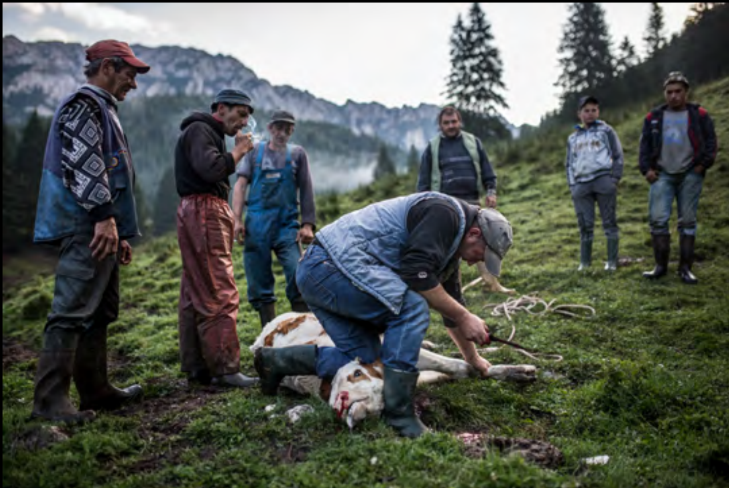
Borjúvágás az esztenaházhoz közeli legelőn.