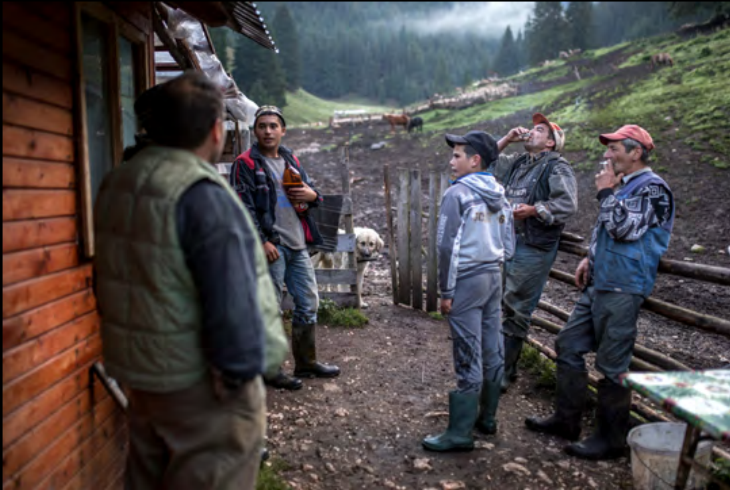
Pálinkázás és dohányzás az esztenház udvarán.