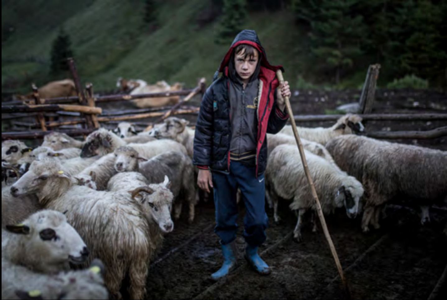
Pásztorfiú a Nagy-Hagymáshoz közeli esztenán.