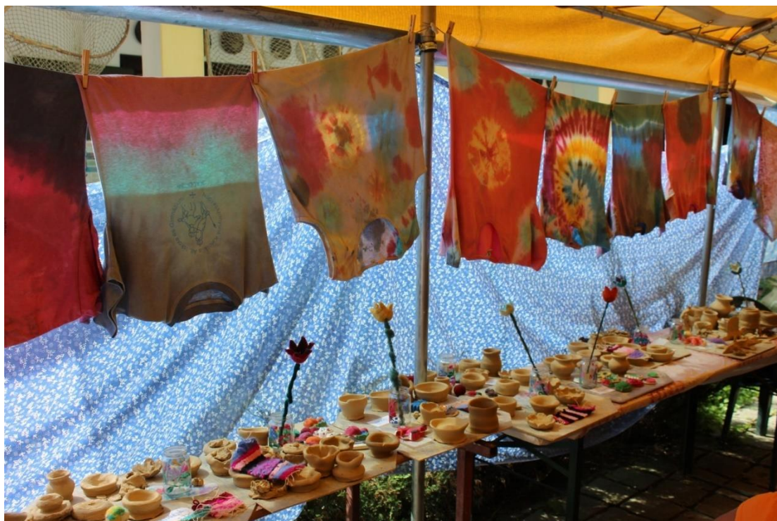
10. és 11. kép Kiállítások