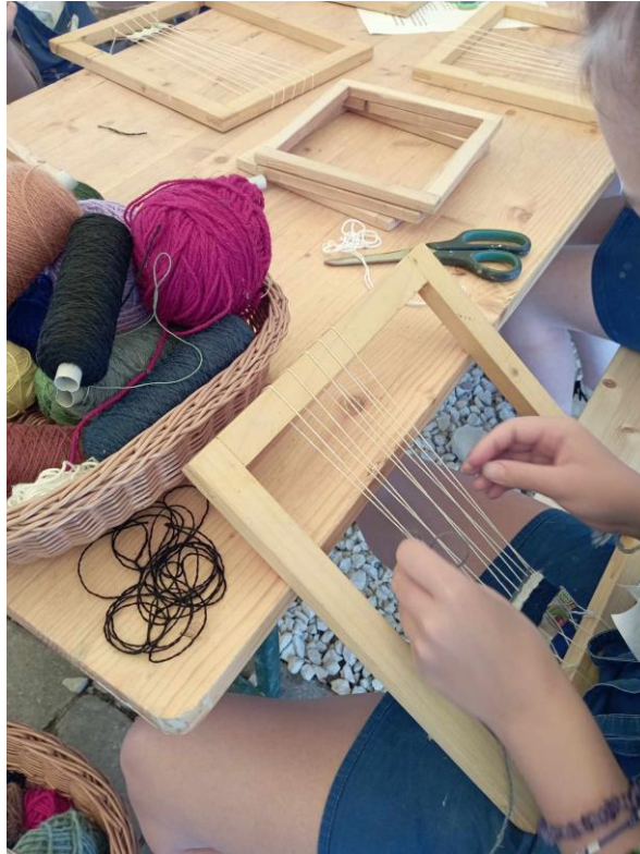
7. kép Szövés kereten