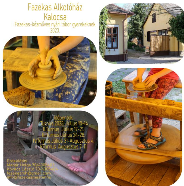
1. és 2. kép 2023. és 2024. Plakátok a tábor szervezéshez