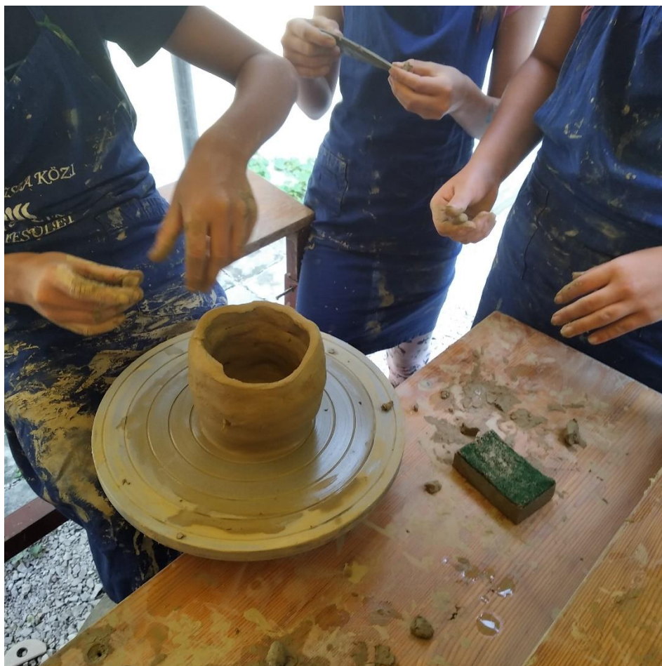
5. kép Korongon felrakással készült csoportos munka