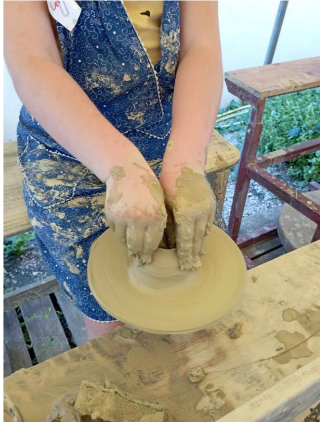
3. kép Korongozás