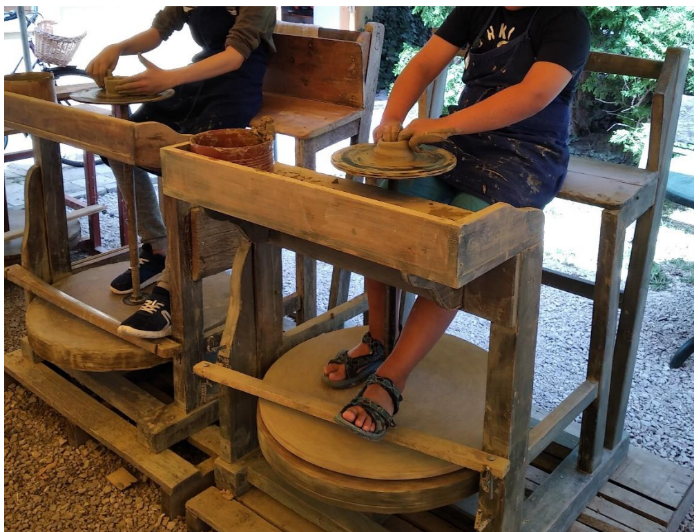
6. kép Hagyományos lábkorongon korongozás: láb-kéz harmónia