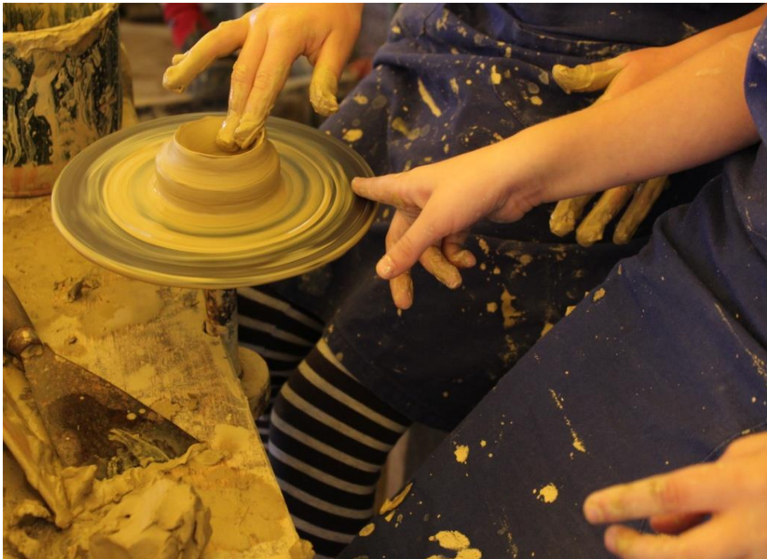
4. kép Egymás segítése: egyik rúgta a lábával - másik készítette a kezével