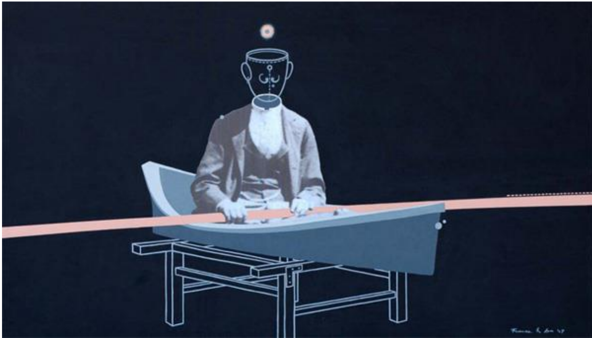
A gyakorlat II. – print, akril, vászon, 120x68 cm, 2007