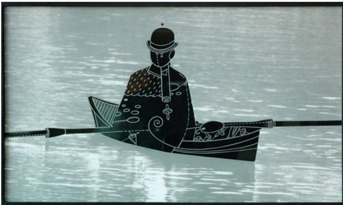
A gyakorlat I. – print, mattított üvegfelület, 86x50 cm, 2006