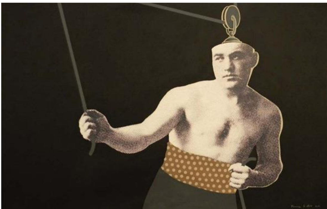
A bajnok mindig talpra áll II. – print, akril, vászon, 120x76 cm, 2010