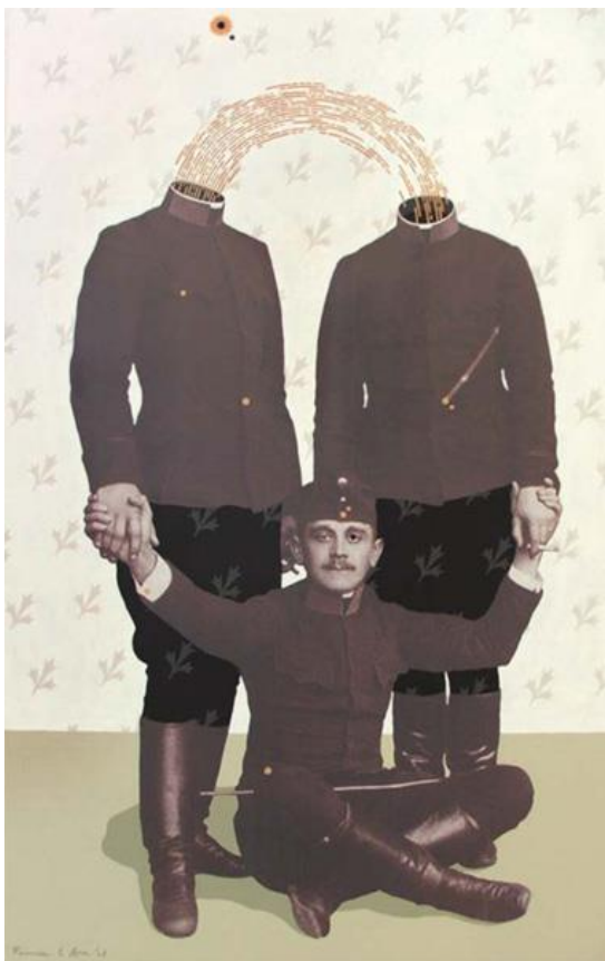
Kapcsolat ciklus- Cimborák print, akril, vászon, 110x80 cm, 2009