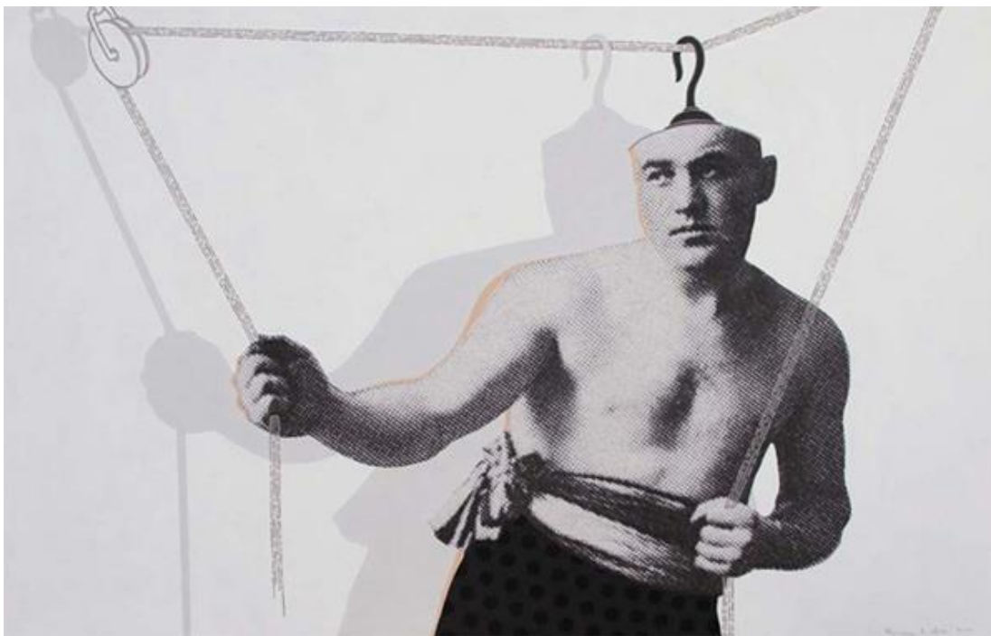
A bajnok mindig talpra áll I. – print, akril, vászon, 120x76 cm, 2010