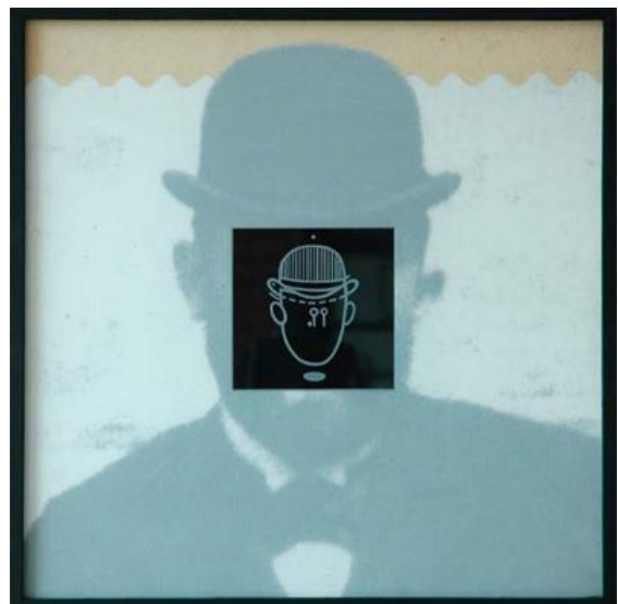
Fejek I.-IV. –print, mattított üvegfelület, 40x40 cm, 2006