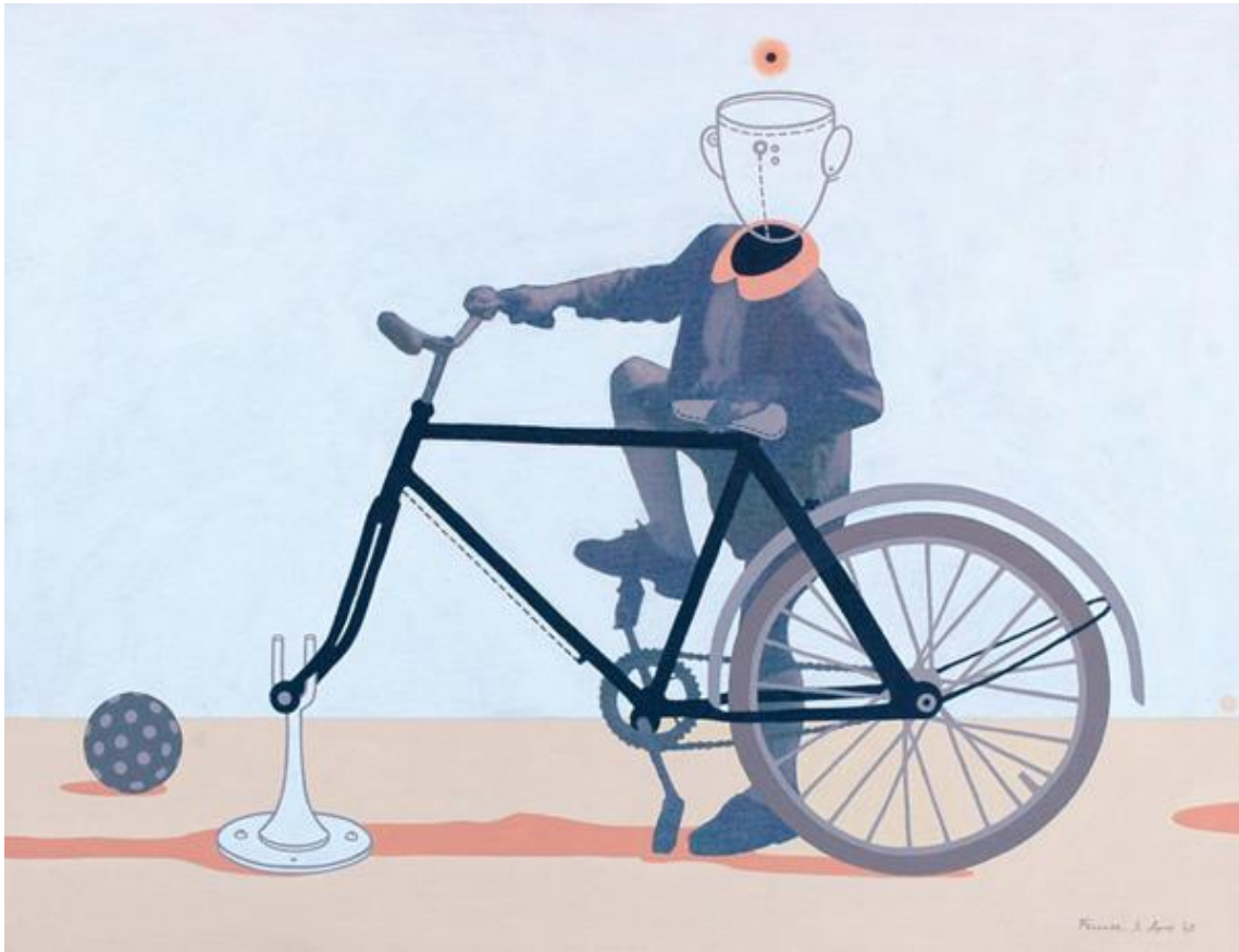
Gondtalan délután II. – print, akril, vászon, 100x76 cm, 2006