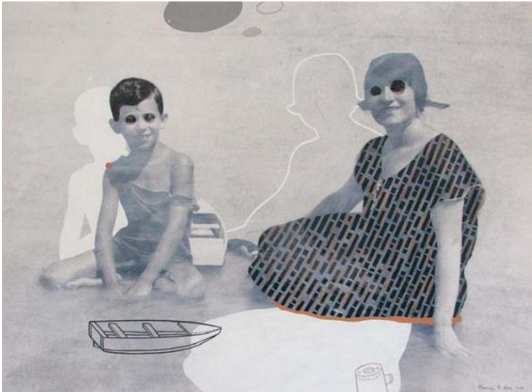
Gondtalan délután- Fehér kép – print, akril, vászon, 110x81 cm, 2010