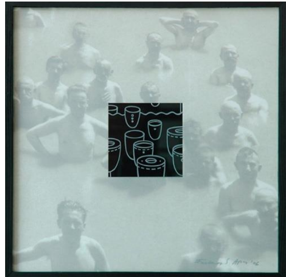
Fürdő ciklus I.-II. – print, mattított üvegfelület, 40x40 cm, 2005