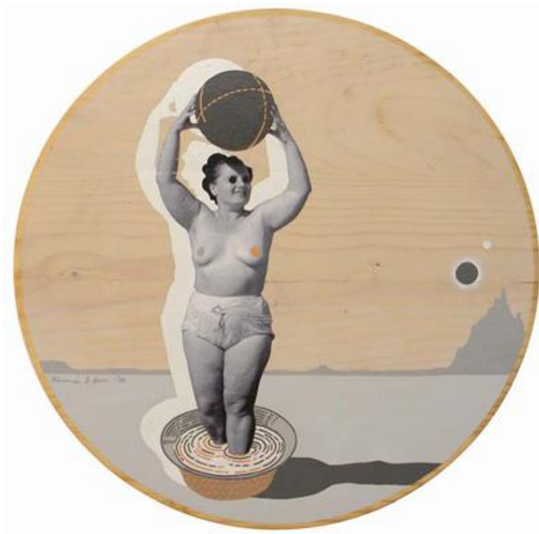
Napfogyatkozás – fatábla, print, akril, print, 50x50 cm, 2010