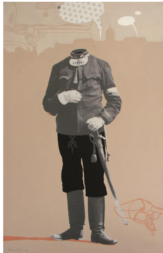
Múlt vagy jelen? print, akril, vászon, 110x75 cm, 2010