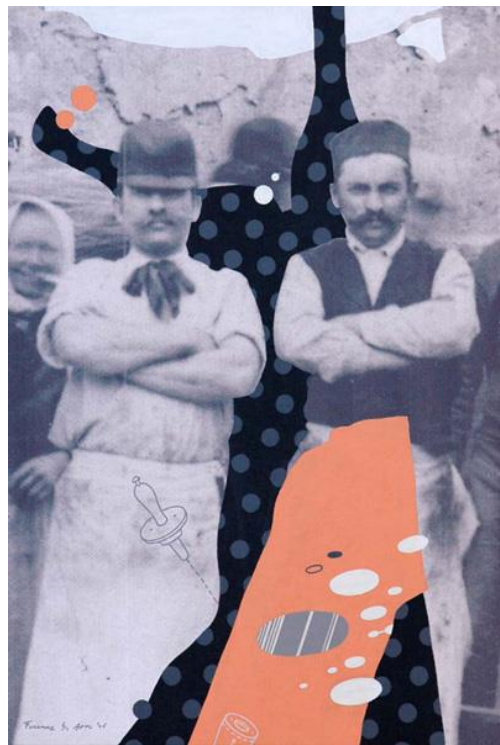
A disznó I.- II. - print, akril, vászon, 80x56 cm, 2006