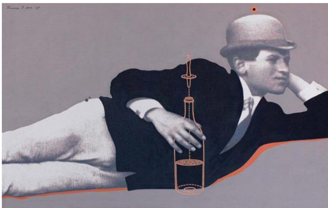
Gondtalan délután I. - print, akril, vászon, 120x78 cm, 2006