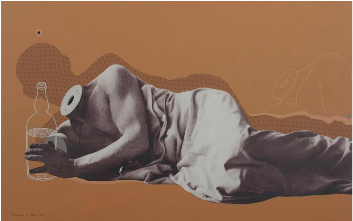
Gondtalan délután VI. – print, akril, vászon, 120x78 cm, 2008