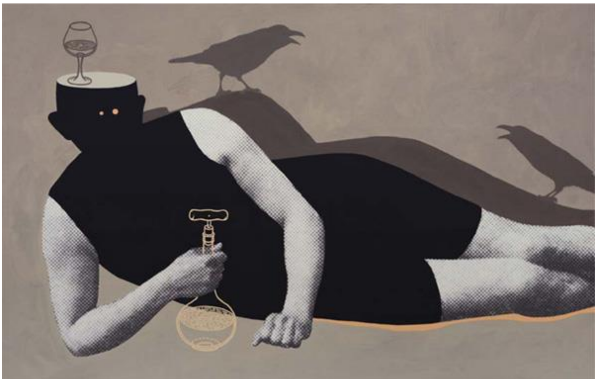
Gondtalan délután- Hollós kép – print, akril, vászon, 120x78 cm, 2010