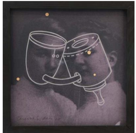
Kapcsolat ciklus- Szüzek I.-IV. – print, mattított üvegfelület, 30x30 cm, 2008