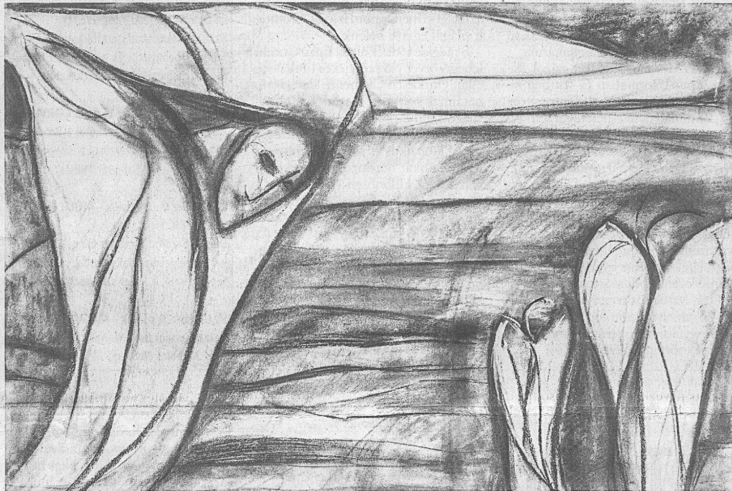
Péntek Orsoya: Angyalok a külvárosban

re fókuszálnak, hanem sokkal inkább szituatív dinamikákra.” (213.) Ezzel a funkcionalista iskola melletti vonzalmának is hangot ad egyúttal. S szintén ez a szemléleti beidegződés köszön vissza akkor, amikor Raphael Gross a német múltbevallás ( Vergangenheitsbewältigung ) korábbi gyakorlatát kárhóztatja: „a háború utáni német viták sokkal inkább morális kérdésekről és kifejezőmódokról, mint magukról a tényekről szólnak”. (243.) Hasonlóképpen ez az ethosz fűti a németországi holokausztemlékezeti helyek kurátorait is, akiket a Buchenwaldi és Mittelbau-Dora Emlékhely Alapítvány történész igazgatója,