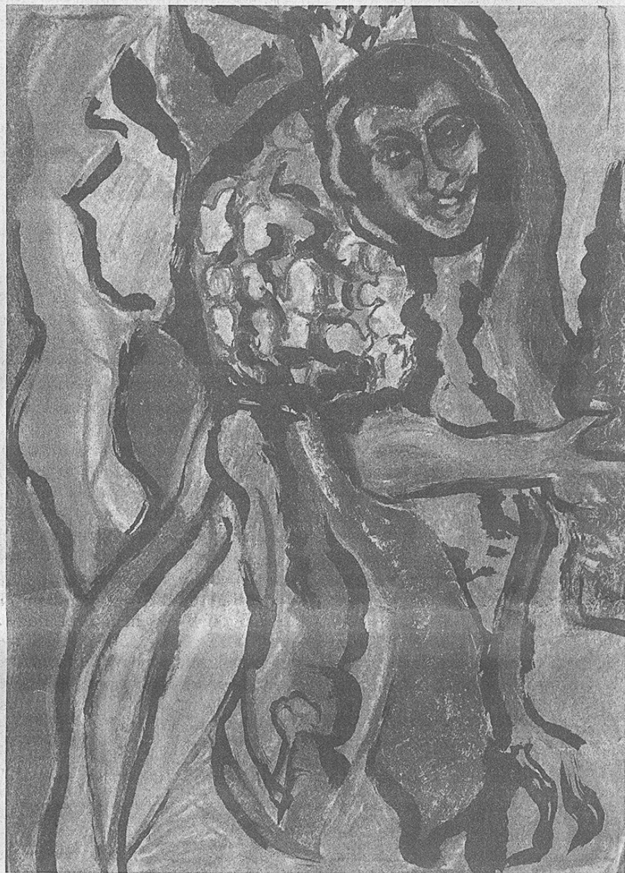
Péntek Orsoya: Kofa

szírozó kamatszerezeitekkel, amit már az Európai Központi Bank is kritizált.