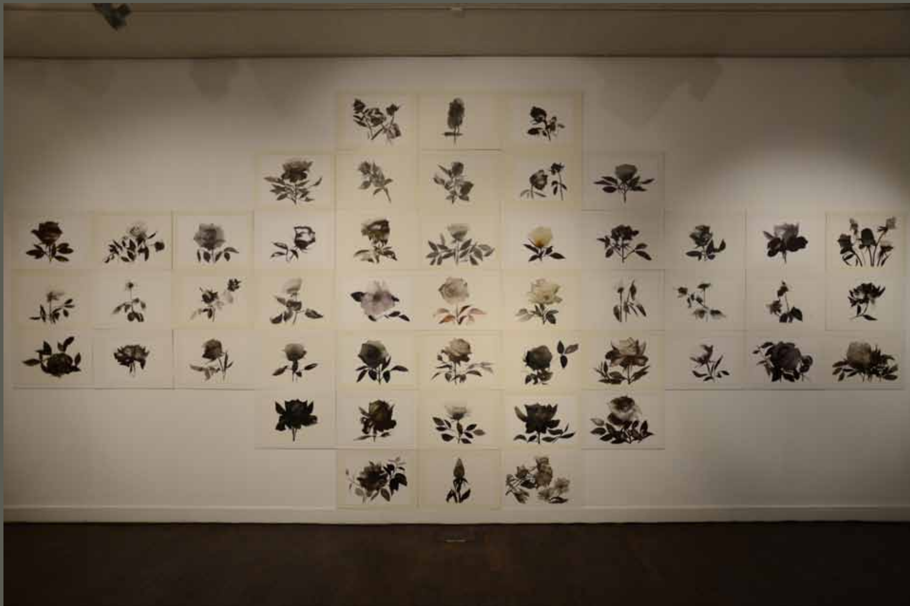
Rózsakert / Papír, tus / 605x 280cm / egyenként.: 40x55cm 2013.