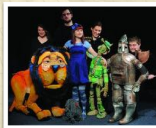
Az előadás szereplői