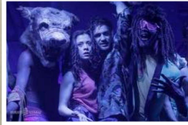
Jelenet az előadásból