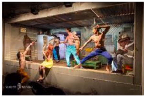
Jelenet az előadásból