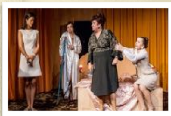
Jelenet az előadásból