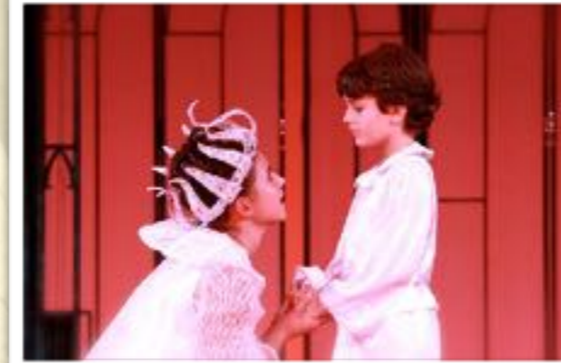
A királyné és Tündér Lala