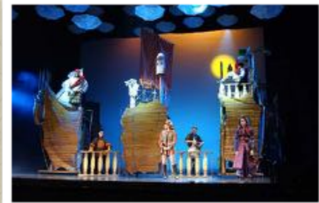
Jelenet az előadásból