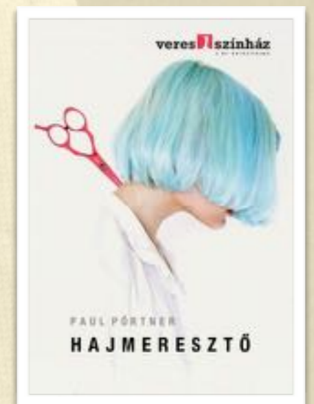
Az előadás plakátja