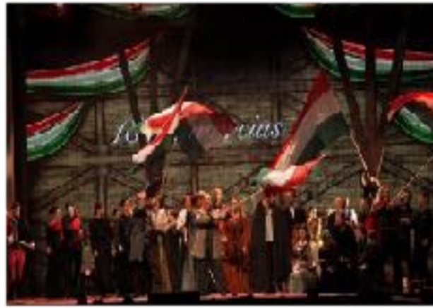
Jelenet az előadásból