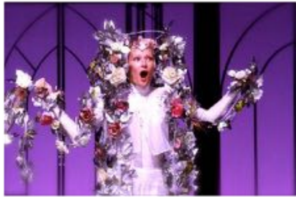
Jelenet az előadásból