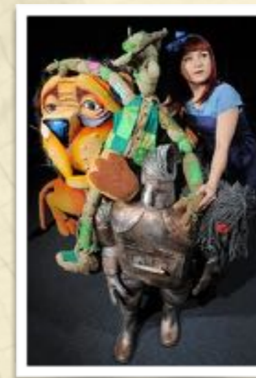
Dorka és "kísérői"