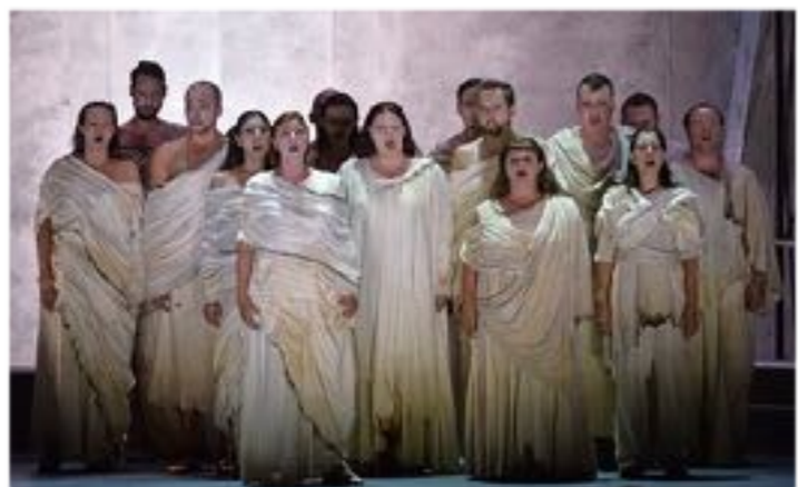
Az Á la cARTE kórus