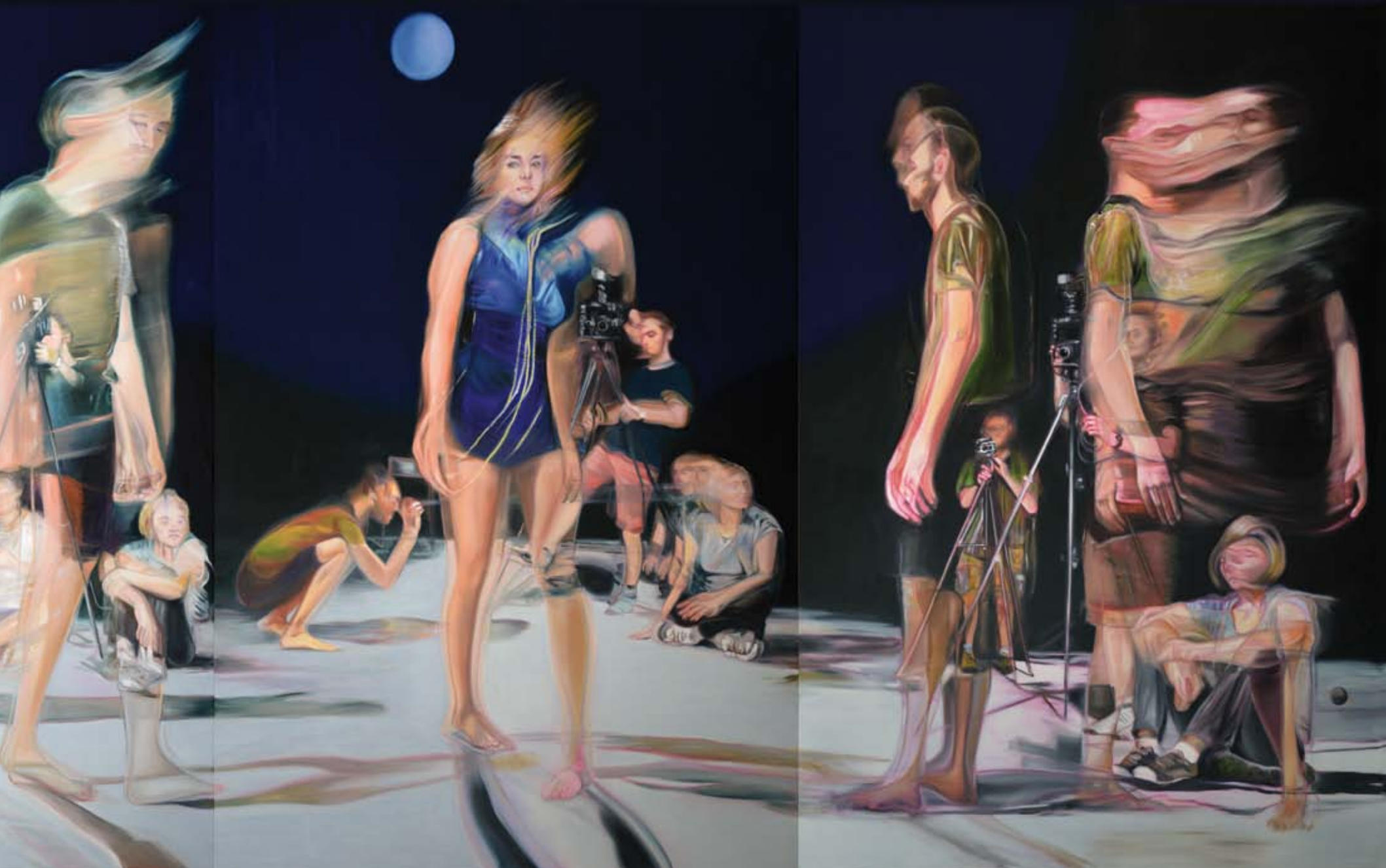
olaj vásznon | oil on canvas részlet | detail 210 x 435 cm | 2019