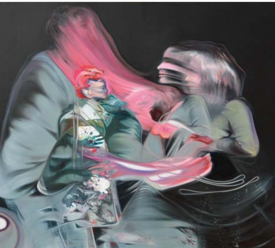
olaj vásznon | oil on canvas 140 x 160 cm | 2017