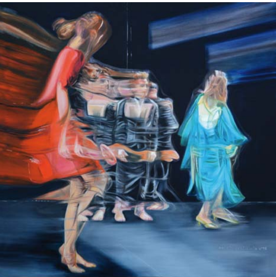
olaj vásznon | oil on canvas 100 x 100 cm | 2018