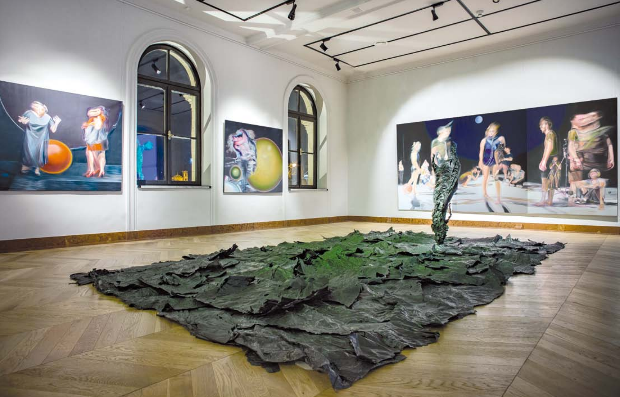
Helyspecifikus installáció | Site-specific installation Ybl Budai Kreatív Ház | 2019