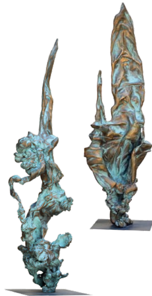
patinázott bronz | patinated bronze 61 x 32 x 32 cm | 2016