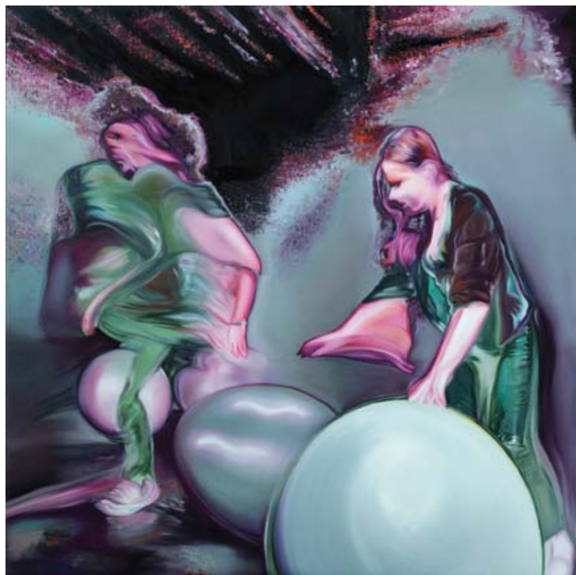
olaj vásznon | oil on canvas 100 x 100 cm | 2017, 2018