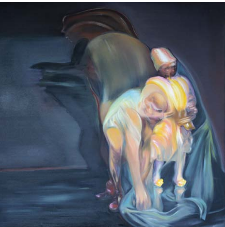
olaj vásznon | oil on canvas 55 x 55 cm | 2016