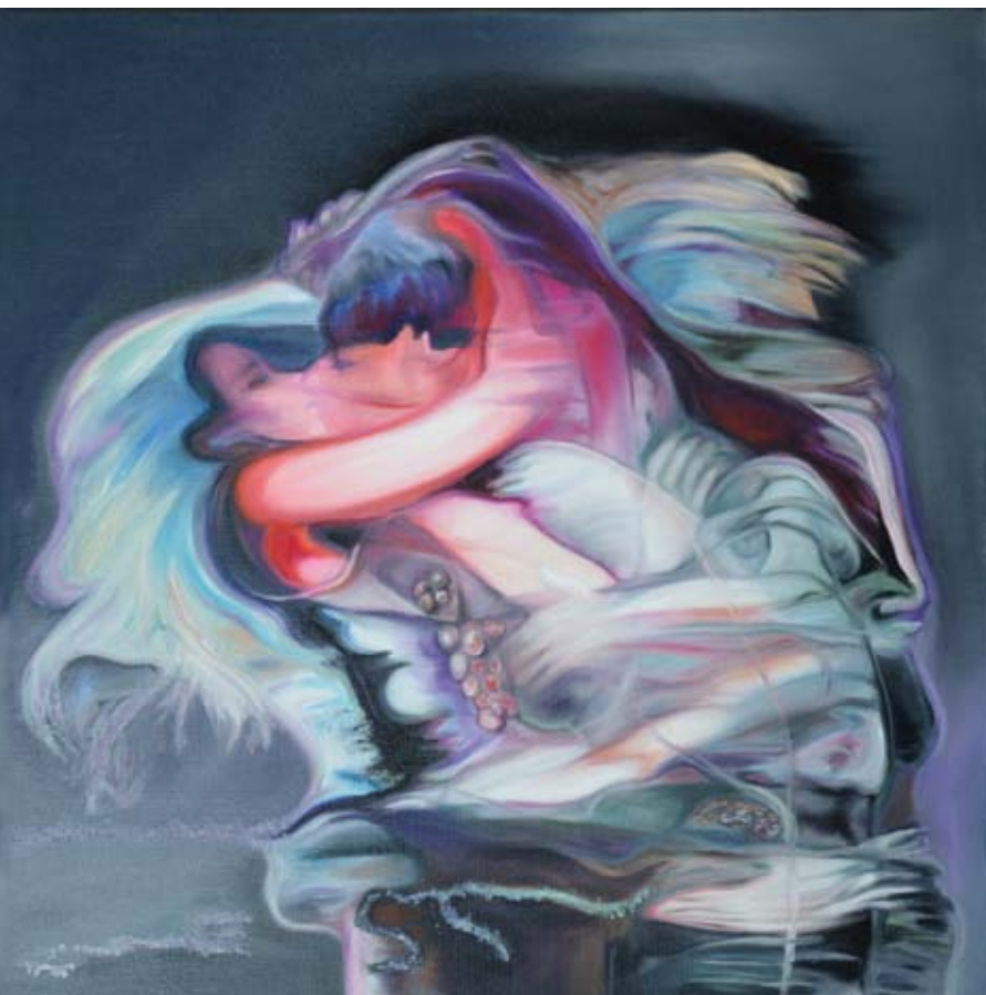
olaj vásznon | oil on canvas 60 x 60 cm | 2017