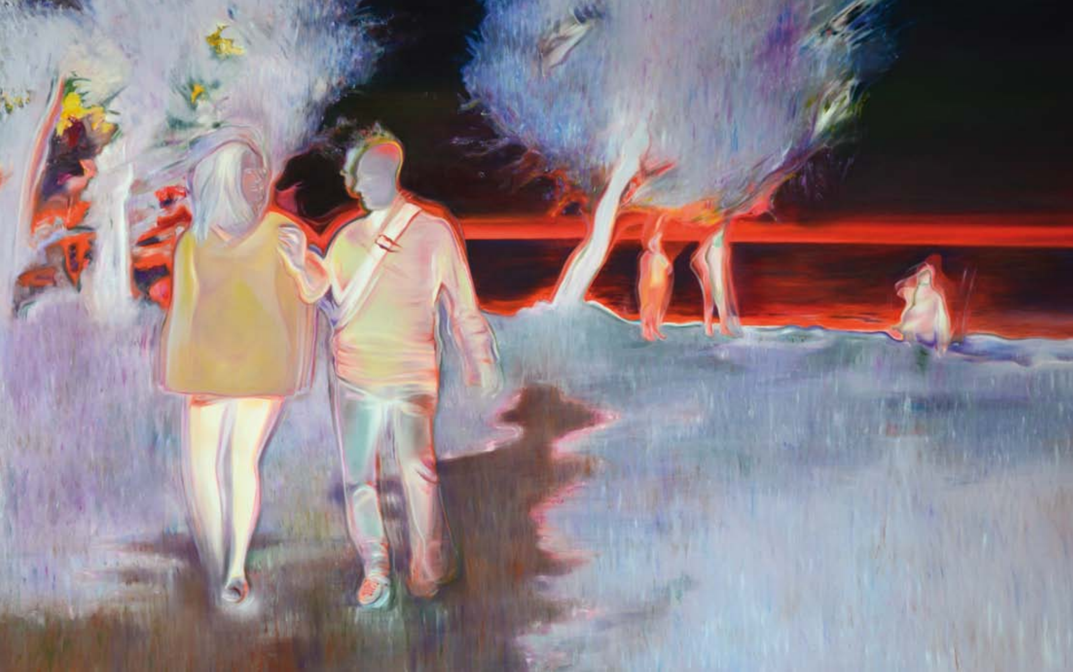
olaj vásznon | oil on canvas részlet | detail (145 x 210 cm | 2016)