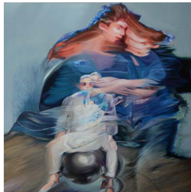
olaj vásznon | oil on canvas 150 x 150 cm | 2016