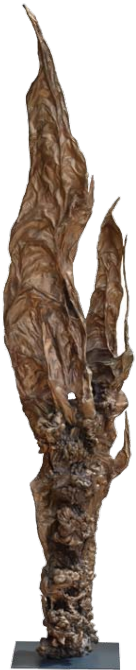
bronz | bronze 120 x 34 x 40 cm | 2016