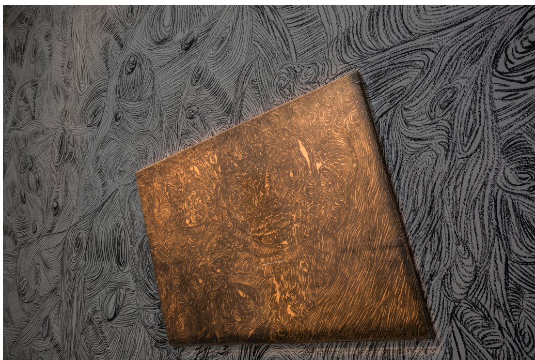
Nagy Barbara: Ösvények a kertben, installáció, Art Capital, Vajda Lajos Múzeum, Szentendre 2018.

A művészet léte ami foglalkoztat, a határ, ahol egy puszta tárgy műalkotássá válik. Ezért dolgozom a fatáblákon kívül más műfajokban is: legyen az installáció, videó, vagy épp egy ceruzarajz, mert az átlényegülés-átlépés pillanata az, amit meg akarok mutatni.