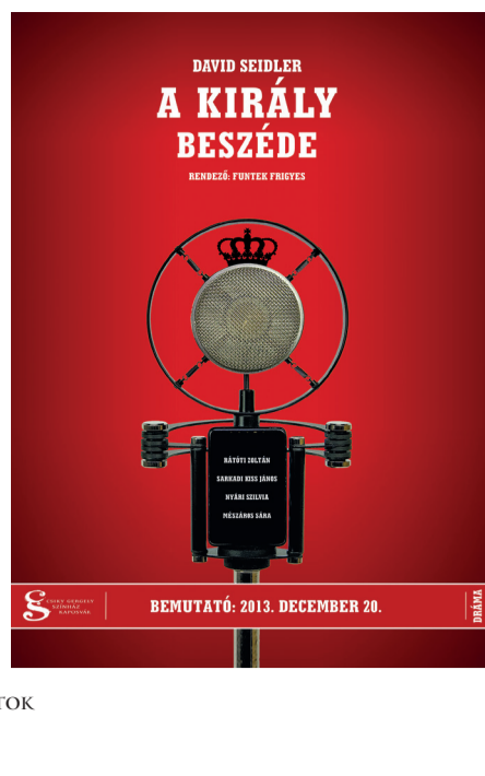
A KAPOSVÁRI CSIKY GERGELY SZÍNHÁZNAK KÉSZÜLT PLAKÁTOK