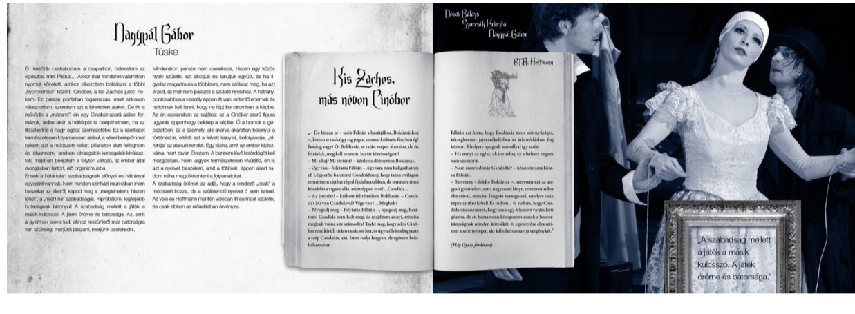
BÁRKA SZÍNHÁZ - ÉJFELI MESÉK MŰSORFÜZET

ALAPÍTÓ TAGJA VOLTAM A MATT (MAGYAR TERVEZŐGRAFIKUSOK ÉS TIPOGRÁFUSOK SZÖVETSÉGE) NEVŰ SZAKMAI SZERVEZETNEK.