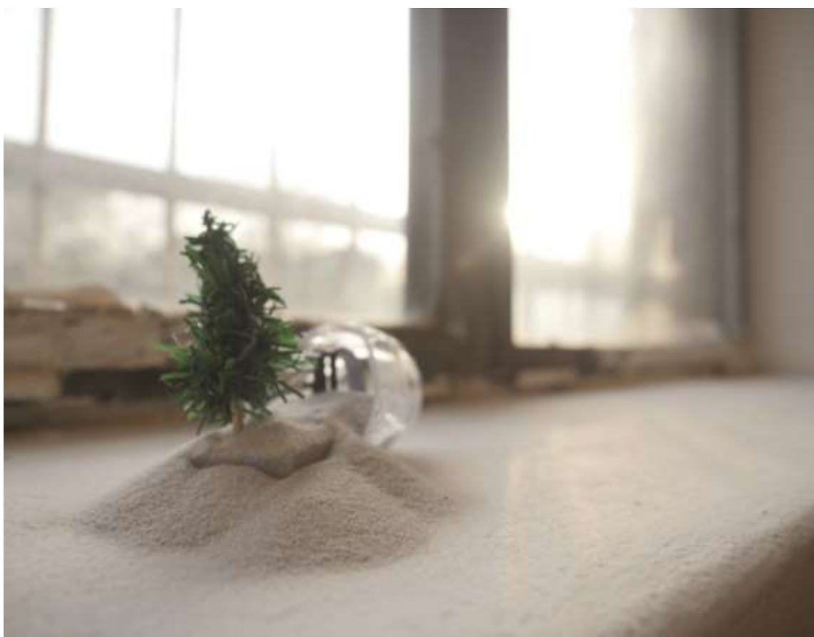
Polly pocket/Csúszda (2018) Vegyes technika, ólomkristály 10x12x5 cm