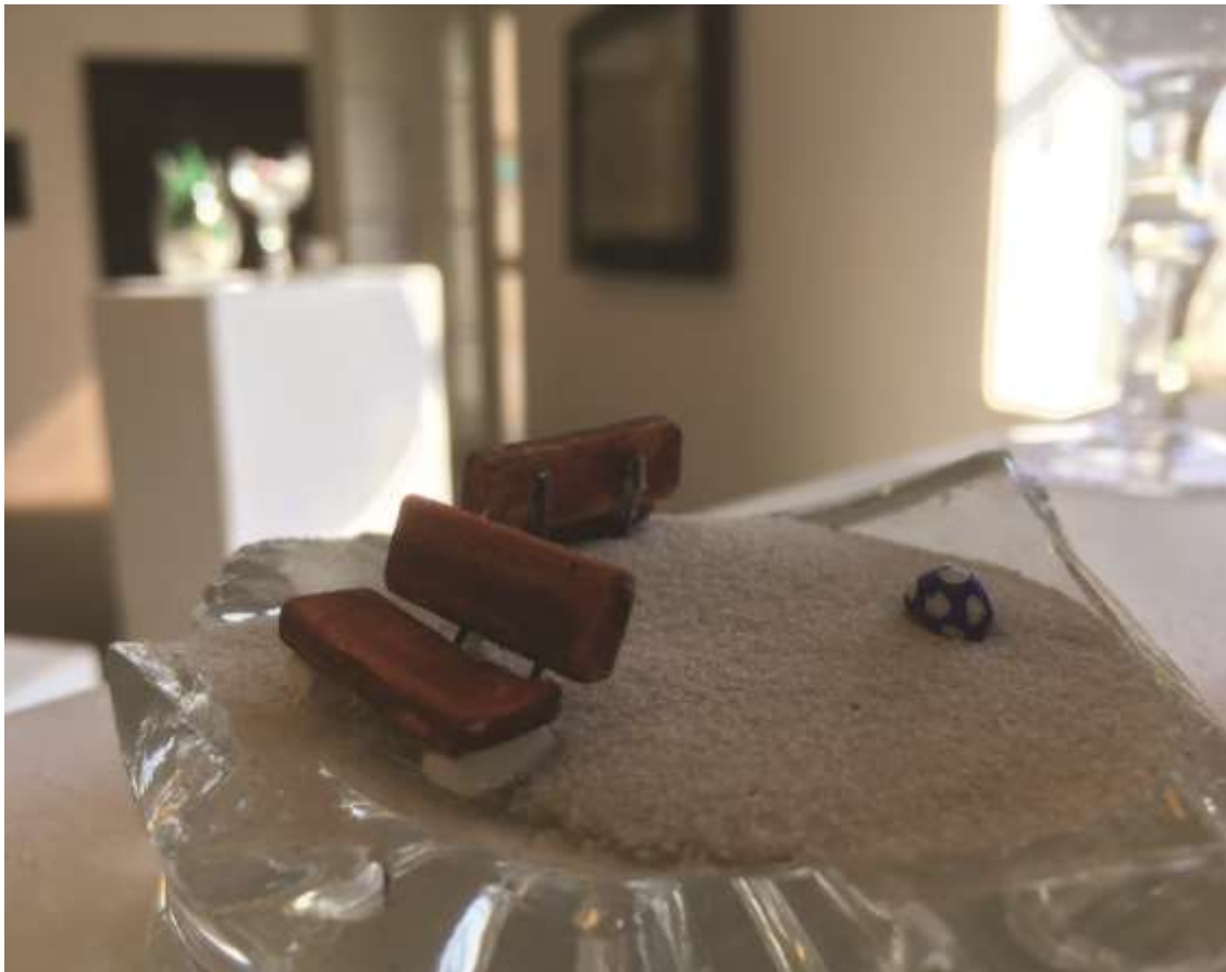
Polly pocket/Pad pöttyös labdával (2018) Vegyes technika, ólomkristály 5x10x10cm