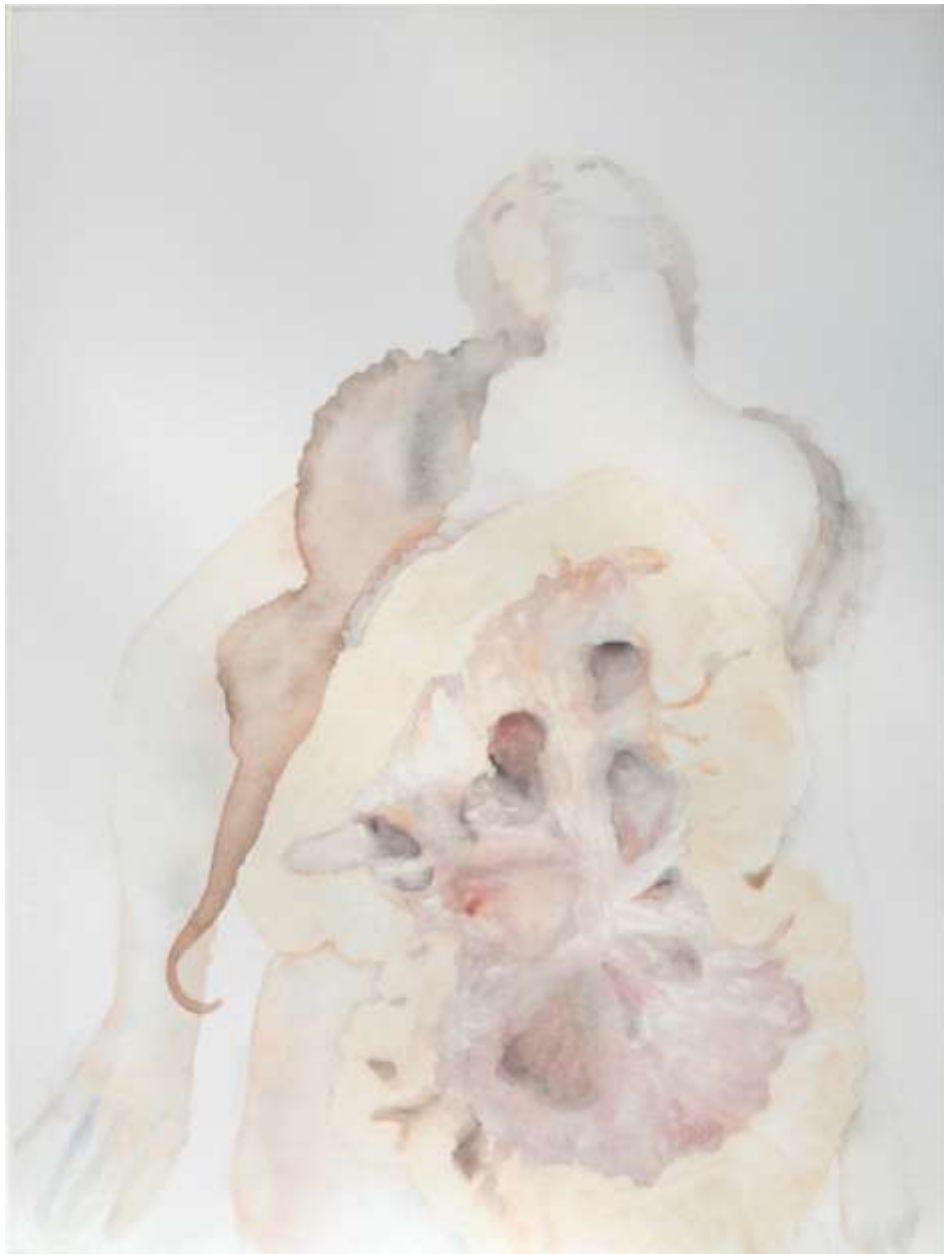
Nyirokrendszer (2018) Akvarell, akril, vászon 80x60cm