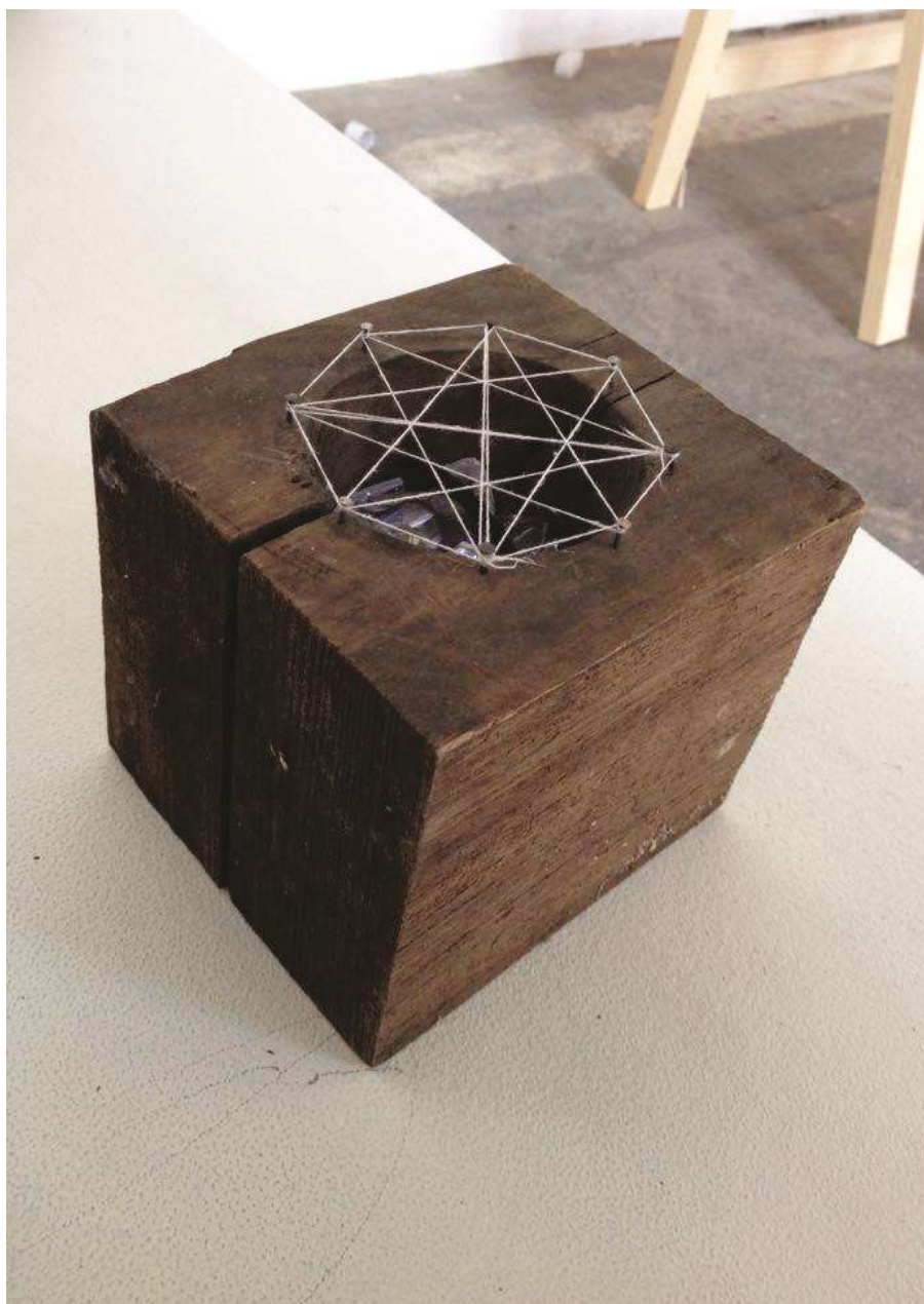
Kapu (2016) Fa, ólomkristály, cérna 13x14x14 cm