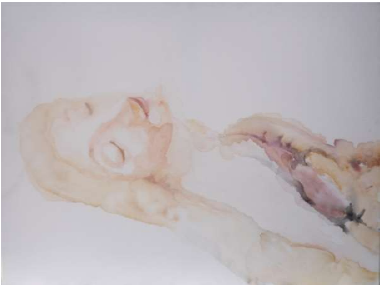
Kiterítve II. (2018) akril, akvarell, vászon 60x80 cm