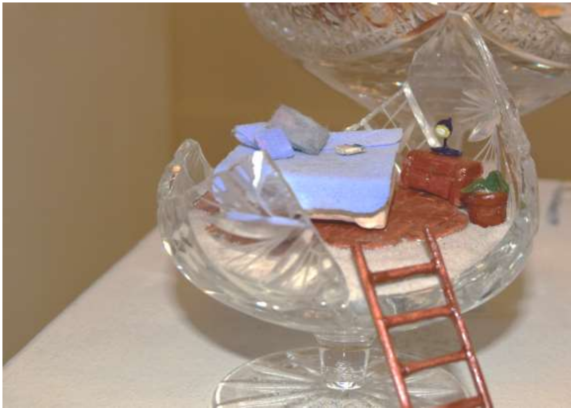
Polly pocket/Háló (2017) Vegyes technika, ólomkristály 10x11x10 cm