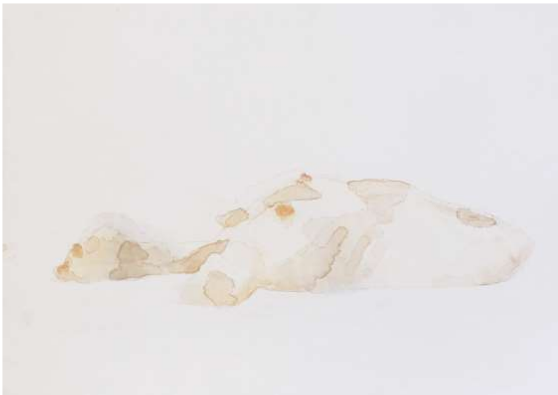
Újjászületés 2018 Akvarell, akril, vászon 60x80 cm