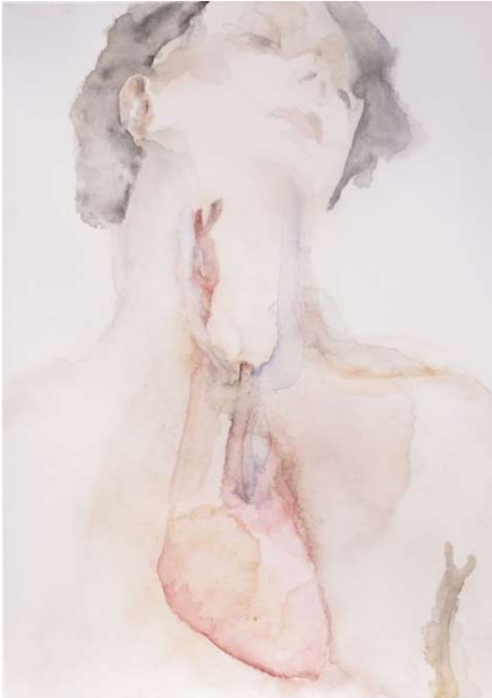
Kiterítve III. (2018) Akvarell, akril, vászon 70x50 cm