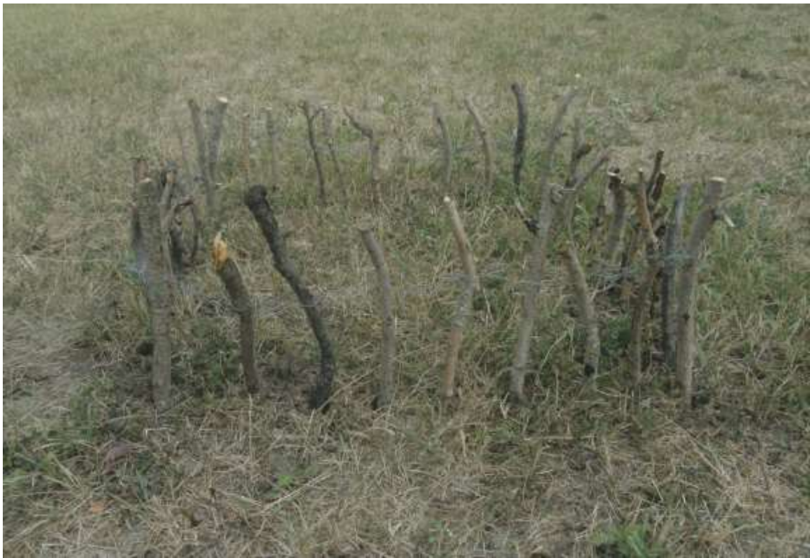
Elkerítve (2013) 100x100x30cm fa, fém, virág, föld, kő