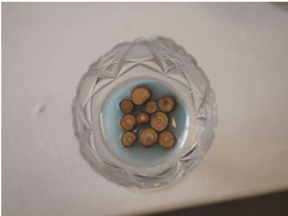
Polly pocket/Faúszató (2018) Vegyes technika, ólomkristály 14x4x4cm