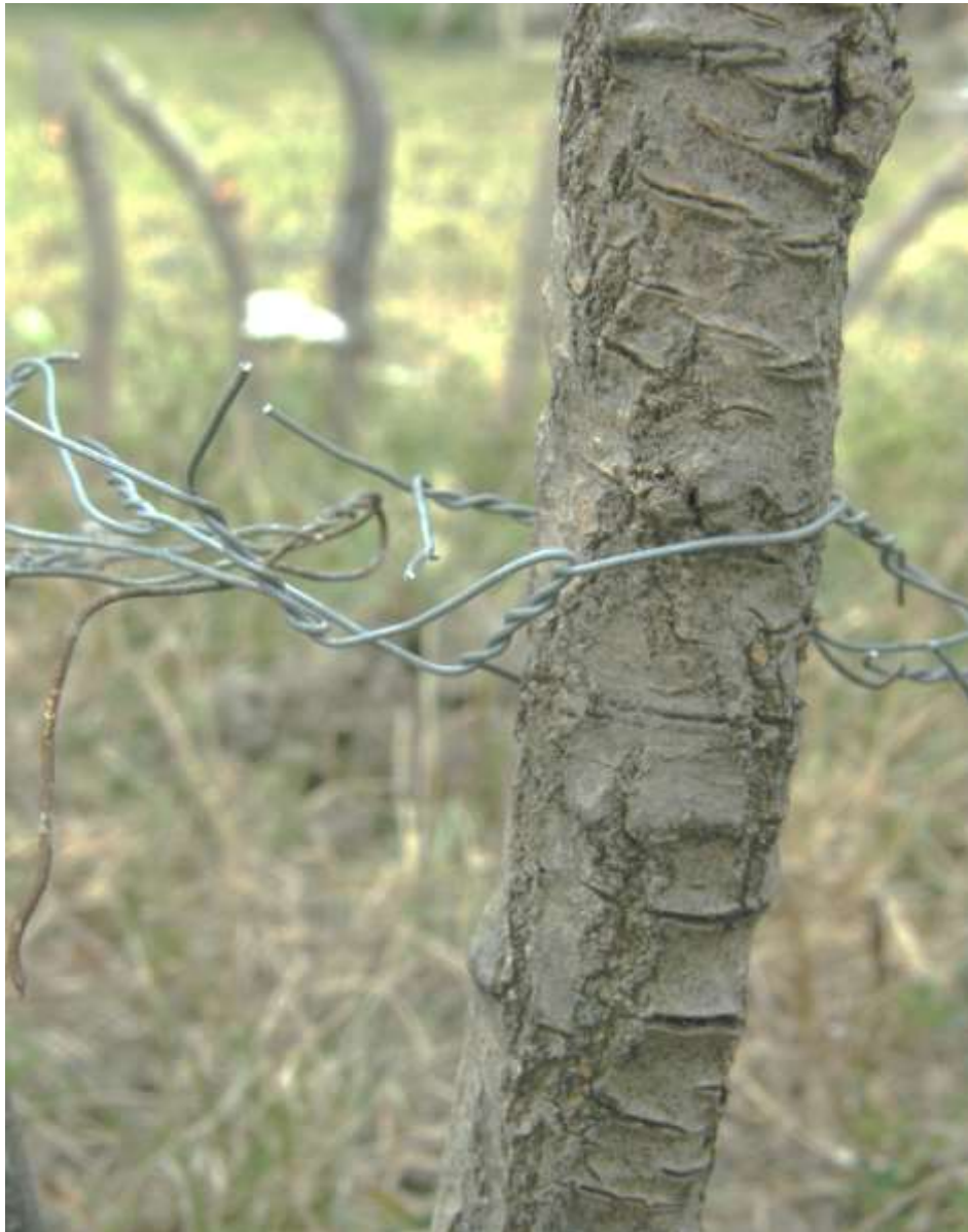
Elkerítve (2013) 100x100x30cm fa, fém, virág, föld, kő