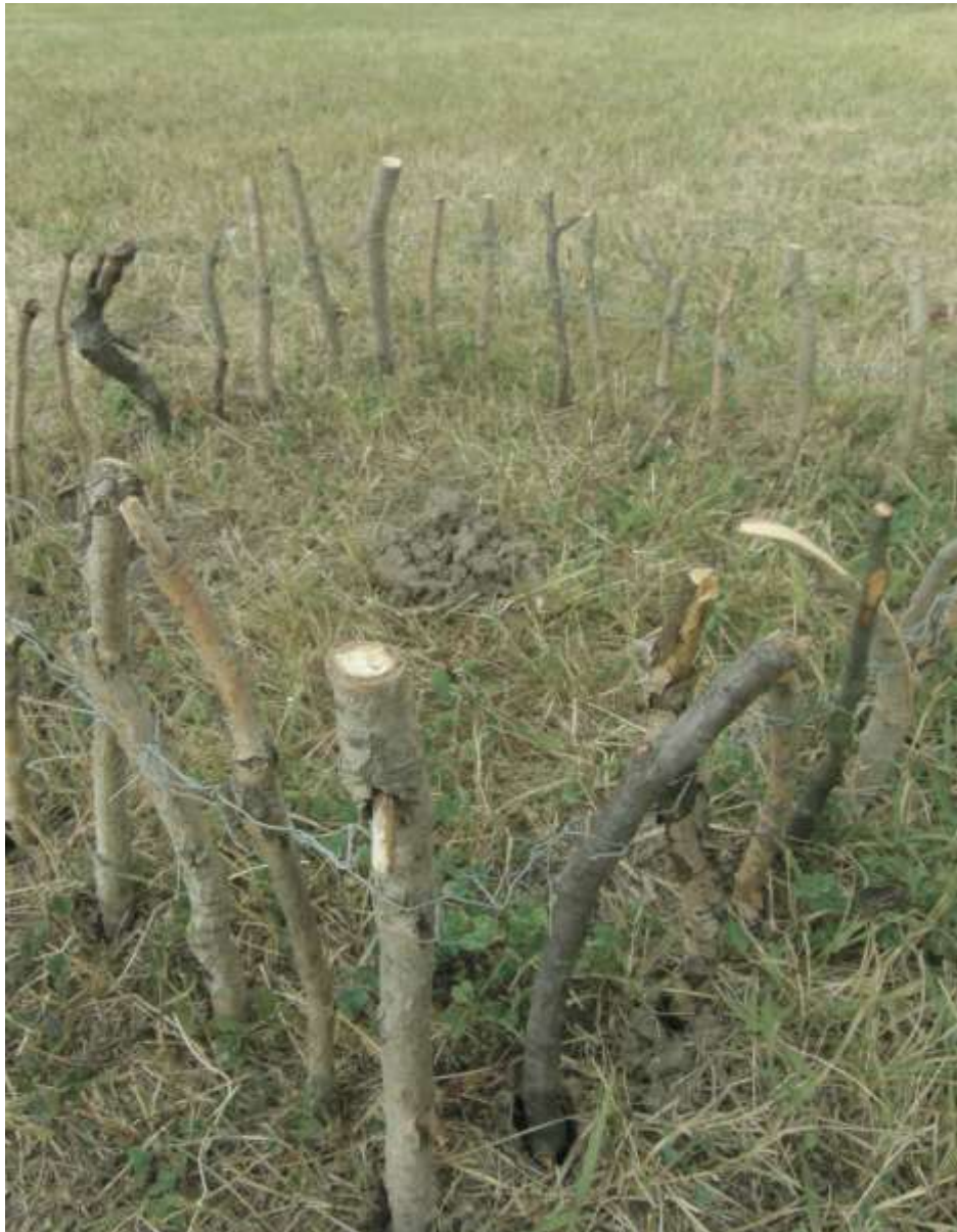
Elkerítve (2013) 100x100x30cm fa, fém, virág, föld, kő