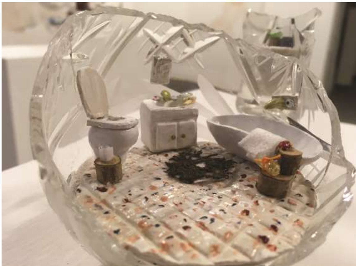
Polly pocket/Mosdó (2017) Vegyes technika, ólomkristály 8,5x10,5x15 cm