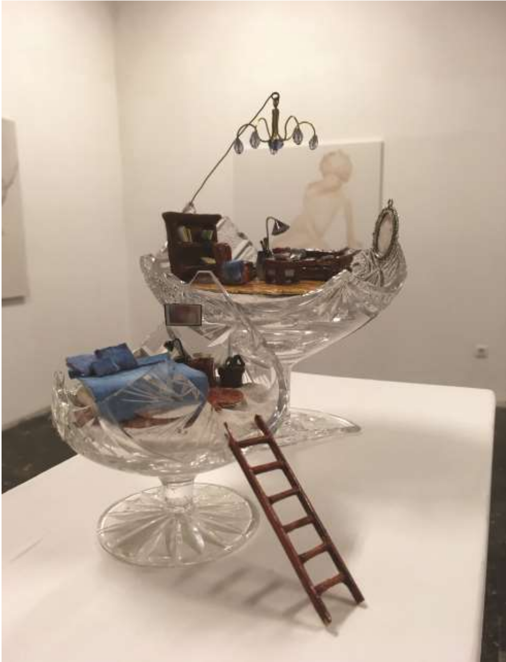
Polly pocket/Nappali (2017) Vegyes technika, ólomkristály 18x13x15 cm