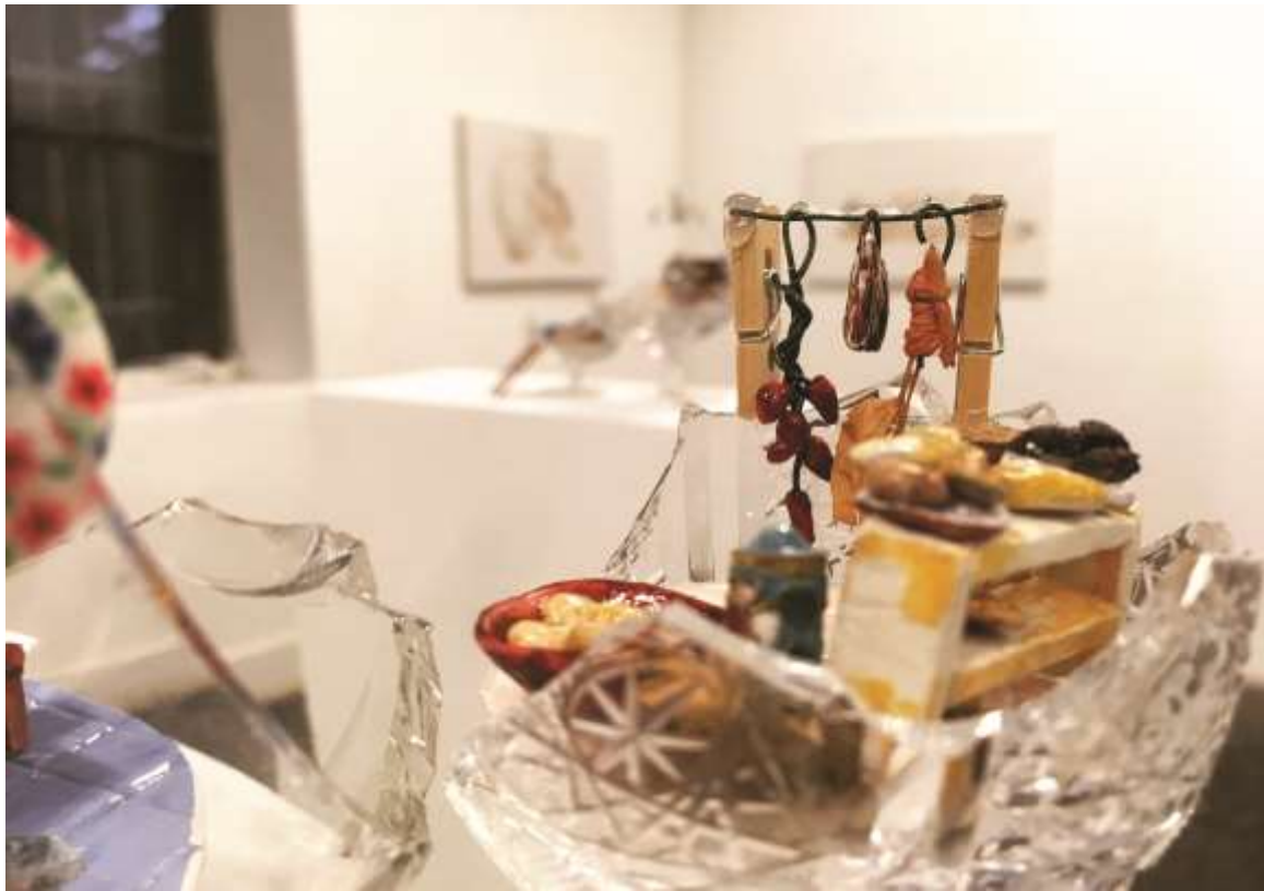
Polly pocket/Kamra (2017) Vegyes technika, ólomkristály 13,5x7x6,5 cm