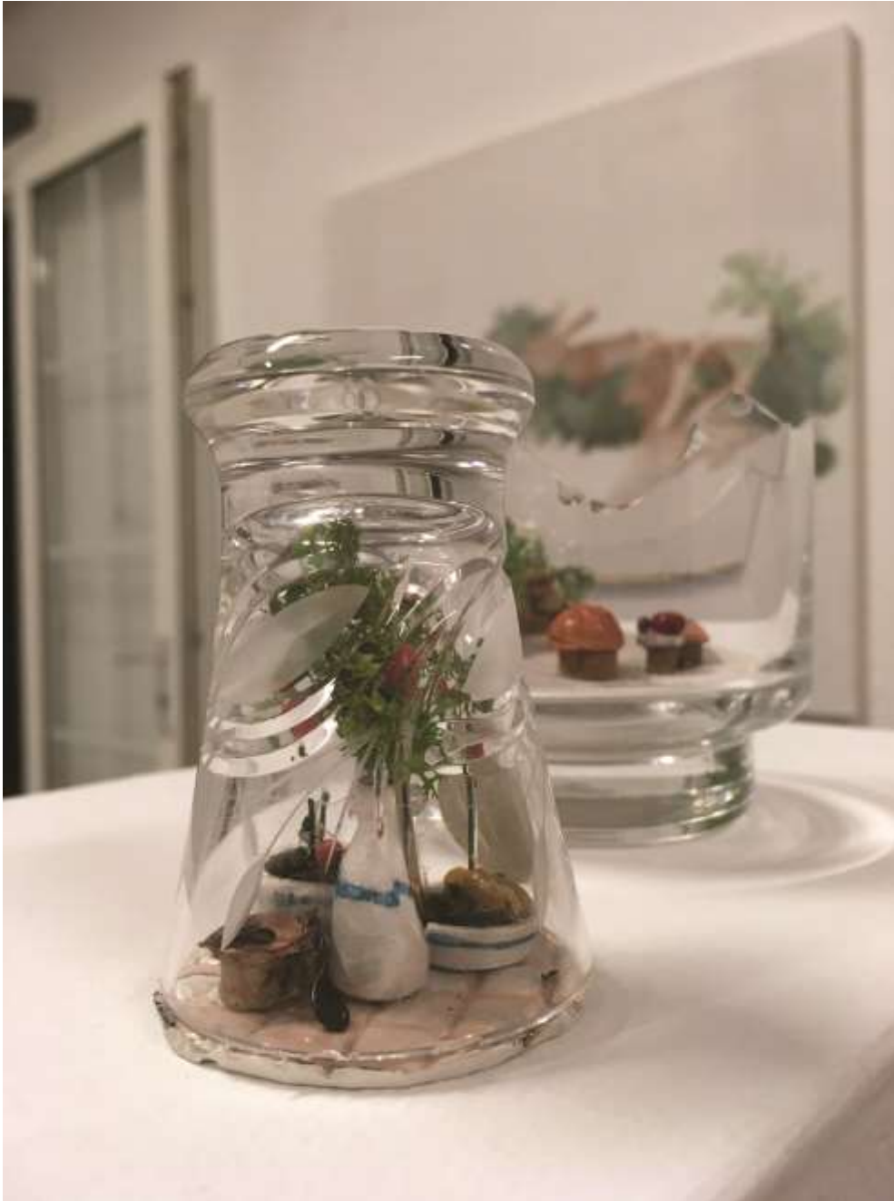
Polly pocket/Melegház (2017) Vegyes technika, ólomkristály 7x5x5 cm