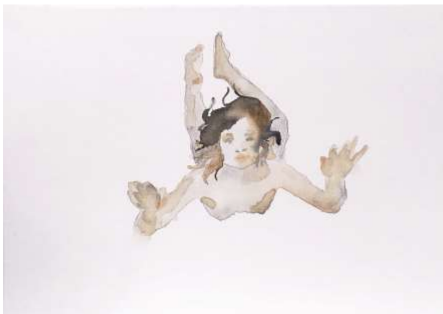
Lebegés II. (2018) Akvarell, akril, vászon 30x40 cm