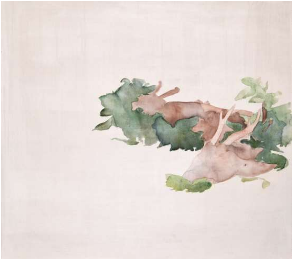
A csodaszarvas temetése (2017) akril, akvarell, vászon 90x100cm