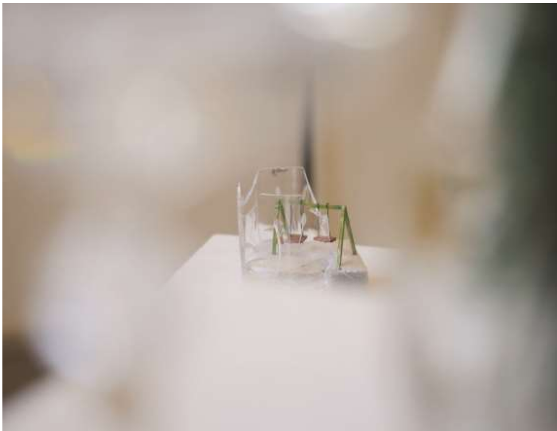
Polly pocket/Hinta (2018) Vegyes technika, ólom kristály 12x11x10cm