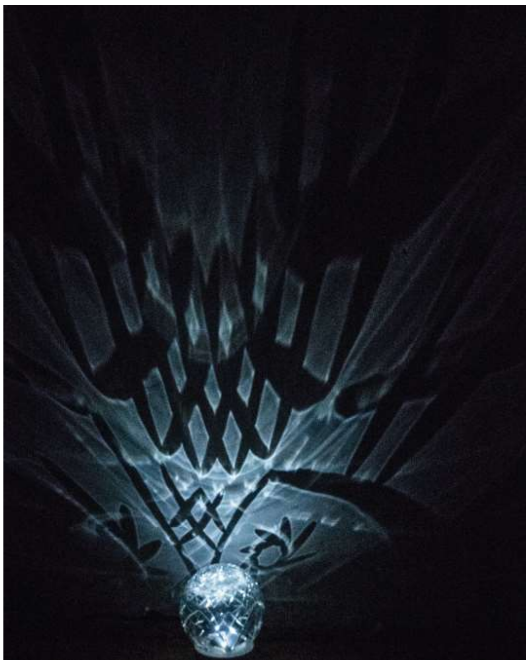
Árnyjáték (2019) Vegyes technika, ólomkristály 15x12x12cm