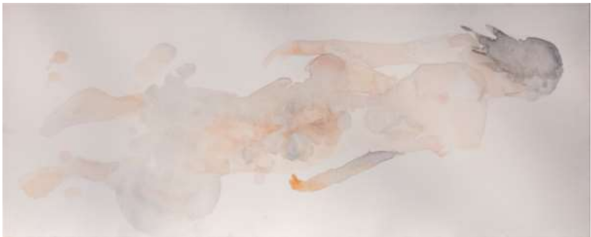
Lebegés III. (2018) akril, akvarell, vászon 50x120 cm