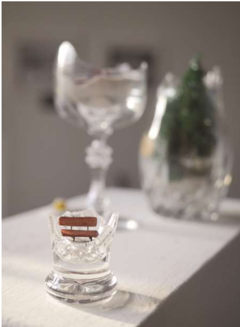
Polly pocket/Homokozó (2018) Vegyes technika, ólomkristály 15x6x6cm