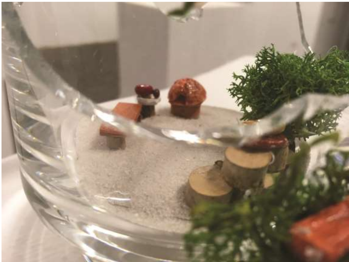
Polly pocket/Kert (2017) Vegyes technika, ólomkristály 9x8x8 cm