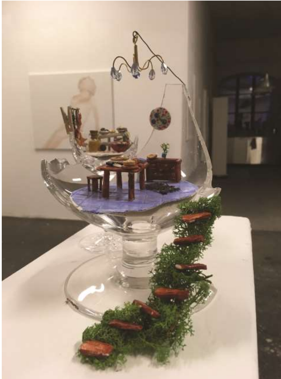
Polly pocket/Konyha (2017) Vegyes technika, ólomkristály 15x12x12cm