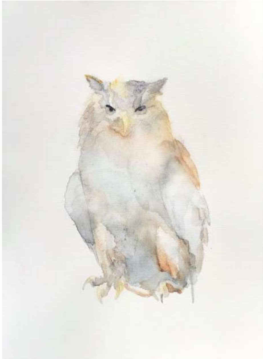
P.A. (2018) akril, akvarell, vászon 40x30cm