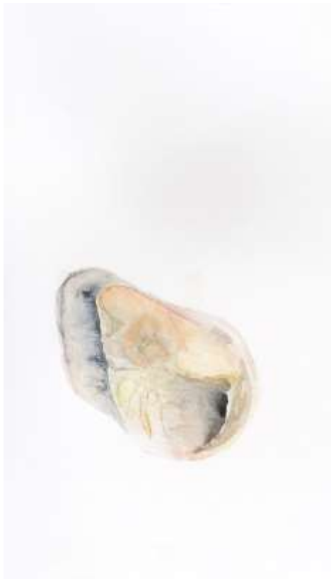
Születés (2018) akril, akvarell, vászon 50x30cm