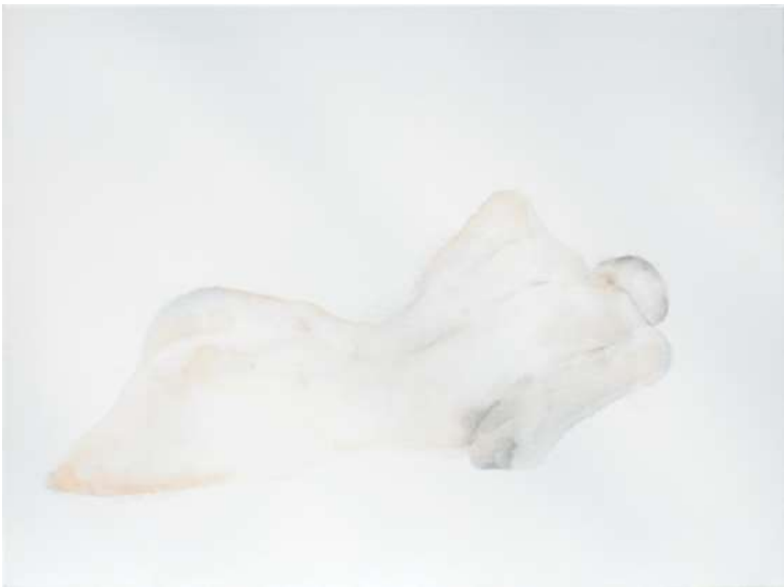
Újjászületés 2018 Akvarell, akril, vászon 70x100 cm