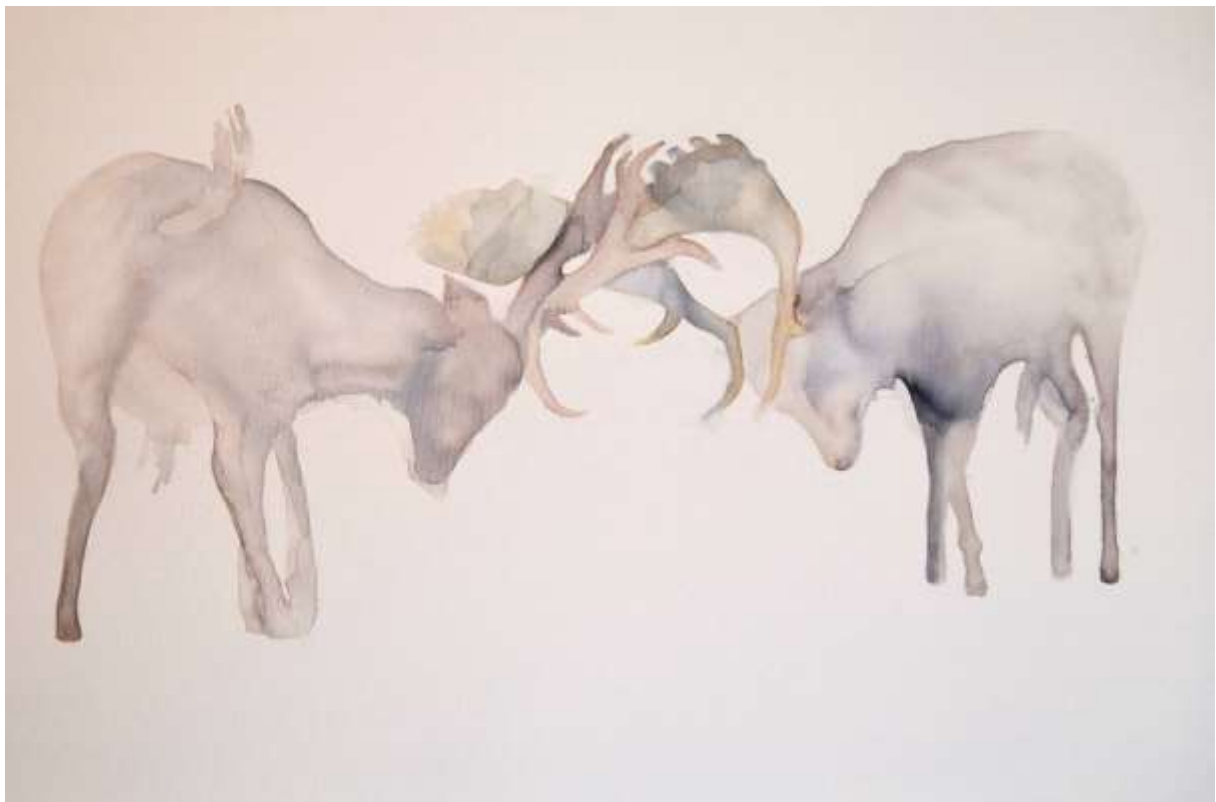
Ütközés (2017) akril, akvarell, vászon 100x150cm