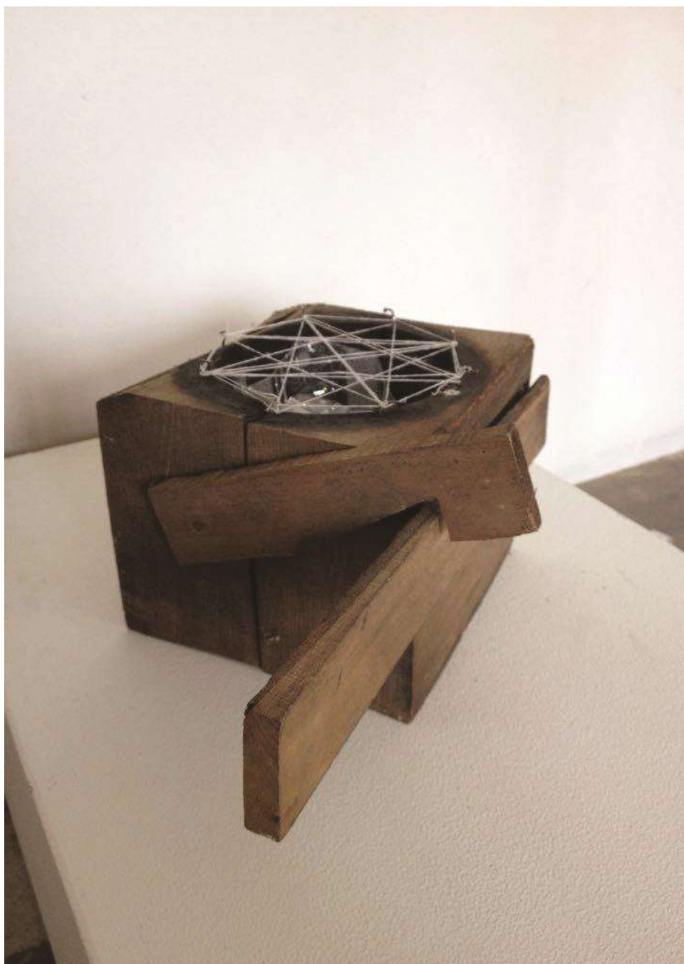
Kapu (2016) Fa, ólomkristály, céna 20x13x15 cm