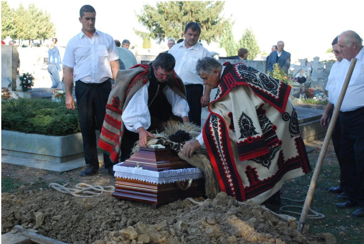
Juhásztemetés (Fotó: Nagy Gábor, Csanádpalota, 2017)