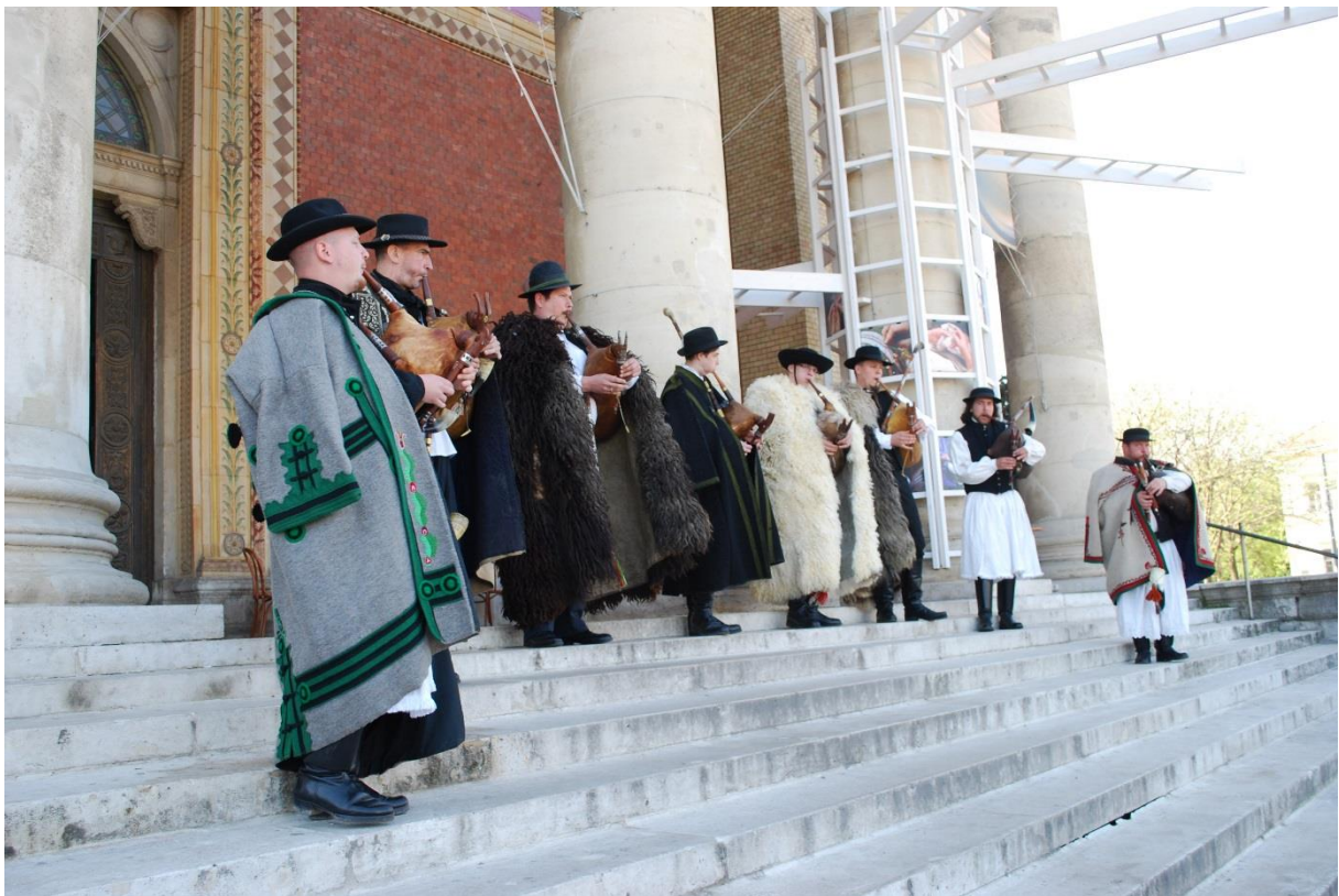
2018. 04. 21. KÉZ/MŰ/REMEK kiállítás megnyitásán