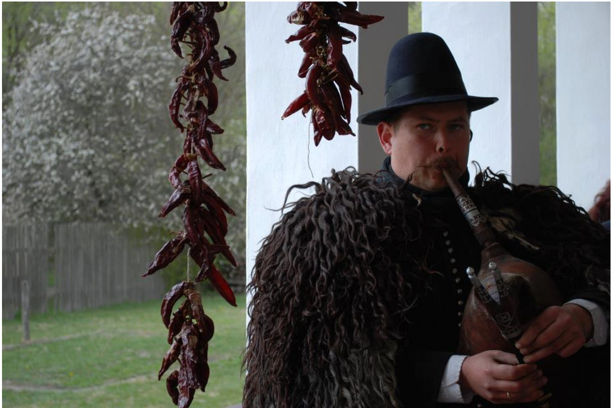
2012-ben az Ópusztaszeri Nemzeti Történelmi Emlékparkban