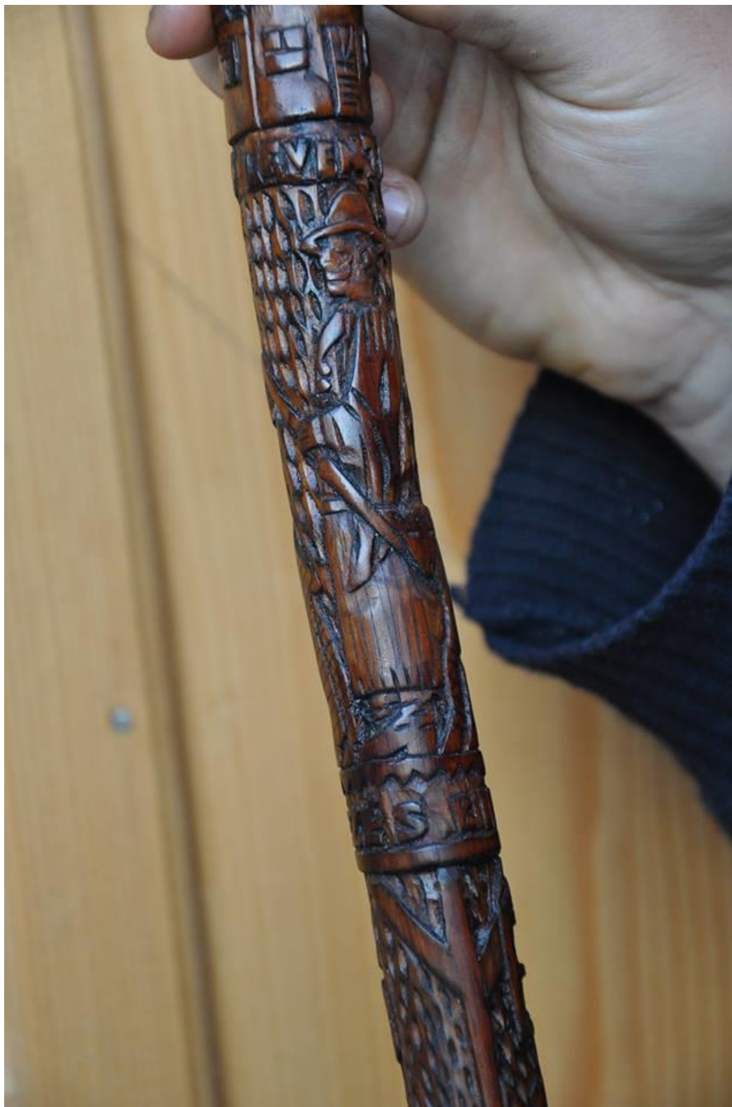
Saját faragású juhászkampószer részlete