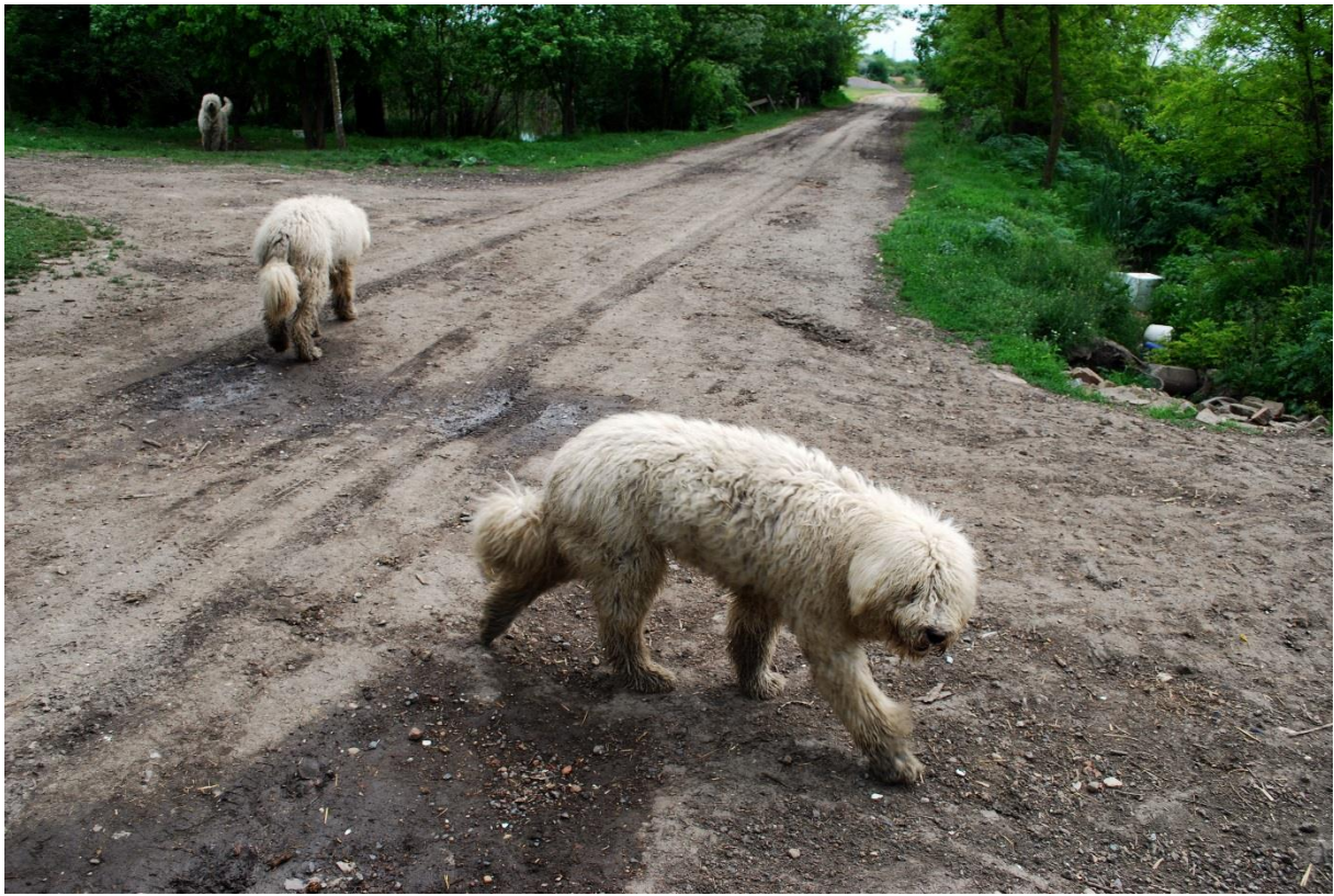
Komondorok (Fotó: Nagy Gábor, Hódmezővásárhely, 2015)