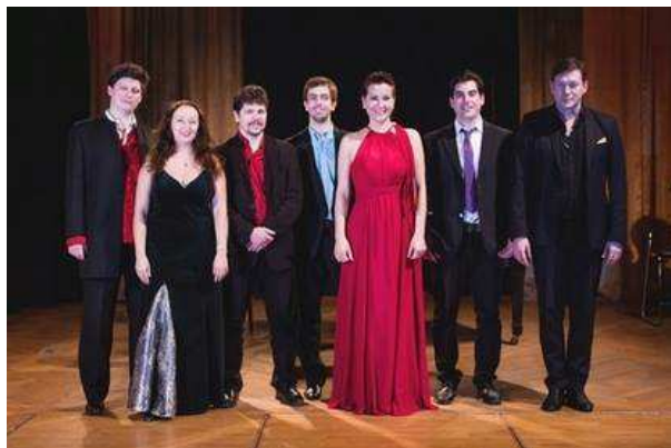
Kiváló Előadóművészeimmel a 2016 decemberi szerzői estemen

Zeneszerzői pályámon kiváló művészekkel dolgozom. A velük való munka rendkívül fontos és inspiratív! Számos koncertemen játszottunk együtt vagy választott művemet adtuk elő. Rendszeresen fellépője vagyok az évente megrendezésre kerülő hazai fesztiváloknak: Mini Fesztivál, Fészek klub hangversenyei, Művészpédagógusok koncertjei.