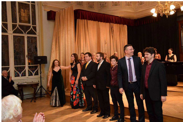
Neves művésztársaimmal, előadói csapattal a 2018. januári 11-i önálló szerzői estemen a Nádor teremben

Zeneszerzői munkásságom céljai között szerepel minél színesebb, változatosabb művek sokaságának megalkotása és bemutatása ezáltal minél szélesebb körben bemutatni a magyar kortárs zene értékeit!