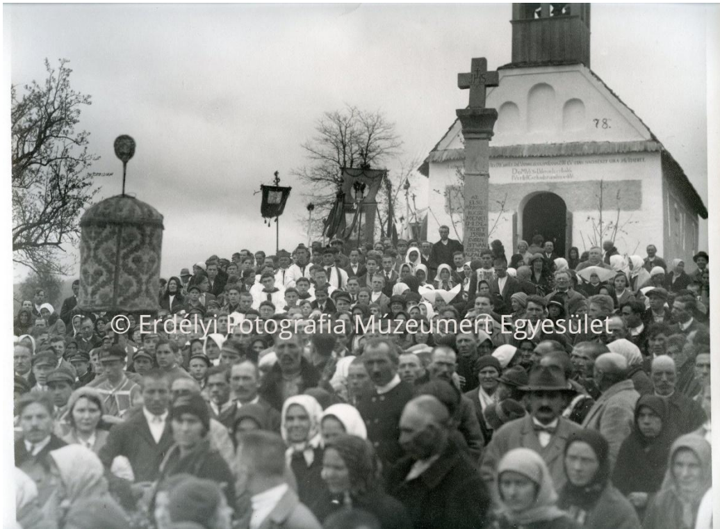
Csíksomlyói búcsú, 1930-as évek