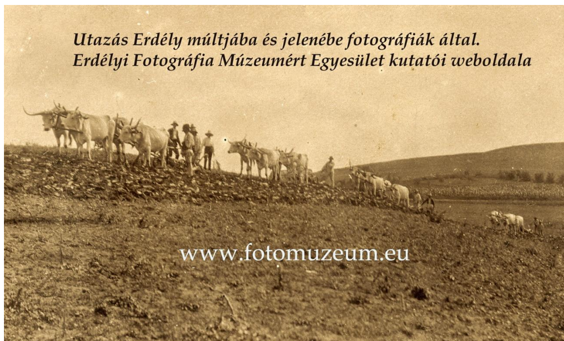
7 pár ökör szántja erdély földjét, az 1900-as évek eleje