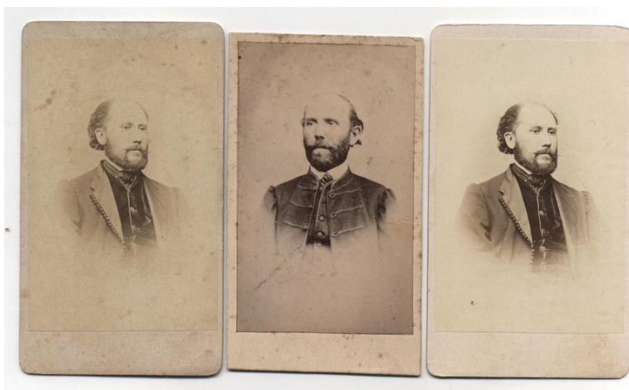
Vámbéry Ármin, magyar orientalista 1860-as évek eleje