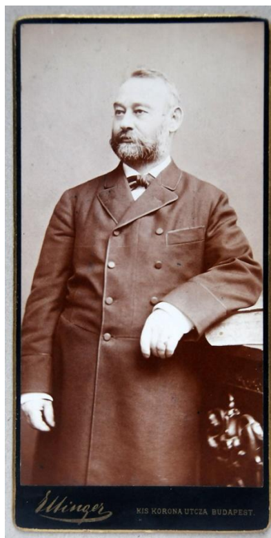
Bánffy Dezső miniszterelnök, kb. 1876-ból ...