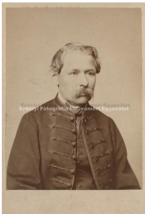
Arany János magyar költő, tanár, újságíró. Korabeli fénykép, 1870.-es évek