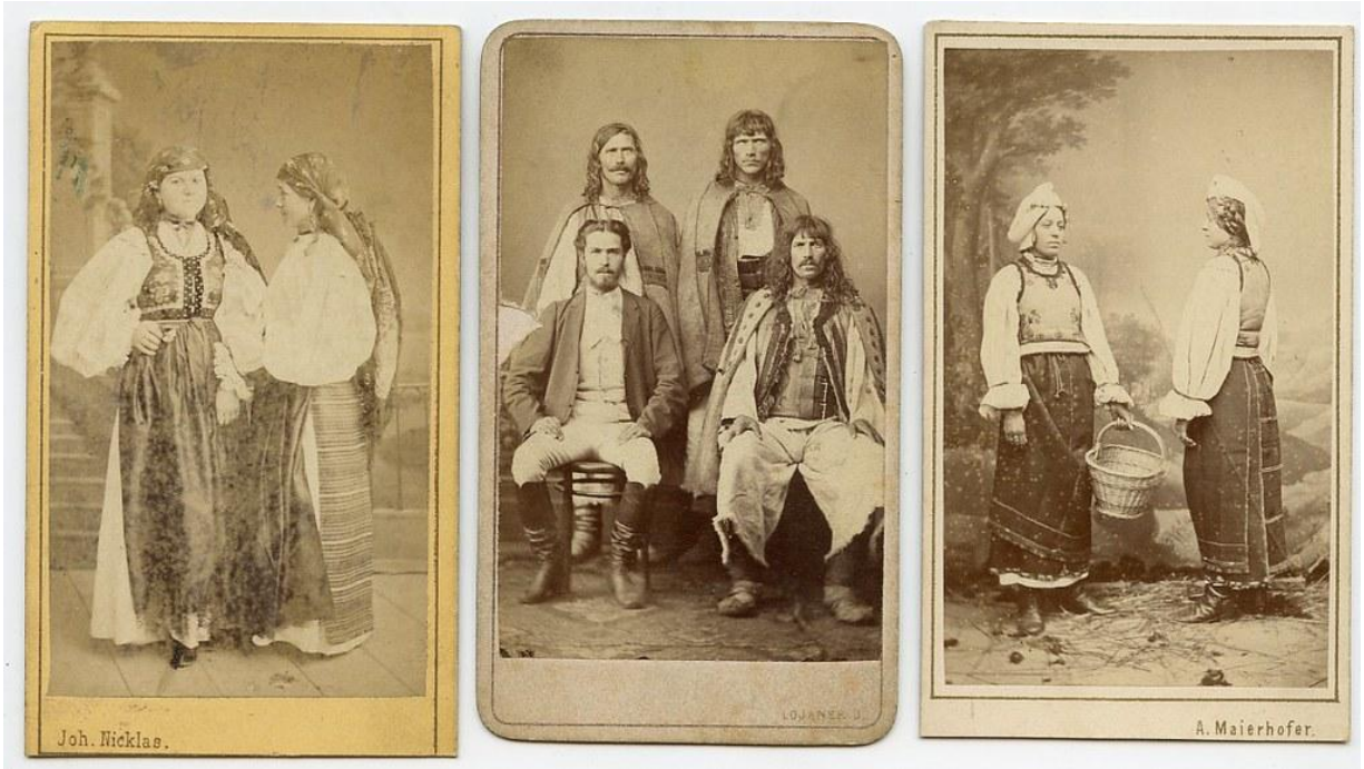
Népviséletek Erdélyben 1860-1870-es években