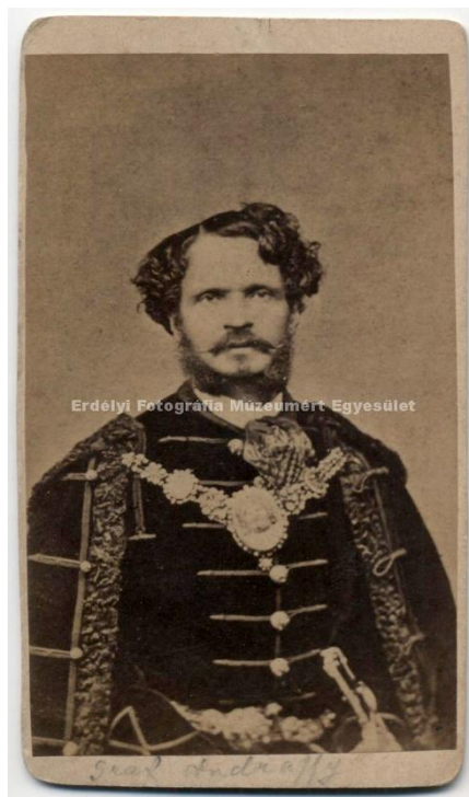
Csíkzentkirályi és krasznahorkai gróf Andrassy Gyula , a Magyar Királyság miniszterelnöke, 1871–79 körül