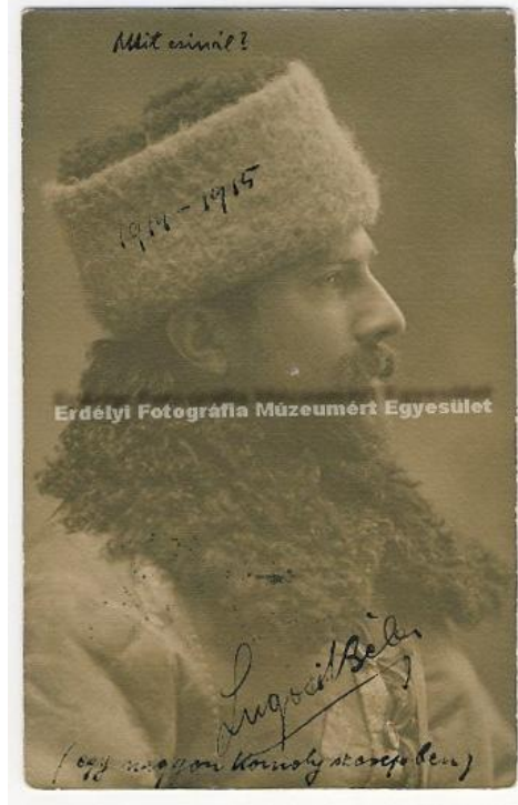
Lugosi Béla -Dracula - fényképe 1916-ból saját aláírásával