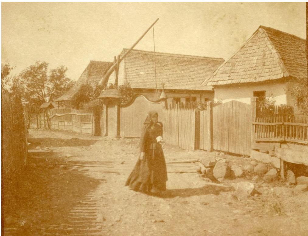
Szovátai utca 1917-ben. Német katonai felvétel