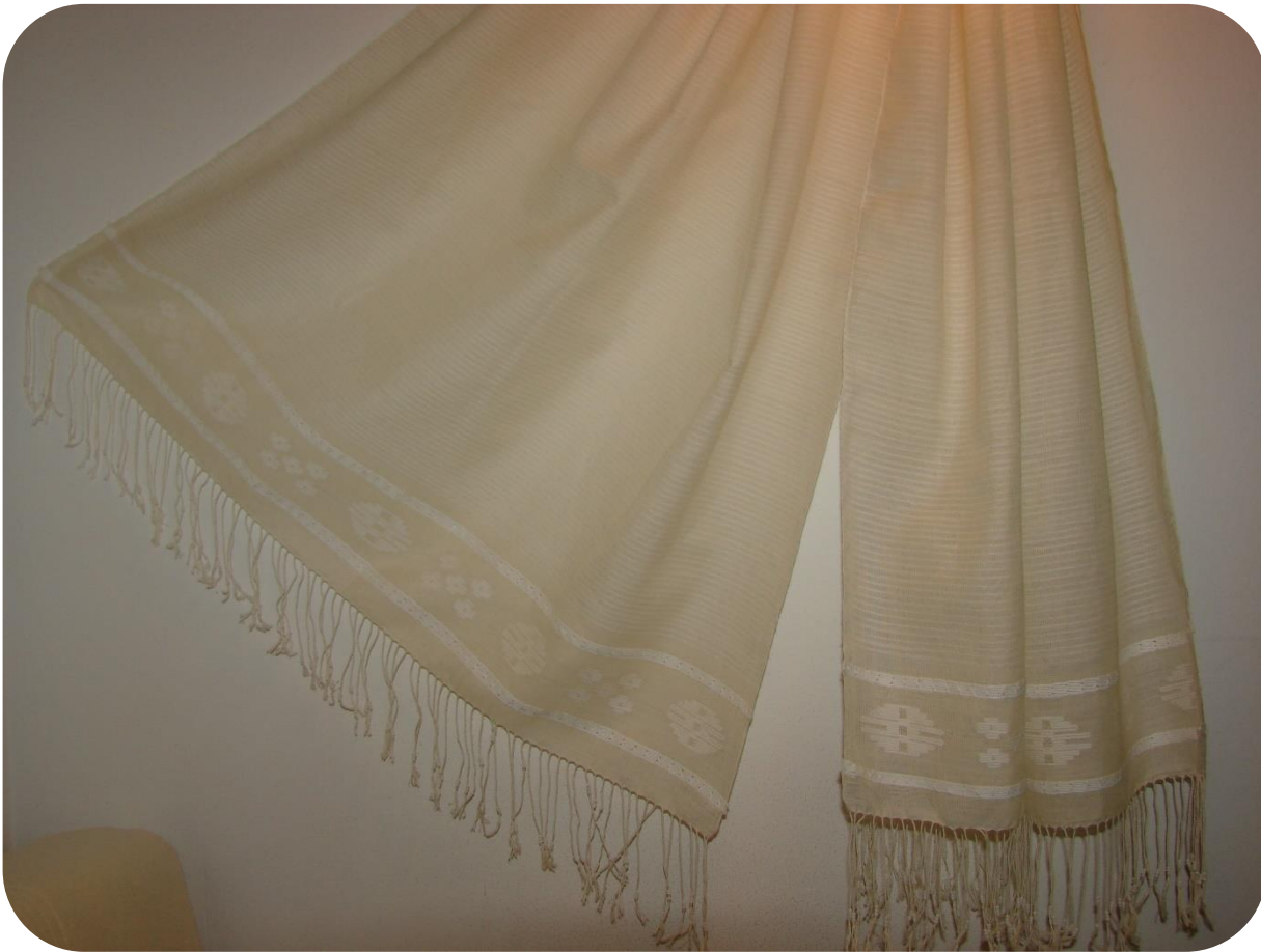
Napos-holdas keresztelői kendő