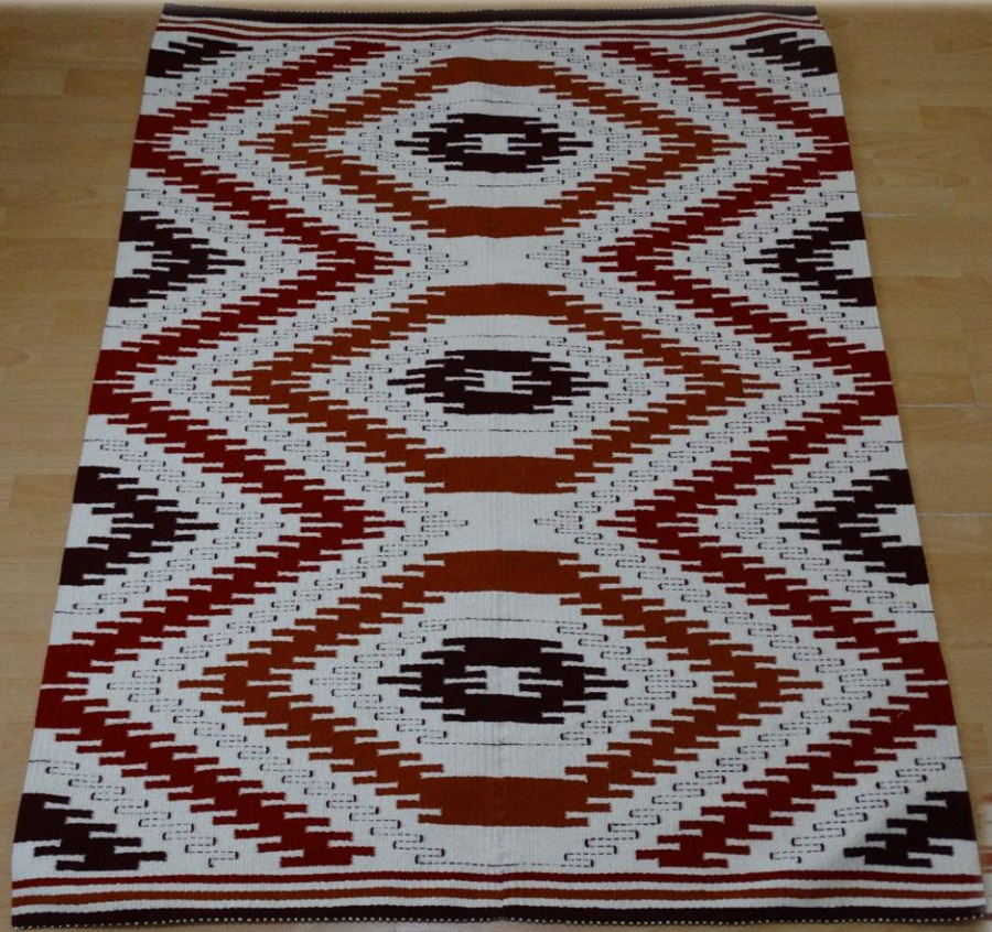
1. Csáncsált festékes szőnyegem