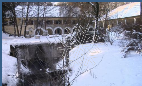
Kácsai fürdő – a fekete bődöncsiga utolsó lakhelye