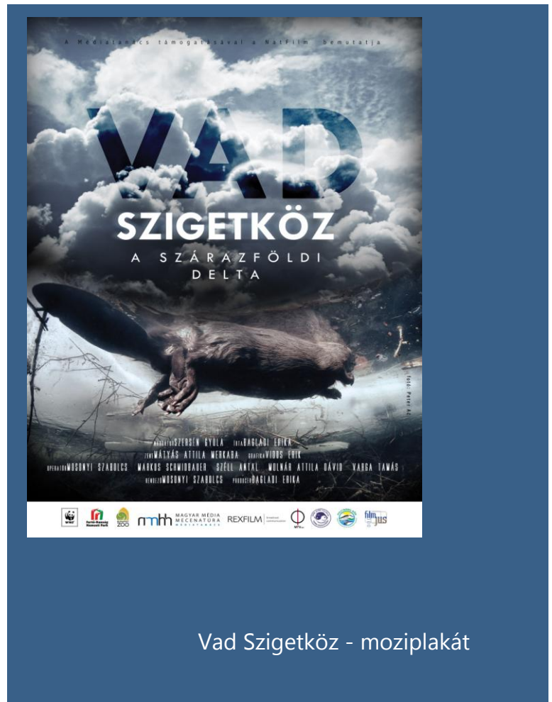
Vad Szigetköz - moziplakát