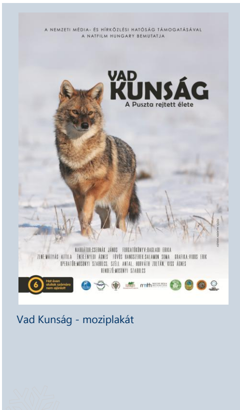
Vad Kunság - moziplakát