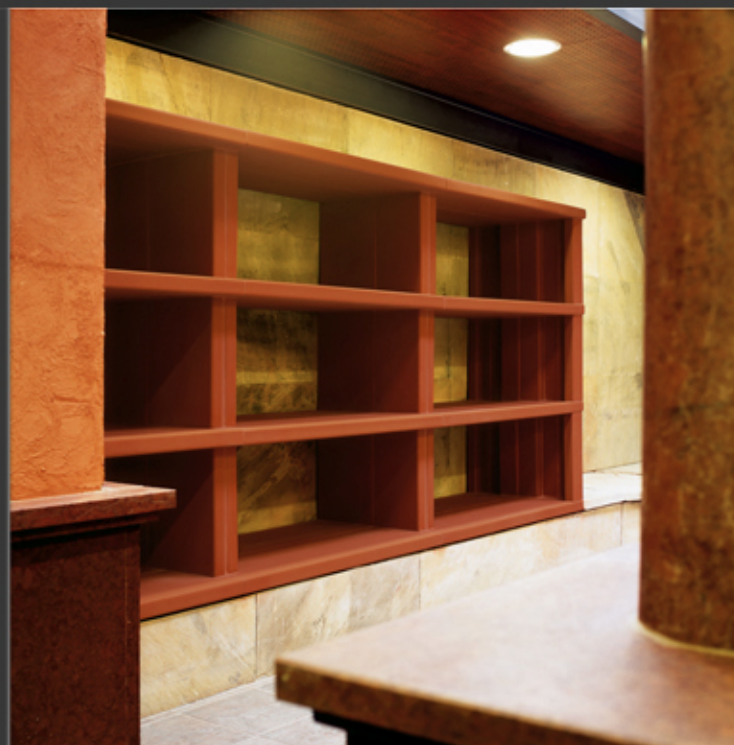
Fűtött pad és lepedőszárító polc, Rudas Fürdő, Budapest extrudált fagyálló kerámia