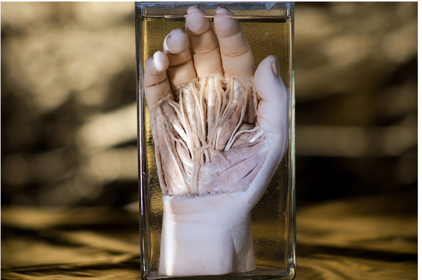
Alkotás 01, 2018