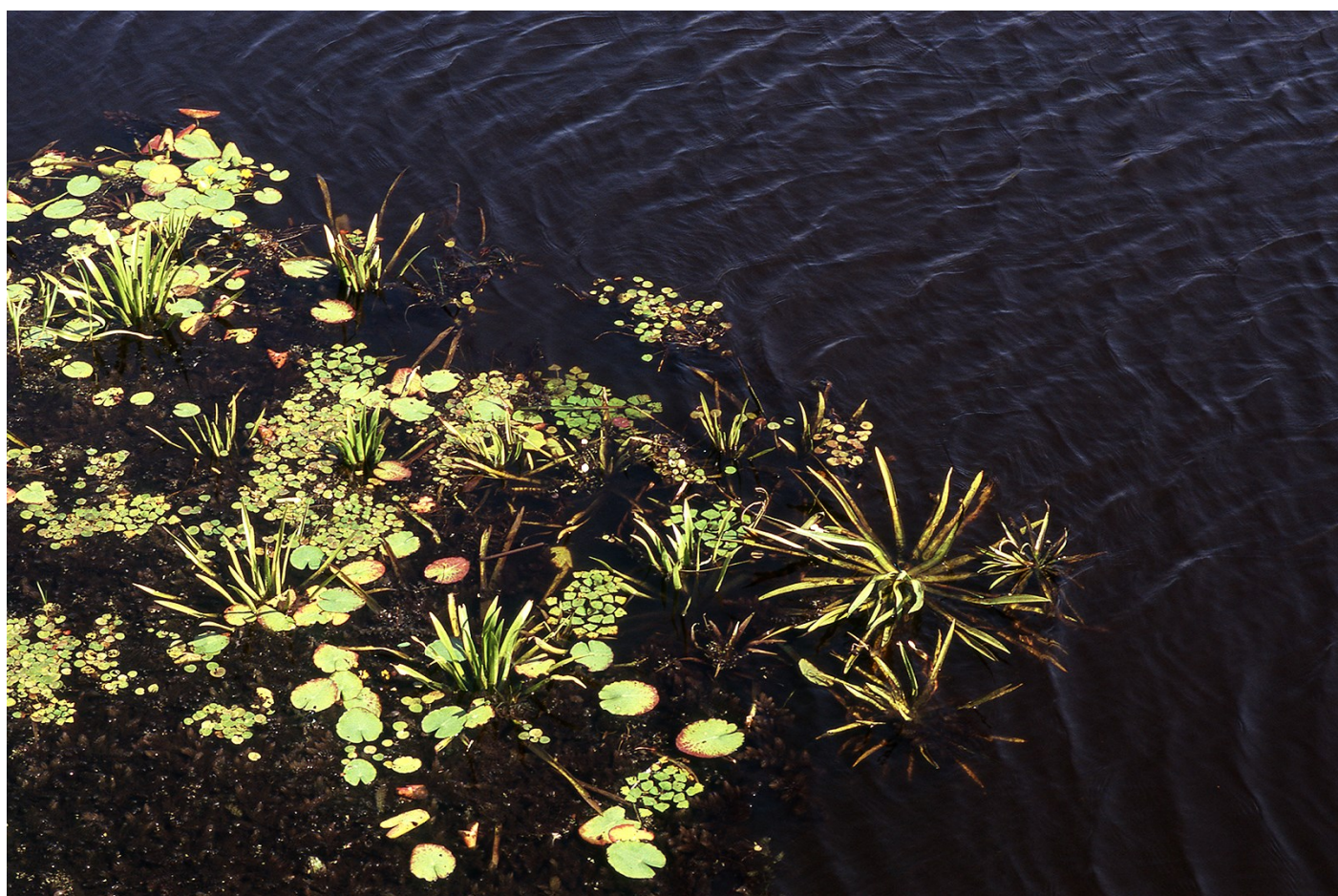
Növény 02, 2017