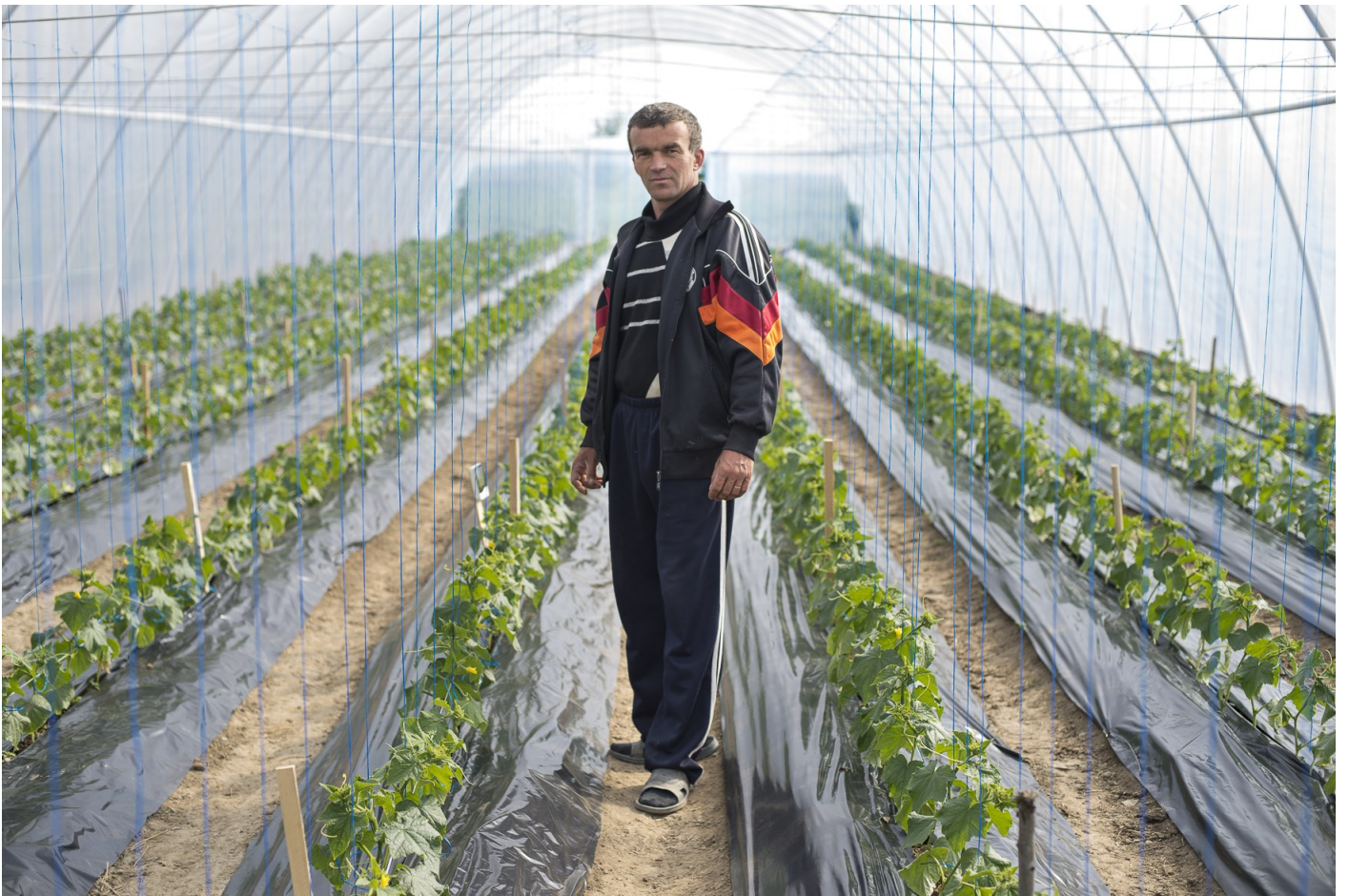
Nagydobronyi gazda a fóliasátorban, 2015