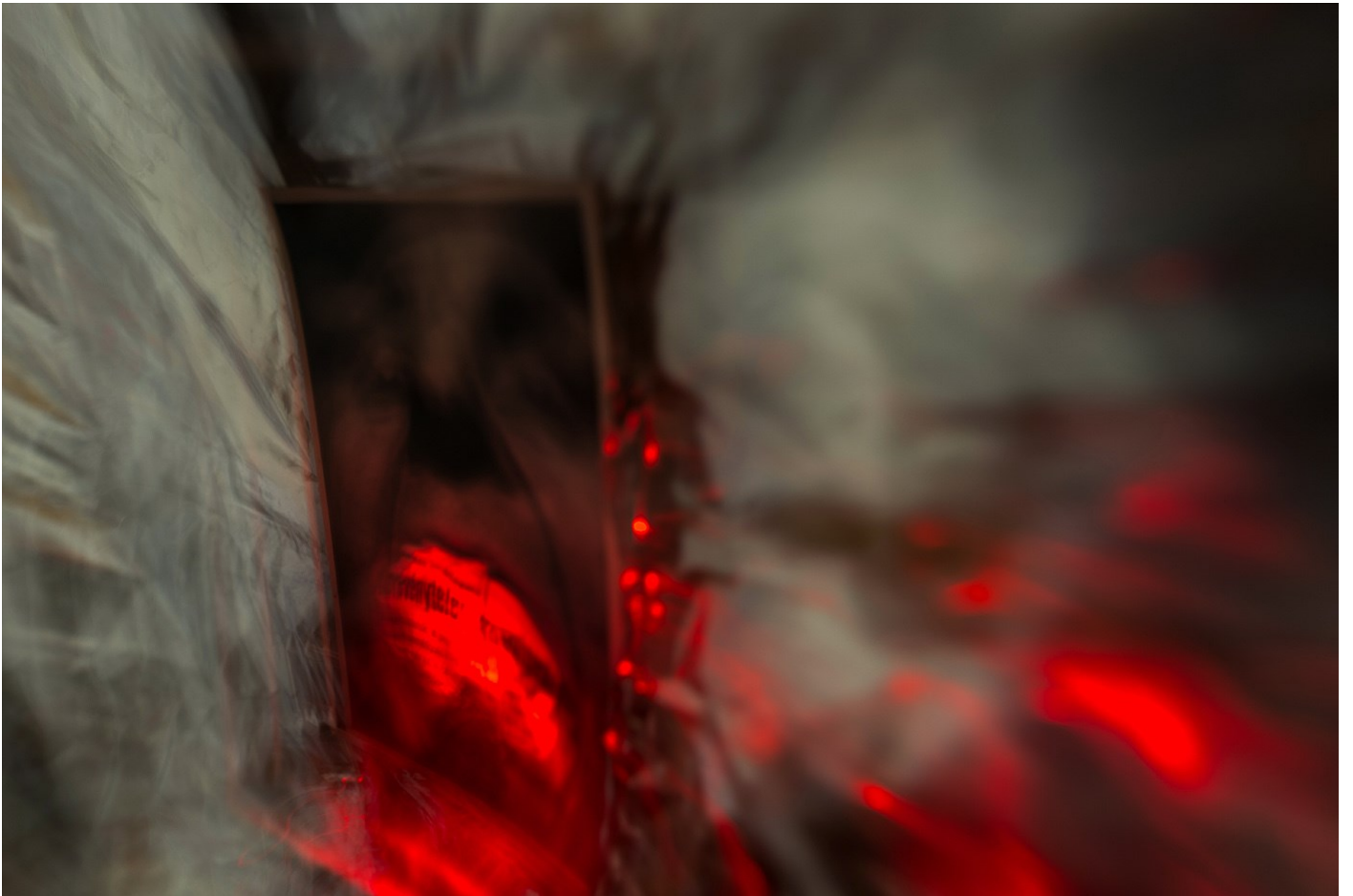
Alkotás 04, 2017