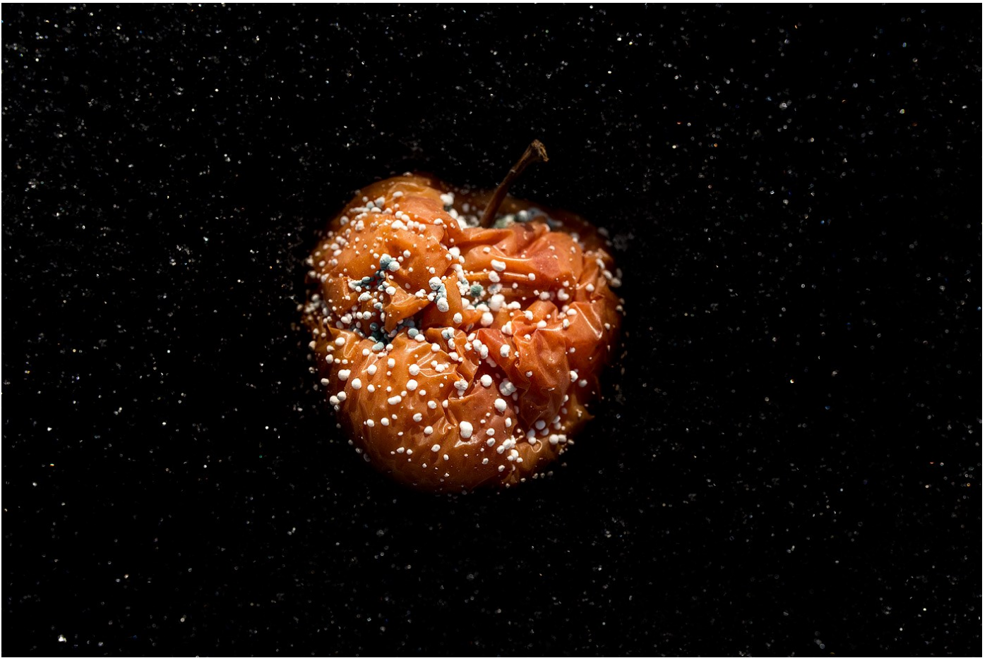
Növény 01, 2017