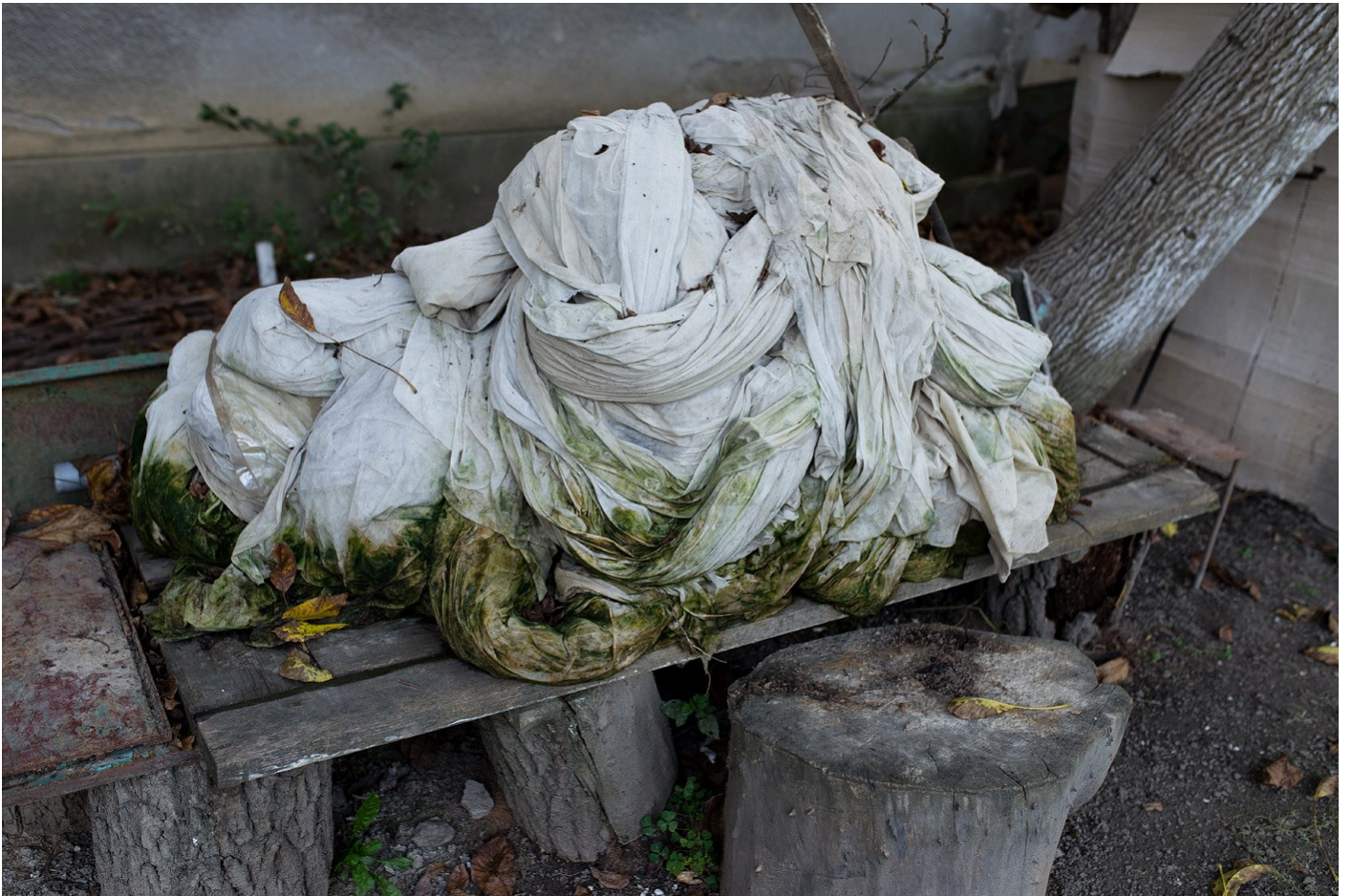
Tárgy 06, 2018