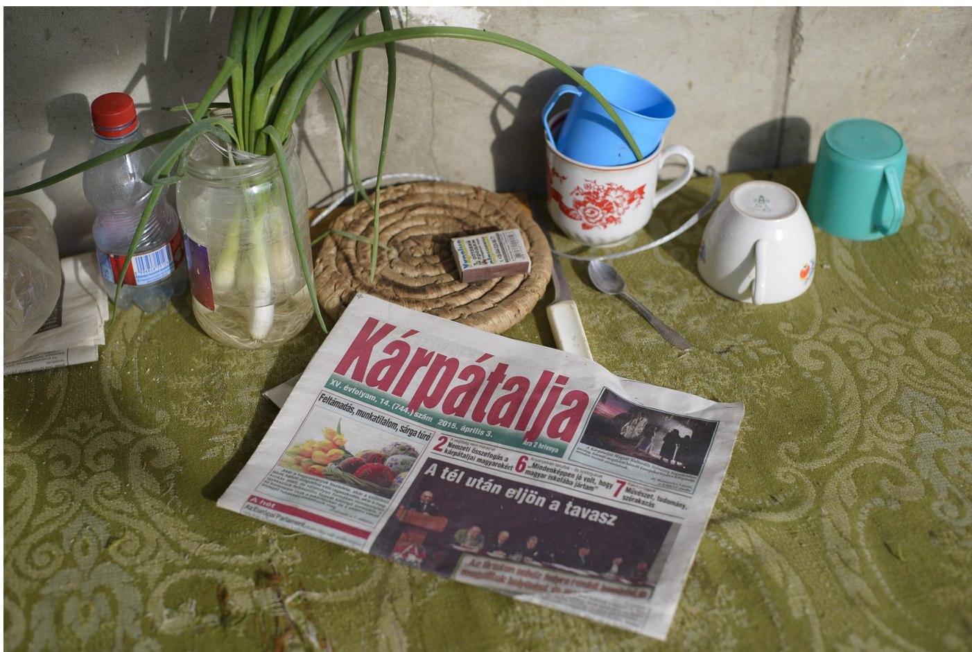
Csendélet, Nagydobrony, 2015