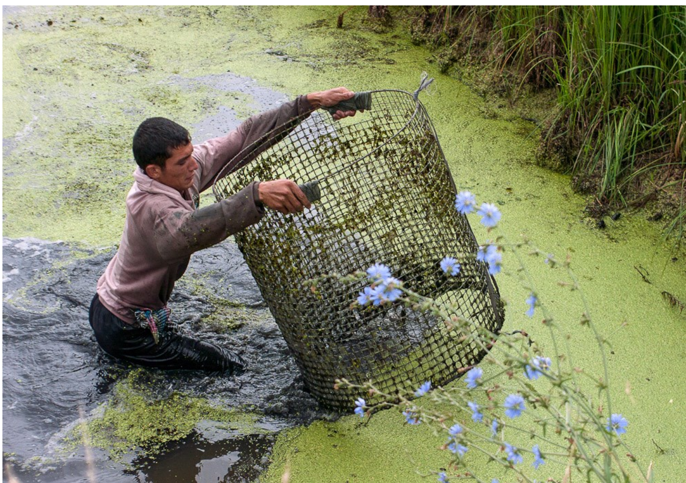
Halászó fiú, Nagydobrony, Ukrajna, 2012