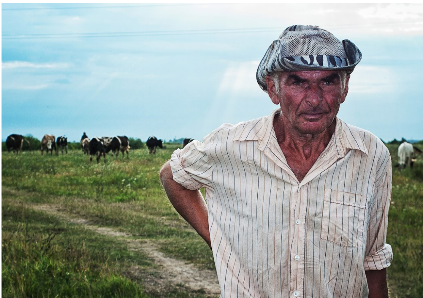
Csordás, Nagydobrony, Ukrajna, 2012