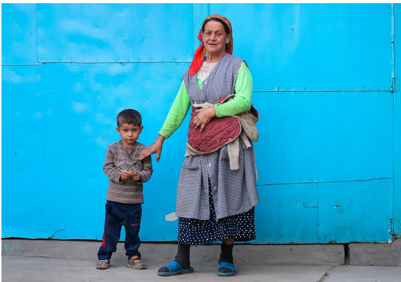
Cigányasszony az unokájával, Nagydobrony, Ukrajna, 2014