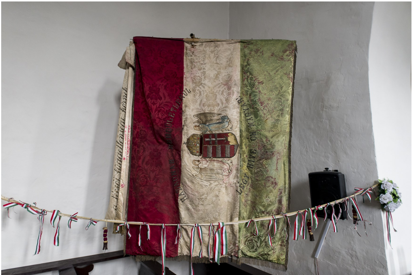
Magyar zászló a técsői református templomban, 2015