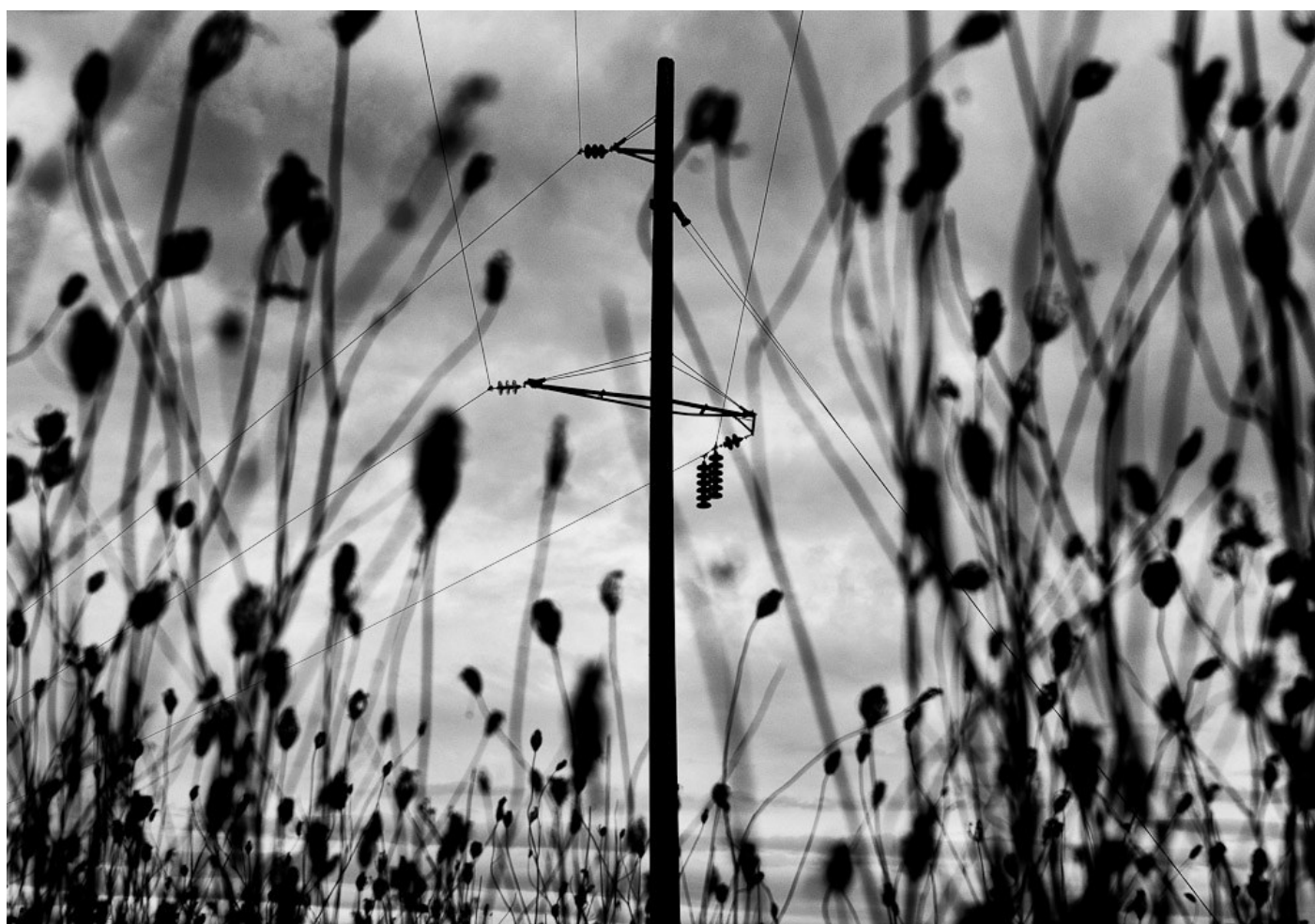
Oszlop, Nagydobrony, Ukrajna, 2014