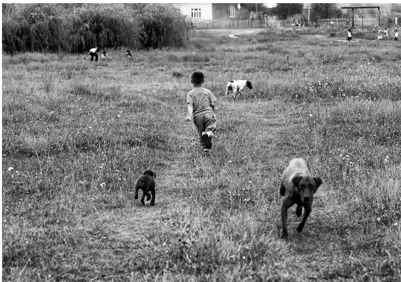
Futás a kutyákkal, Nagydobrony, Ukrajna, 2011