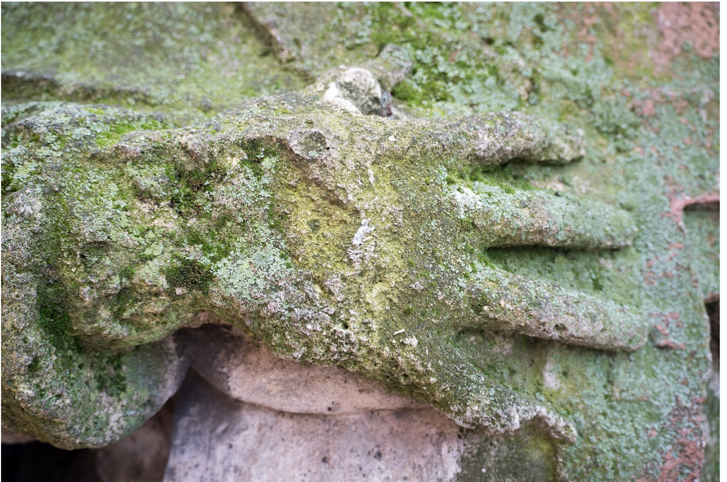
Alkotás 02, 2018