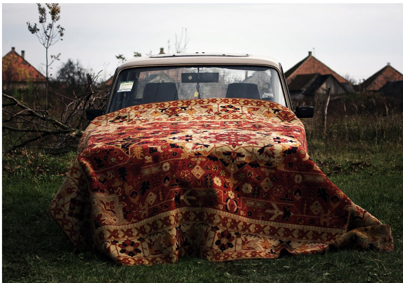
Szőnyeg, Nagydobrony, Ukrajna, 2010