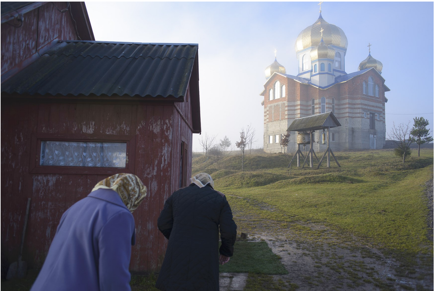
Felsőszárad templom, 2015