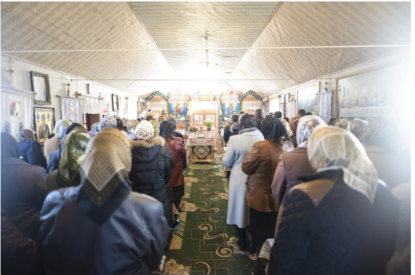
Felsősáradi templom, 2015