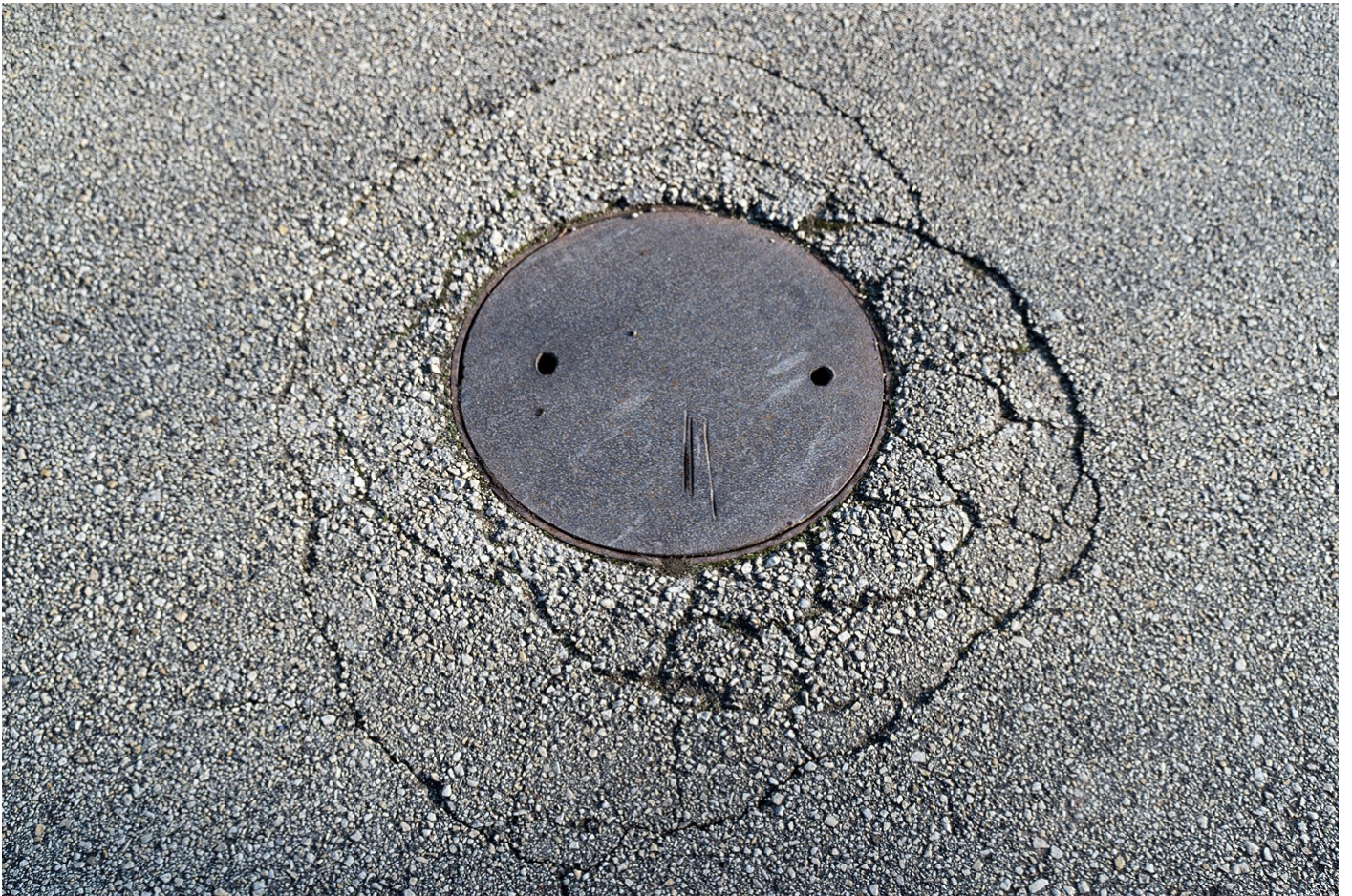
Tárgy 05, 2018