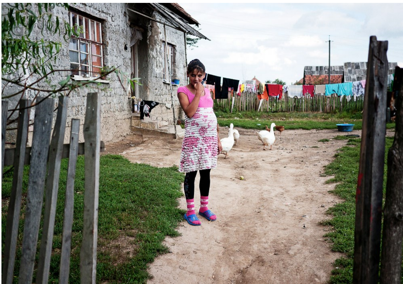
Várandós cigányasszony az udvaron, Nagydobrony, Ukrajna, 2012