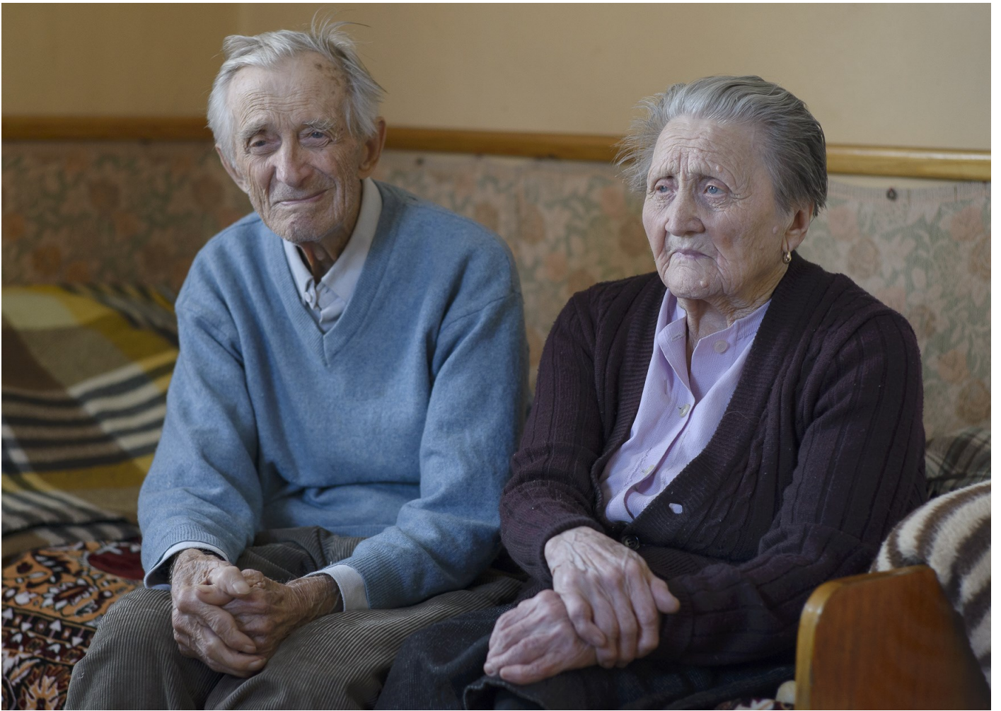
Idős pár, Kőrösmező, 2015