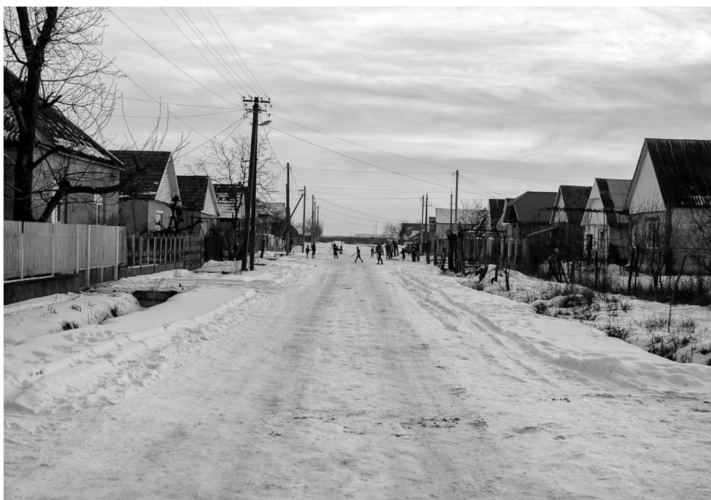
Nyirigyszög utca, Nagydobrony, Ukrajna, 2014