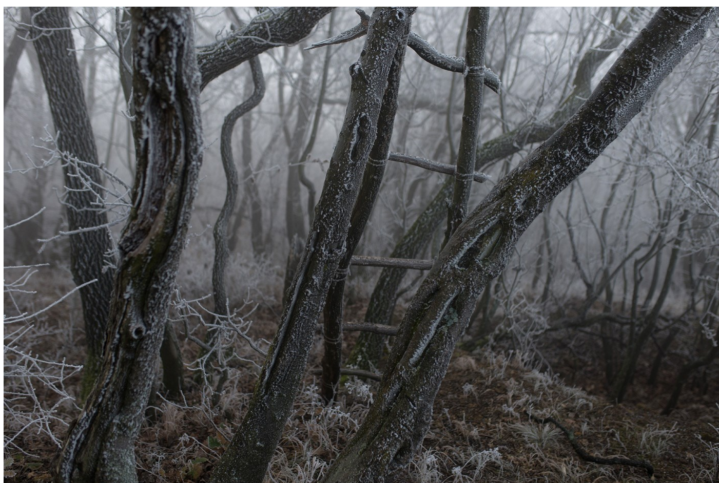
Tárgy 02, 2017