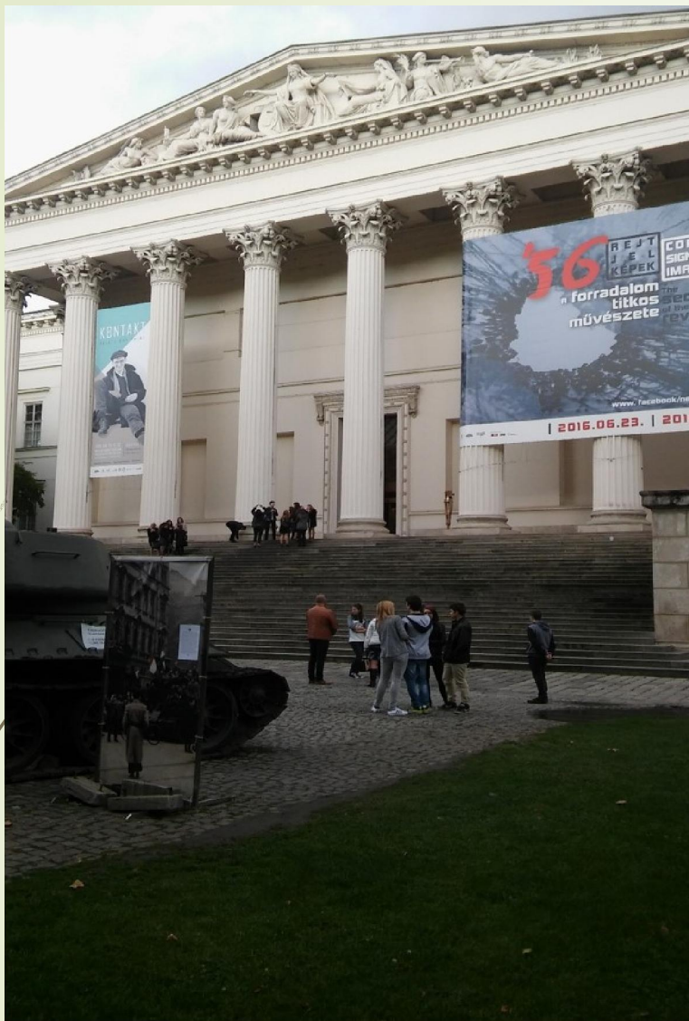
Rejt/Jel/Képek 56 – A forradalom titkos művészete című időszak kiállítás képei