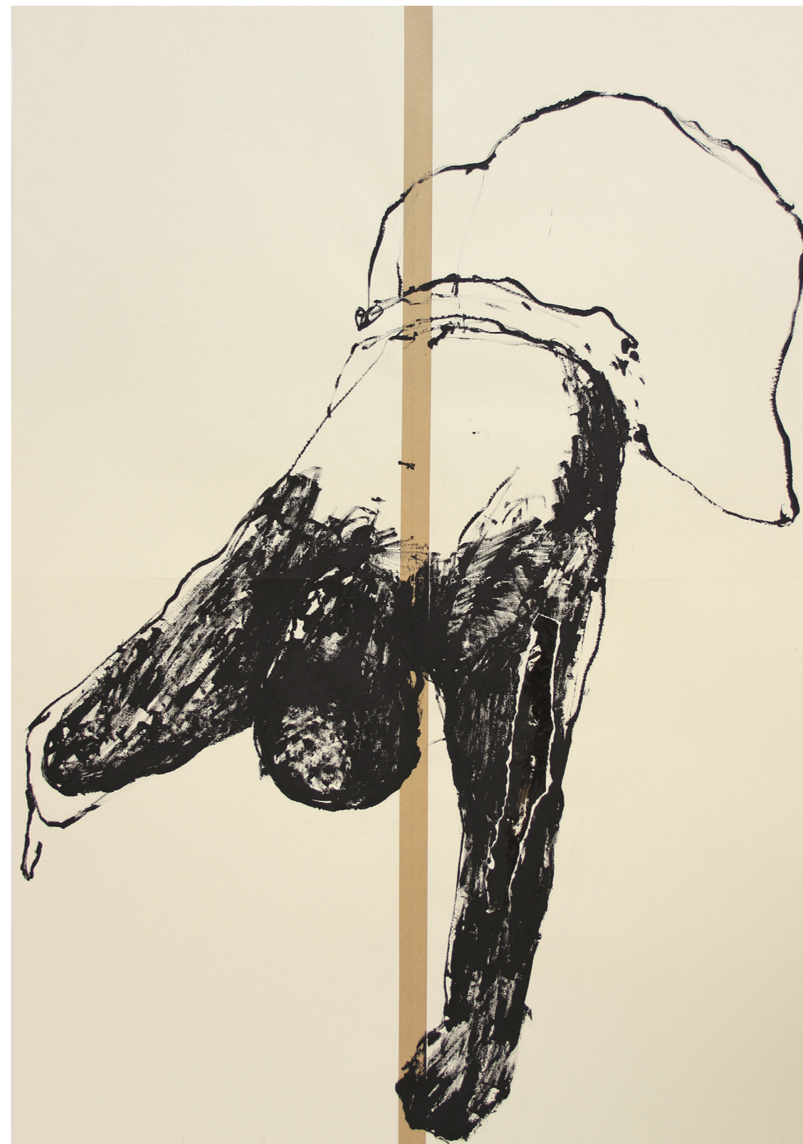
A HÁBORÚ ANATÓMIÁJA 200 x 140 cm | akril papíron | 2018