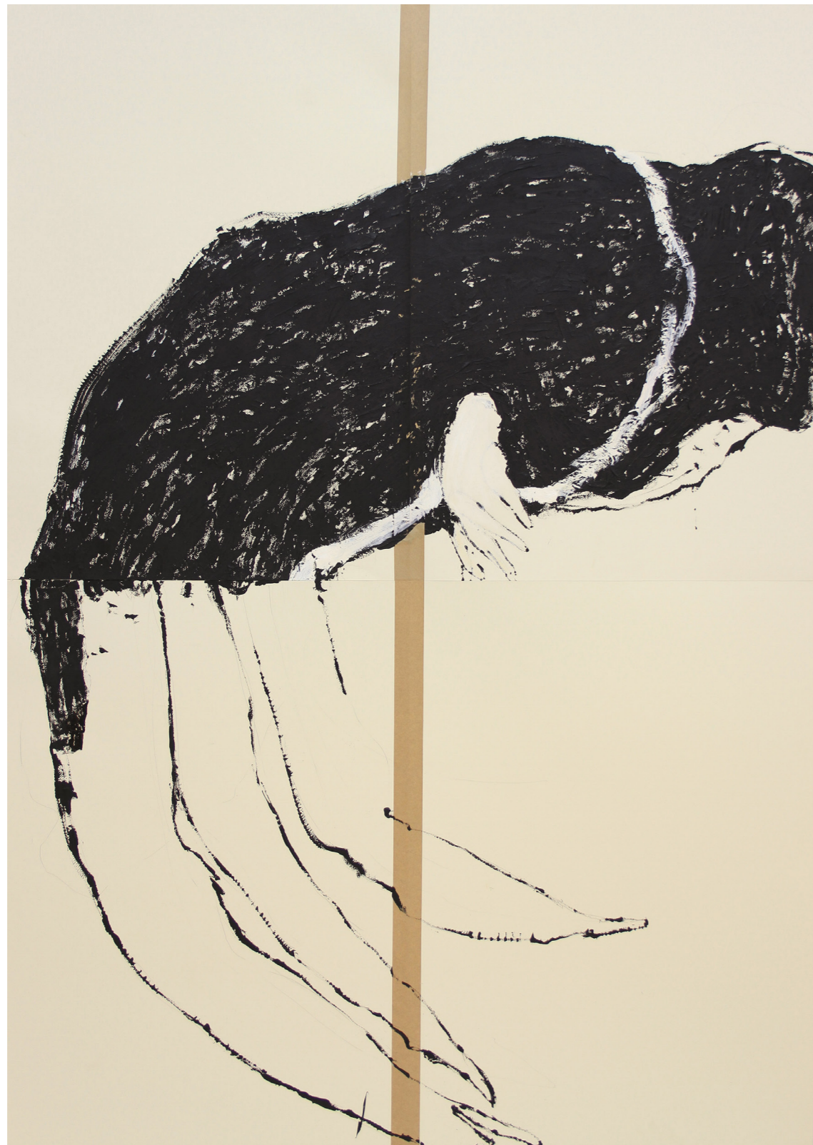
A HÁBORÚ ANATÓMIÁJA 200 x 140 cm | akril papíron | 2018