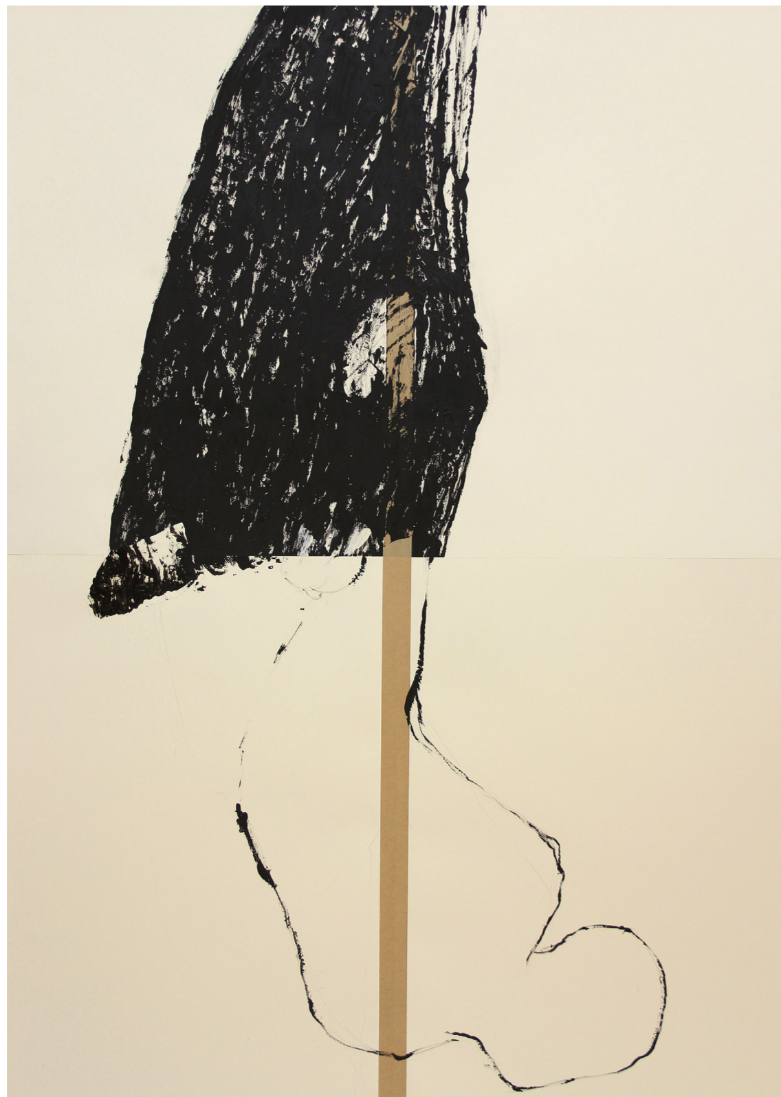
A HÁBORÚ ANATÓMIÁJA 200 x 140 cm | akril papíron | 2018