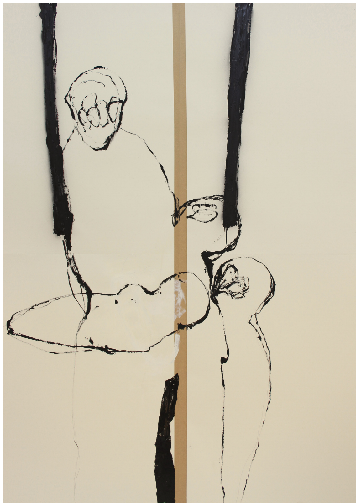
A HÁBORÚ ANATÓMIÁJA 200 x 140 cm | akril papíron | 2018