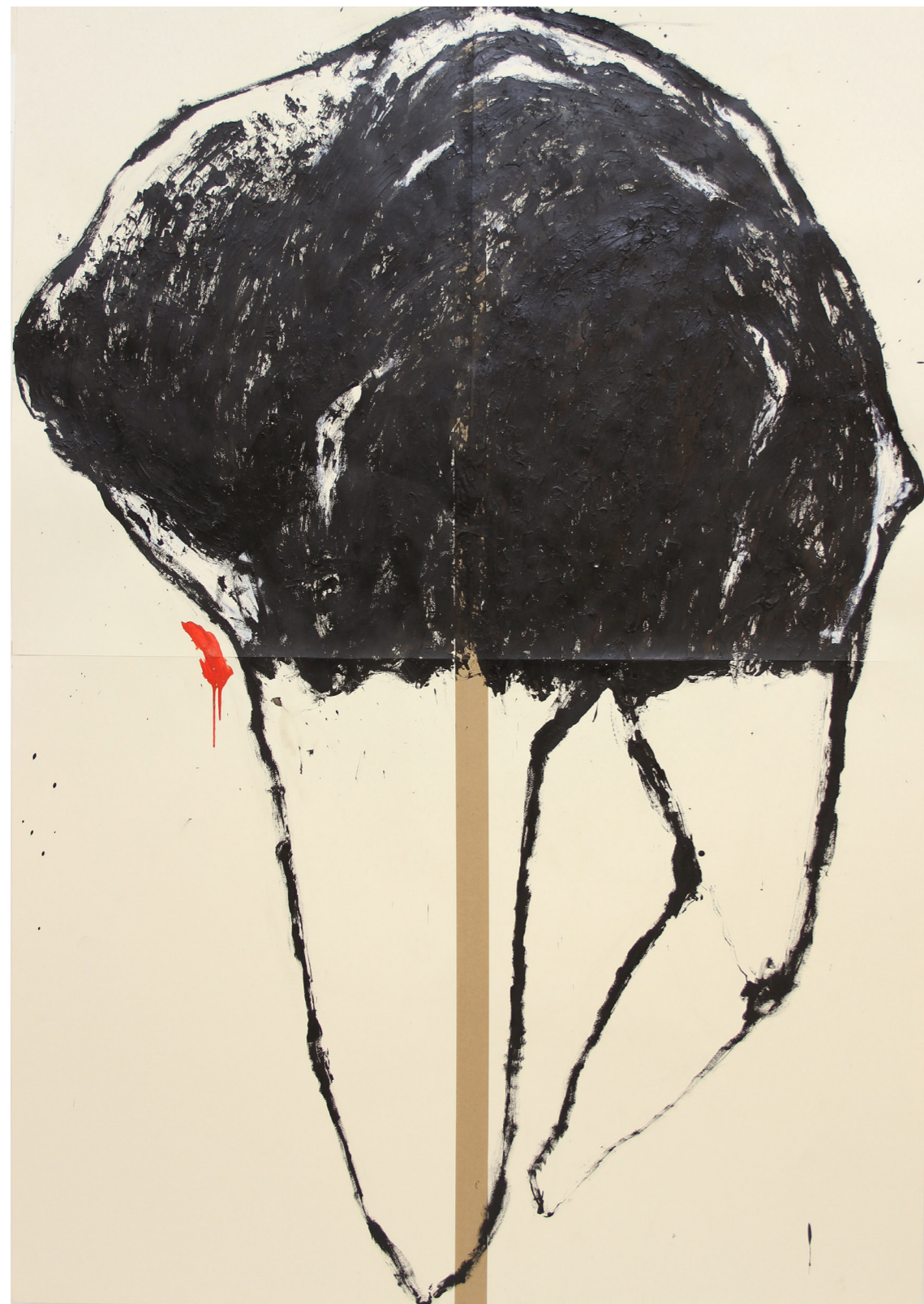
A HÁBORÚ ANATÓMIÁJA 200 x 140 cm | akril papíron | 2018