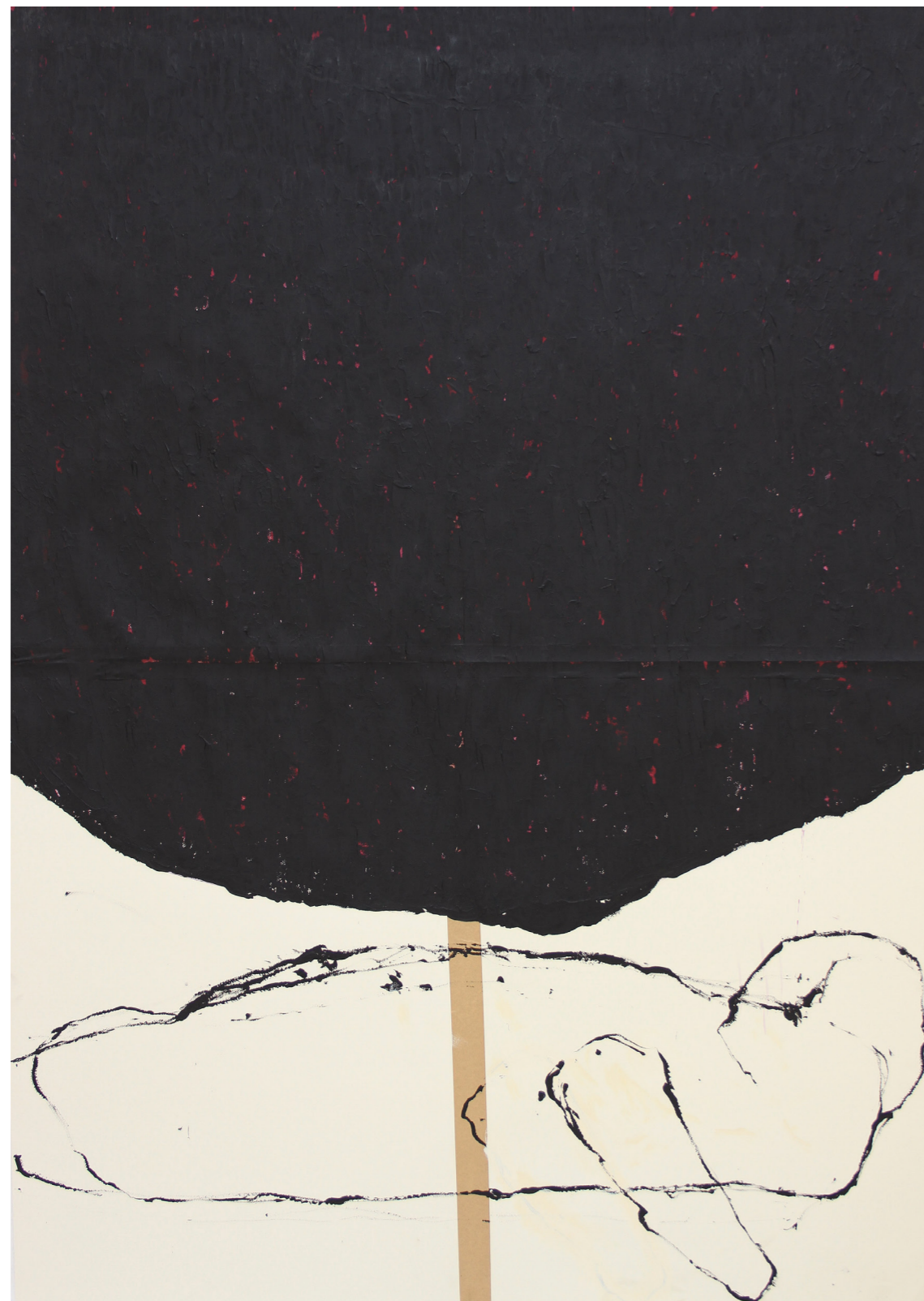
A HÁBORÚ ANATÓMIÁJA 200 x 140 cm | akril papíron | 2018