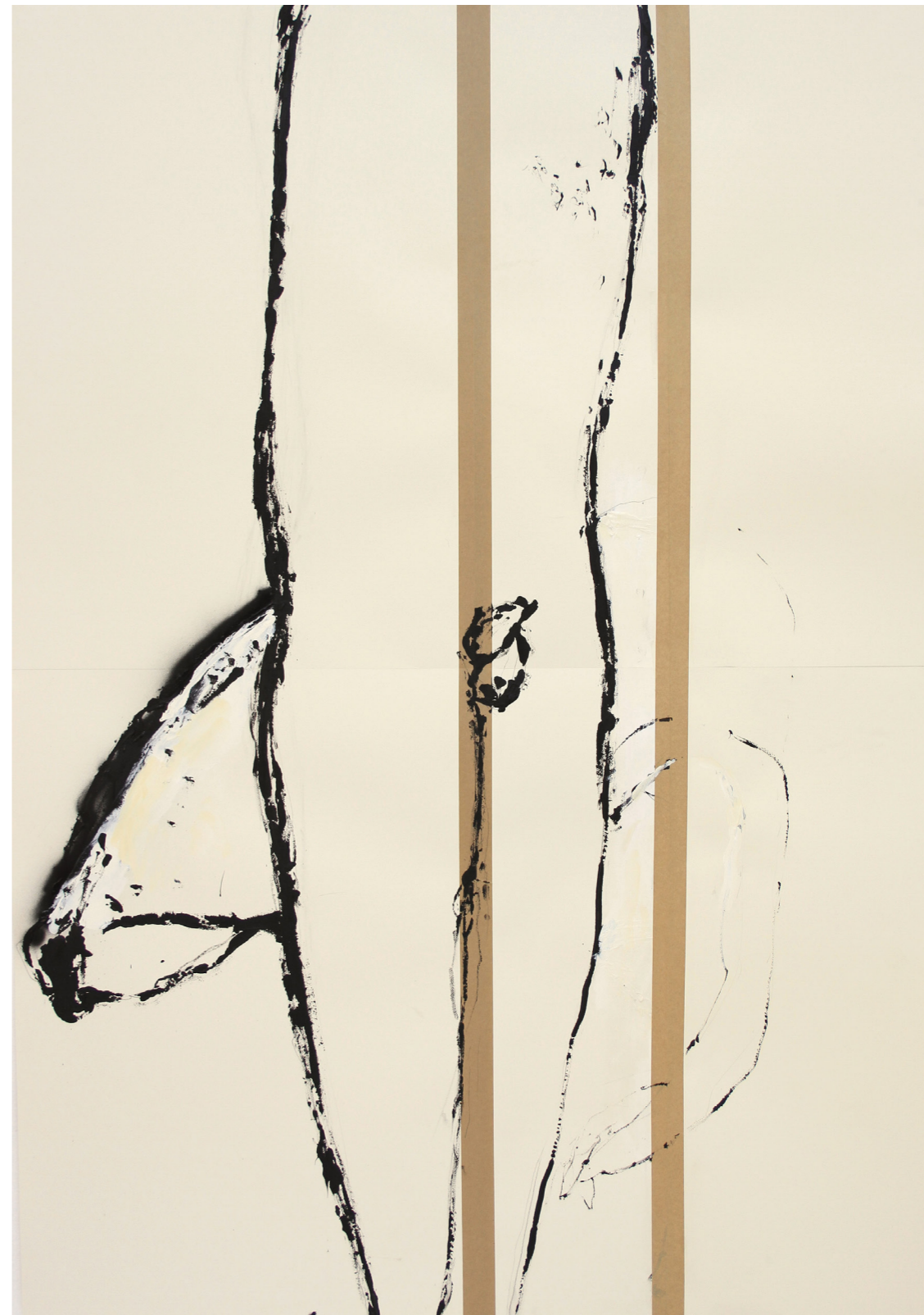
A HÁBORÚ ANATÓMIÁJA 200 x 140 cm | akril papíron | 2018