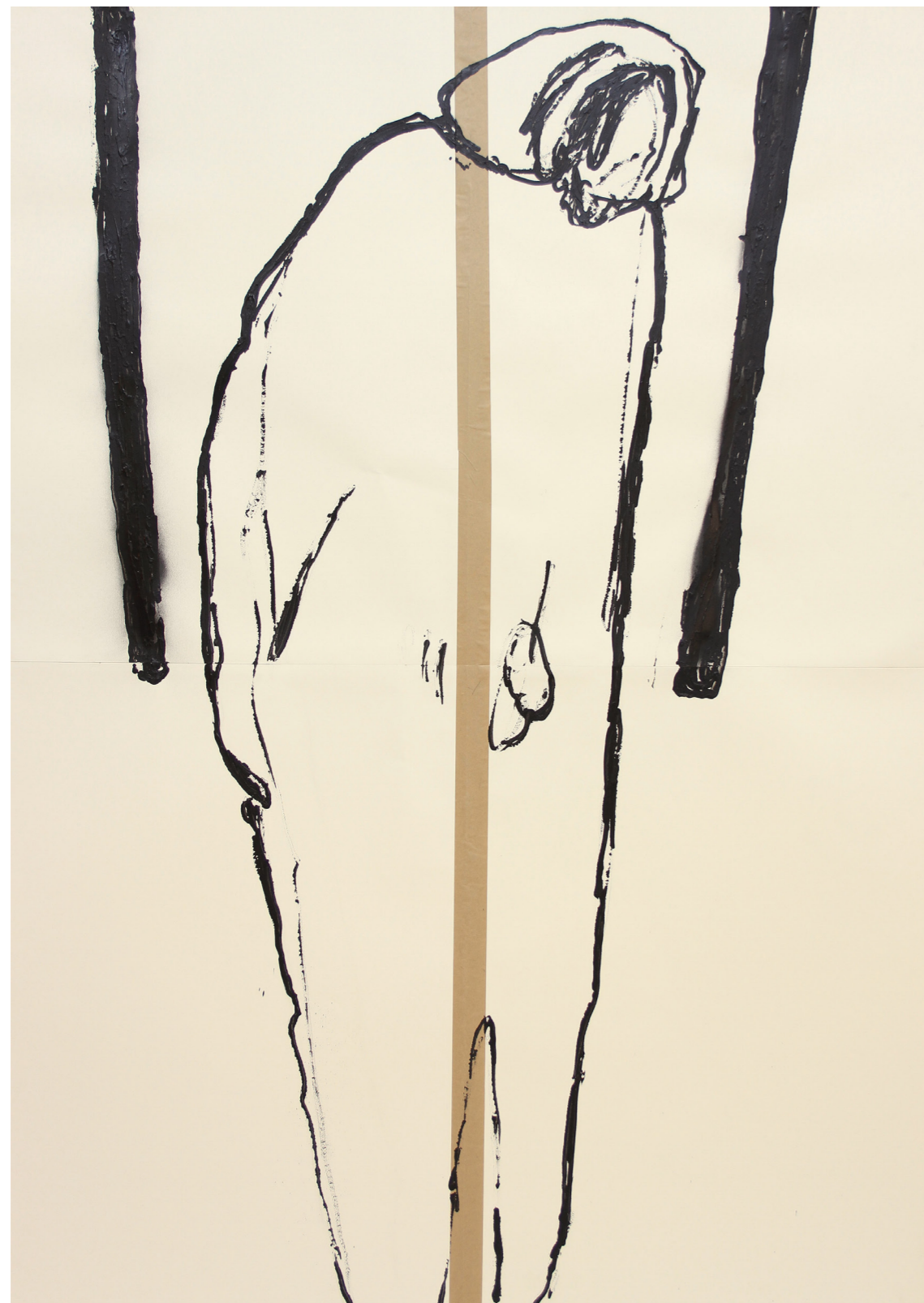
A HÁBORÚ ANATÓMIÁJA 200 x 140 cm | akril papíron | 2018