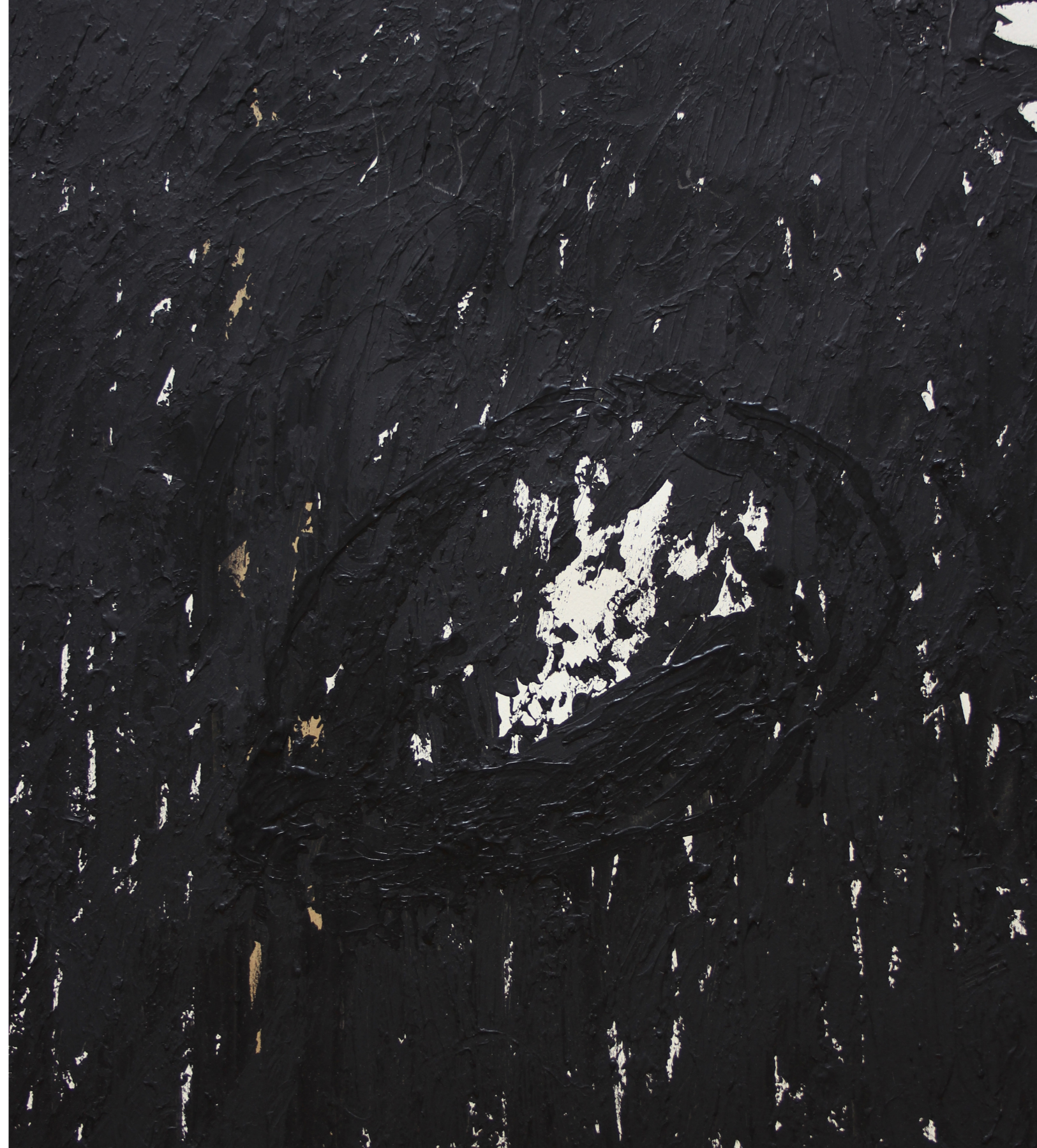
A HÁBORÚ ANATÓMIÁJA (RÉSZLET) 200 x 140 cm | akril papíron | 2018