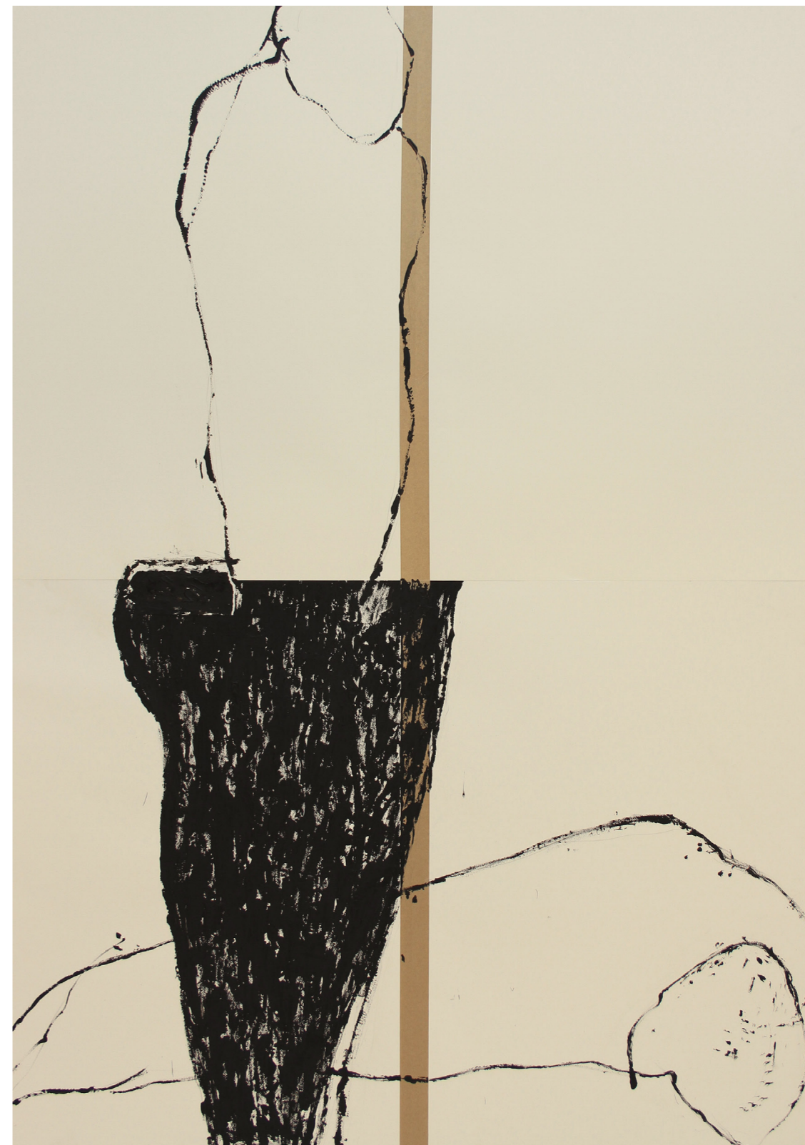
A HÁBORÚ ANATÓMIÁJA 200 x 140 cm | akril papíron | 2018