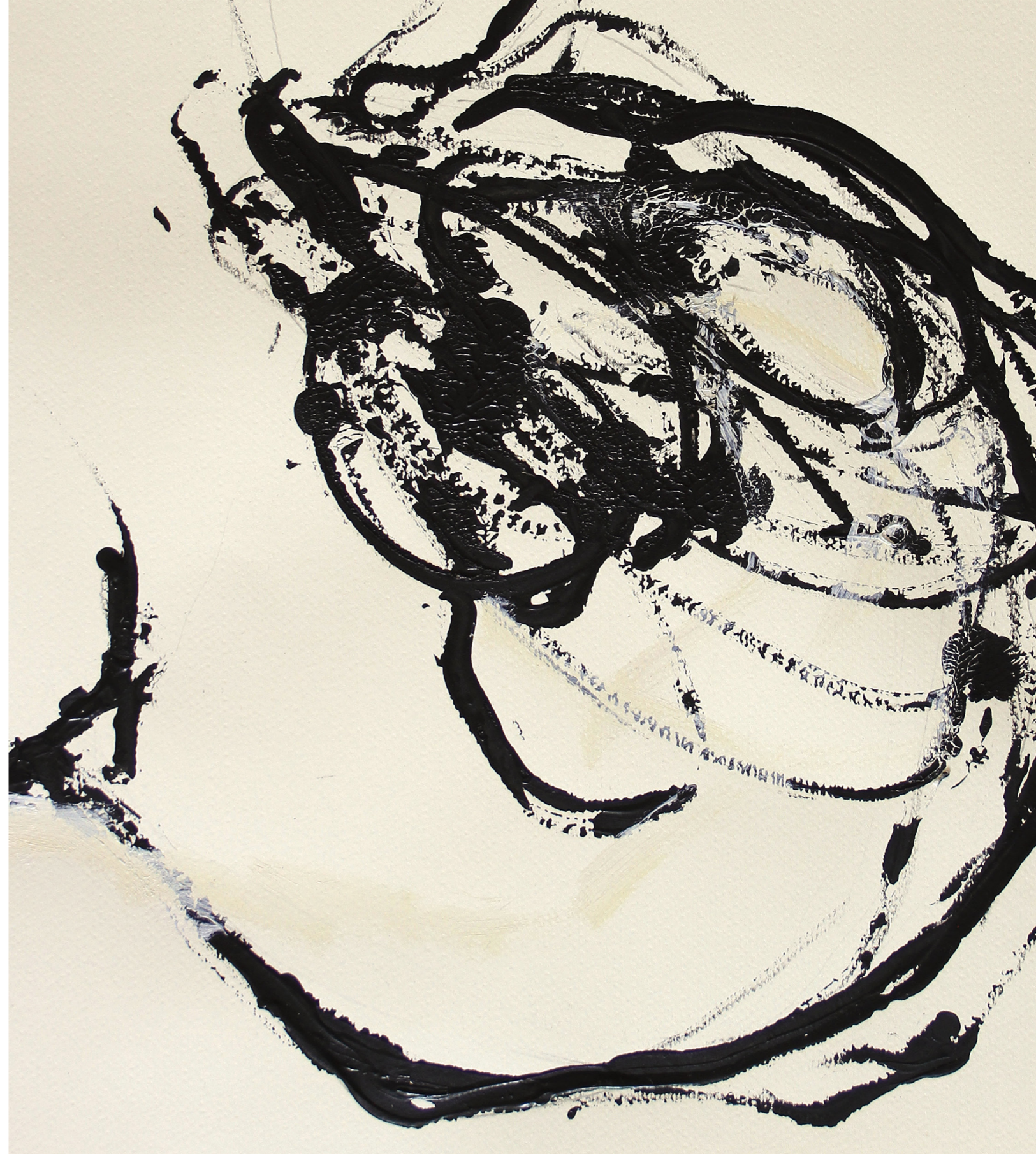
A HÁBORÚ ANATÓMIÁJA (RÉSZLET) 200 x 140 cm | akril papíron | 2018