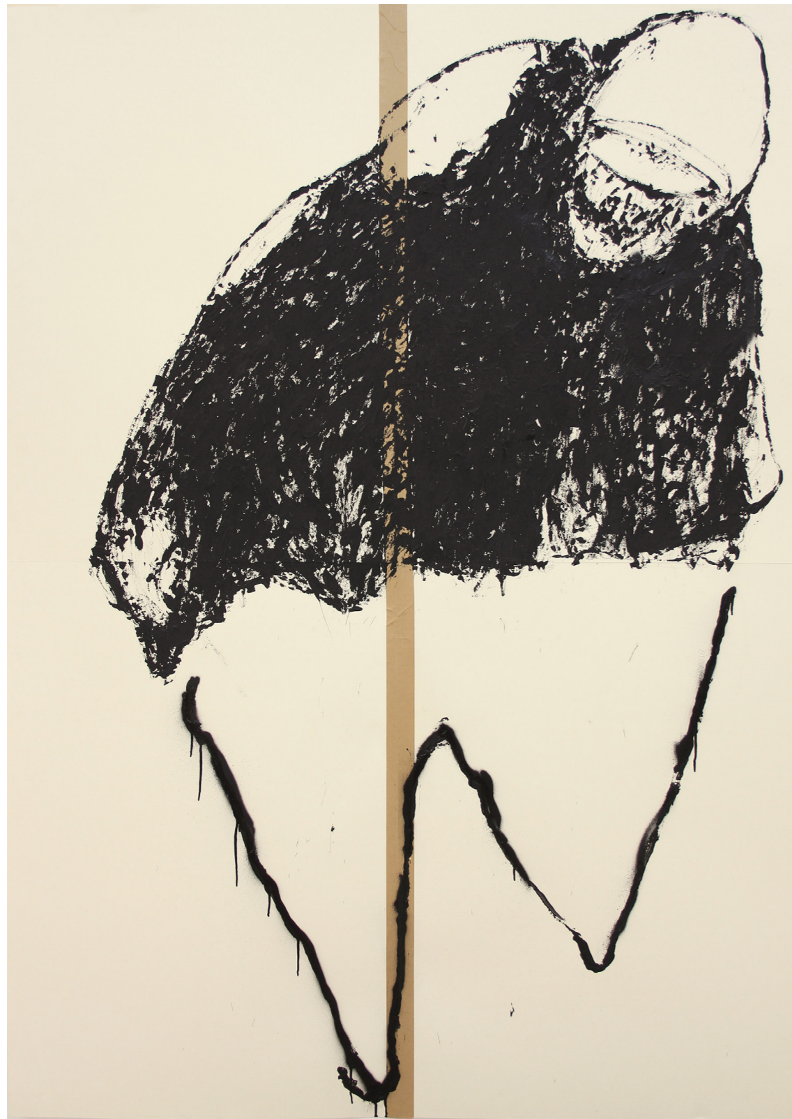
A HÁBORÚ ANATÓMIÁJA 200 x 140 cm | akril papíron | 2018