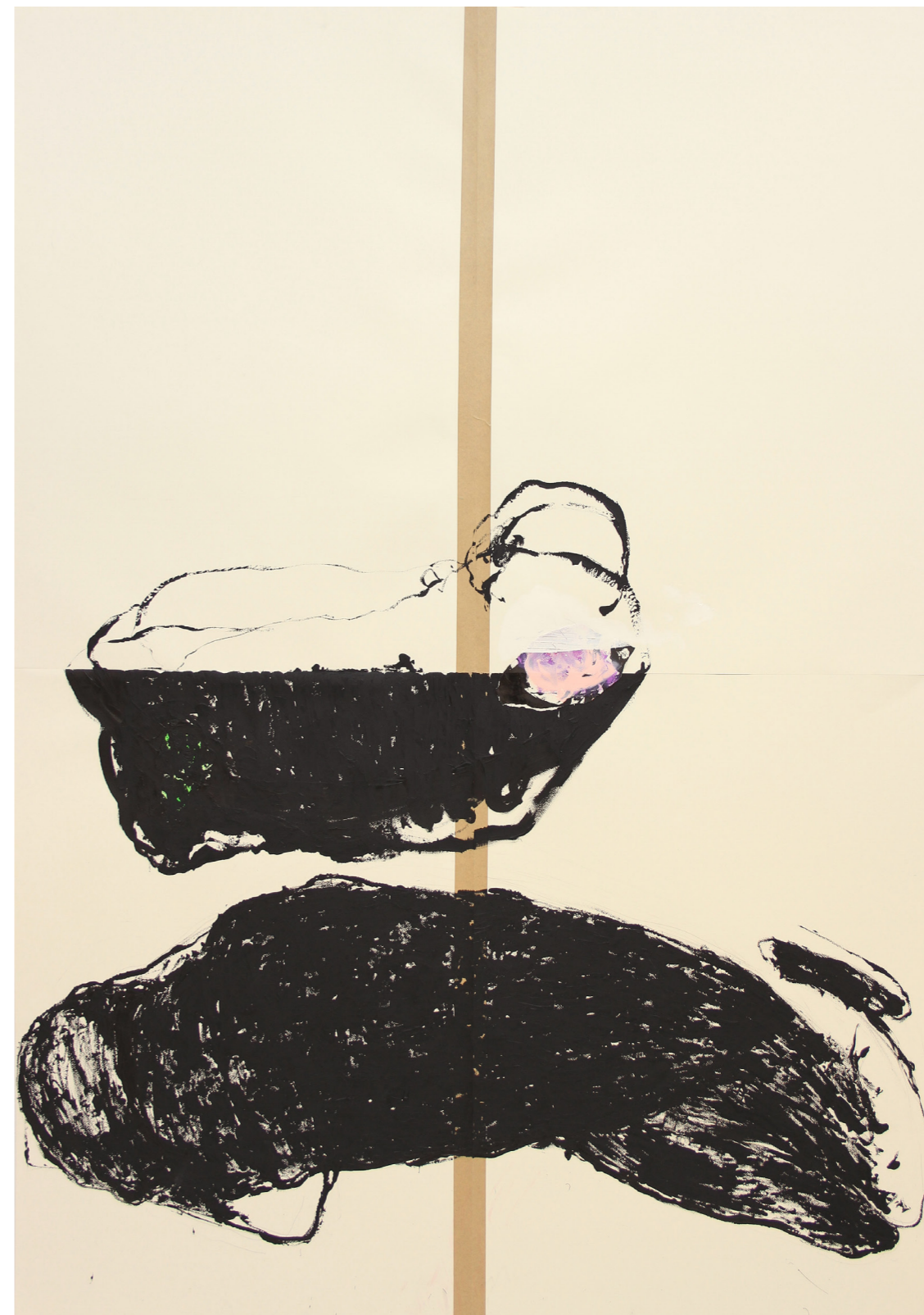
A HÁBORÚ ANATÓMIÁJA 200 x 140 cm | akril papíron | 2018