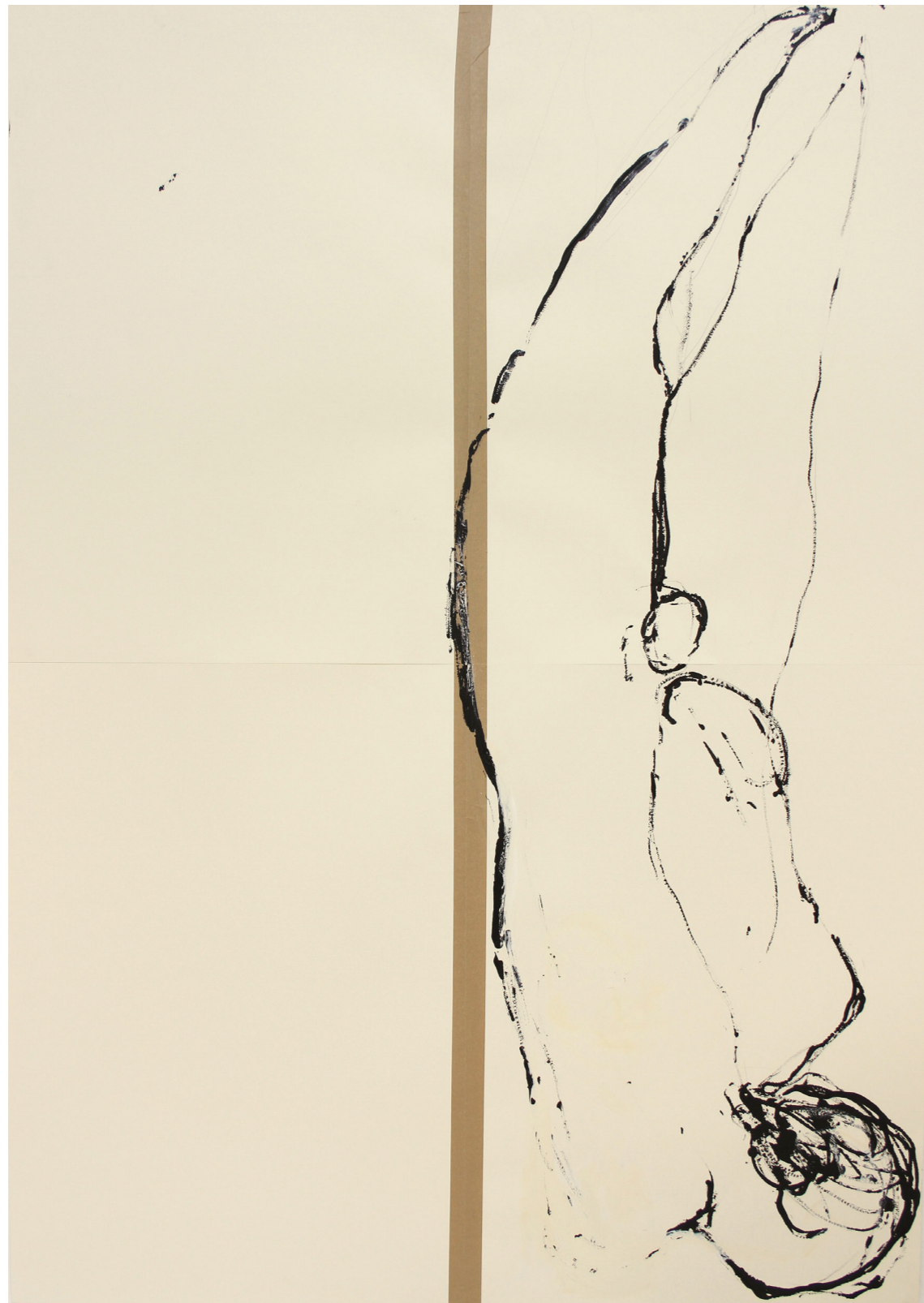
A HÁBORÚ ANATÓMIÁJA 200 x 140 cm | akril papíron | 2018