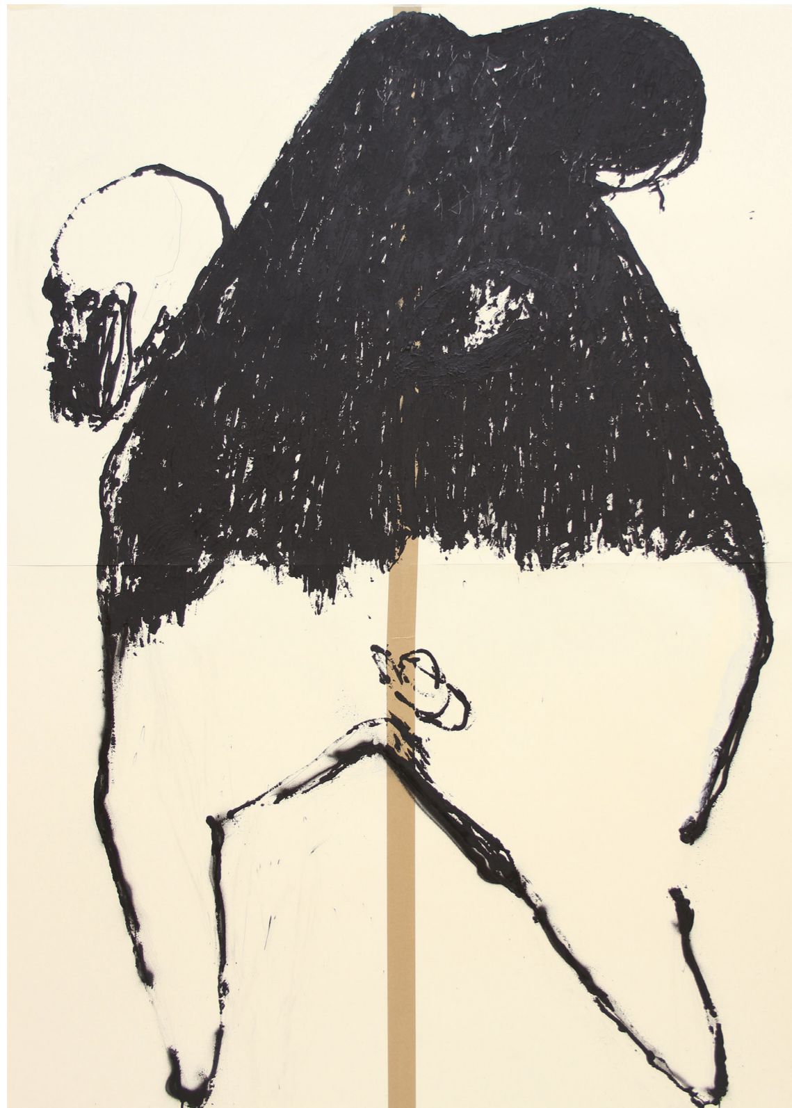
A HÁBORÚ ANATÓMIÁJA 200 x 140 cm | akril papíron | 2018