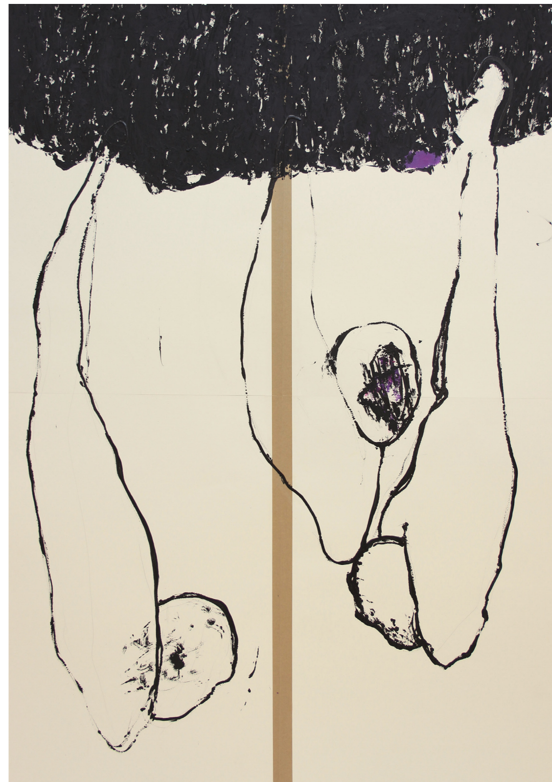
A HÁBORÚ ANATÓMIÁJA 200 x 140 cm | akril papíron | 2018