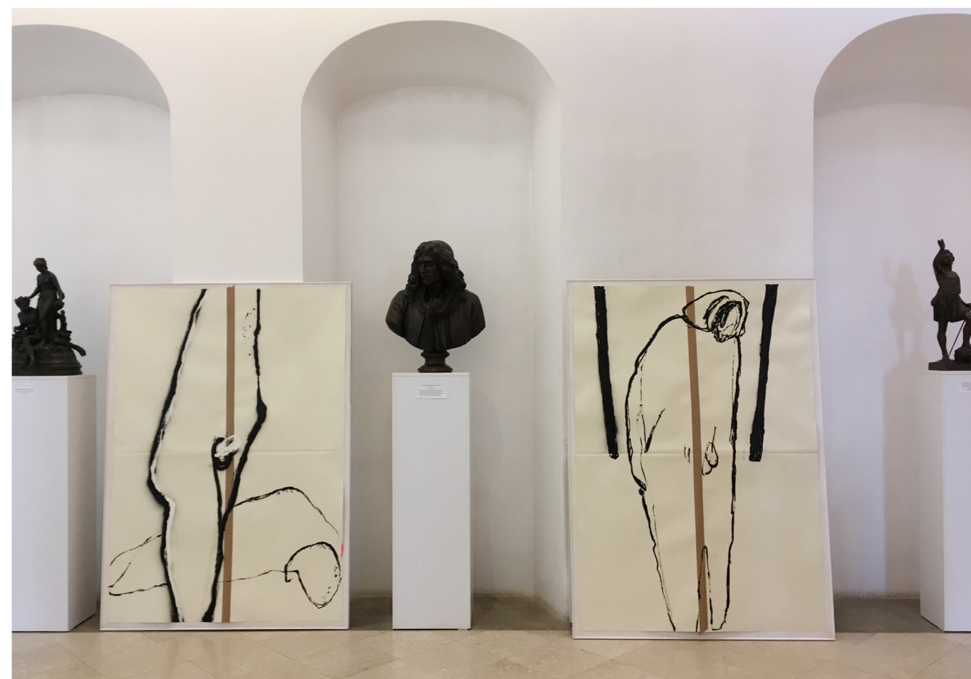
TEMESVARI MÚZEUM 2018. március 22.