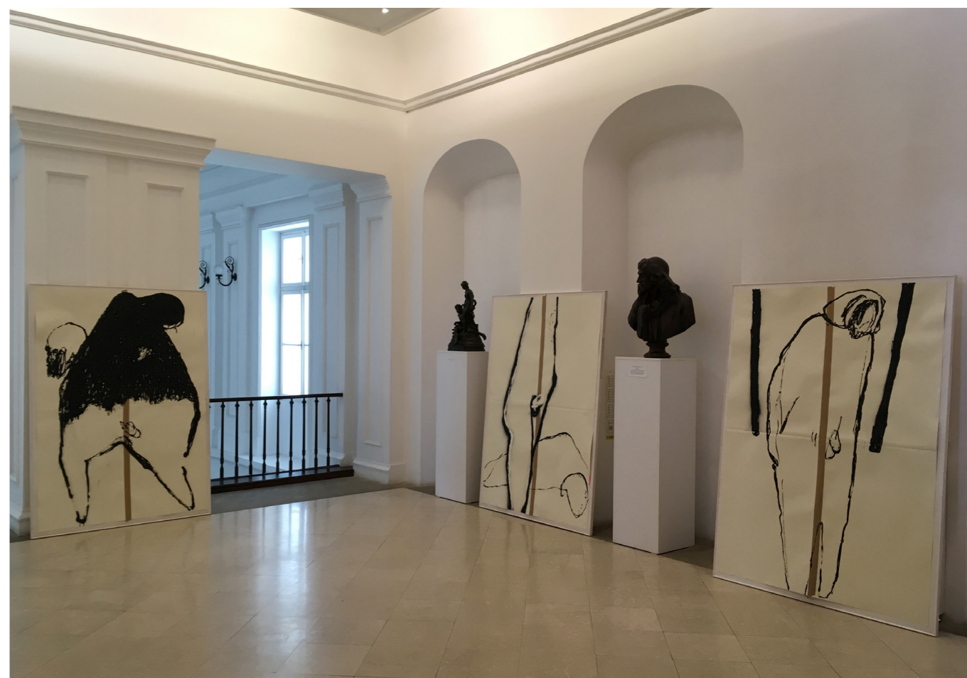
TEMESVARI MÚZEUM 2018. március 22.