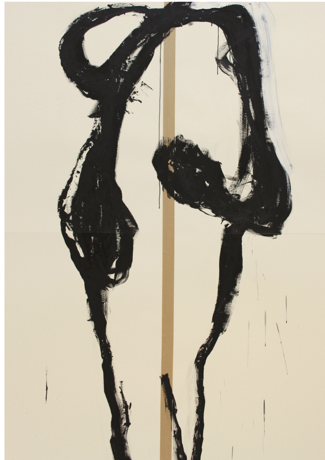
A HÁBORÚ ANATÓMIÁJA 200 x 140 cm | akril papíron | 2018