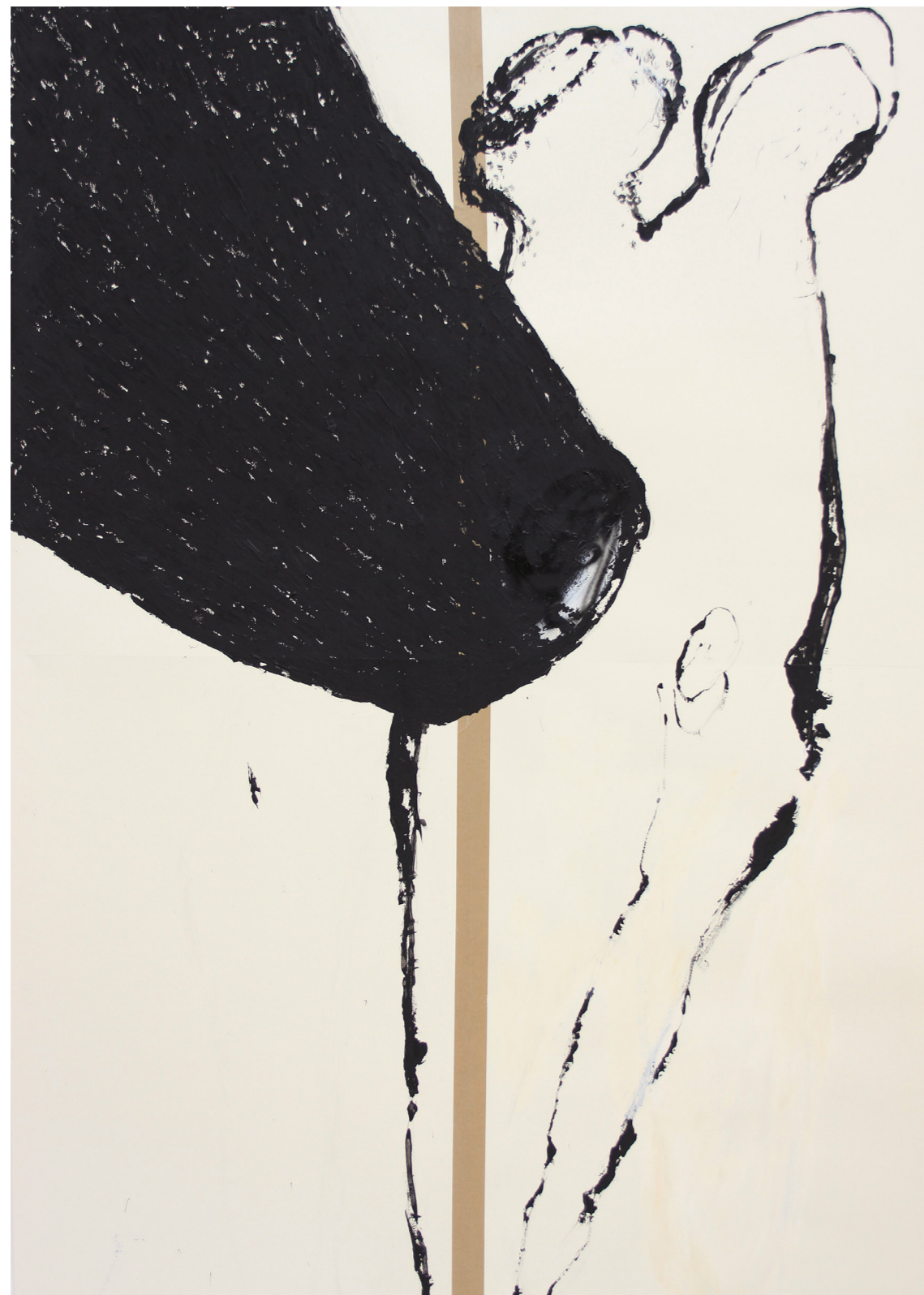
A HÁBORÚ ANATÓMIÁJA 200 x 140 cm | akril papíron | 2018