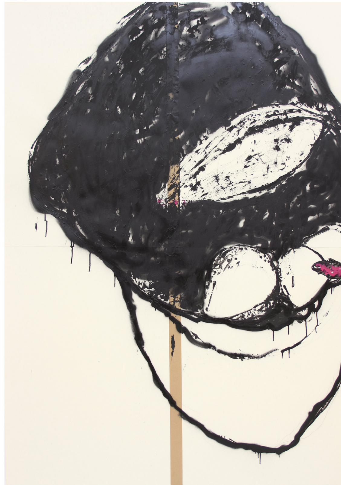
A HÁBORÚ ANATÓMIÁJA 200 x 140 cm | akril papíron | 2018