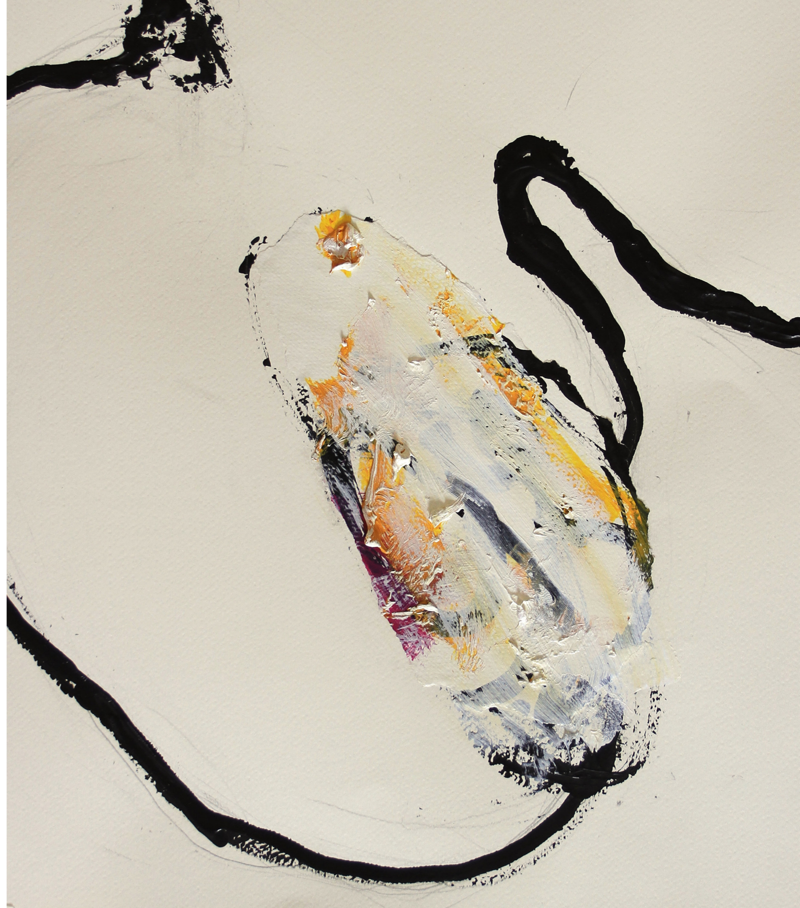
A HÁBORÚ ANATÓMIÁJA (RÉSZLET) 200 x 140 cm | akril papíron | 2018