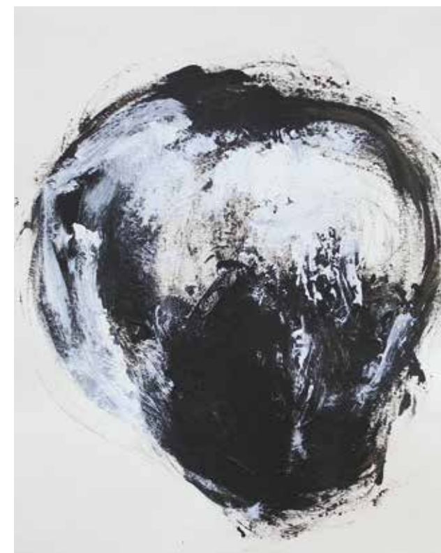
LÉLEKVESZTÉS / LOSS OF SOUL akril papíron / acrylic on paper 25 x 20 cm, 2016

A lélekvesztésből nincs visszafelé kiút. Az egykori meleg fészkek, a múltbeli ember visszasírása csak a sorvadásba, Botond állatfejcsontvázaihoz vezet. Életünkben még nem látjuk, milyen lélekvesztő fog kivinni a lélekvesztés gombolyagaiból. A képeken nekem a kis rózsaszínek, a pici színek hozzák vissza az életet és reményt. Sosincs vissza, mindig előre van.