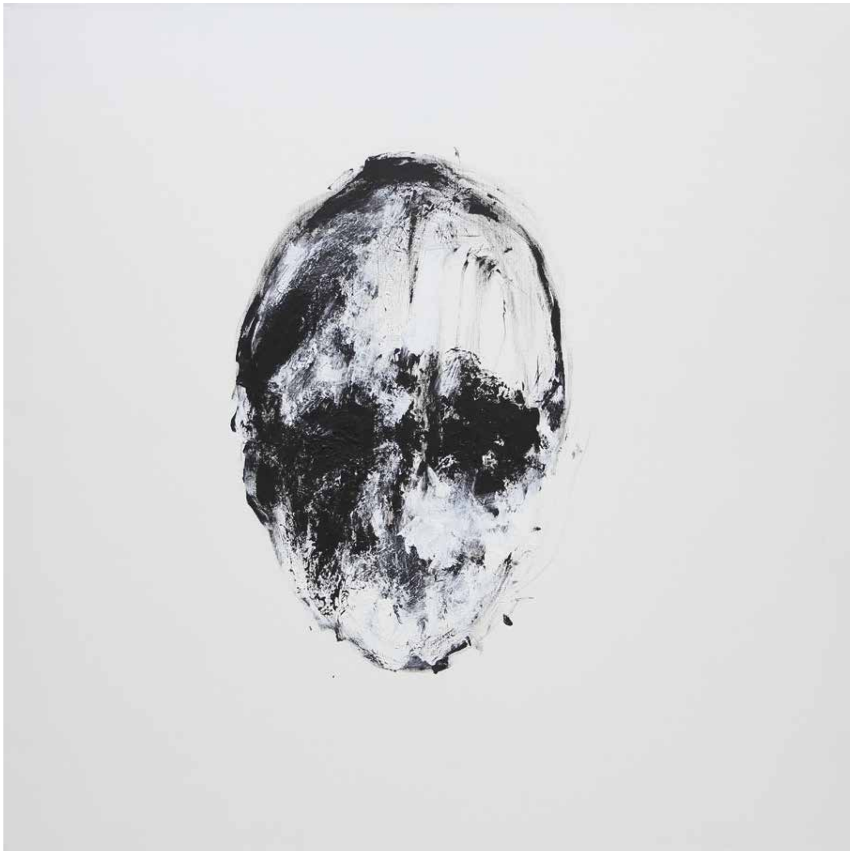
LÉLEKVESZTÉS / LOSS OF SOUL akril vászon / acrylic on canvas 90 x 90 cm, 2015