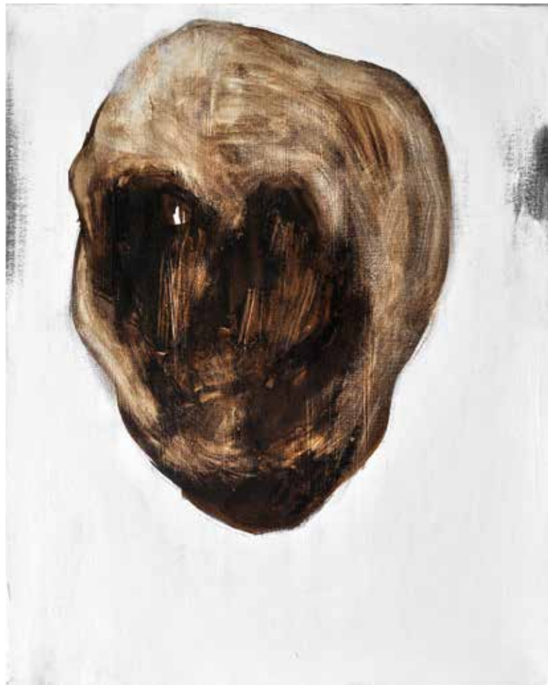
LÉLEKVESZTÉS / LOSS OF SOUL akril vászon / acrylic on canvas 50 x 40 cm, 2015