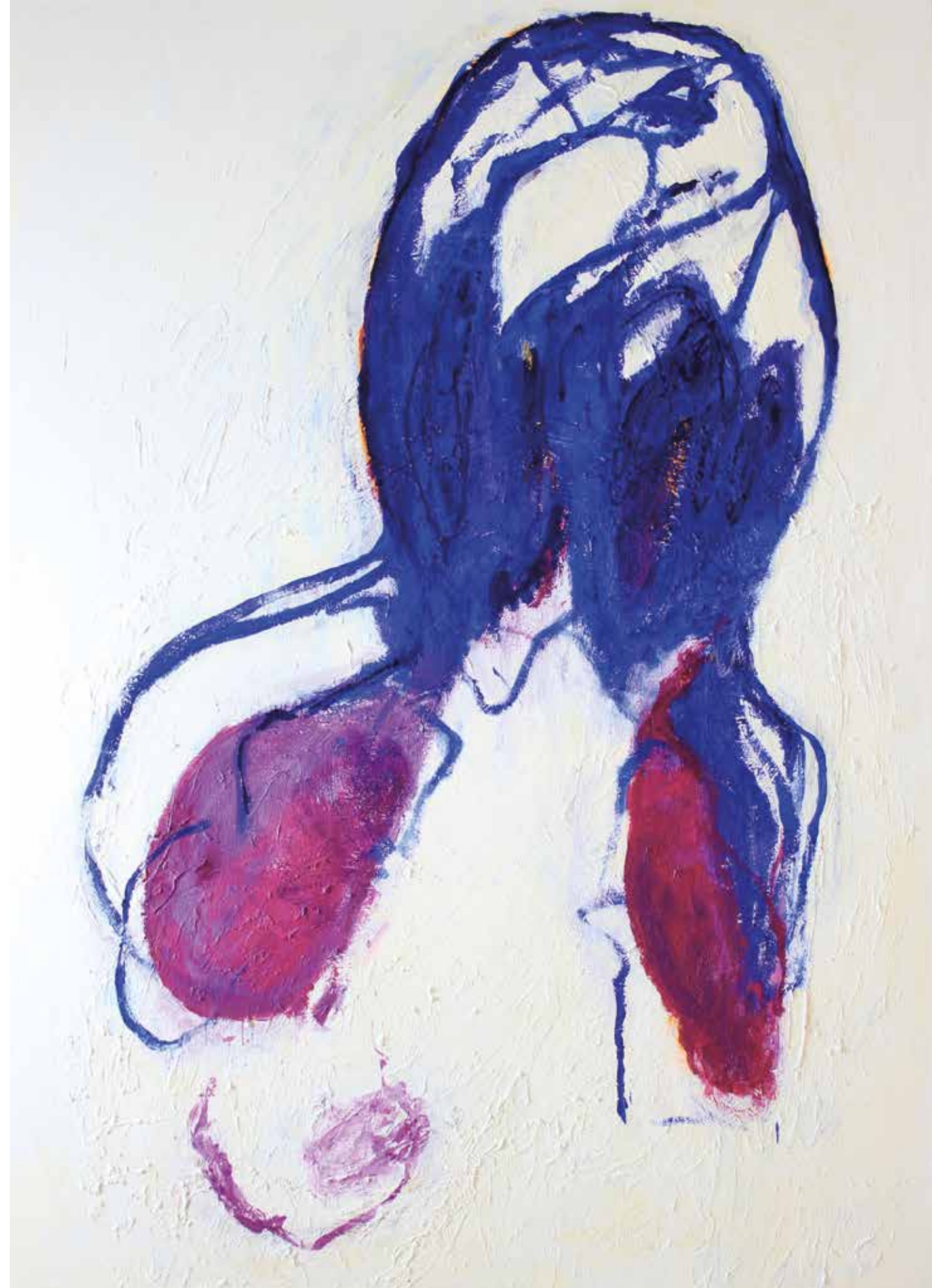
LÉLEKVESZTÉS / LOSS OF SOUL akril vászon / acrylic on canvas 230 x 165 cm, 2016