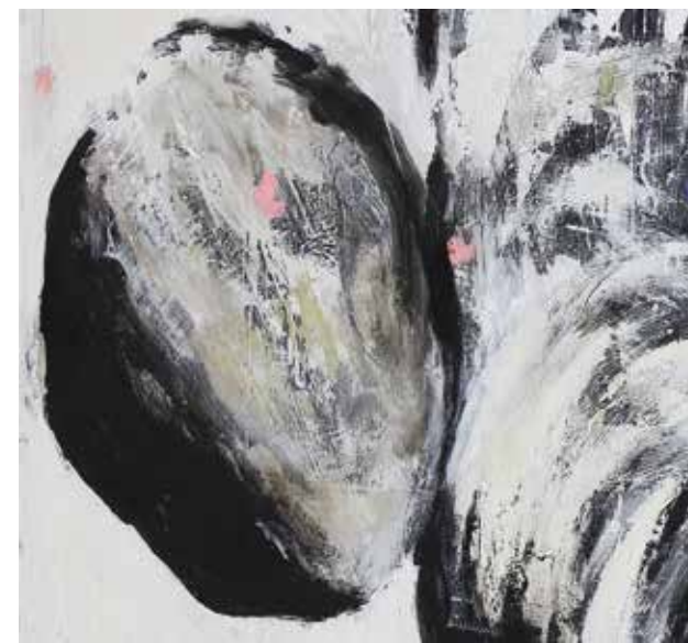
LÉLEKVESZTÉS / LOSS OF SOUL (részlet / detail) akril vászon / acrylic on canvas, 150 x 100 cm, 2016

Nézzük ezt máshonnan! Részegh Botond vászonra, papírra nagyjából kör alakú foltokat fest föl. A felület különféle lazúrok miatt soha nem marad homogén, sőt a rétegek fejlődnek, épülnek a képsíkjaik. Munkája nyomán előderengenek ezek a körök,