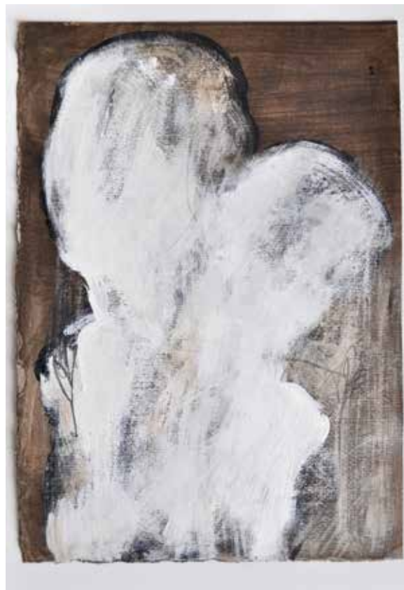
LÉLEKVESZTÉS / LOSS OF SOUL akril vászon / acrylic on canvas 35 x 25 cm, 2015