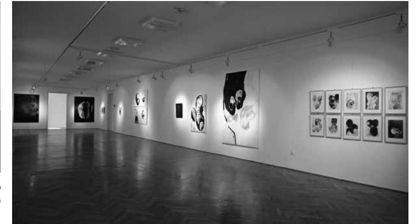
LÉLEKVESZTÉS / LOSS OF SOUL, Aradi Művészeti Múzeum / Museum of Art Arad, 2016