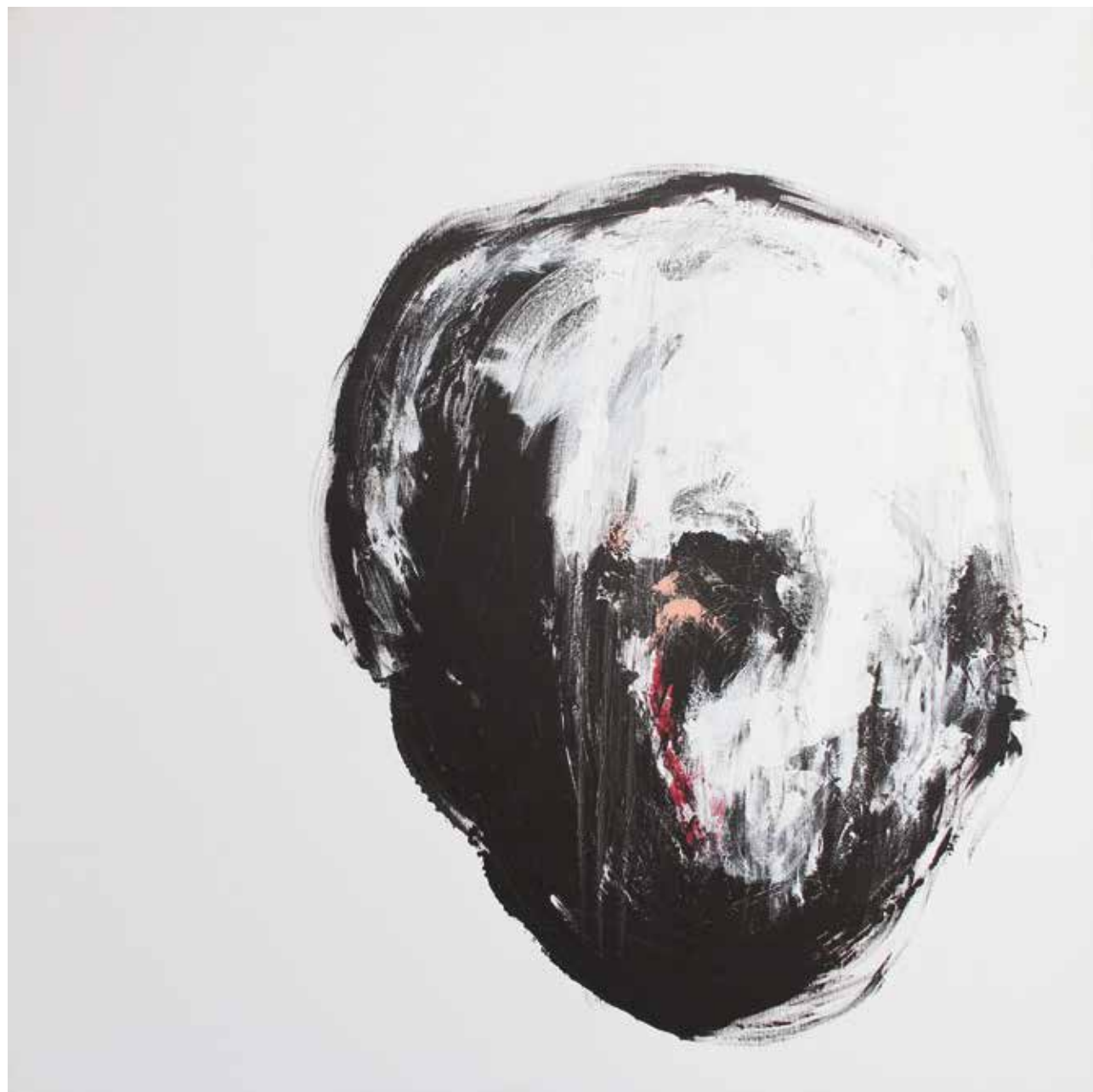
LÉLEKVESZTÉS / LOSS OF SOUL akril vászon / acrylic on canvas 90 x 90 cm, 2015