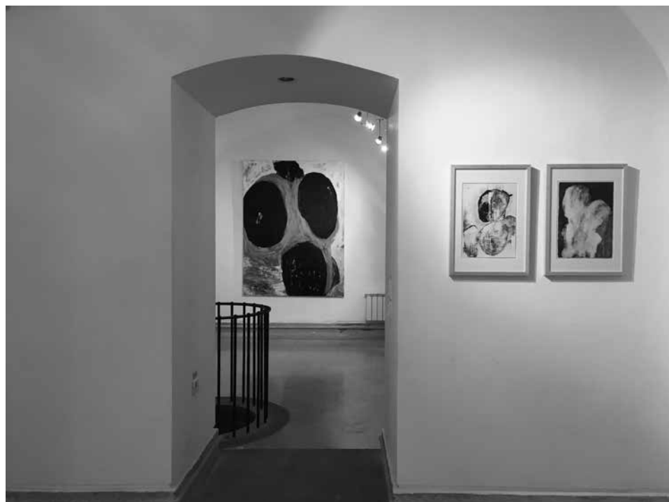
LÉLEKVESZTÉS / LOSS OF SOUL, Temesvári Művészeti Múzeum / Museum of Art Timisoara, 2018