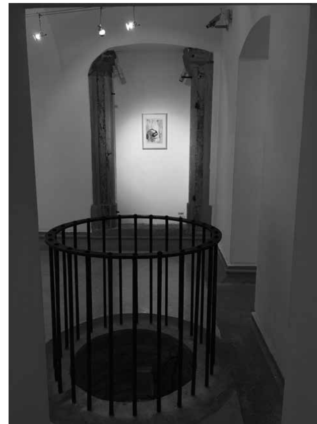
LÉLEKVESZTÉS / LOSS OF SOUL , Temesvári Művészeti Múzeum / Museum of Art Timisoara, 2018