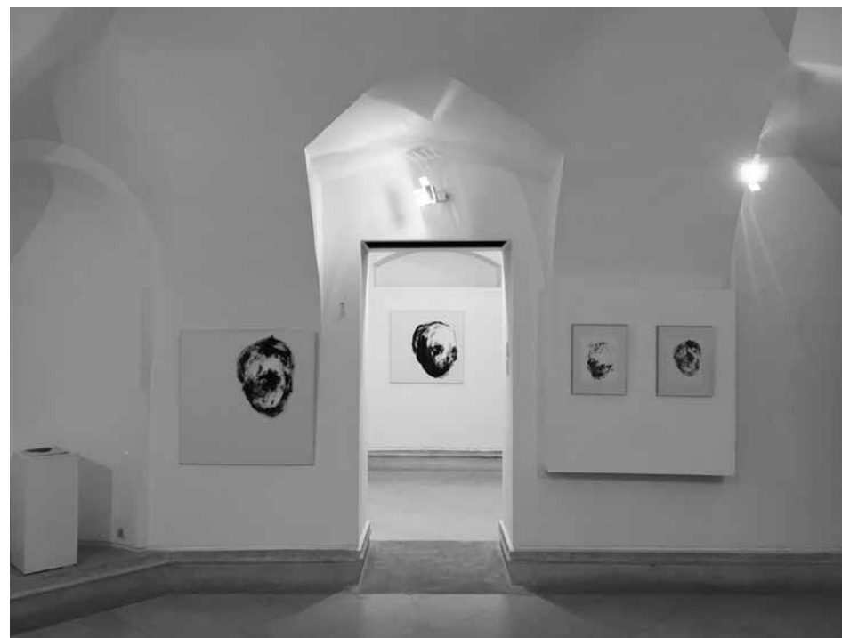
LÉLEKVESZTÉS / LOSS OF SOUL, Temesvári Művészeti Múzeum / Museum of Art Timisoara, 2018

LÉLEKVESZTÉS / LOSS OF SOUL akril, tus, papír / acrylic, ink on canvas 100 x 70 cm, 2015