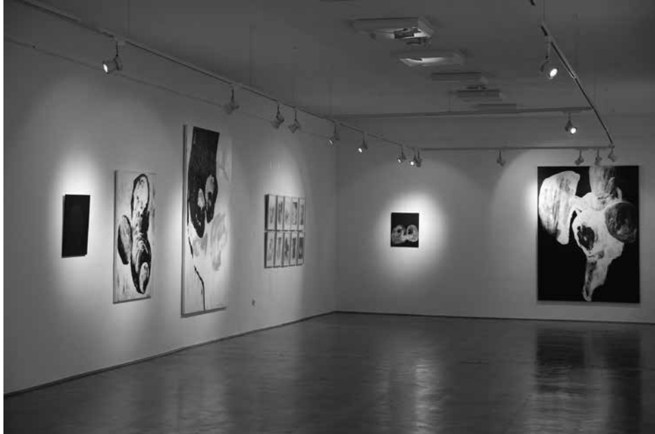
LÉLEKVESZTÉS / LOSS OF SOUL, Aradi Művészeti Múzeum / Museum of Art Arad, 2018

LÉLEKVESZTÉS / LOSS OF SOUL akril vászon / acrylic on canvas 150 x 100 cm, 2015