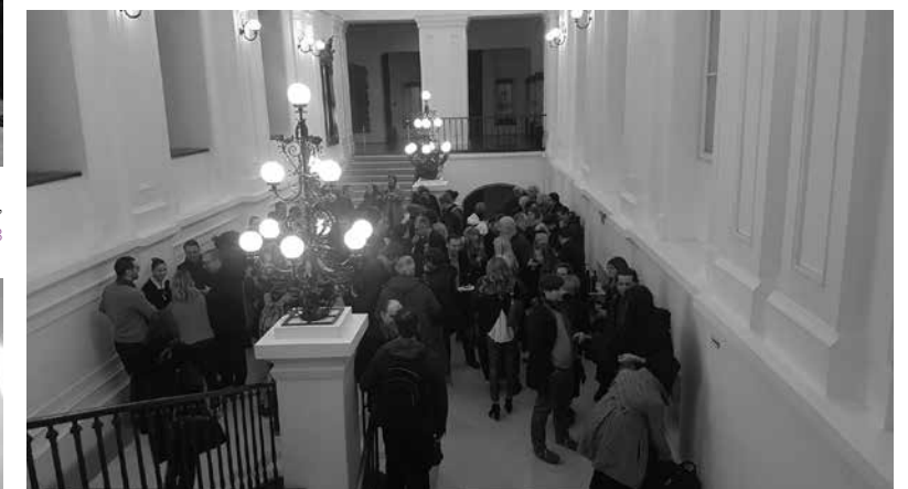
LÉLEKVESZTÉS / LOSS OF SOUL, Temesvári Művészeti Múzeum / Museum of Art Timisoara, 2018