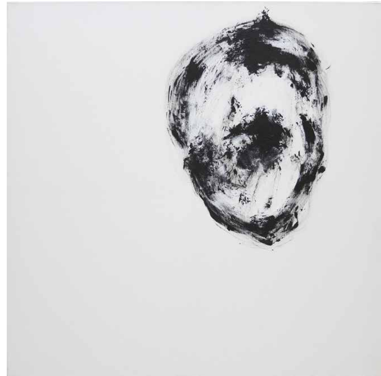
LÉLEKVESZTÉS / LOSS OF SOUL

akril vászon / acrylic on canvas 90 x 90 cm, 2015