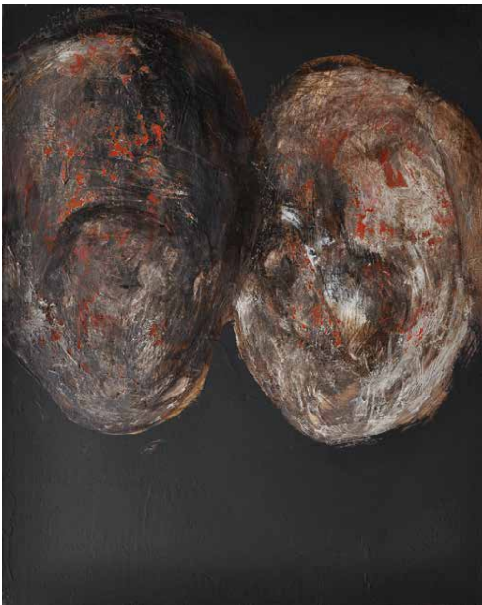
LÉLEKVESZTÉS / LOSS OF SOUL akril vászon / acrylic on canvas 40 x 50 cm, 2015