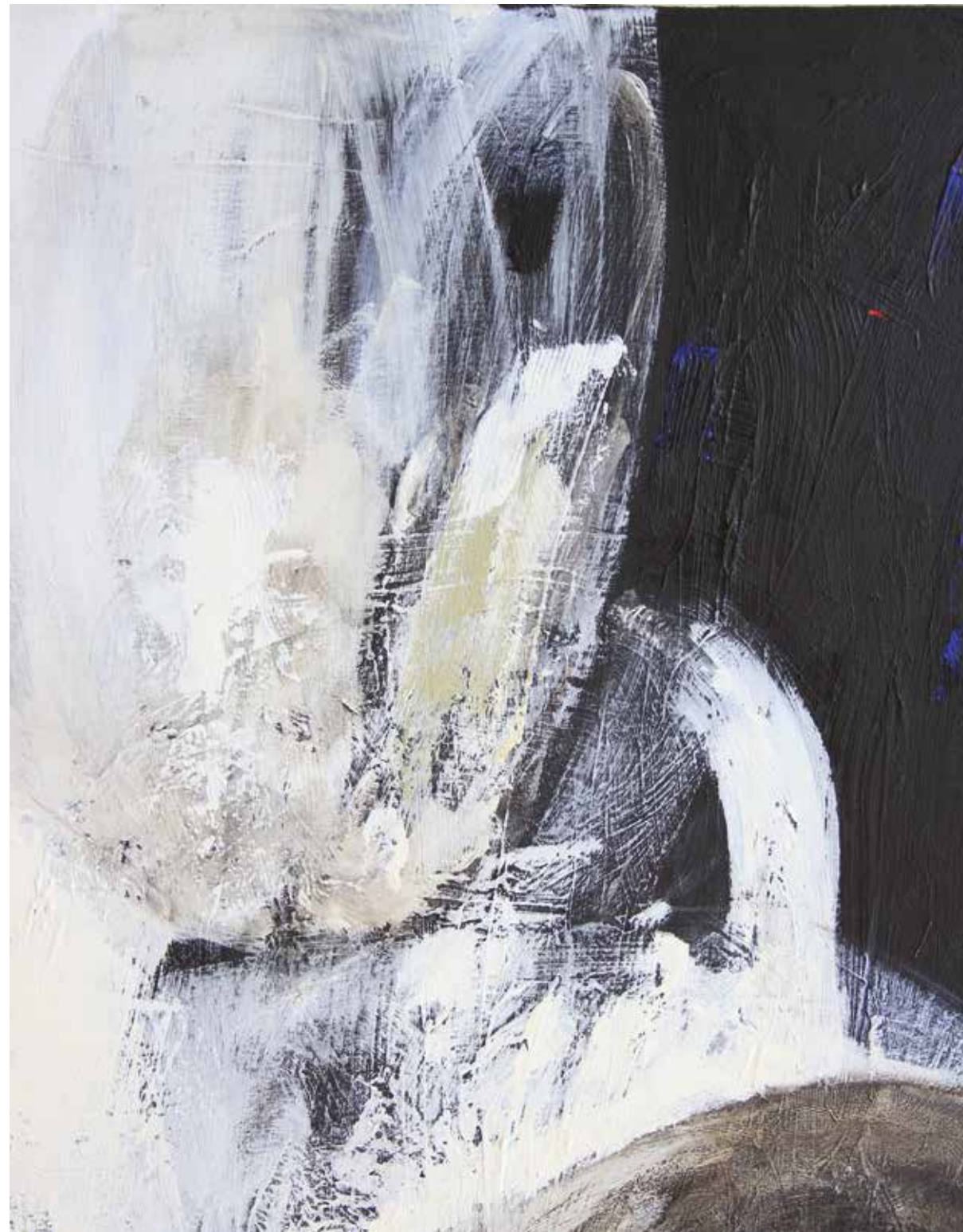
LÉLEKVESZTÉS / LOSS OF SOUL (részlet / detail) akril vászon / acrylic on canvas 230 x 165 cm, 2016