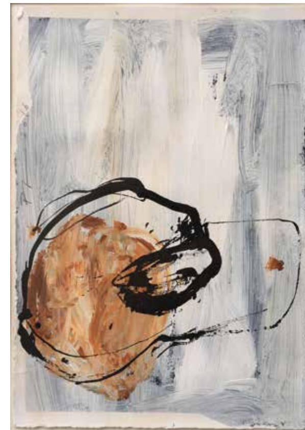
LÉLEKVESZTÉS / LOSS OF SOUL akril vászon / acrylic on canvas 35 x 25 cm, 2015