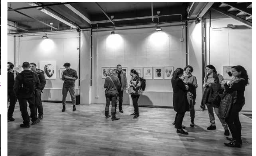
LÉLEKVESZTÉS / LOSS OF SOUL, Atelier 030202, Bukarest / Bucharest