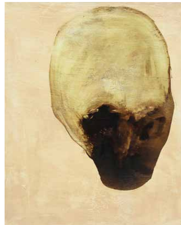
LÉLEKVESZTÉS / LOSS OF SOUL akril vászon / acrylic on canvas 40 x 50 cm, 2015