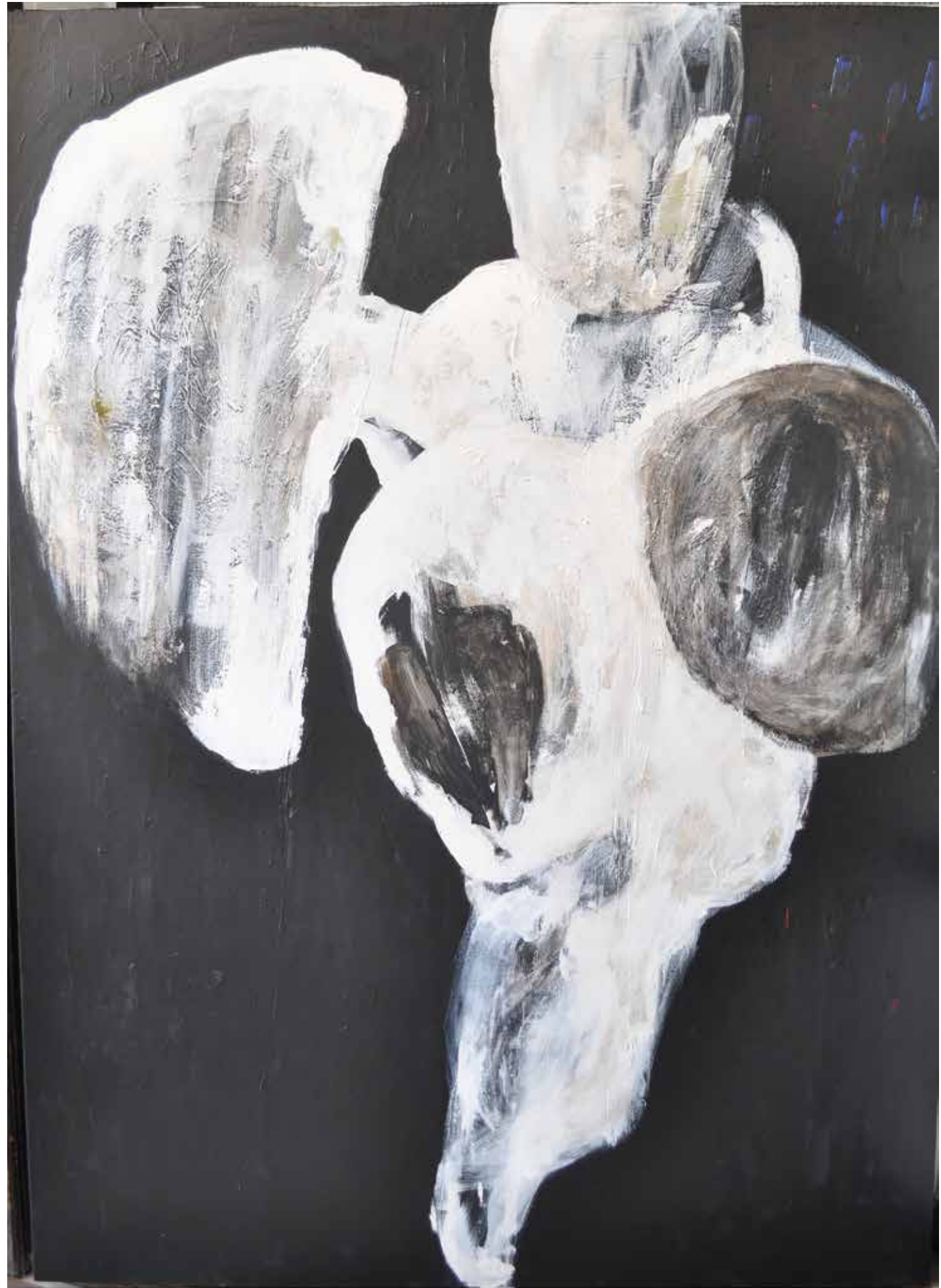
LÉLEKVESZTÉS / LOSS OF SOUL akril vászon / acrylic on canvas 230 x 165 cm, 2016