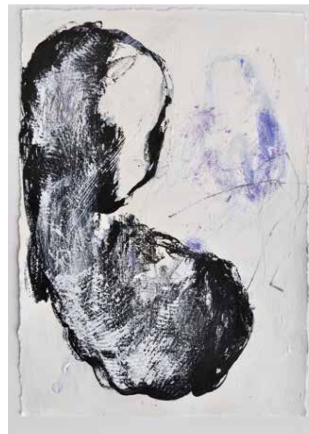
LÉLEKVESZTÉS / LOSS OF SOUL akril vászon / acrylic on canvas 35 x 25 cm, 2015