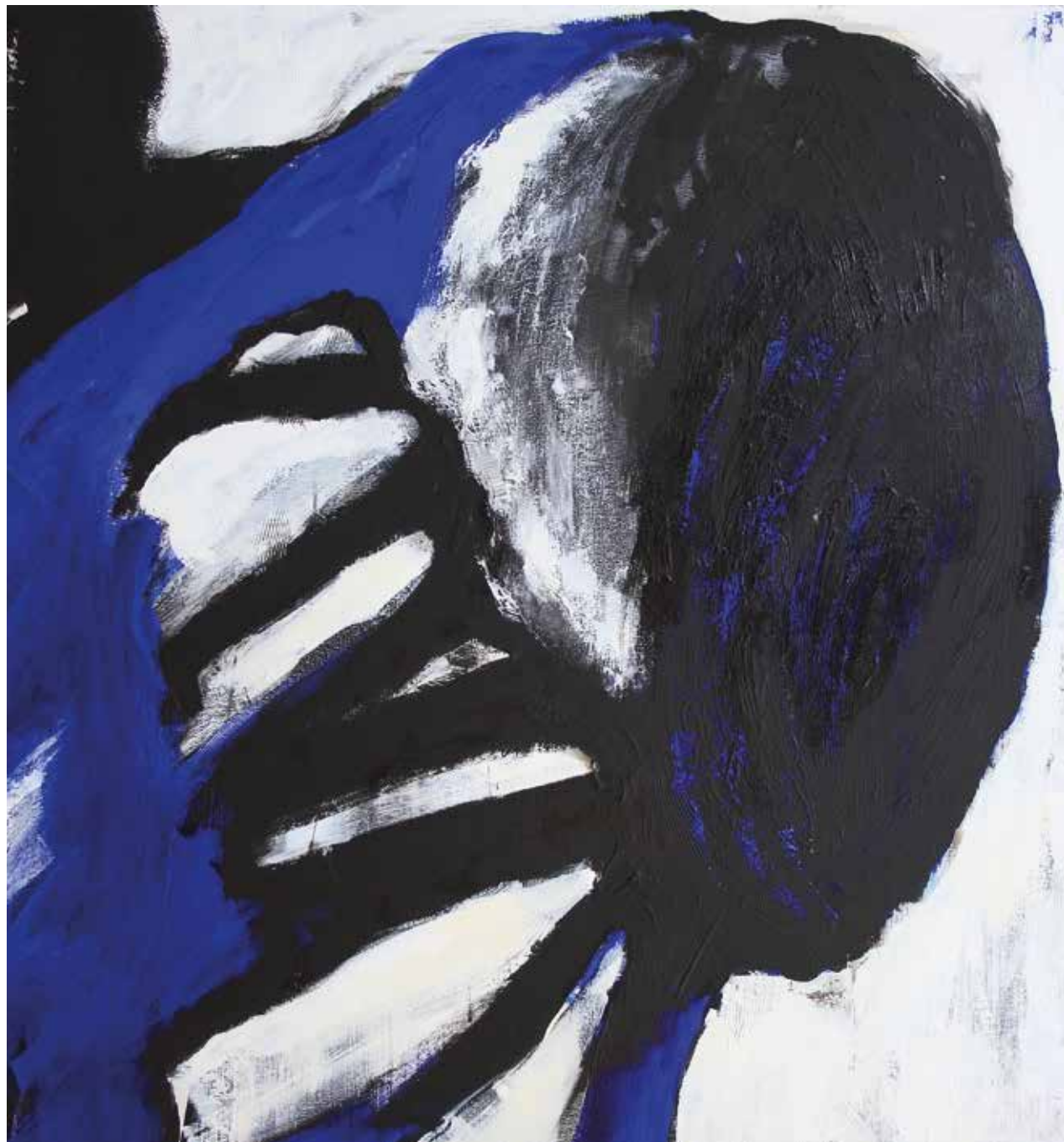
LÉLEKVESZTÉS / LOSS OF SOUL (részlet / detail) akril vászon / acrylic on canvas 230 x 165 cm, 2016