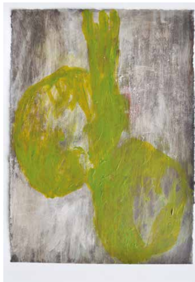
LÉLEKVESZTÉS / LOSS OF SOUL akril vászon / acrylic on canvas 35 x 25 cm, 2015