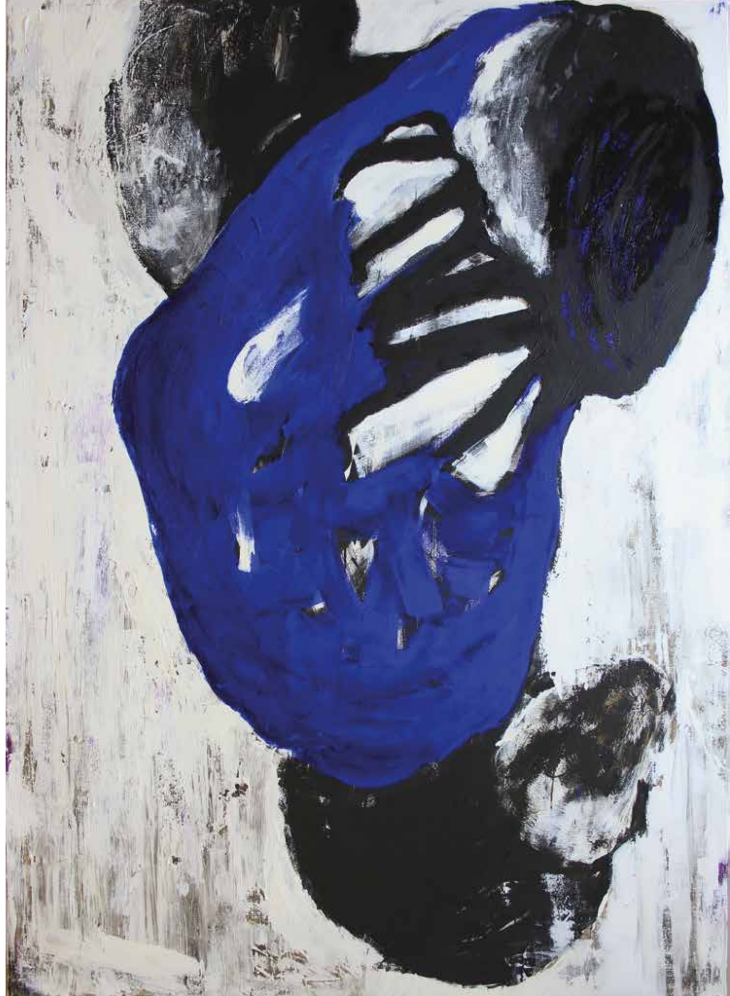
LÉLEKVESZTÉS / LOSS OF SOUL akril vászon / acrylic on canvas 230 x 165 cm, 2016- 2018