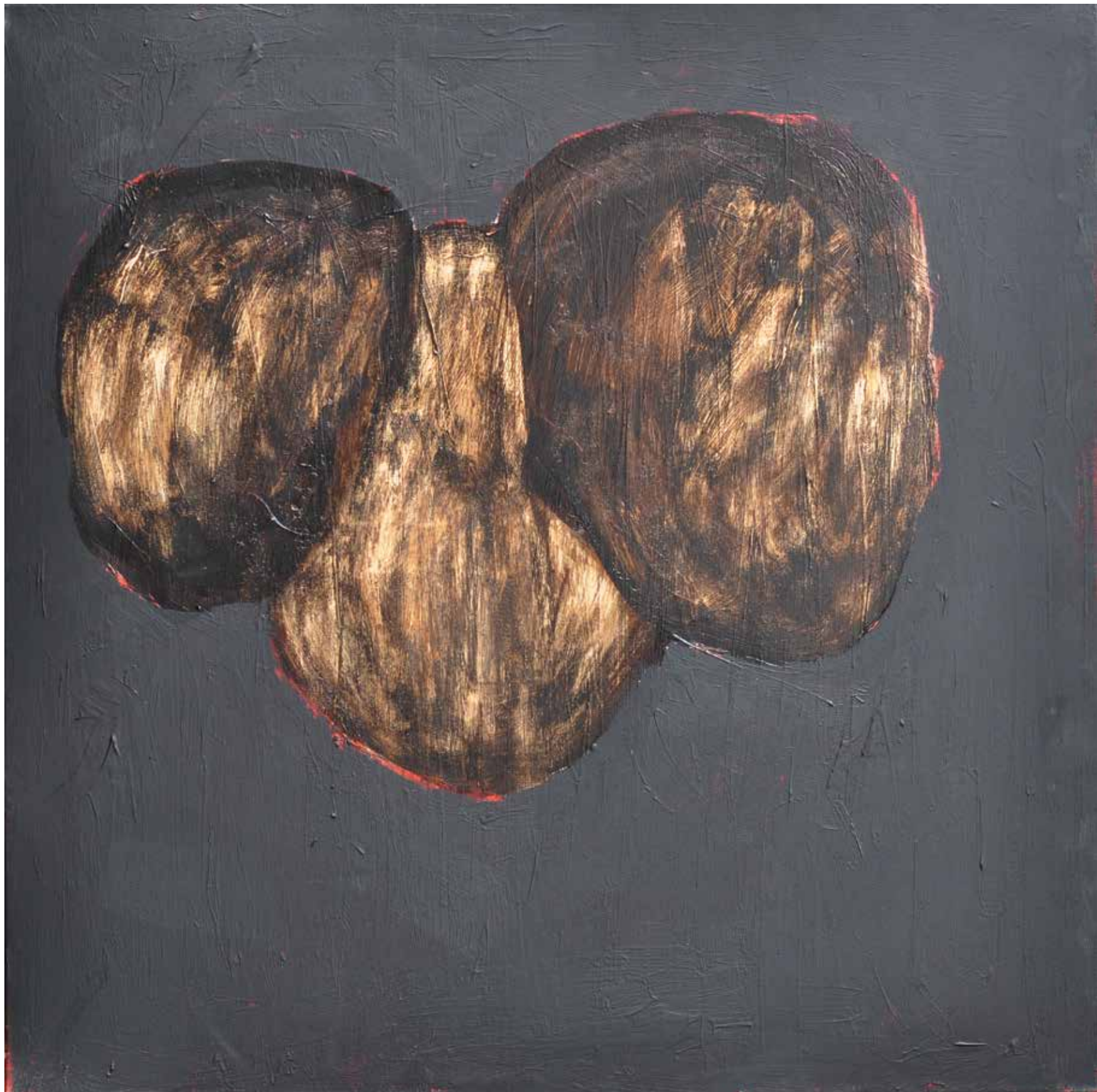
LÉLEKVESZTÉS / LOSS OF SOUL akril vászon / acrylic on canvas 90 x 90 cm, 2015