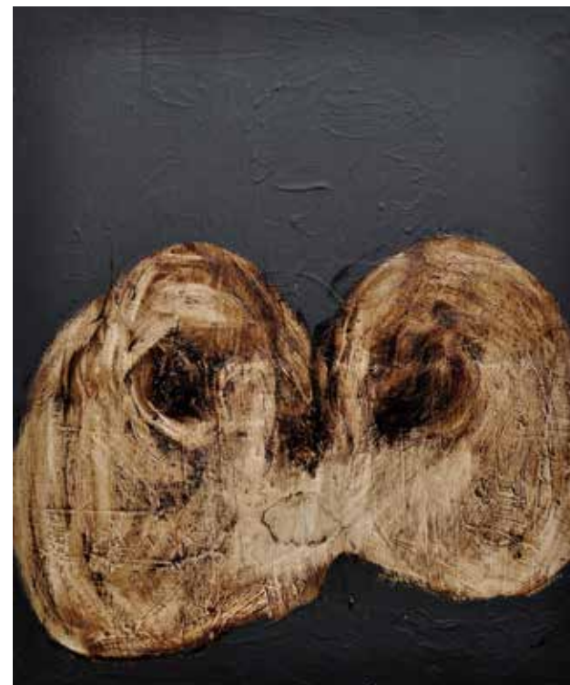
LÉLEKVESZTÉS / LOSS OF SOUL akril vászon / acrylic on canvas 60 x 50 cm, 2015