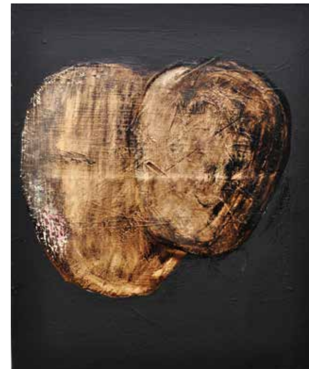
LÉLEKVESZTÉS / LOSS OF SOUL akril vászon / acrylic on canvas 60 x 50 cm, 2015