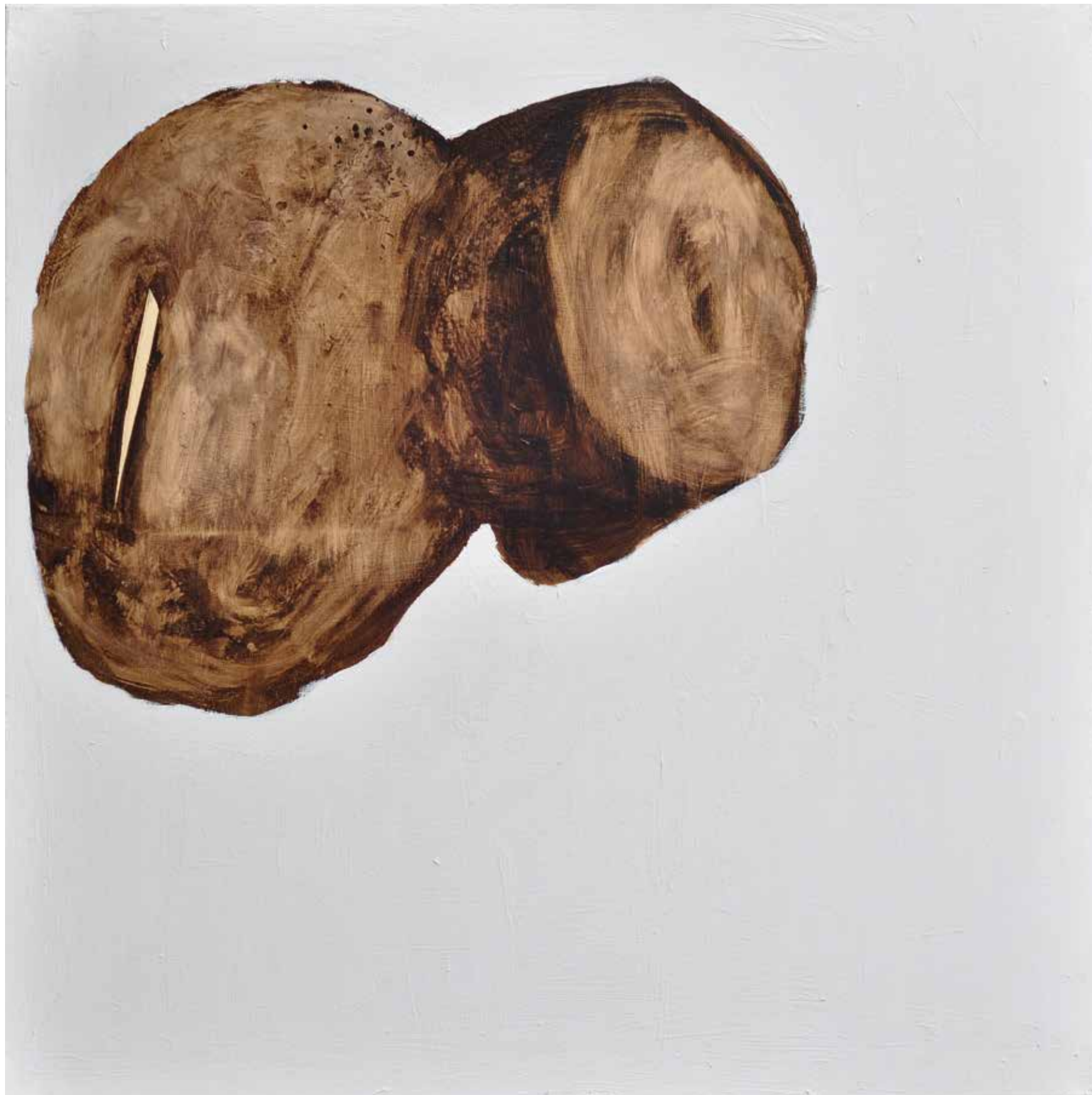
LÉLEKVESZTÉS / LOSS OF SOUL akril vászon / acrylic on canvas 90 x 90 cm, 2015