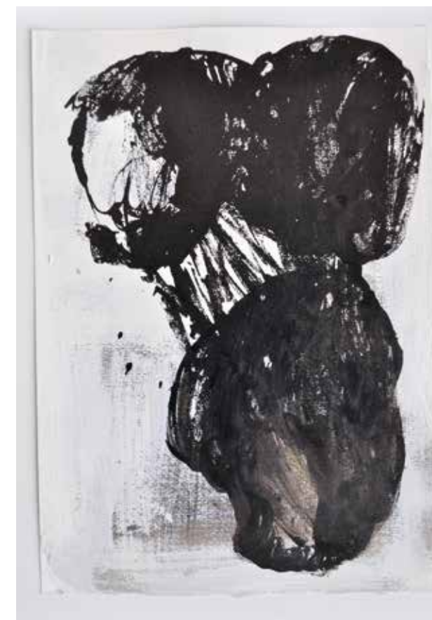
LÉLEKVESZTÉS / LOSS OF SOUL akril vászon / acrylic on canvas 35 x 25 cm, 2015