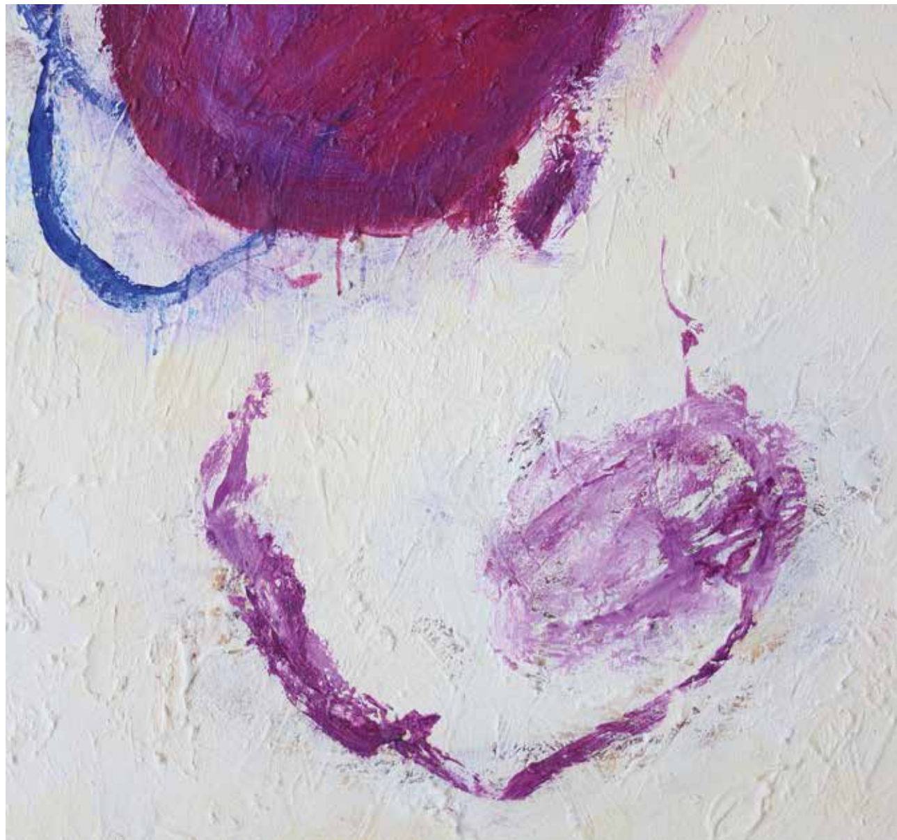
LÉLEKVESZTÉS / LOSS OF SOUL (részlet / detail) akril vászon / acrylic on canvas 230 x 165 cm, 2016