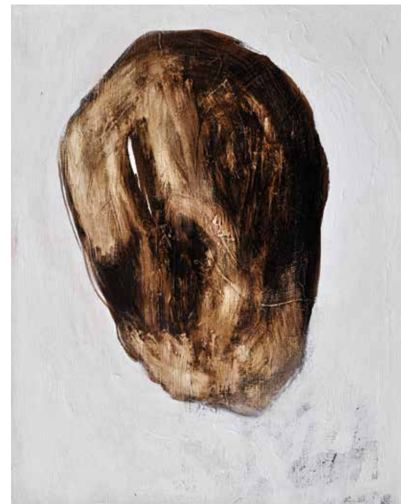
LÉLEKVESZTÉS / LOSS OF SOUL akril vászon / acrylic on canvas 40 x 50 cm, 2015