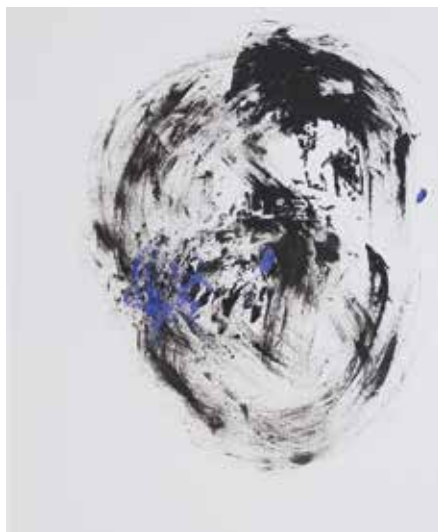
LÉLEKVESZTÉS / LOSS OF SOUL akril papíron / acrylic on paper 25 x 20 cm, 2016