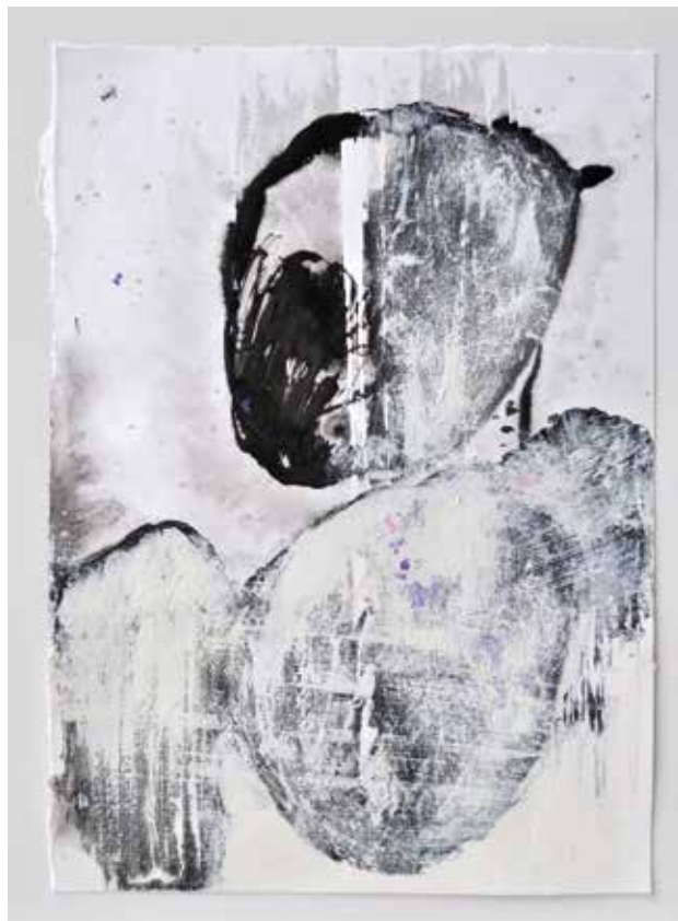
LÉLEKVESZTÉS / LOSS OF SOUL akril vászon / acrylic on canvas 35 x 25 cm, 2015