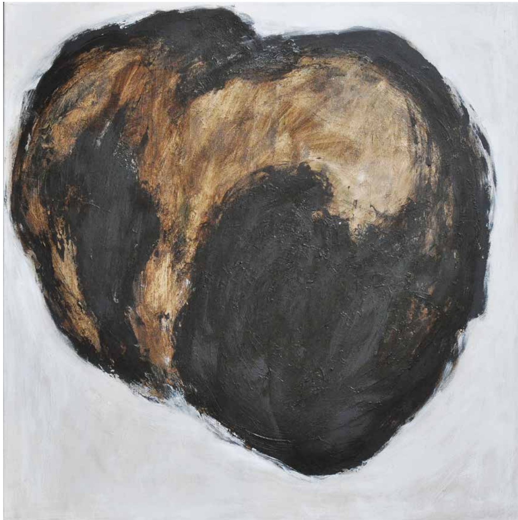
LÉLEKVESZTÉS / LOSS OF SOUL akril vászon / acrylic on canvas 90 x 90 cm, 2015