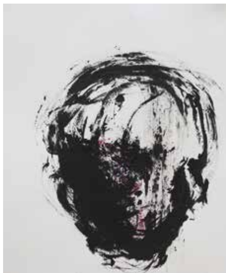
LÉLEKVESZTÉS / LOSS OF SOUL akril papíron / acrylic on paper 25 x 20 cm, 2016

It's so densely interlinked, that it collapses into its own community, while connecting to each of us.