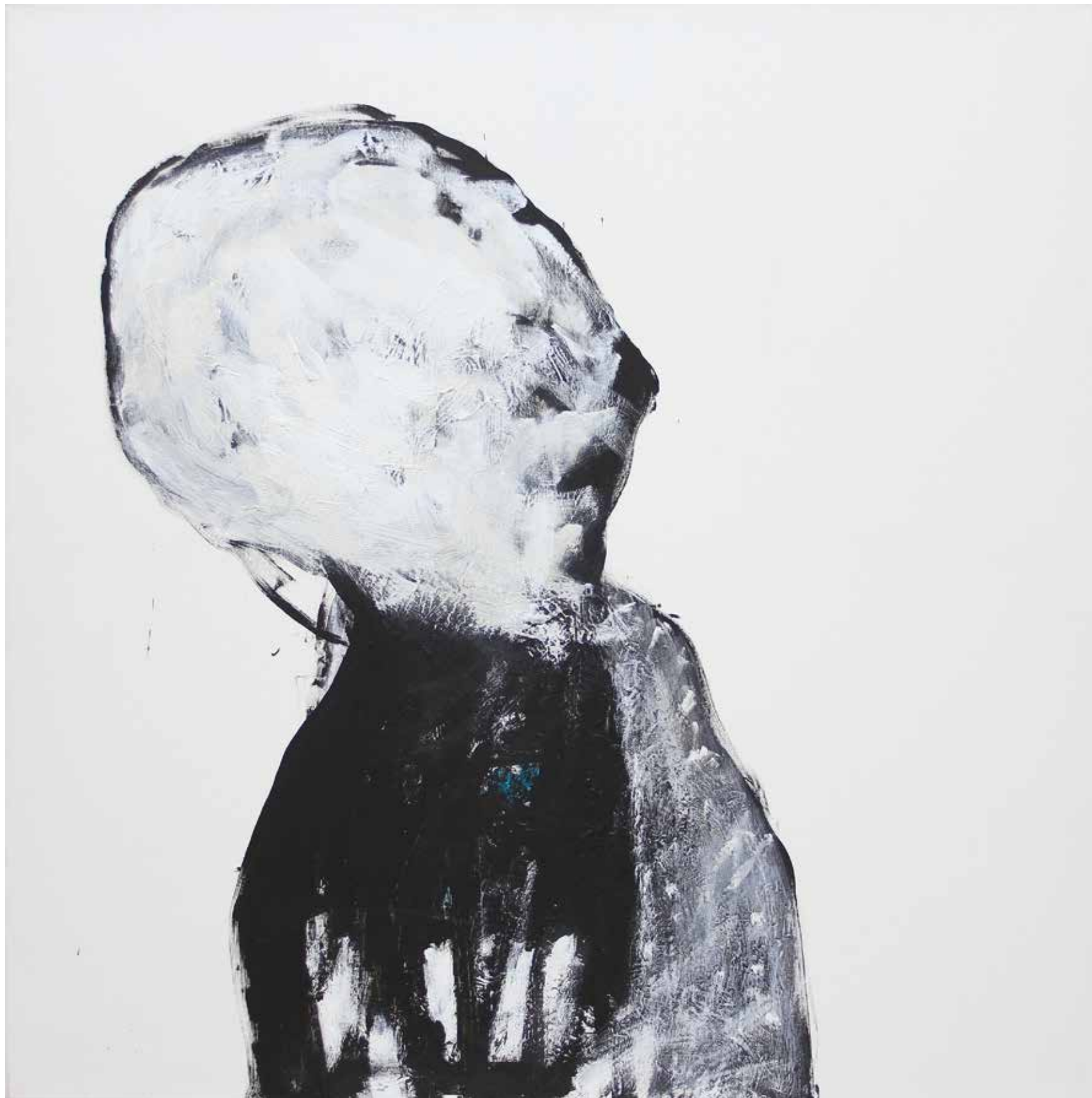
LÉLEKVESZTÉS / LOSS OF SOUL akril vászon / acrylic on canvas 90 x 90 cm, 2015