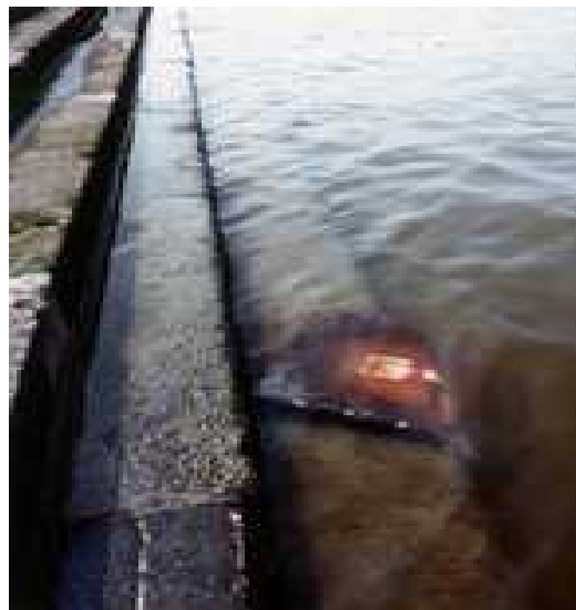
Hordalék 2000 Olaj, vászon, Duna