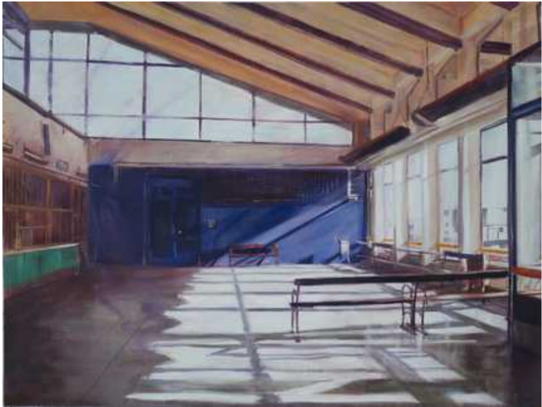
Állomás I. , 150x200cm, olaj, vászon, 2017.