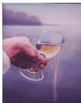
Bor 40x30cm olaj vászon 1998, 1999