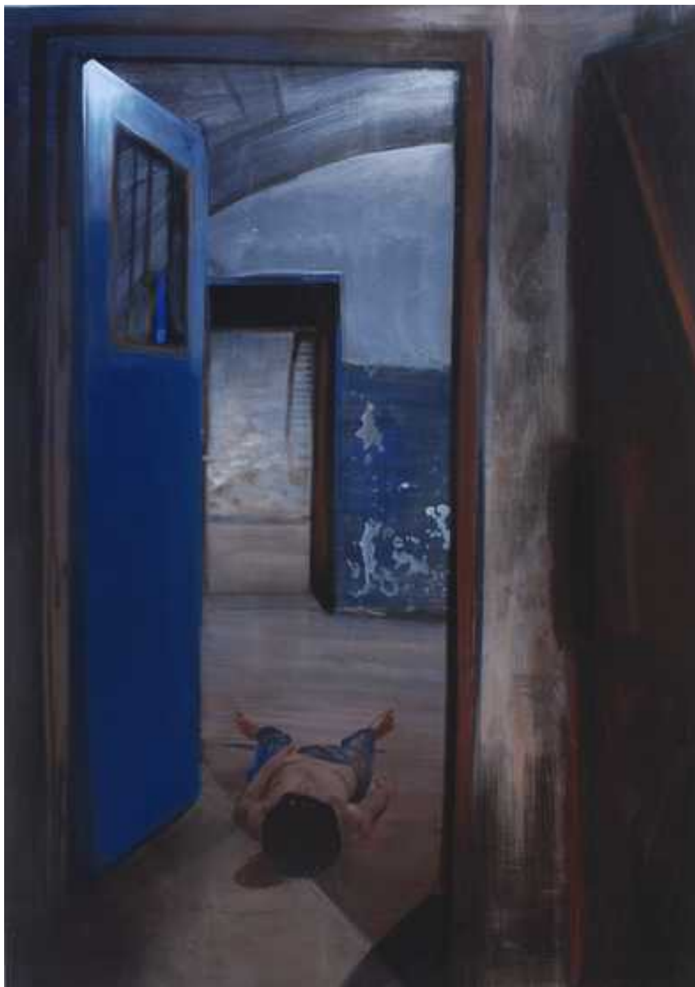
Andrássy 60 , 150x100cm, olaj, vászon, 2012.