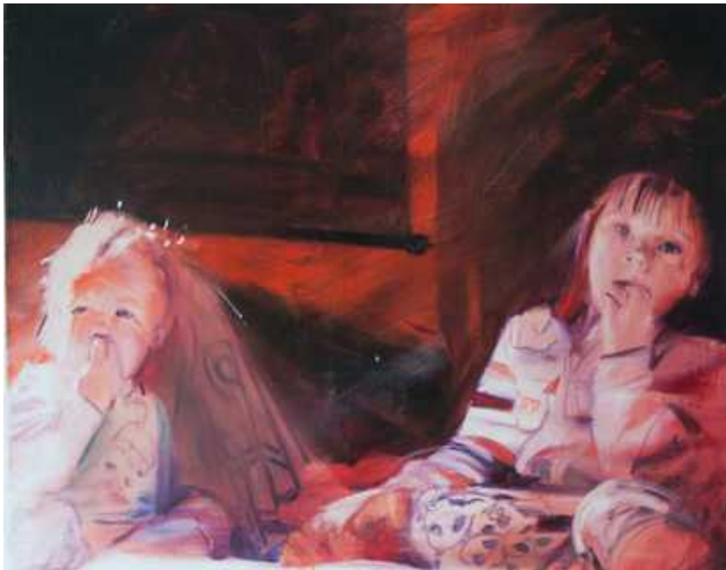
Kicsinyeim II. , 80x100cm, olaj, vászon, 2017.