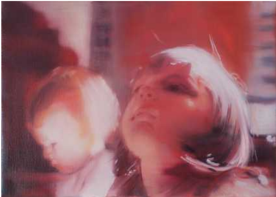
Kicsinyeim , 40x60cm, olaj, vászon, 2017.