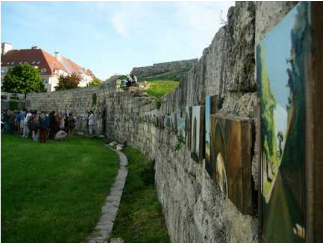
„Róma” Amfiteártum 2004 május 4