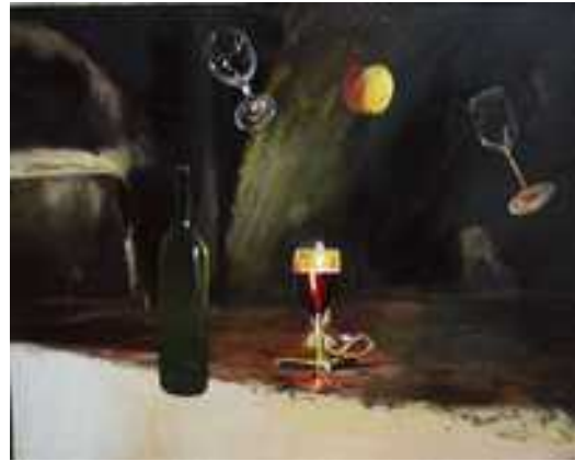
Lebegő tárgyak, 60x80cm, olaj, vászon Lebegő tárgyak 60x80cm, olaj, vászon, 2004