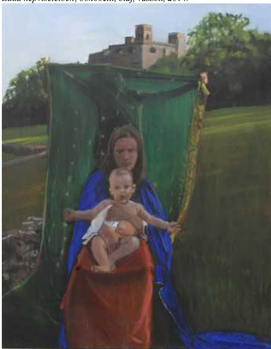
Sárospataki Madonna , 80x60cm, olaj, vászon, 2013.