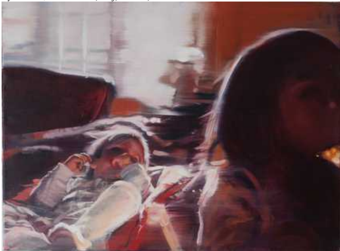
Családom a nappaliban délelőtt , 60x80cm, olaj, vászon, 2017.

Az alábbiaban a zarándokutaimból mutatok be a hely szűke miatt csak 2 festményt, valamint az egyházi megrendelésben készült 8 méter széles oltárkép reprodukcióját lehet látni.