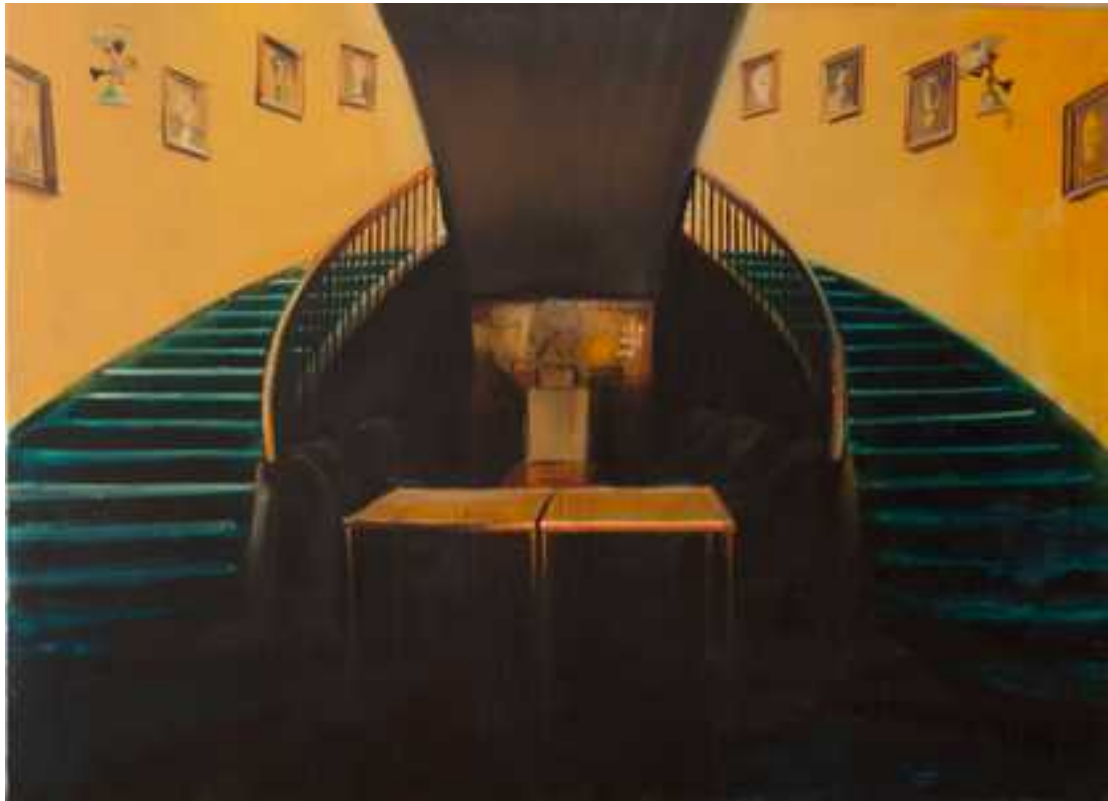
Fészek klub , 150x200cm, olaj, vászon, 2015.