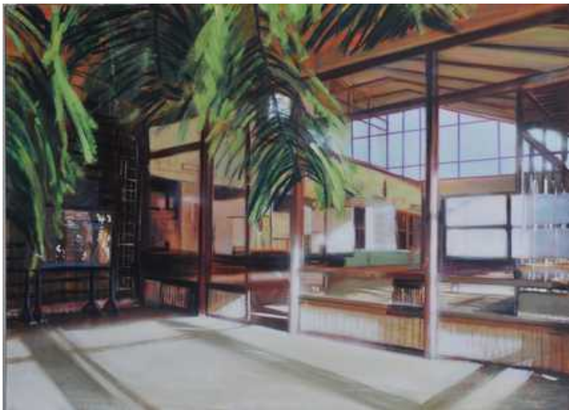
Állomás III. , 110x140cm, olaj, vászon, 2017.