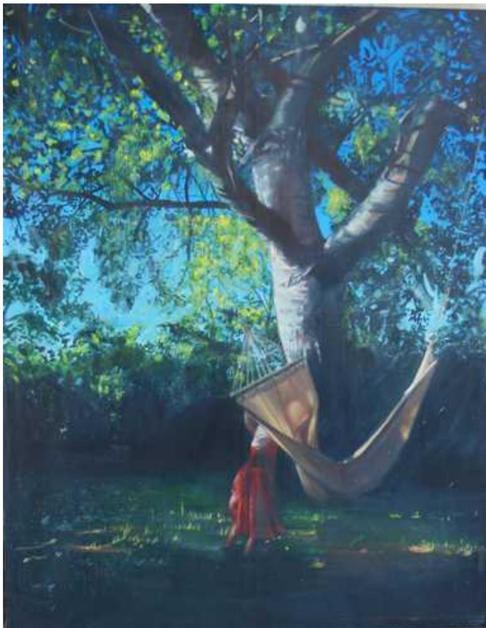
Hintaágy Szolnokon, 200x150 cm, olaj, vászon, 2008