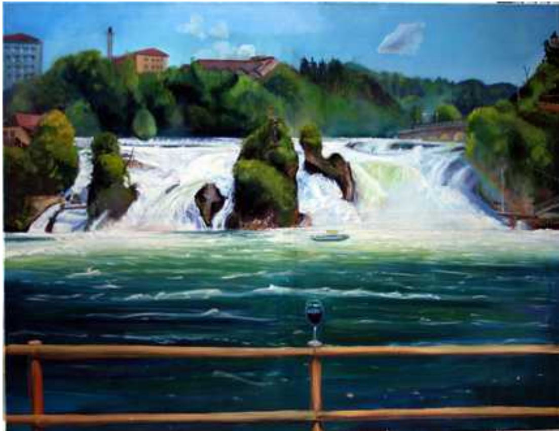
Schaffhauseni vízesés, 140x180cm, olaj, vászon, 2009.

2009 ben Szolnoki művésztelepre költöztünk 2 évre, és ebben az időszakban a figura és a táj kapcsolatával foglalkoztam. Eredetileg a Nagybányai festőiskola alapfelvetése is ez volt.