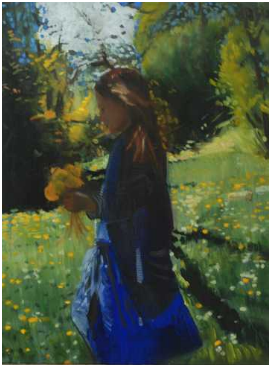
Gellért hegy, 80x60cm, olaj, vászon, 2012.