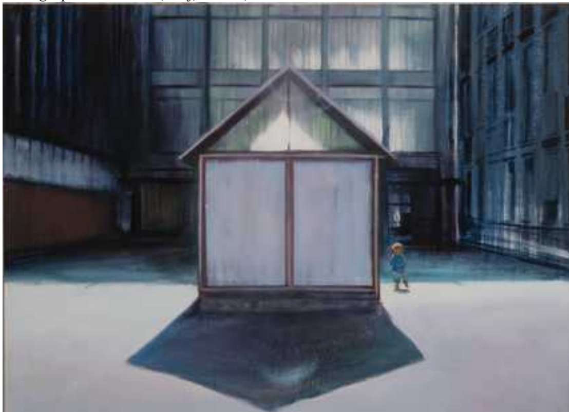
Menedék , 150x200cm, olaj, vászon, 2017.