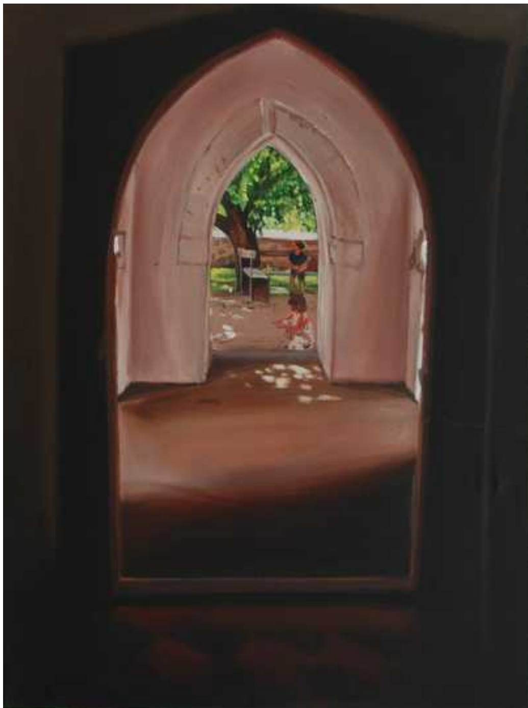
Vizolyi templomkapu, 80x60cm, olaj, vászon, 2008