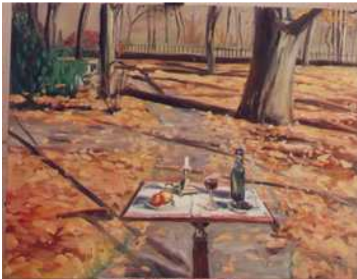
Kecskemét , 140x180cm, olaj, vászon, 2002.