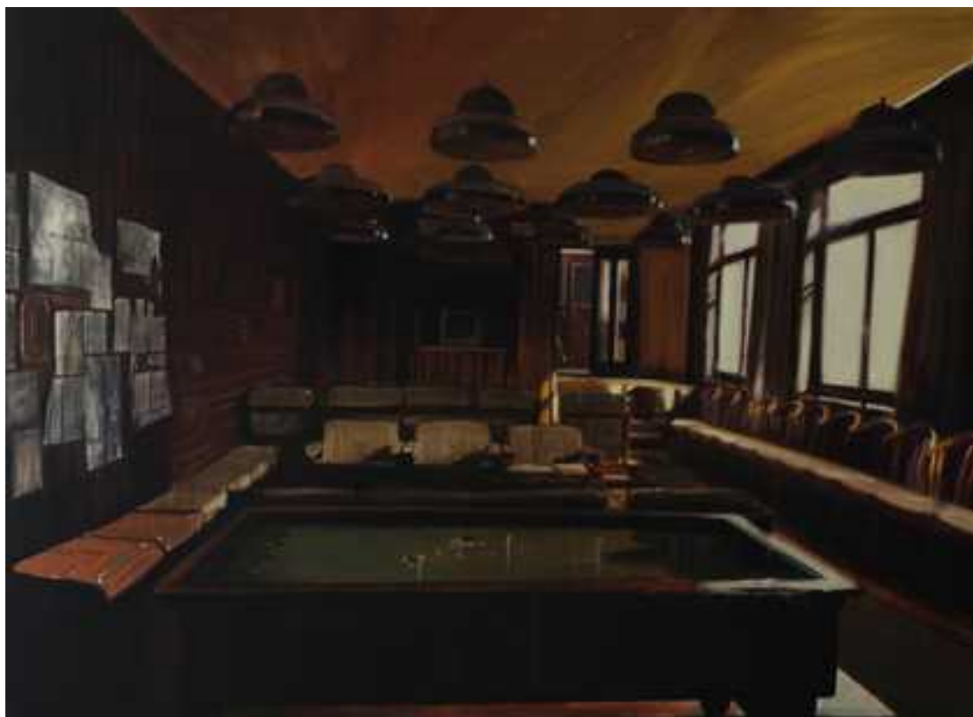
Kecskeméti alkotóház társalgója, 150x200 cm, olaj, vászon, 2013.

Itt az ipari, és posztszocialista terek lesznek bemutatva nagyméretű olajképeken Ezek a terek gyerekkorom óta megvannak, és magukkal hordozzák a múlt , különösen a 80 as évek világát és atmoszféráját.