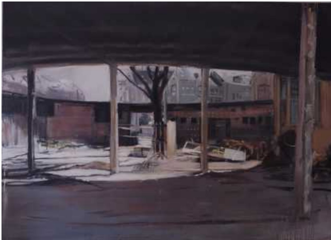
Körtéri gomba, 150x200 cm, olaj, vászon, 2013.