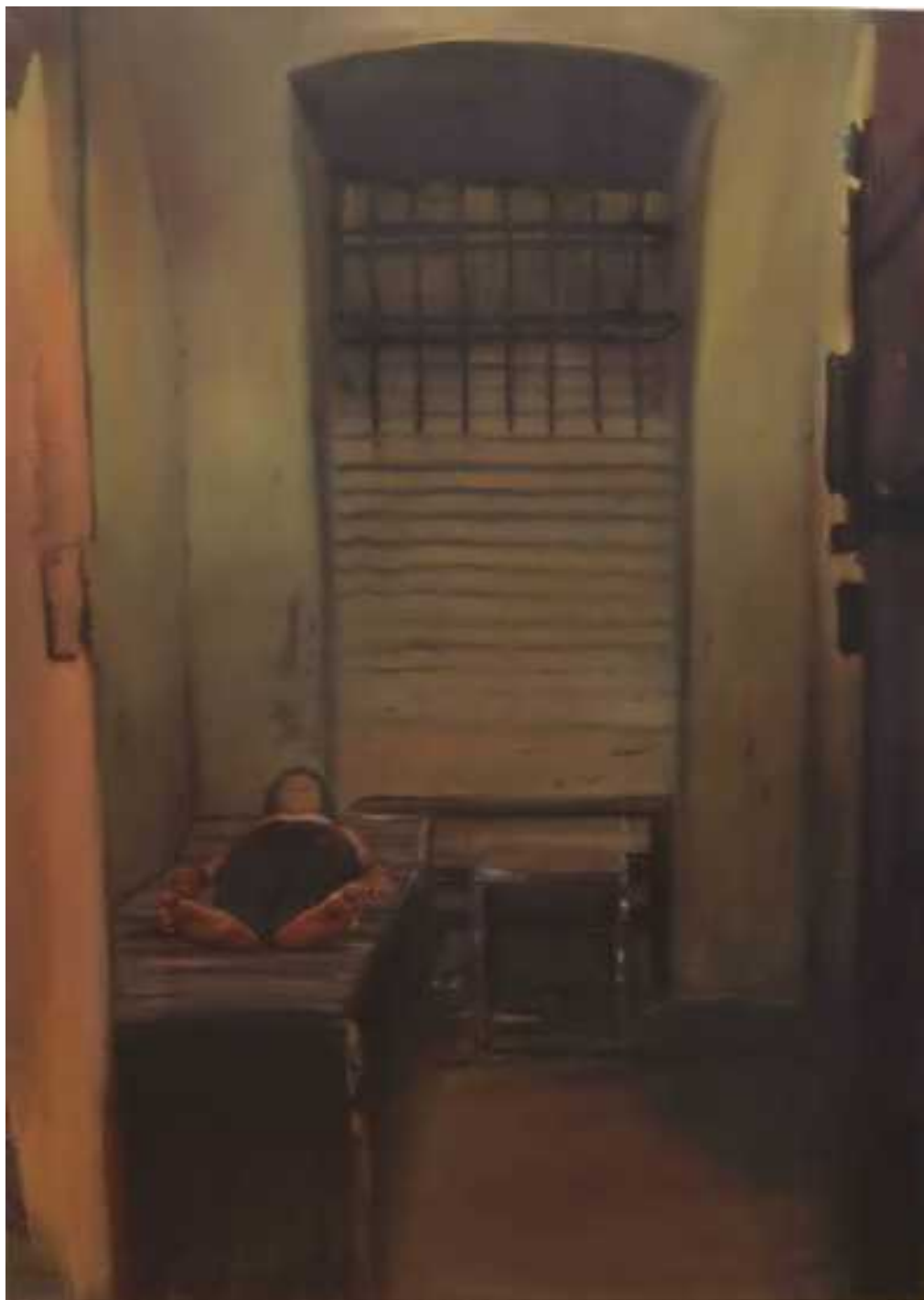
Zárka , 150x110 cm, olaj, vászon, 2012.