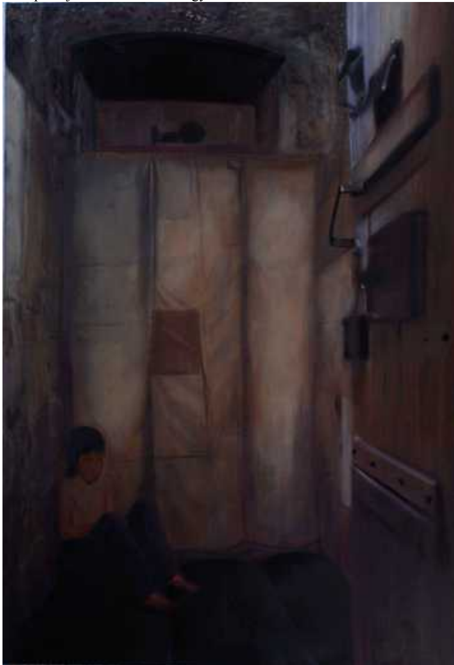
Dühögő Cella , 140 x110 cm, olaj, vászon, 2012.

Az alábbi oldalakon azok a képeim láthatóak melyeket az Alkotmány díszkiadásába festett Rákosi Mátyás kora című megrendelés előtanulmányai voltak. A fotókat a Terror háza pincéjében készítettem nagy fiam közreműködésével.