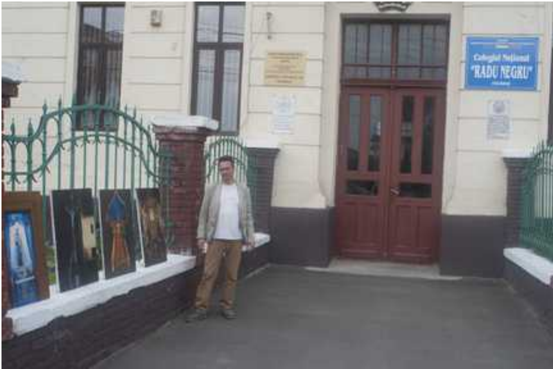
„Mária út” Fogaras 2017 05 31