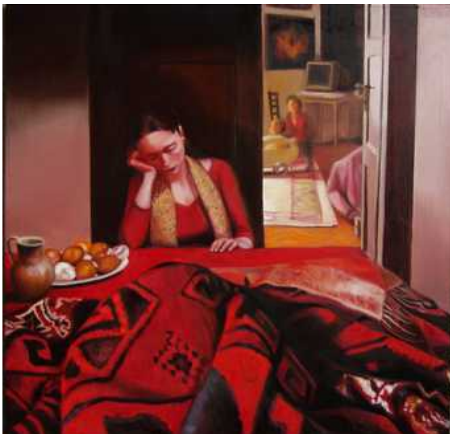
Alvó nő , 100x100cm, olaj, vászon, 2005.