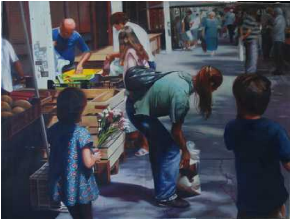
Szolnoki piac , 140x180cm, olaj, vászon, 2008.

Majd Csontváry helyszíneit kerestem fel 100 év elteltével, ahonnan Ő festette.