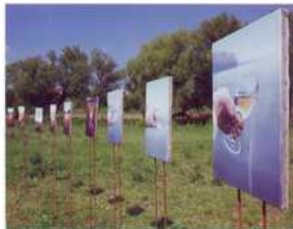
„Százkép” Budakalász 2000 május 5