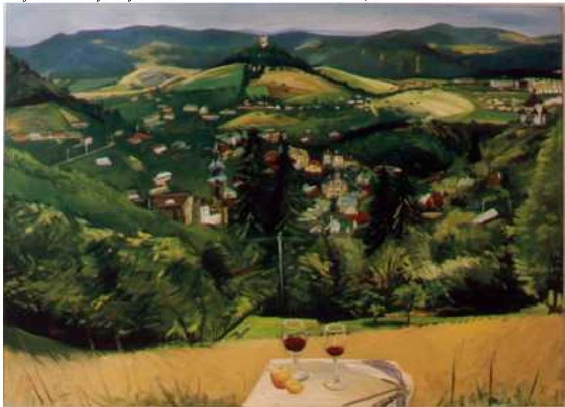
Selmecbánya látképe , 140x180cm, olaj, vászon, 2002.

Majd Csontváry helyszíneit kerestem fel 100 év elteltével, ahonnan Ő festette.