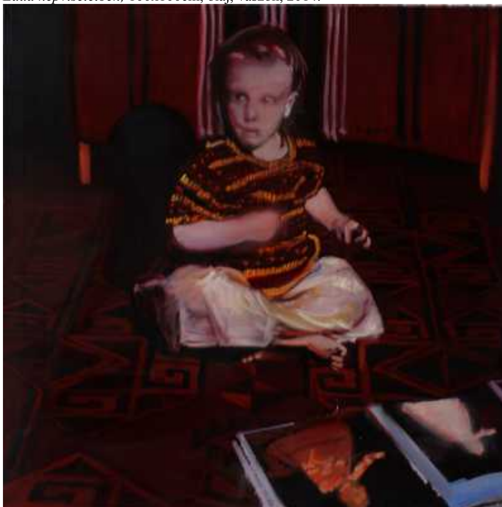
Infánsnők , 100x100cm, olaj, vászon, 2005.