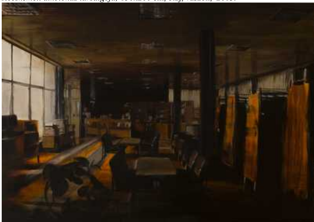
Makói könyvtár, 150x200cm, olaj, vászon, 2013.