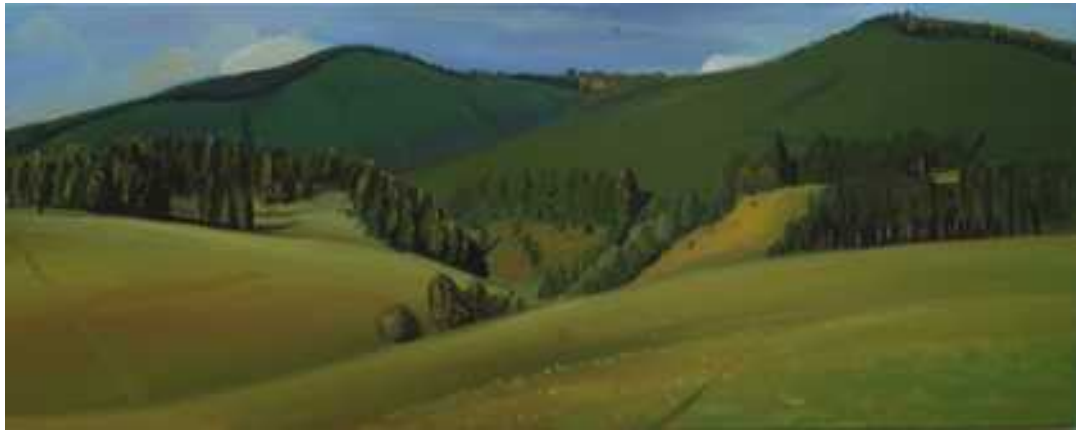
Izvara , 50x125cm, olaj, vászon, 2008.