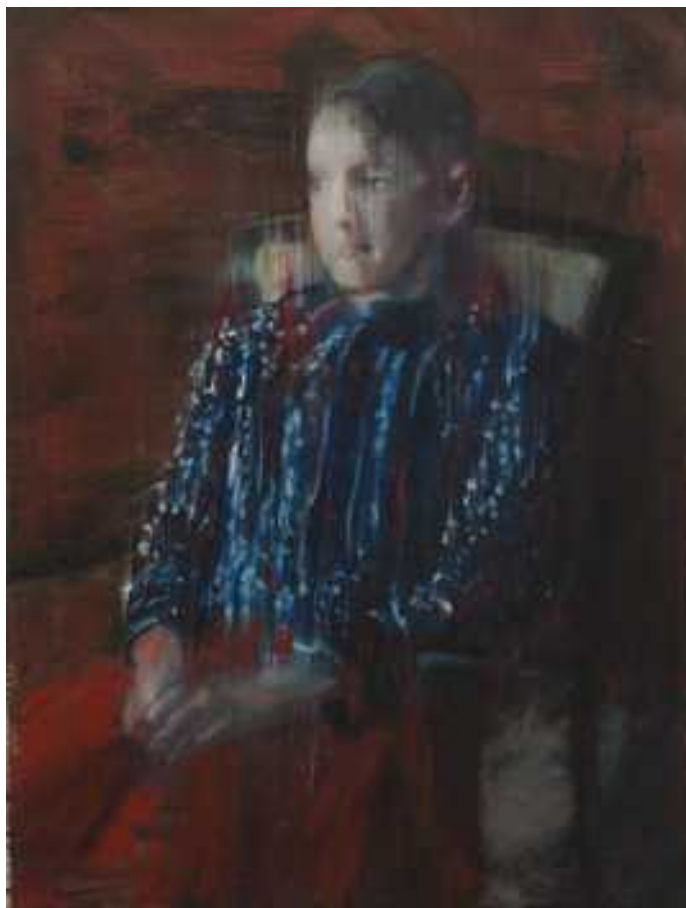
Édua népviseletben , 80x60cm, olaj, vászon, 2014.