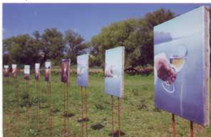
Százkép című kiállítás, Budakalász 2000 május 5.