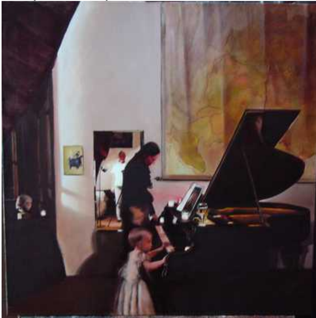
Műterem , 100x100, olaj, vászon, 2004.

A következő Lapon, a korábbi mesterek tiszteletére festettem képeket, először Csernus Tibor parafrázisa látható.