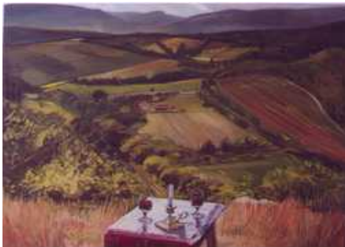
Pilis , 140x180cm, olaj, vászon, 2002.