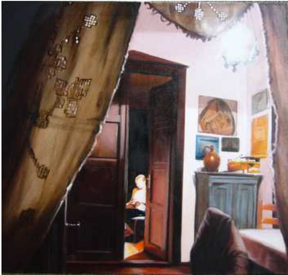
Otthon , 100x100cm, olaj, vászon, 2005.