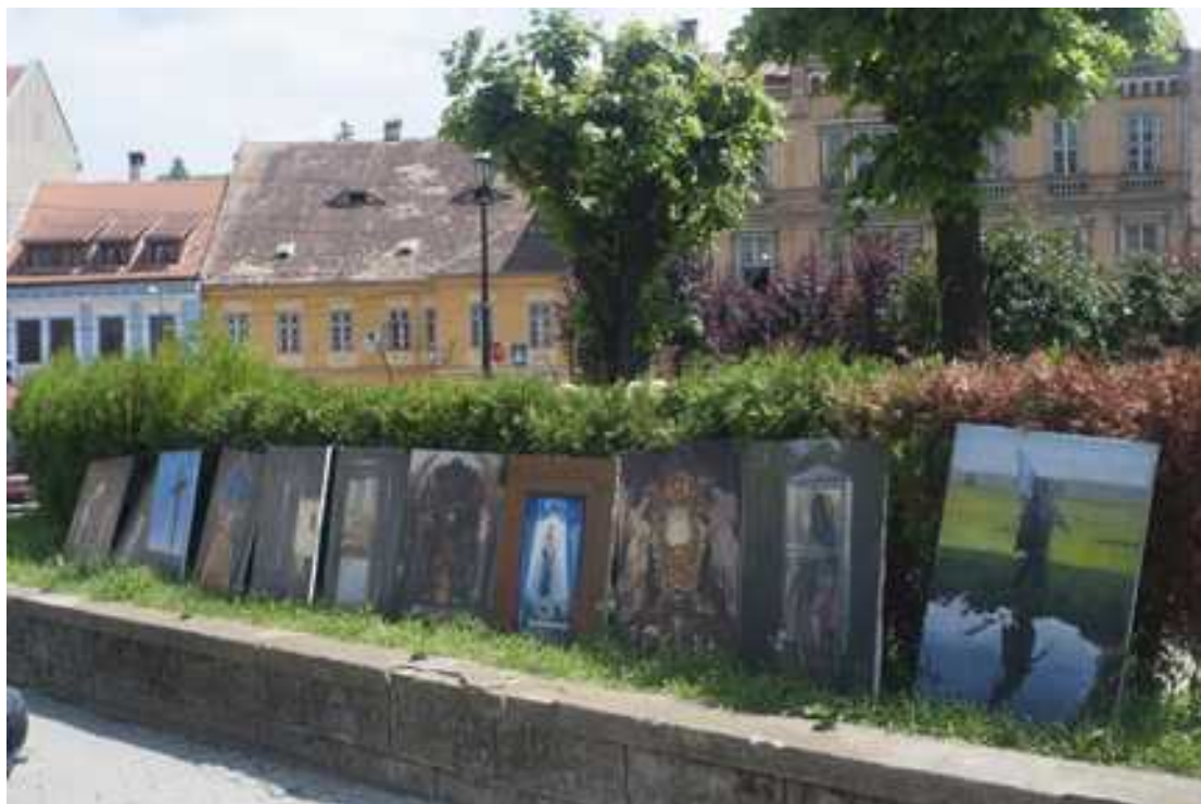
„Mária út” Segesvár 2018 május