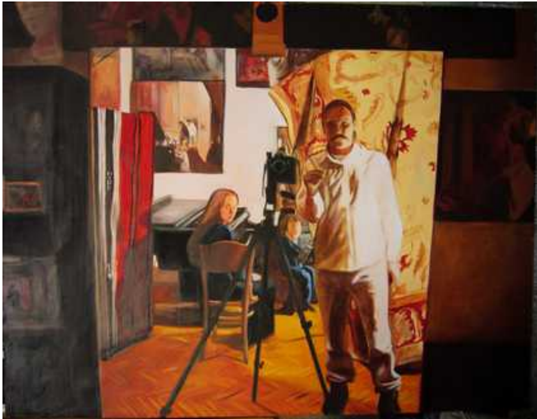
Önarckép , 140x180cm, olaj, vászon, 2005.