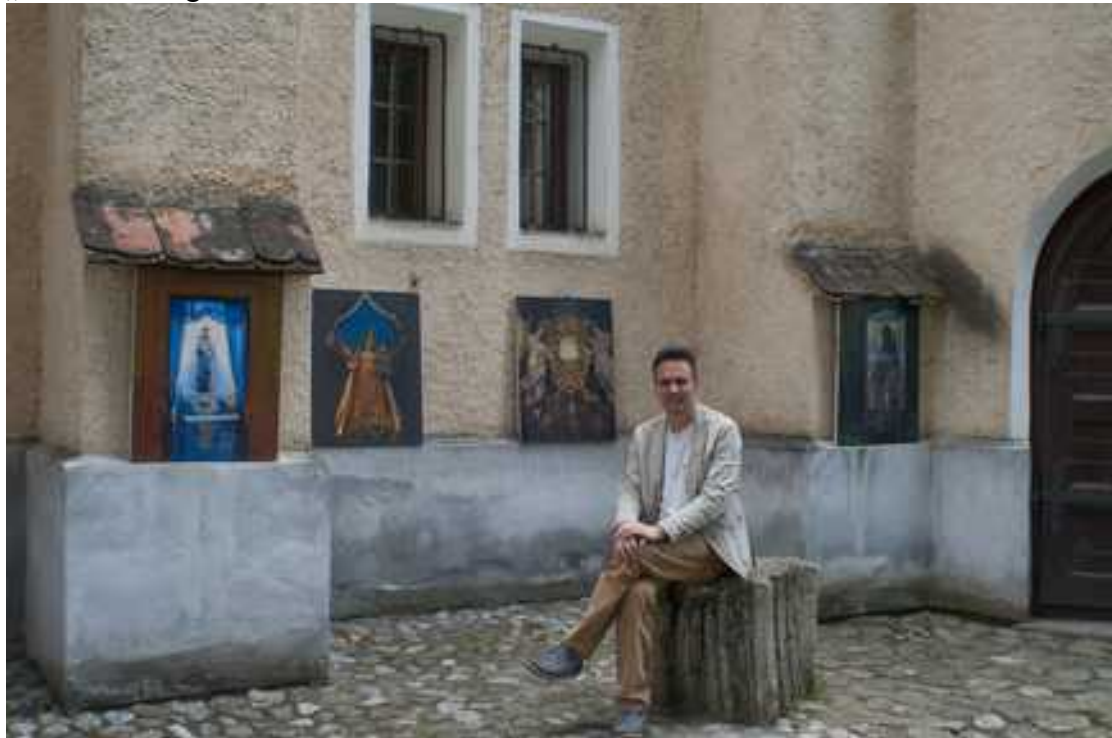
„Mária út” Nagyszeben 2017 május 31