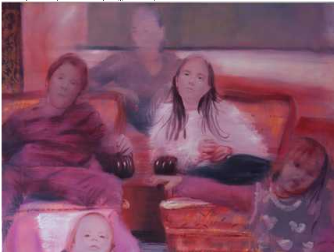
Családom , 110x140cm, olaj, vászon, 2017.