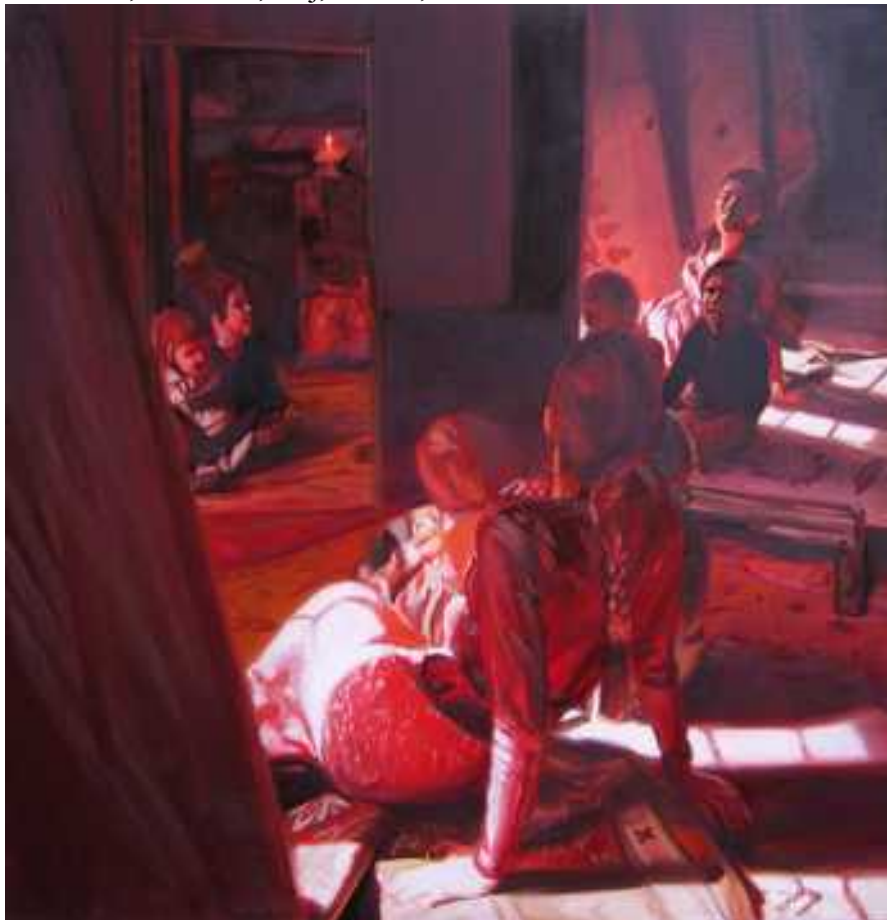
Tükrök , 100x100cm, olaj, vászon, 2006