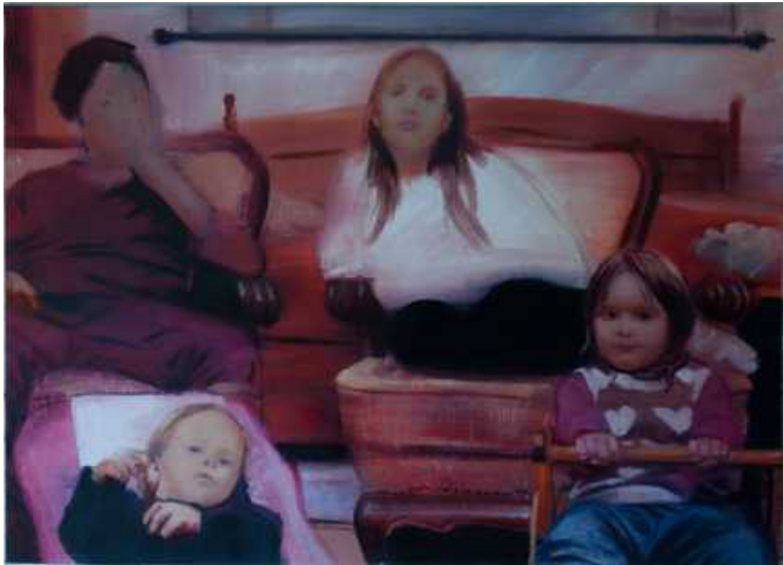
Gyerekeim , 110x140cm, olaj, vászon, 2017.