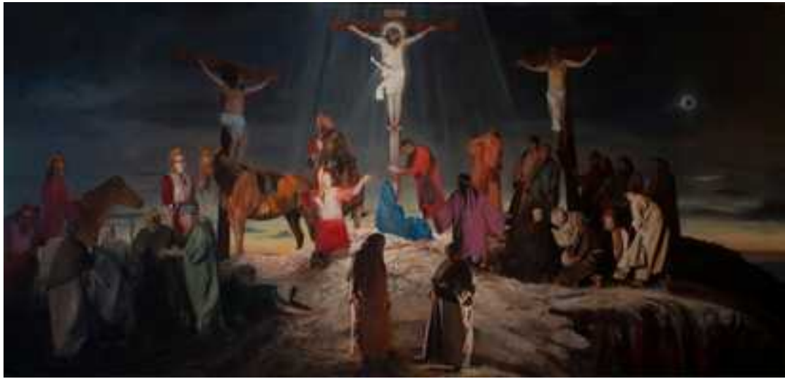
Golgota , 400x850cm, olaj, vászon, 2014. (Szent Kereszt plébániatemplom BP.)

Legvégül azok a munkáimat mutatom be, melyek festmények installációi, szabadban történő elhelyezése, valamint Land-Art munkám dokumentációi a Tolcsvai Land-Art művésztelepről.