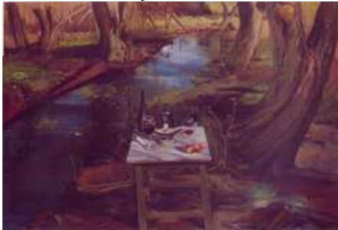
Patakpart , 150x200, olaj, vászon, 2001.