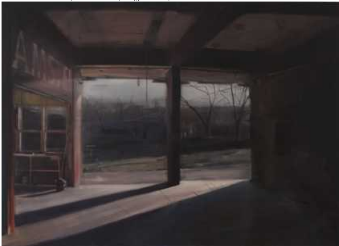
Budai parkszínpad, 150x200 cm, olaj, vászon, 2013.