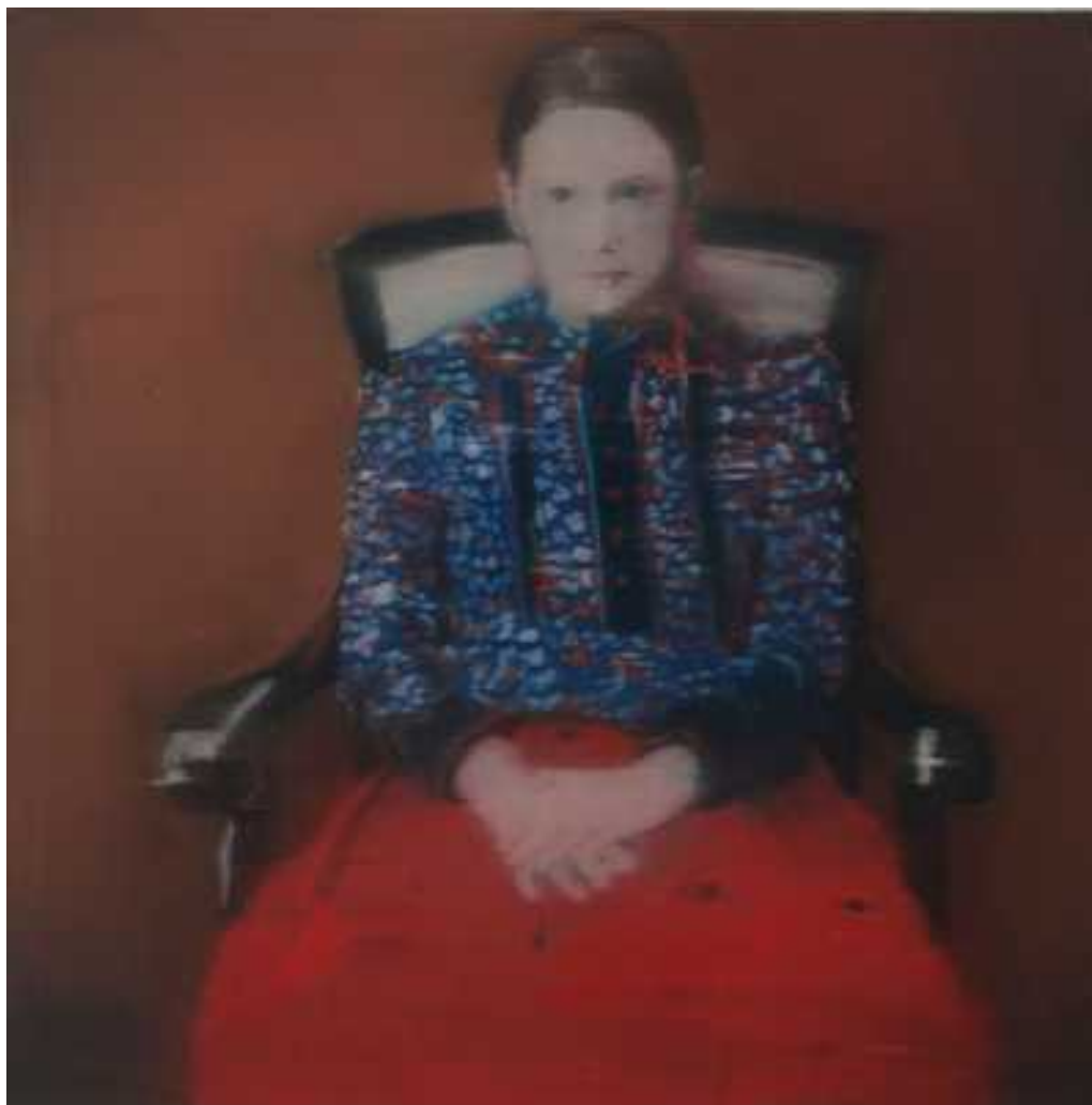
Édua népviseletben , 100x100cm, olaj, vászon, 2014.