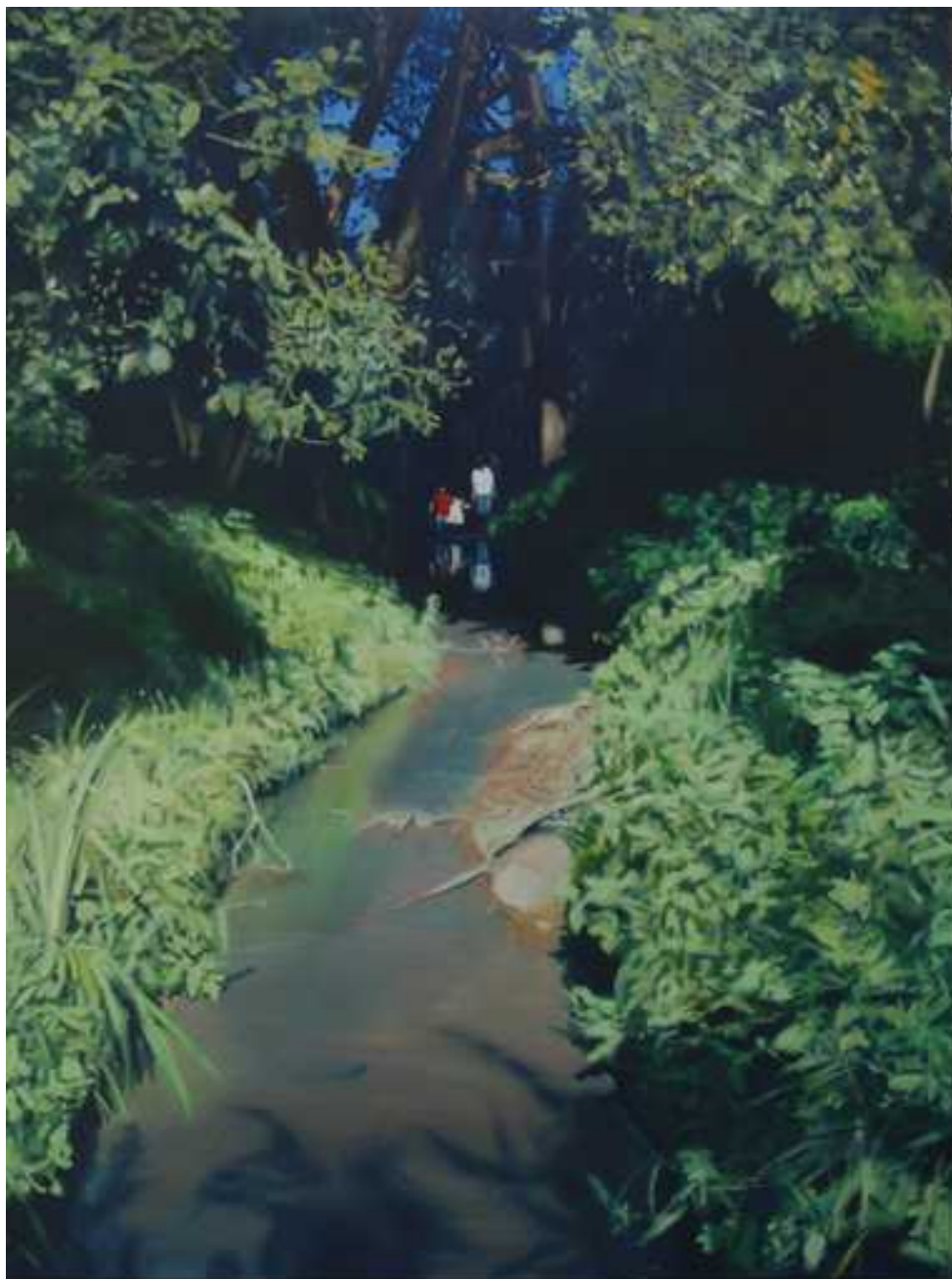
Patakban , 200x150 cm, olaj, vászon, 2007.