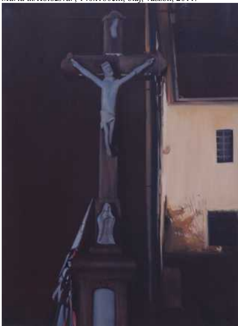
Mária út /Kács, 80x60 cm, olaj, vászon, 2011.