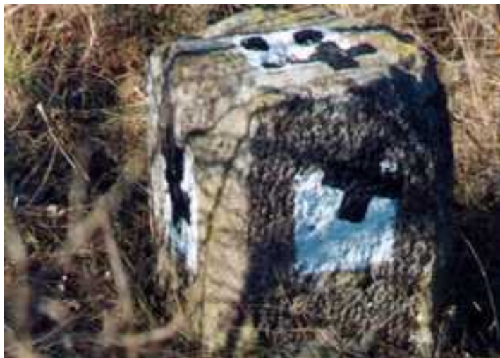
„Malevics emlékösvény” 2001 Tolcsva, festett túristajelzés