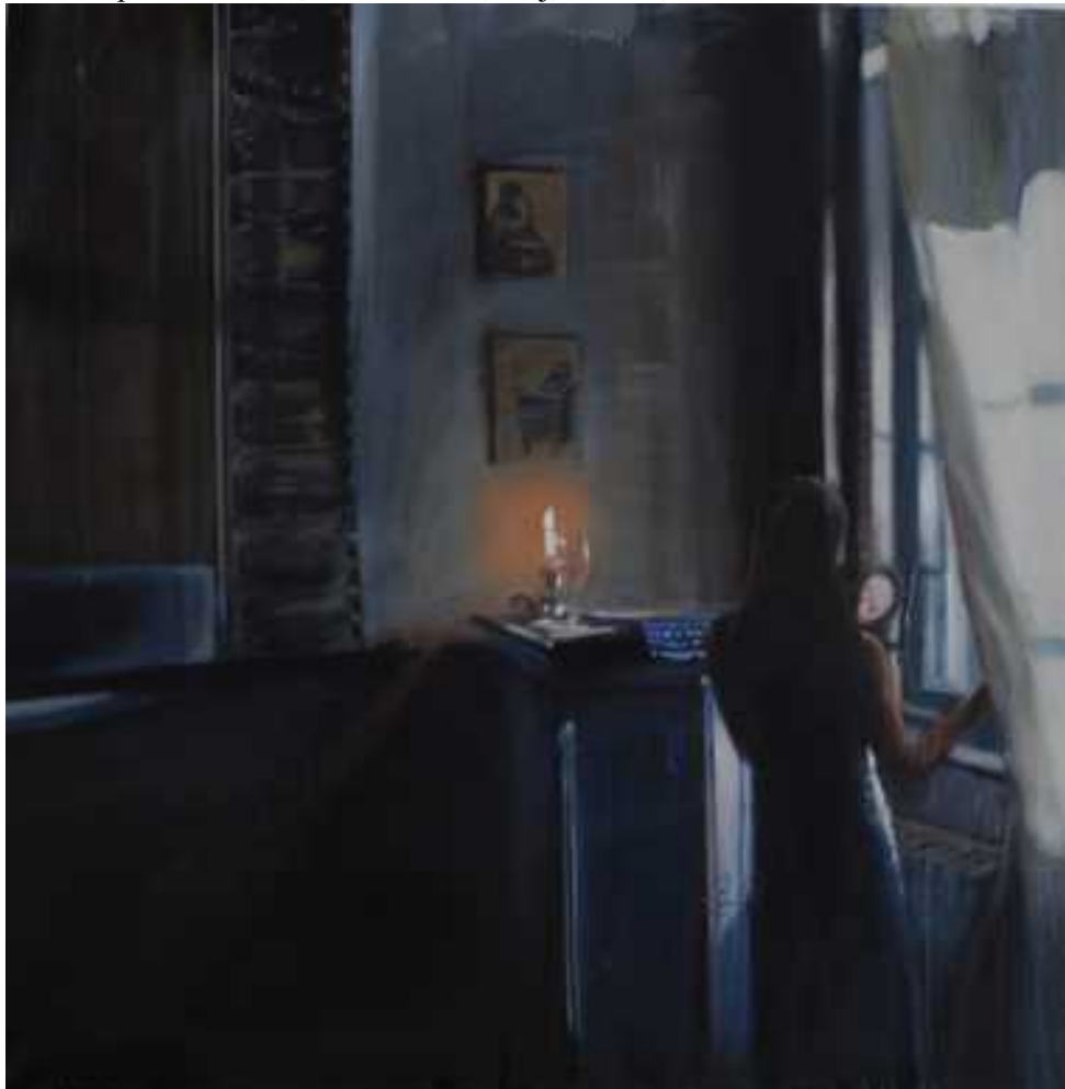
Szolnoki szoba, 100x100cm olaj, vászon, 2009