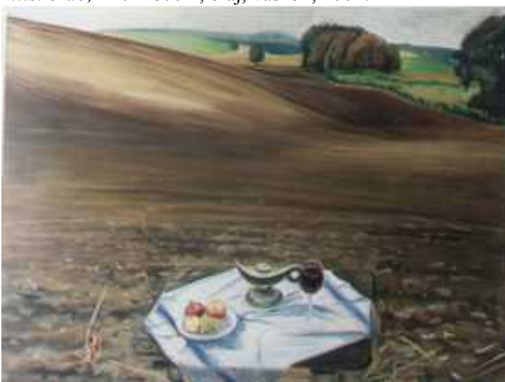
Gyermelyi dombok , 140x180cm, olaj, vászon, 2002.