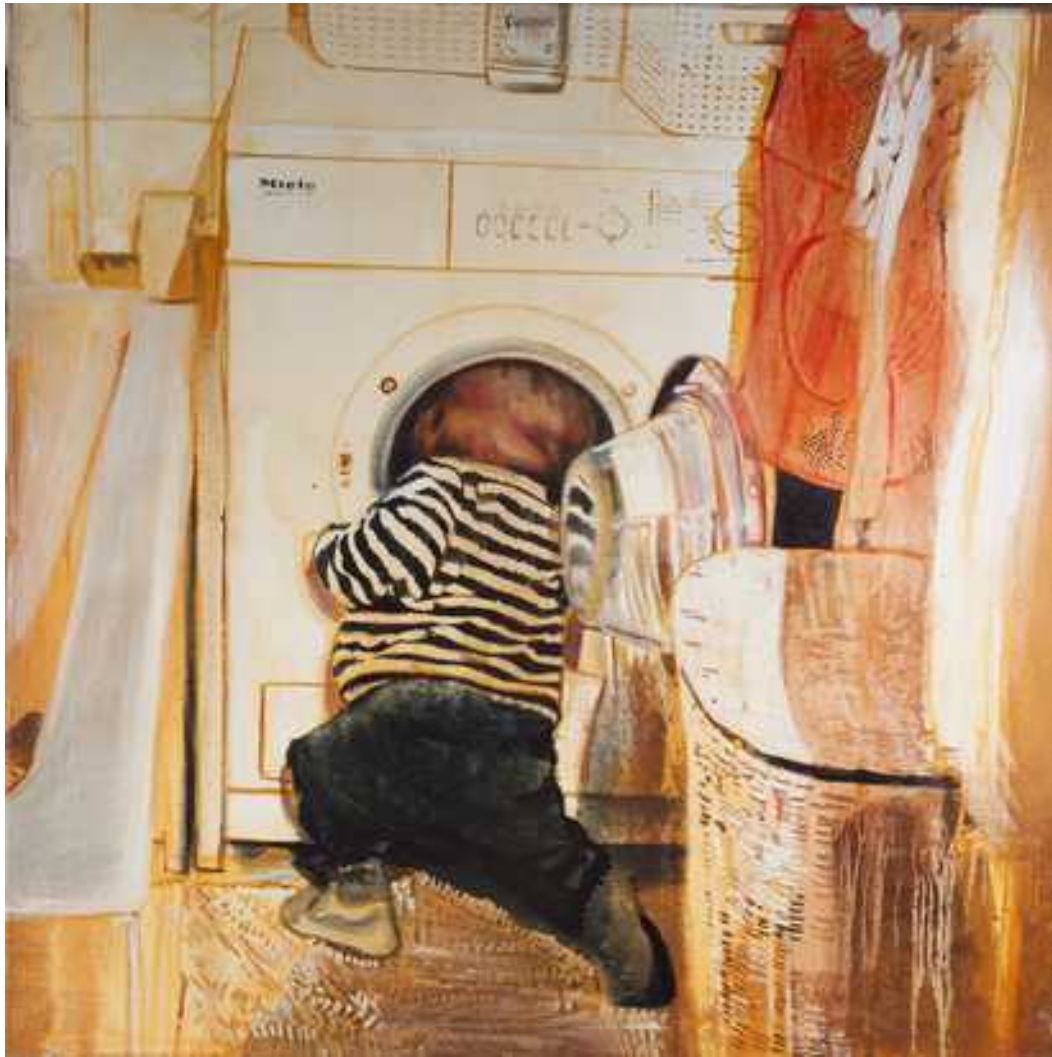
Csillagkapu , 100x100cm, olaj, vászon, 2016.