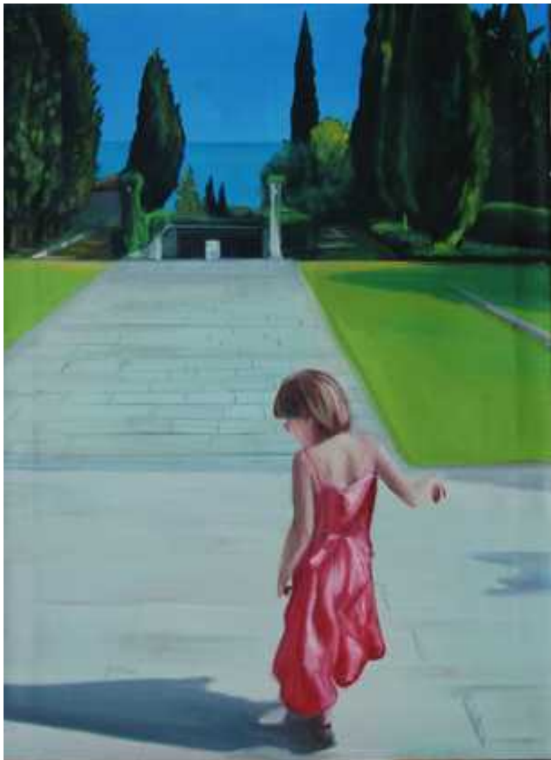
A mester kertje, 80x60cm, olaj, vászon, 2009.

2009 ben Szolnoki művésztelepre költöztünk 2 évre, és ebben az időszakban a figura és a táj kapcsolatával foglalkoztam. Eredetileg a Nagybányai festőiskola alapfelvetése is ez volt.