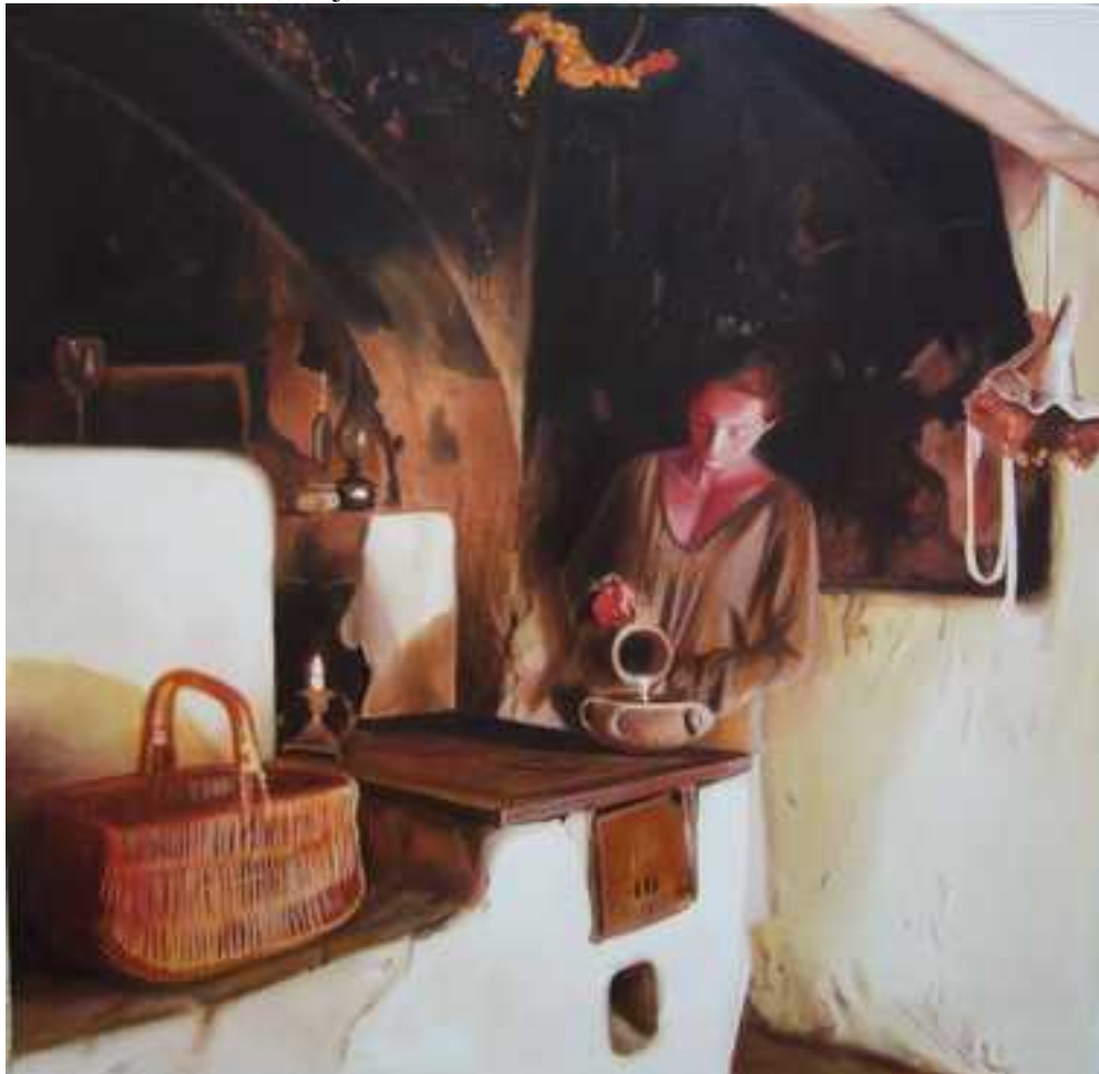
Tejet öntő , 100x100cm, olaj, vászon, 2005.