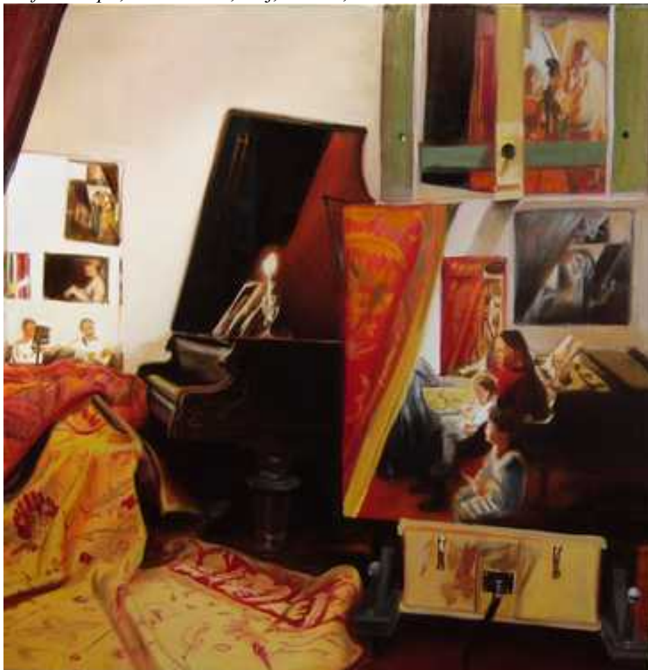
Műterem II , 100 x100cm, olaj, vászon, 2005.