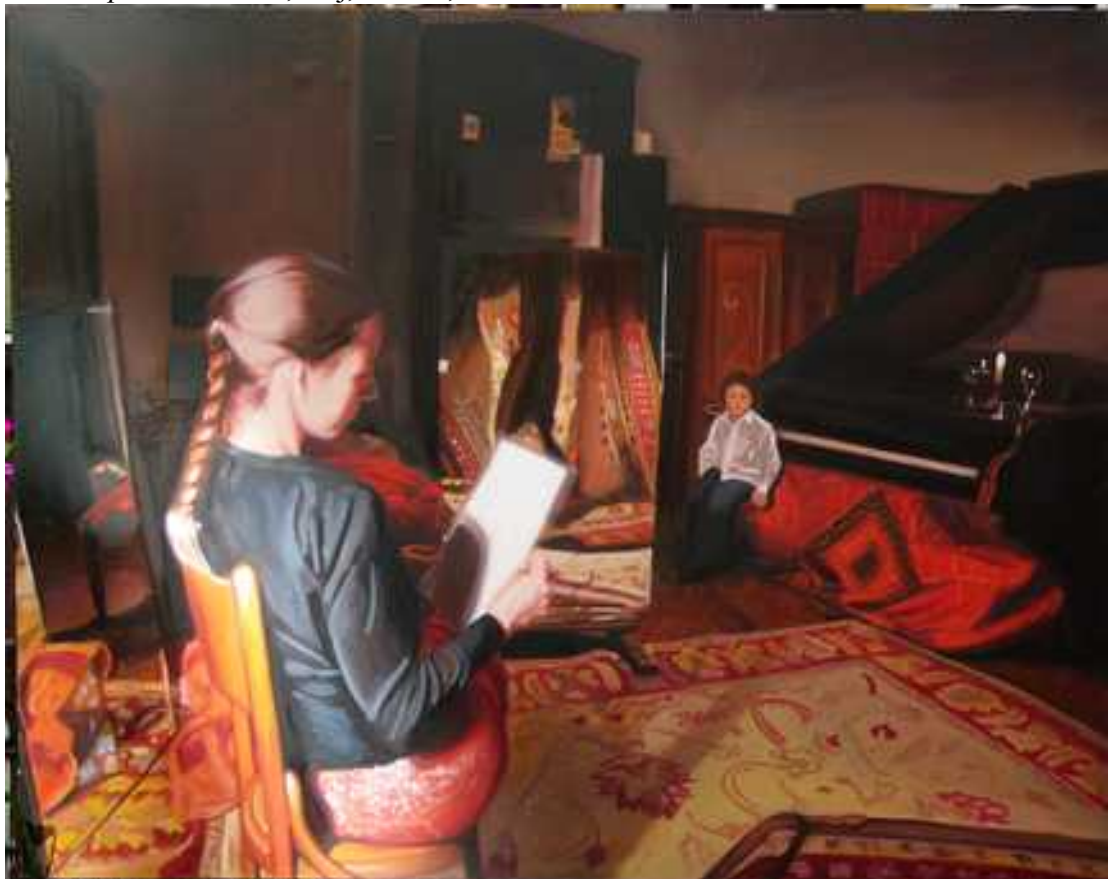
Műterem , 110x140cm, olaj, vászon, 2005.