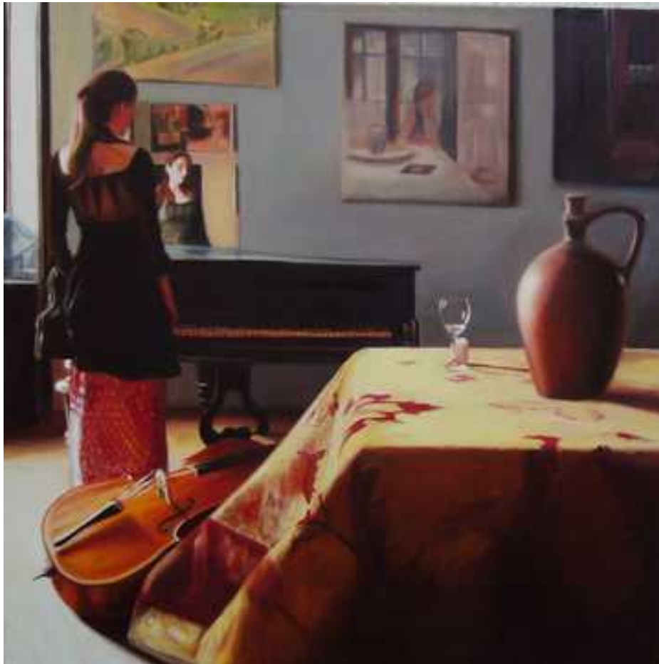
Vermeer parafrázis , 100x100cm, olaj, vászon, 2005.

Az alábbiakban az enteriőröket mutatom be melyeket családom modellálásával az otthonomban festettem. Itt szándékos hivatkozási pont Vermeer festészete.