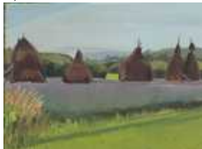
Nagybánya , 40x60cm, olaj, vászon, 2017. Lucernás , 50x70cm, olaj, vászon, 2014.