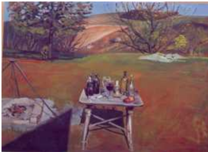
Gyermely , 150x200, olaj, vászon, 2001.