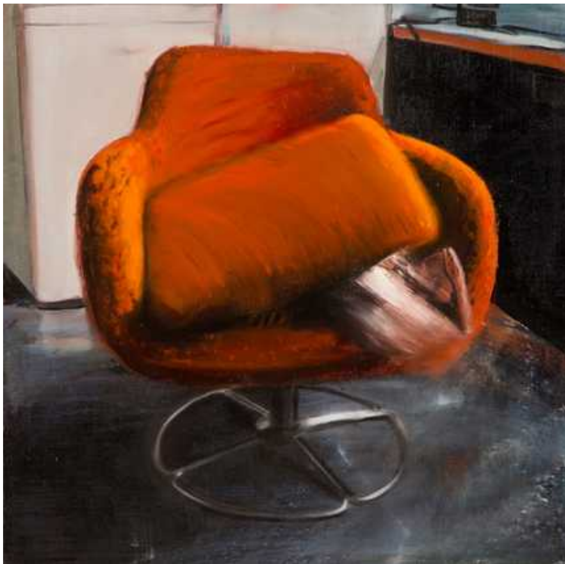
Felfedezés, 100x100cm, olaj, vászon, 2015.