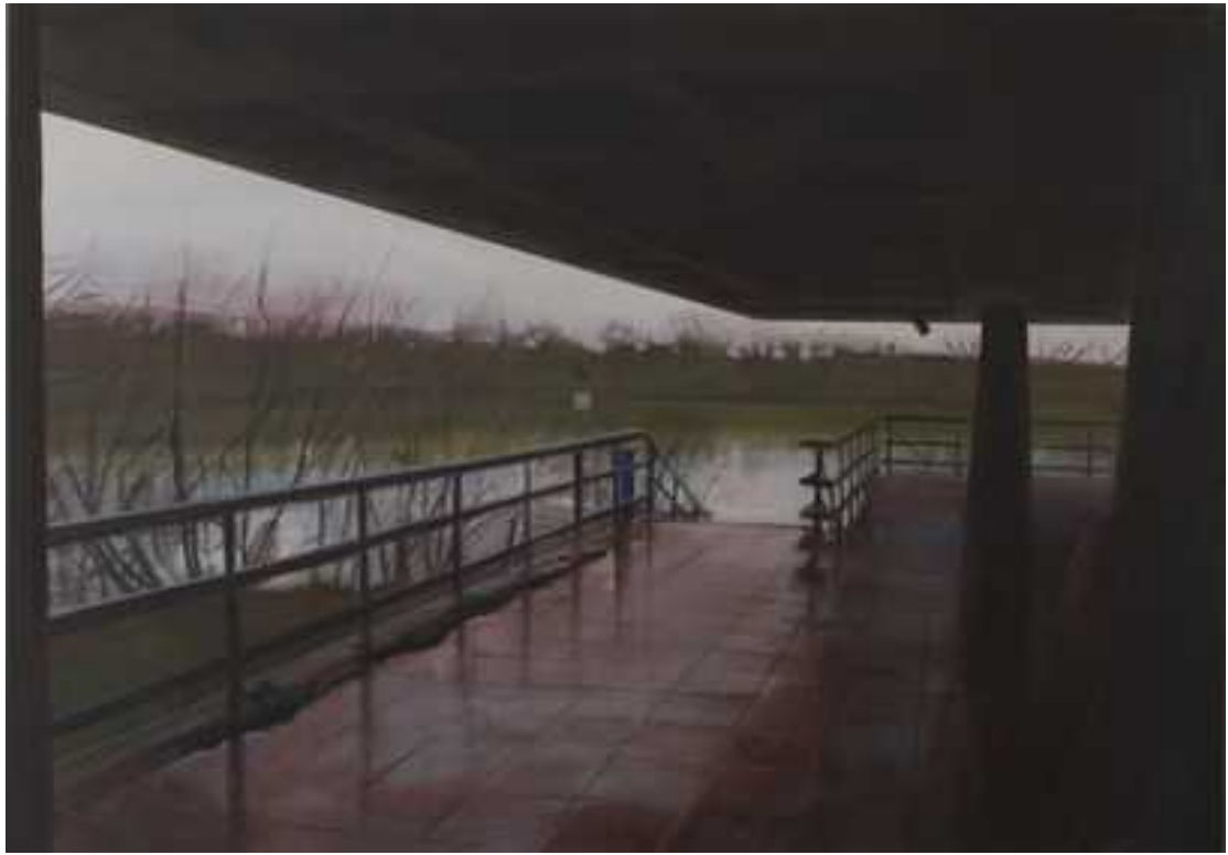
Szentendrei kikötő, 150x200cm, olaj, vászon, 2013.