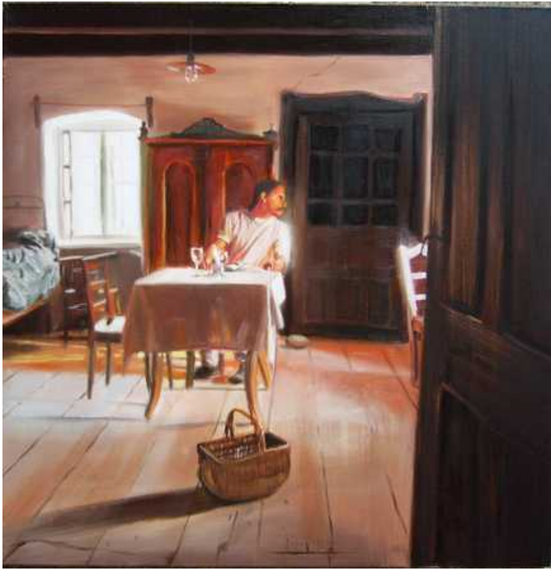
Őnarckép , 100x100cm, olaj, vászon, 2005.