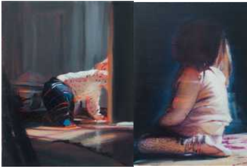
Felállunk! , 40x30cm, olaj, vászon, 2017.