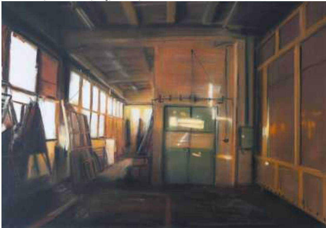
Műhely , 150x110cm, olaj, vászon, 2015.