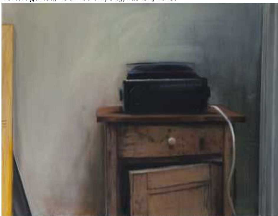
Diavetítő önarcképe, 60x80cm, olaj, vászon, 2014.

Az alábbi oldalon a gyerekeim portéi láthatóak, majd ipari belső terek. Ezt a két tematikát is próbáltam összekötni, így ipari térben a gyerek, vagy mosógépet felfedező kisfiam ennek a témaegyesítésnek, illetve téma kiterjesztésnek az eredményei.