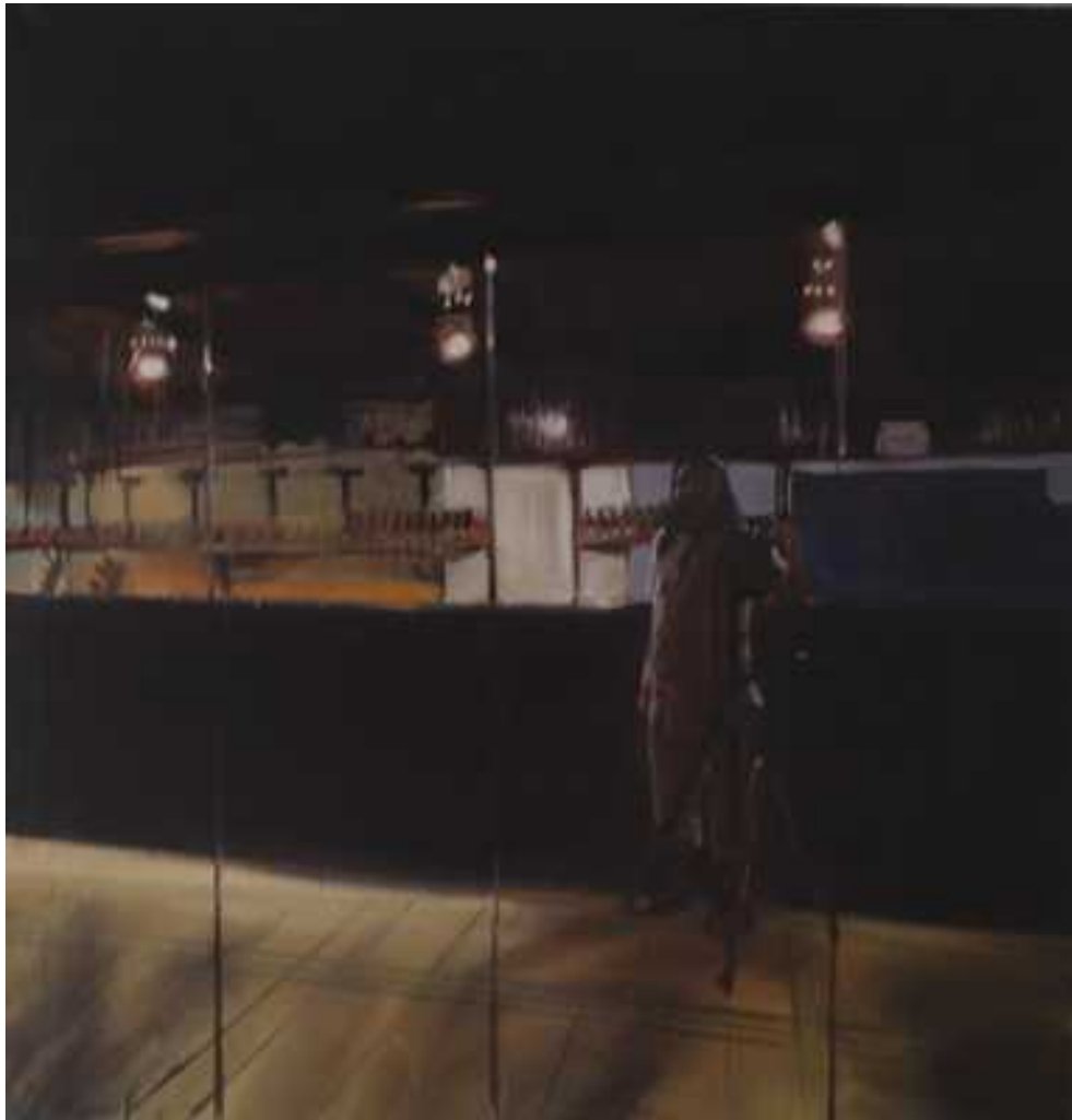
Önarckép ruhatárban, 100x100 cm, olaj, vászon, 2014.