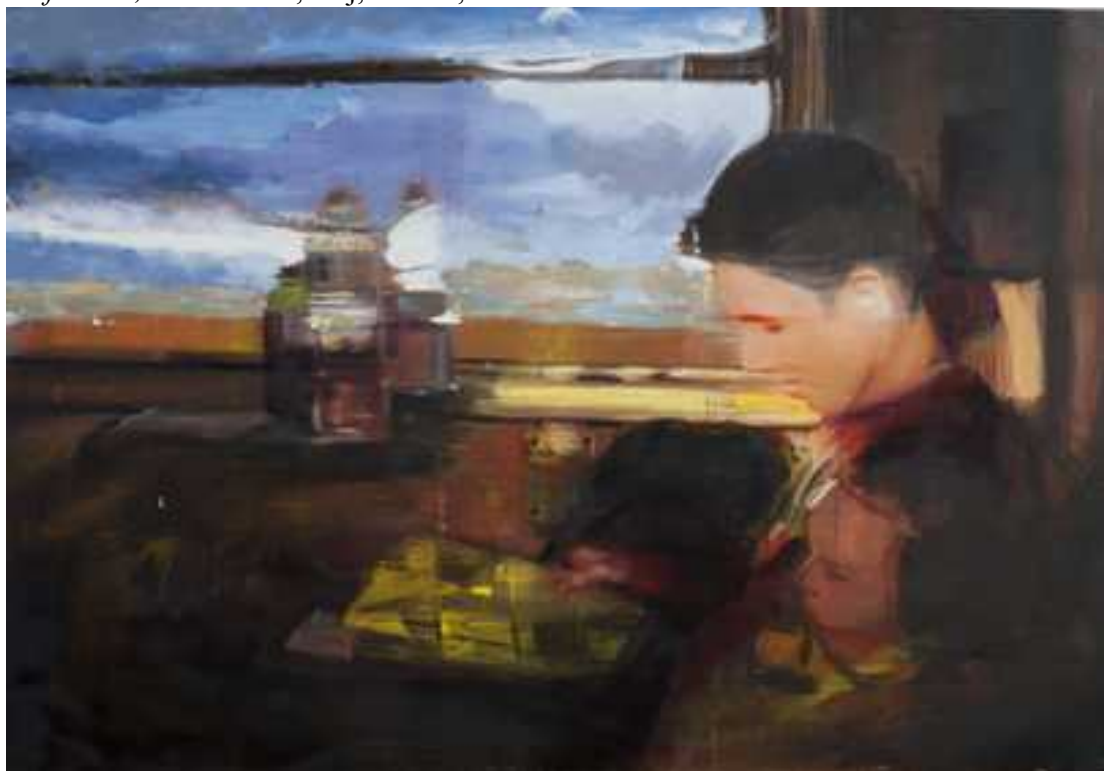
Vonaton, 110x150cm, olaj, vászon, 2015.