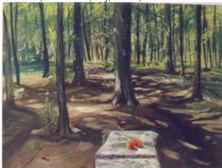
Pilisi erdő , 140x180cm, olaj, vászon, 2002.