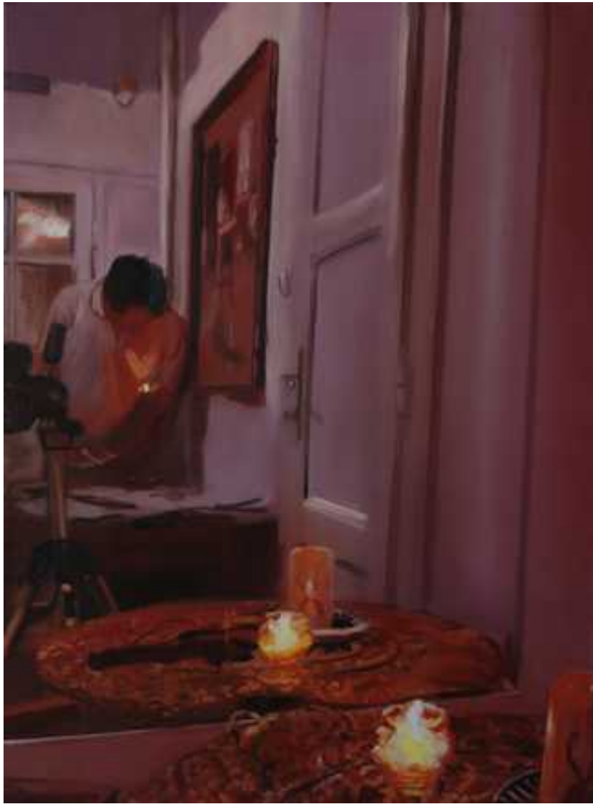
Otthon III , 80x60cm, olaj, vászon, 2007