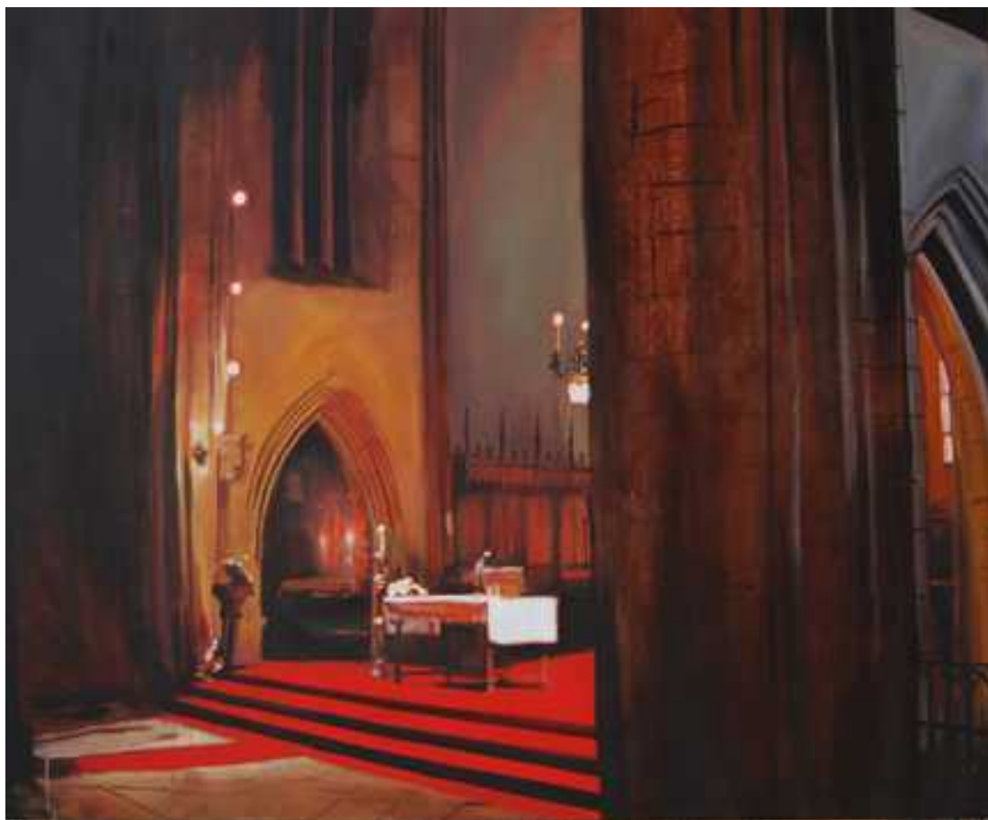
Mária út/Kolozsvár, 140x180cm, olaj, vászon, 2011.