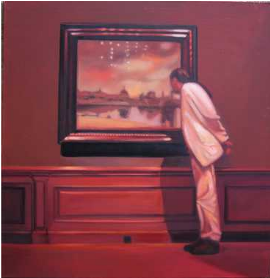
Delft Látképe , 100x100cm, olaj, vászon, 2006.