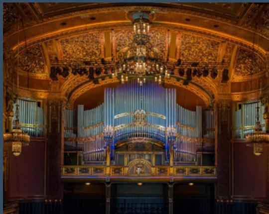
Budapest, Zeneakadémia - Voit (1907)