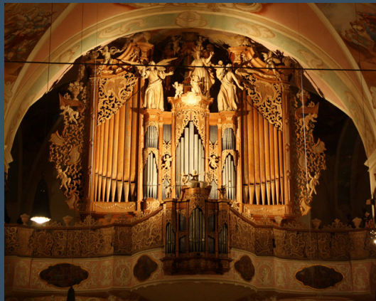
Meihingen, Klosterkirche - Baumeister, 1737 Fotó: Mészáros Zsolt Máté

Ars Magna Consoni et Dissoni: Toccatá I.