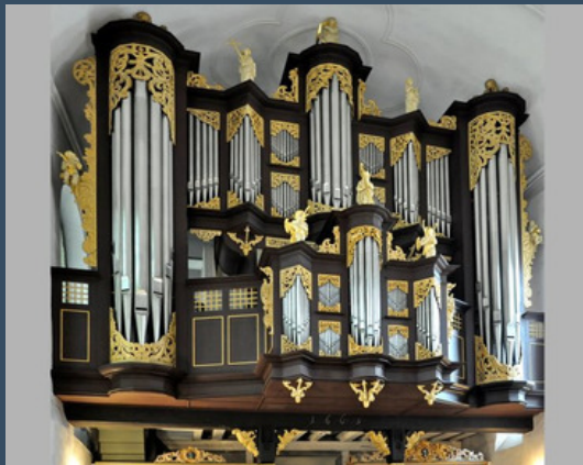
Stade, St. Cosmae et Damiani - Schintger (1668)