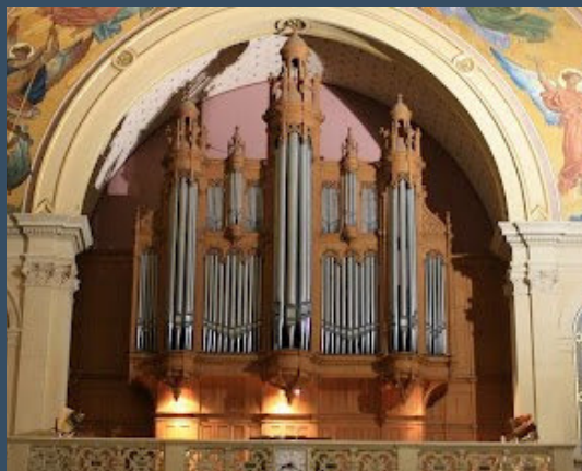
Paris, St. Trinité - Cavallé-Coll (1871)