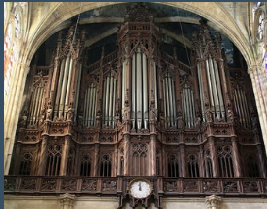
Paris, St. Denis- Cavallé-Coll (1841)