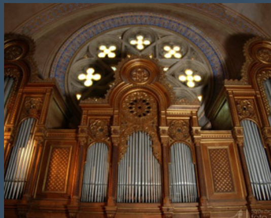
Főt, Katolikus templom - Mooser (1854)

Introitus, R. 390/1 „Les morts” – Oraison, R. 390/2 Kereszteslovagok indulója a Szent Erzsébet legendából (Koloss István orgonaátirata) „Nun danket alle Gott”, R. 408 Offertórium a Magyar koronázási miséből, R. 411b Ora pro nobis, R. 383 Orpheus, R. 415 Preludium – In domum Domini ibimus, R. 395 Resignazione, R. 388 Rosario, R. 396 Salve Regina, R. 394/1 Tu es Petrus, R. 391 Ungarns Gott, R. 399 Via crucis, S. 53 Weimars Volkslied, S. 313 Weinen, Klagen, Sorgen, Zagen, R. 382