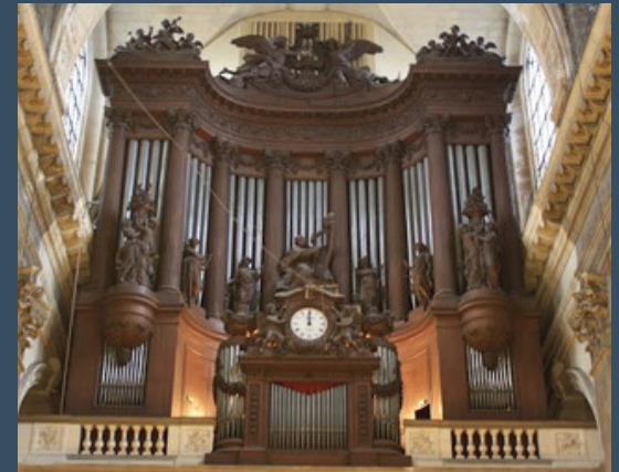
Paris, St. Sulpice – Cavallé-Coll (1862)