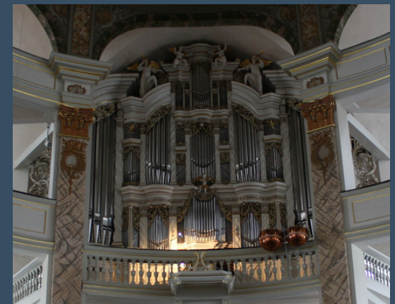
Waltershausen, Stadtkirche - Trost (1741)

Wer nur den lieben Gott lässt walten, BWV 691