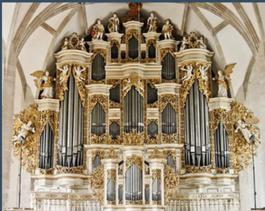
Merseburg, Dom - Ladegast (1851)