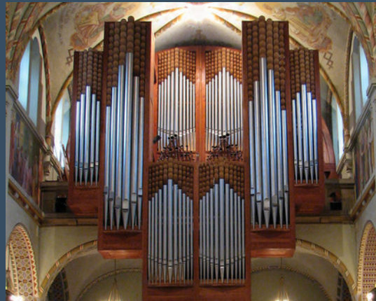
Budapest, Kassai téri Szentlélek-templom