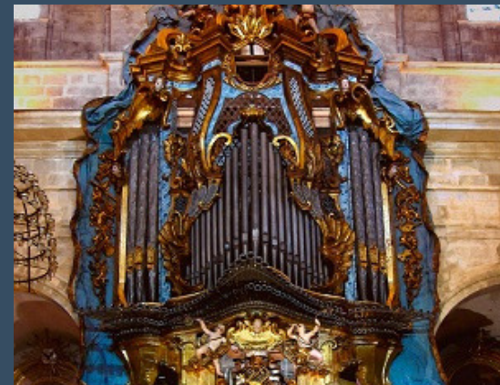
Mallorca, Santanyi - Jordi Bosch (1765)