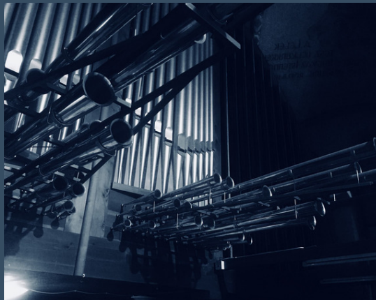
Budapest, Kassai téri Szentlélek-templom