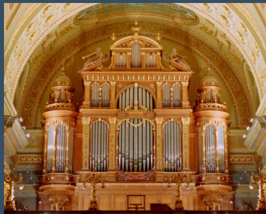
Budapest, Szent István-bazilika - Angster (1905)

Canzonetta I. Canzonetta II. Szent István fantázia