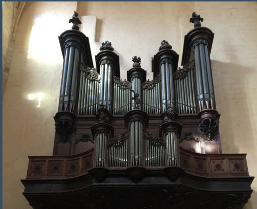
Sarlat, Cathedral - Lepine (1753)