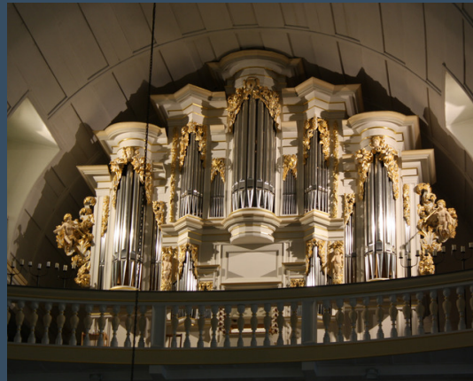
Arnstadt, Bach Kirche - Wender, 1703