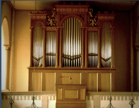
Hoffenheim, Evangelische Kirche – Walcker (1846)