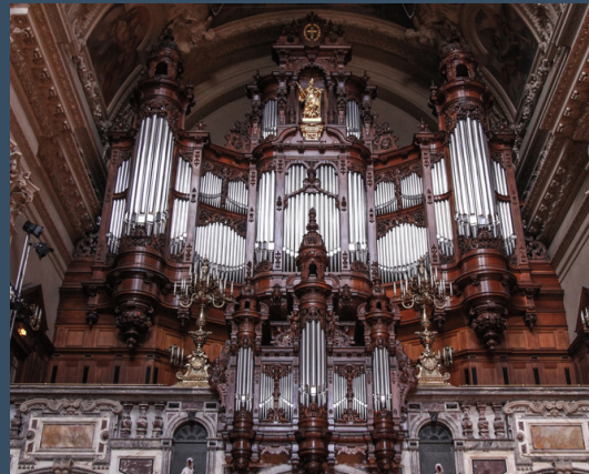
Berlin, Dom - Sauer (1905)

„Jesu, meine Freude” szimfonikus korál, op. 87, no. 2