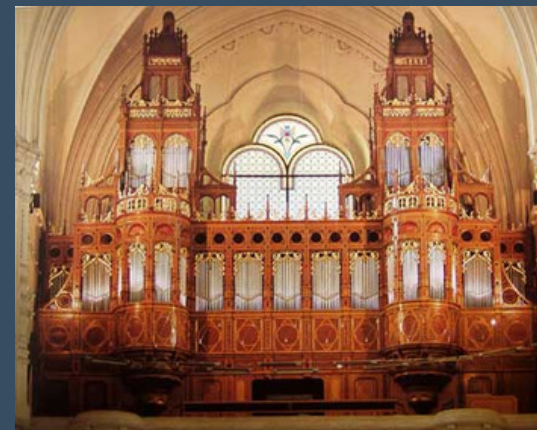
Kőbánya, Szt. László-templom - Rieger (1896)

Elégia egy Bartók téma felett Variációk egy Kodály témára