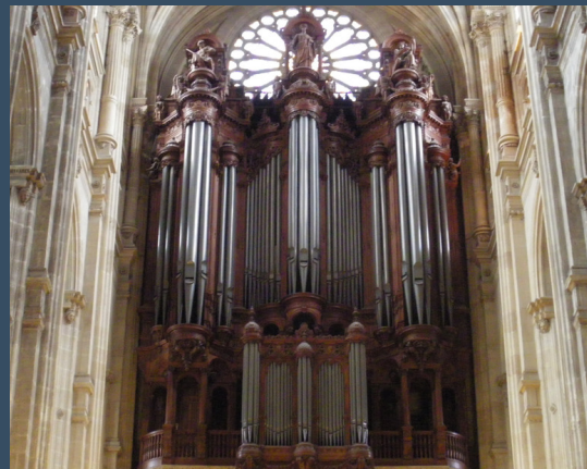
Paris, St. Eustache - Van den Heuvel (1989)