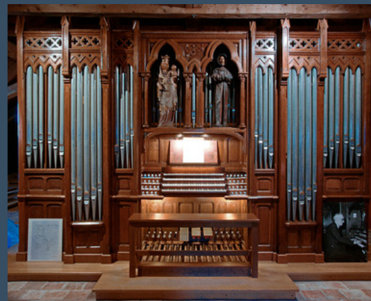
Az Alain család házi orgonája

IV. Sortie – Les oiseaux et les sources V. Sortie - Le vent de l’Esprit