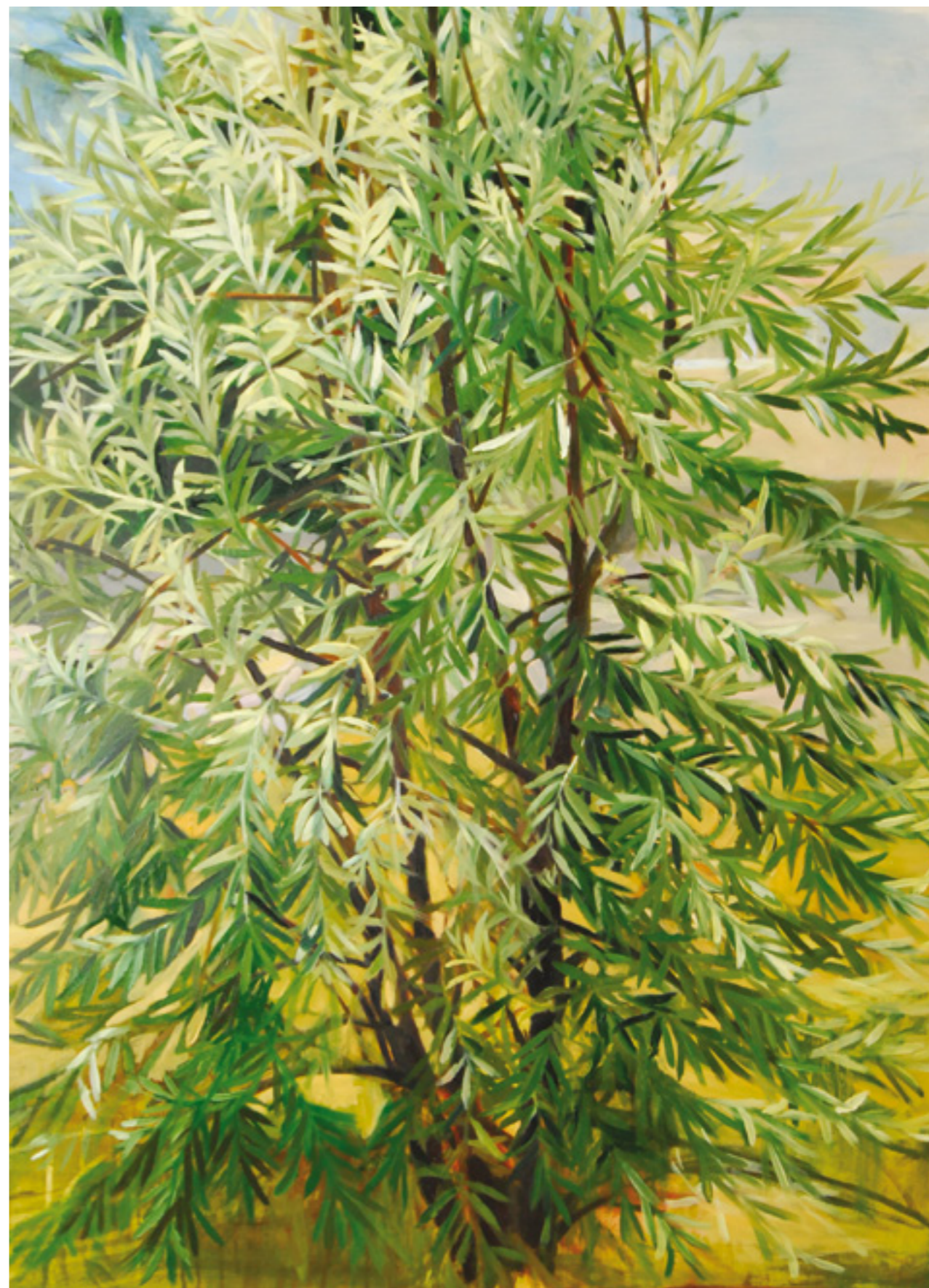
Fűzfa 150x110 cm, olaj, vászon, 2015.