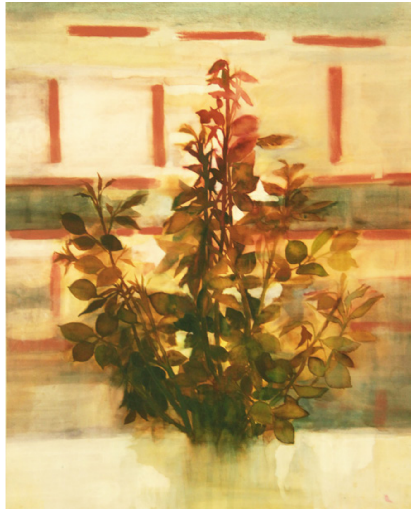
Rózsabokor 97x121cm, papír, ecolin, 2016.