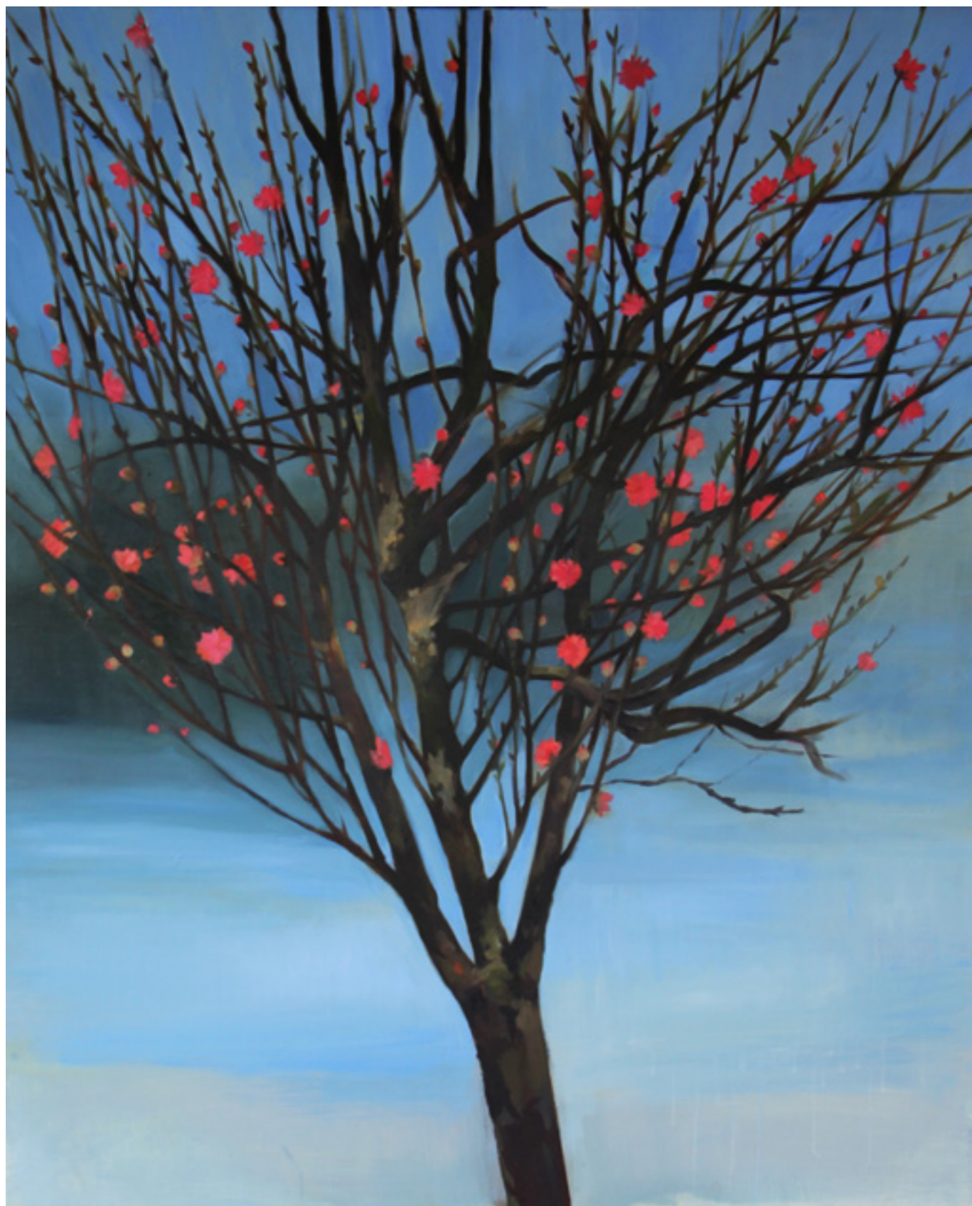
Tet fa 120x100 cm olaj, vászon, 2019.