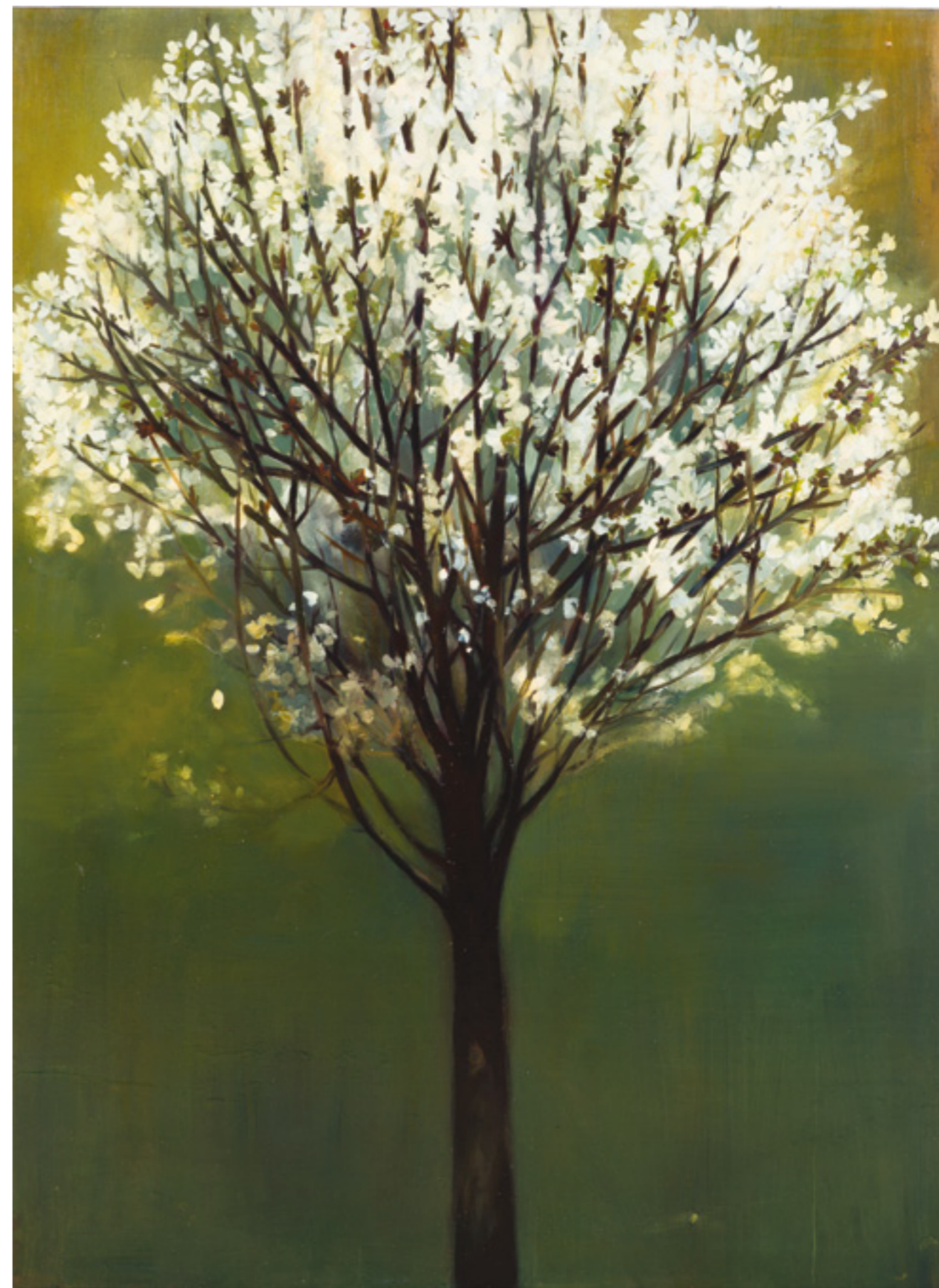
Cseresznyefa 150x110 cm, olaj, fa, 2015.