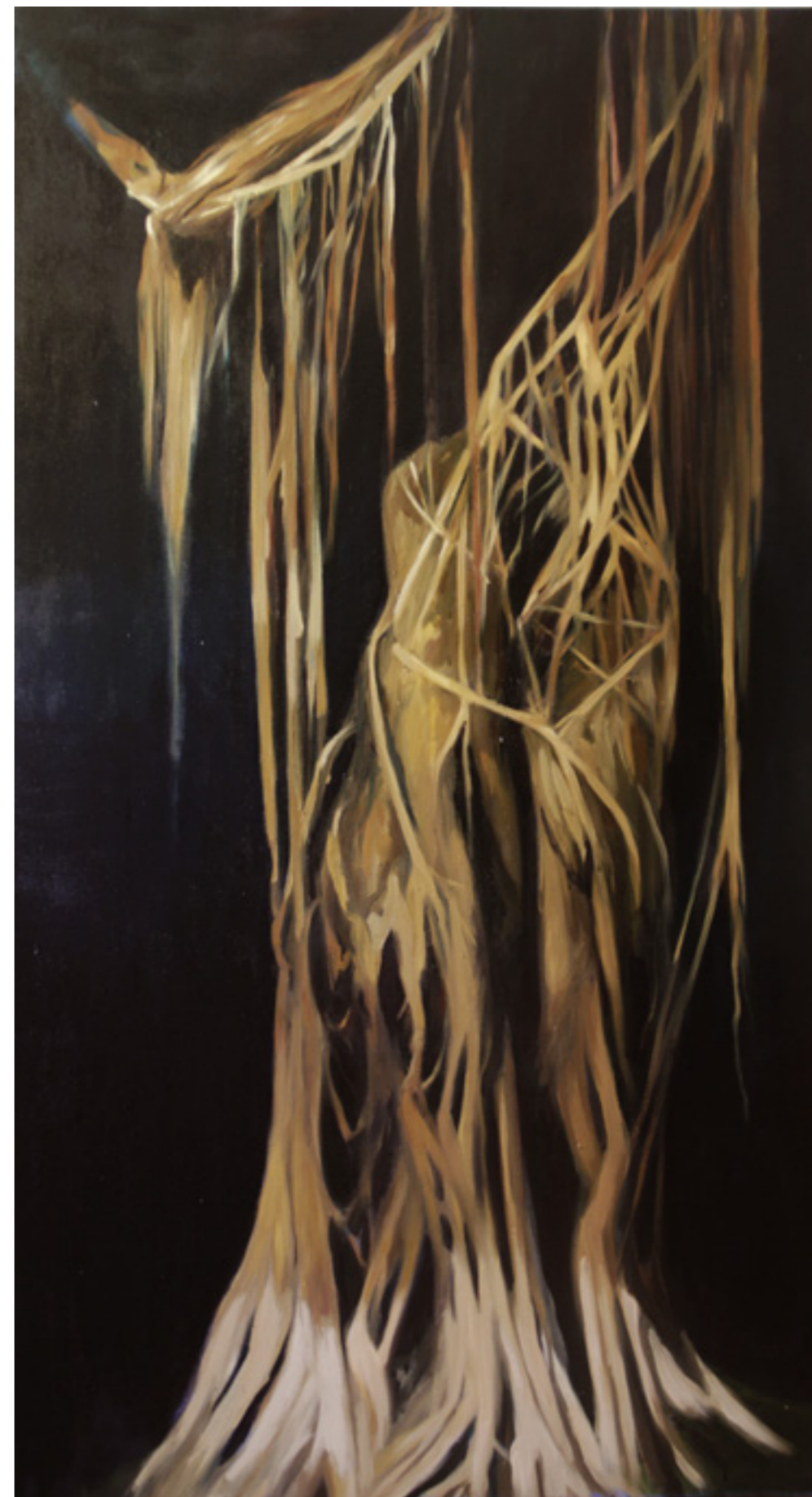
Banyan fa 200x110cm olaj,vászon 2020