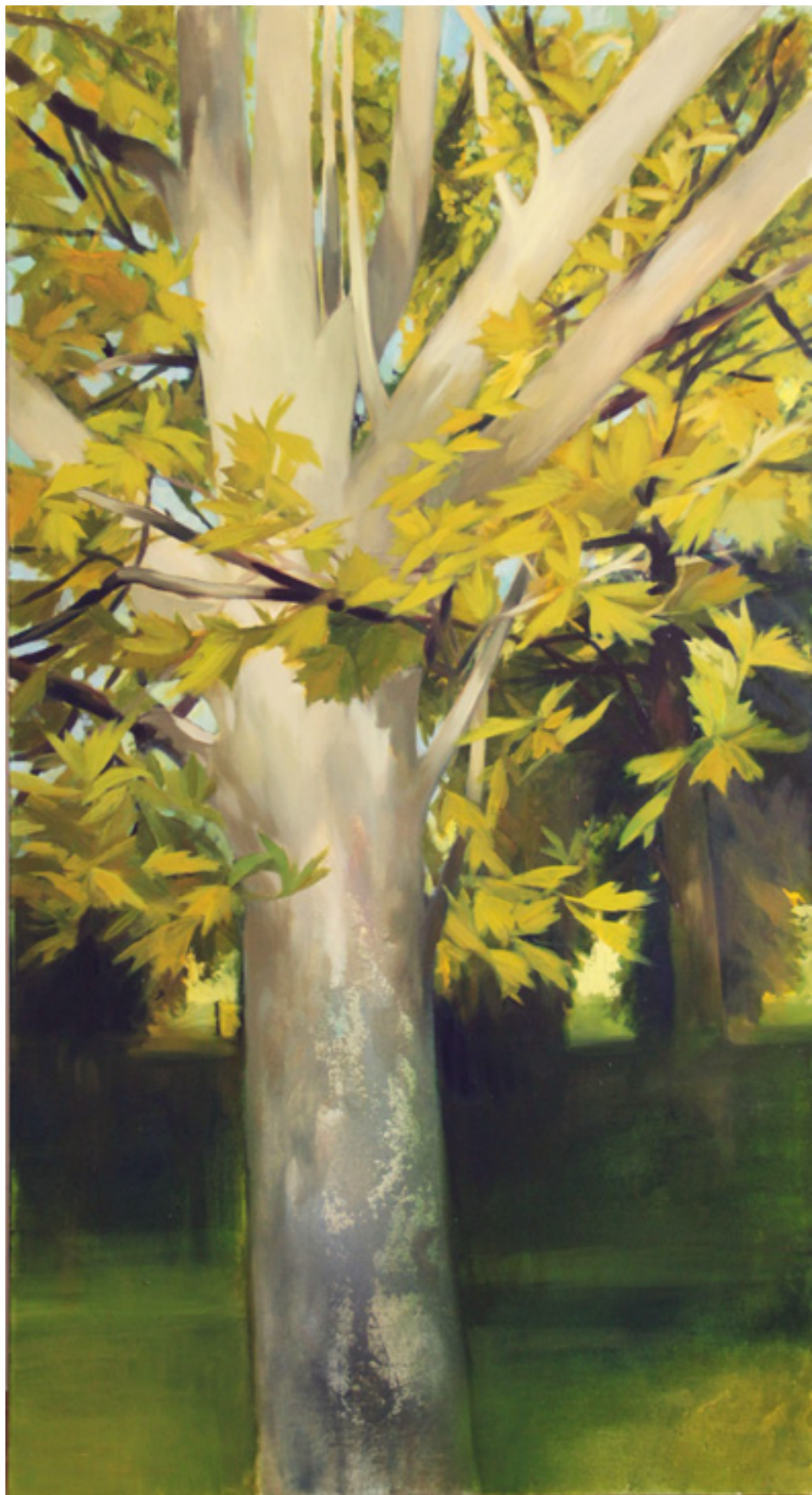
Platán VI. 200x110 cm, olaj, vászon, 2016.