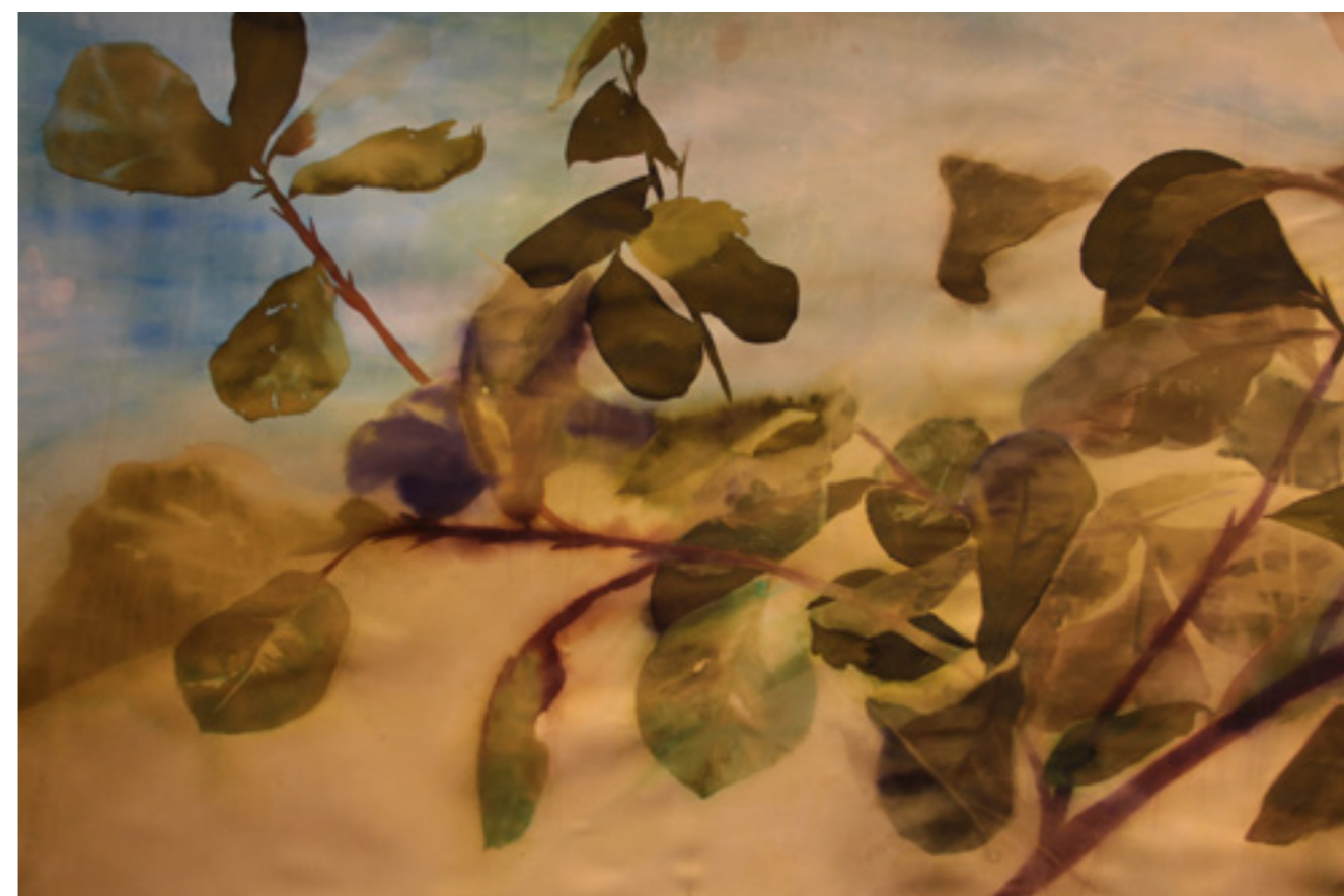
Fríz I. Részlet 109x266 cm, papír, akvarell, 2016.