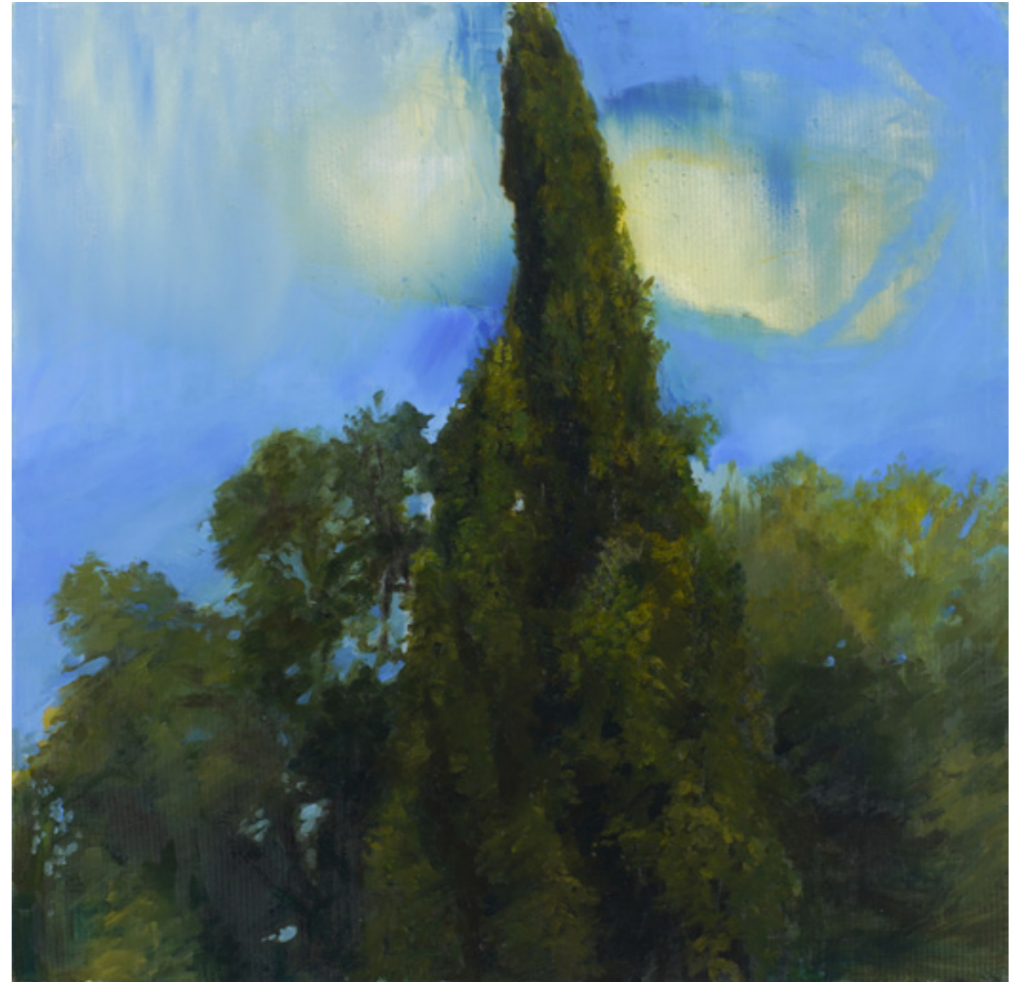
Piramistölgy 90x90c m olaj, vászon 2018.