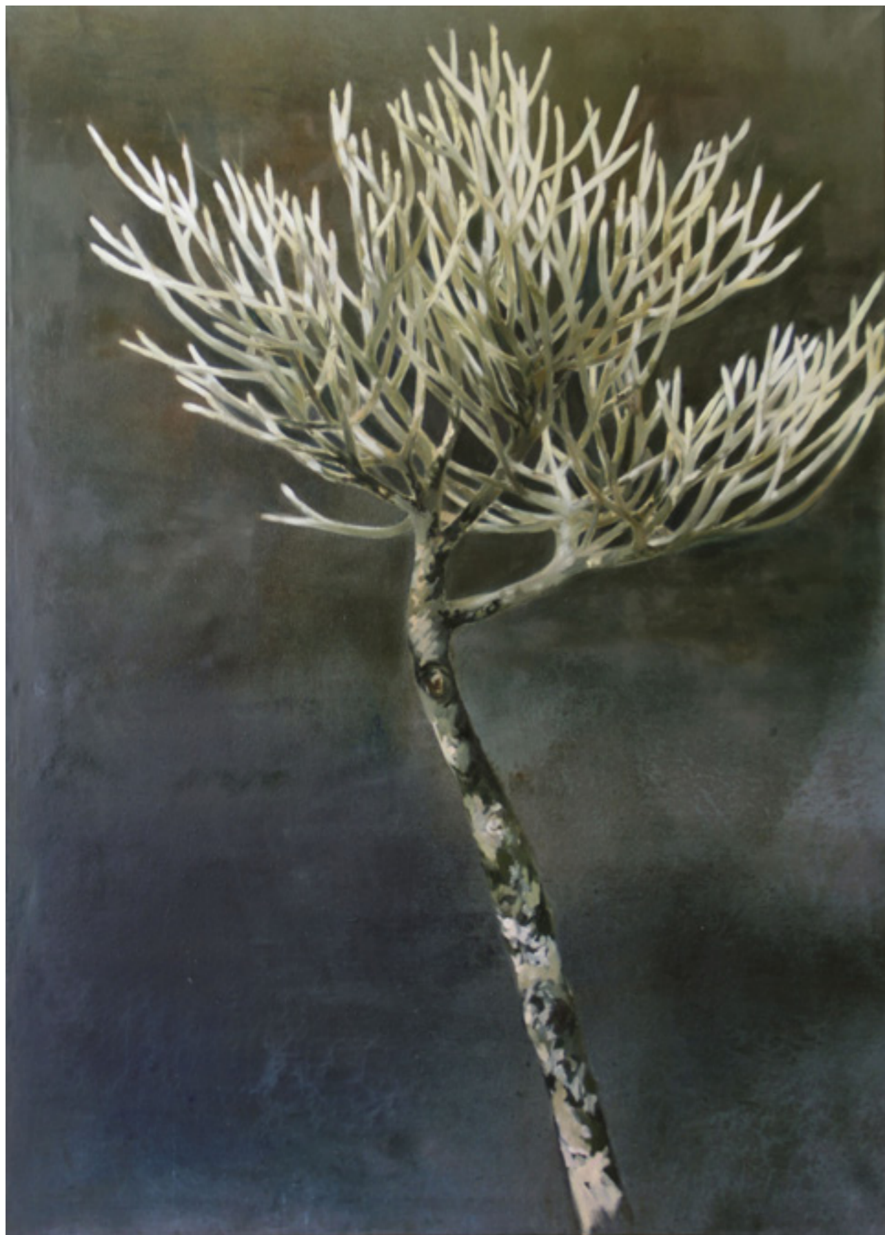
Champa fa 150x110cm olaj,vászon 2019.