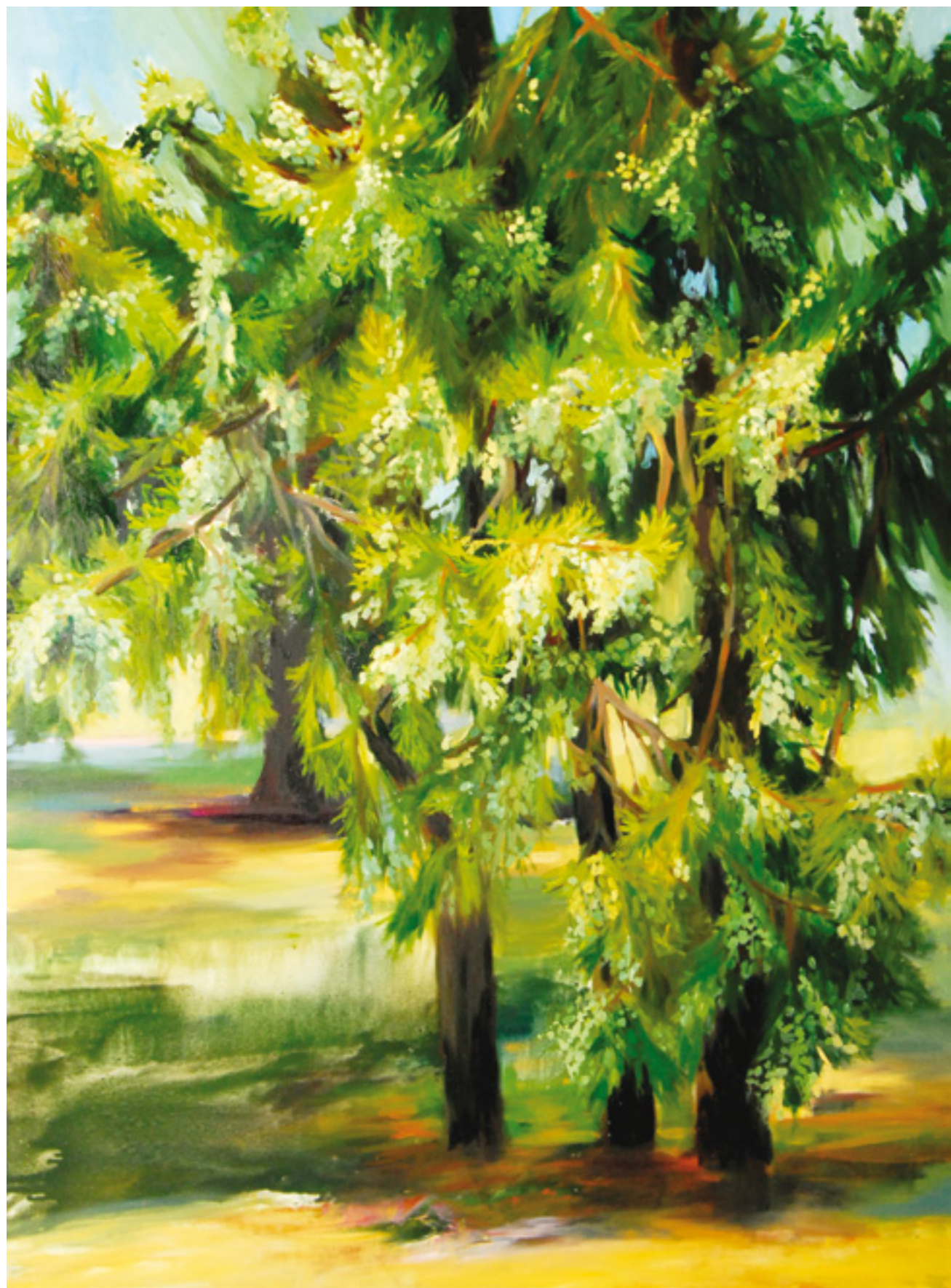
Fenyő III. 150x110 cm, olaj, vászon, 2015.