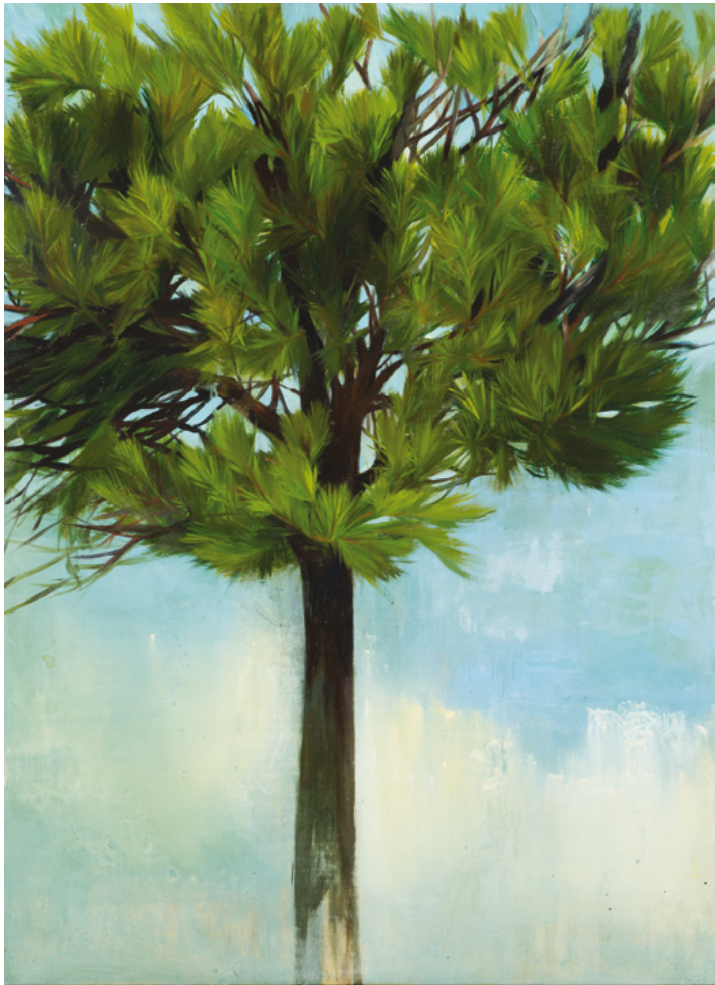
Pinea 150x110 cm, olaj, fa, 2015.