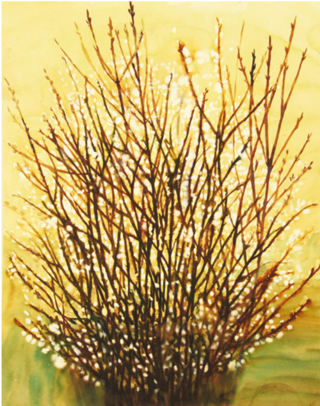
Barka 100x135 cm, papír, ecolin, 2016.