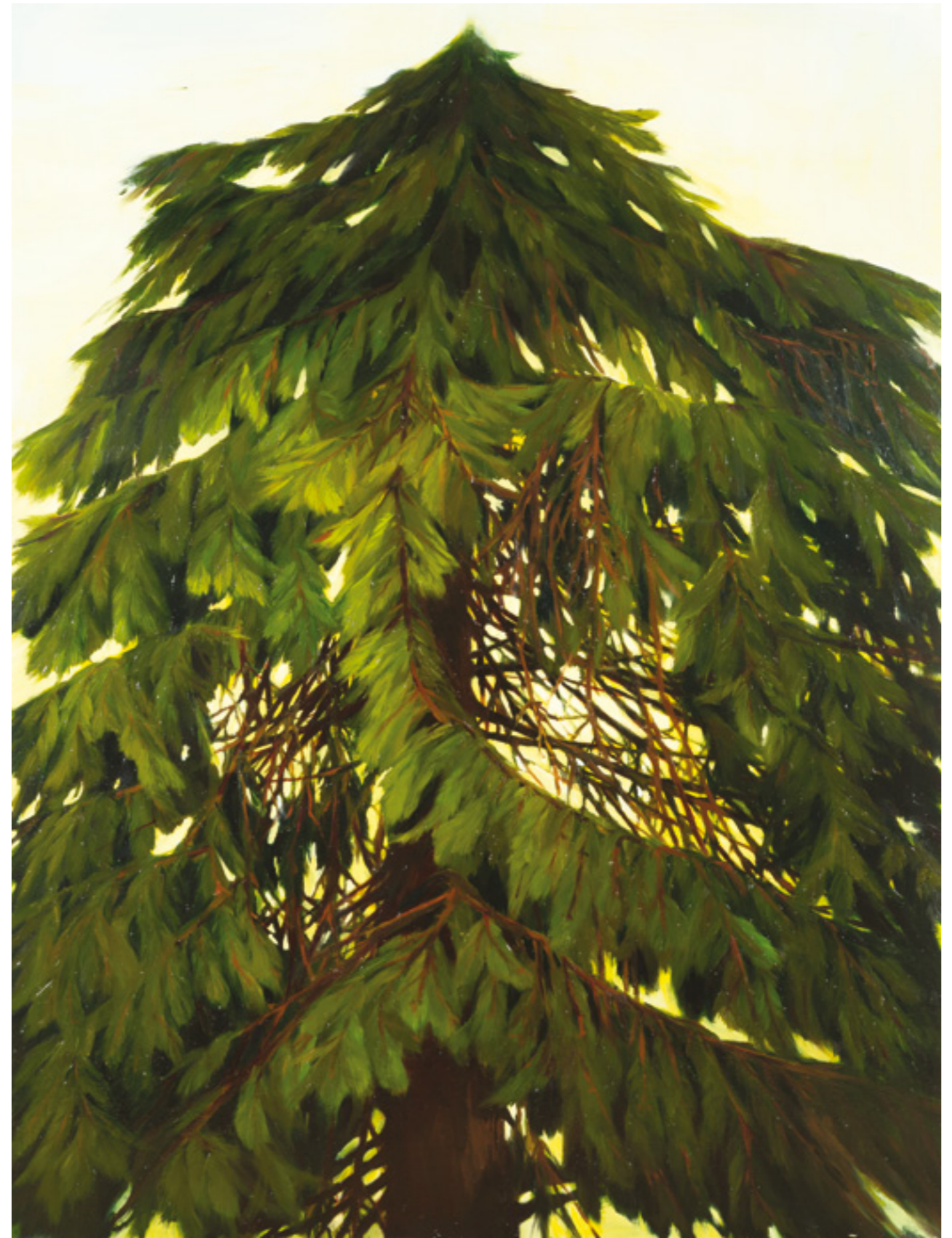
Fenyőfa 170x110 cm, olaj, fa, 2015.