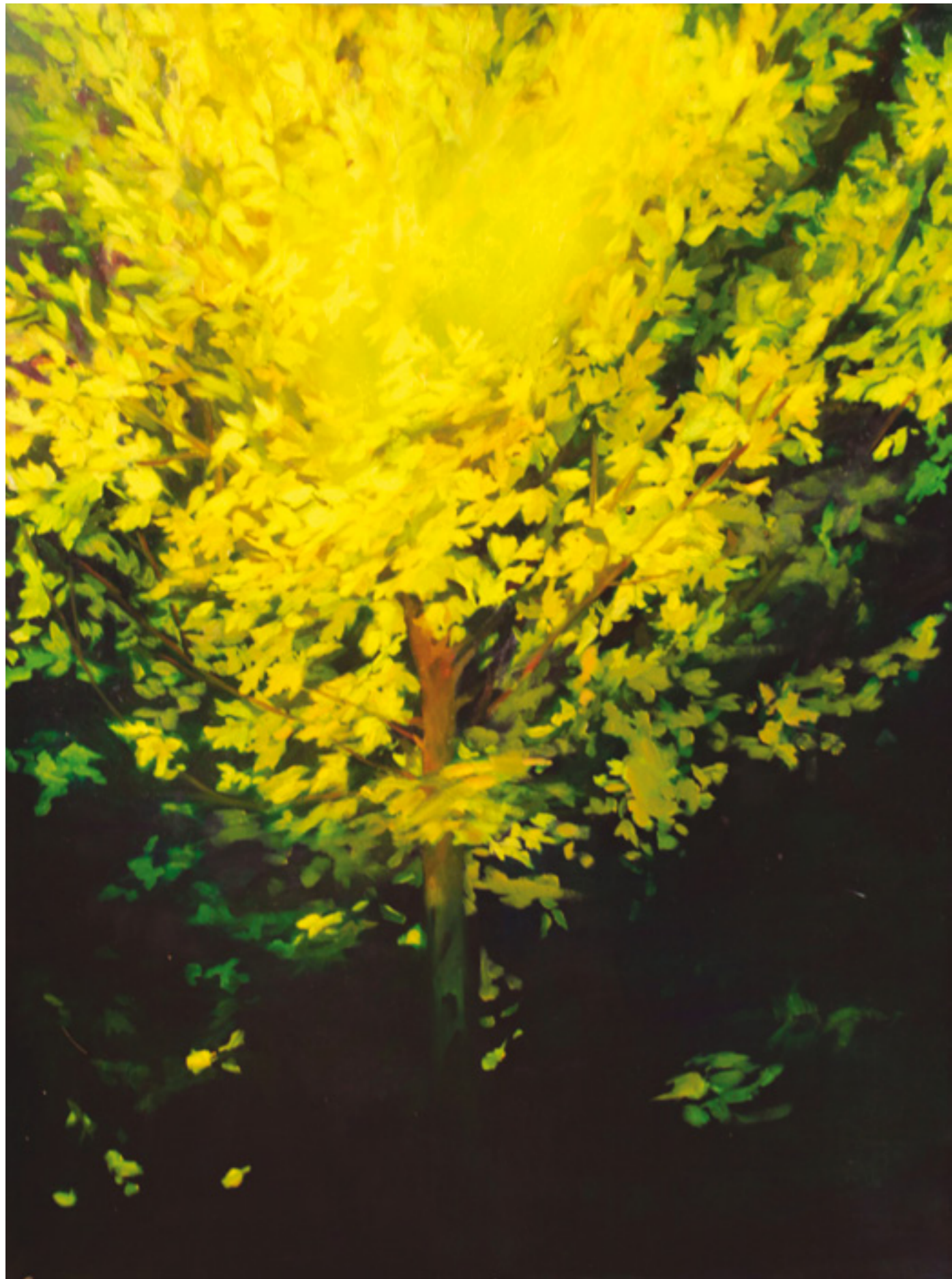
Éjszakai Fa II. 160x120 cm, olaj, vászon, 2015.