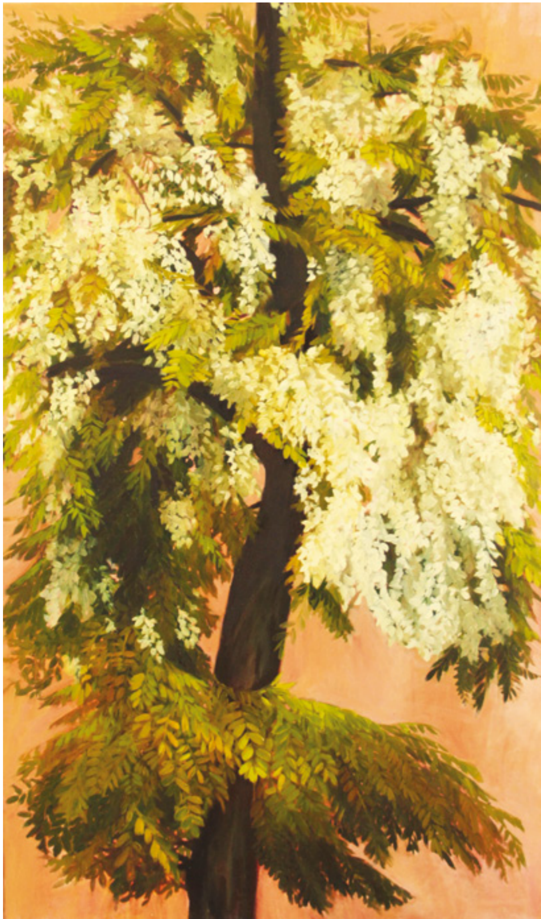
Akác 170x110 cm, olaj, vászon, 2016.