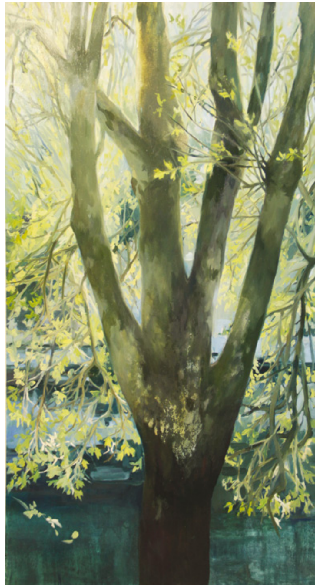
Római Platán 200x110 cm, olaj, vászon, 2015.