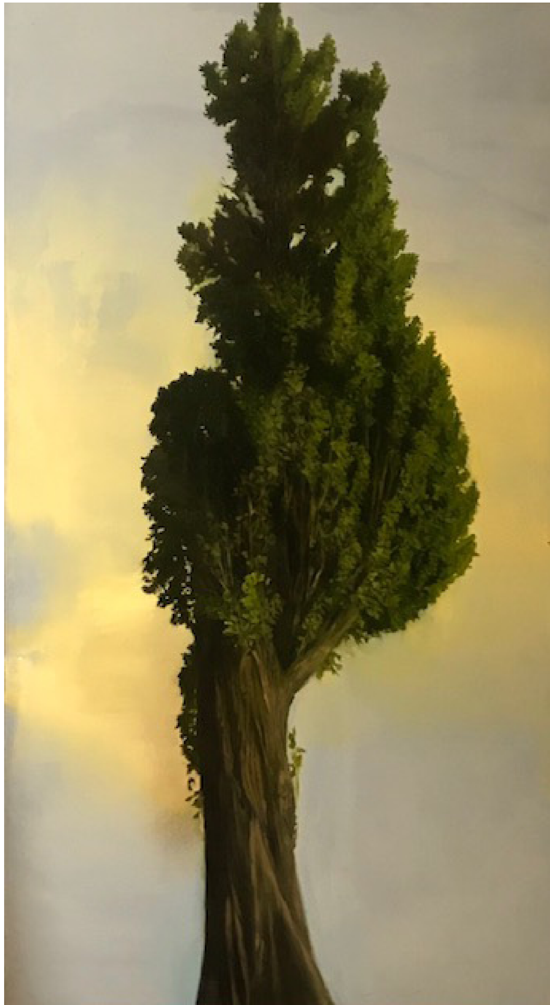
Jegenye I. 200x110cm olaj, vászon 2019.