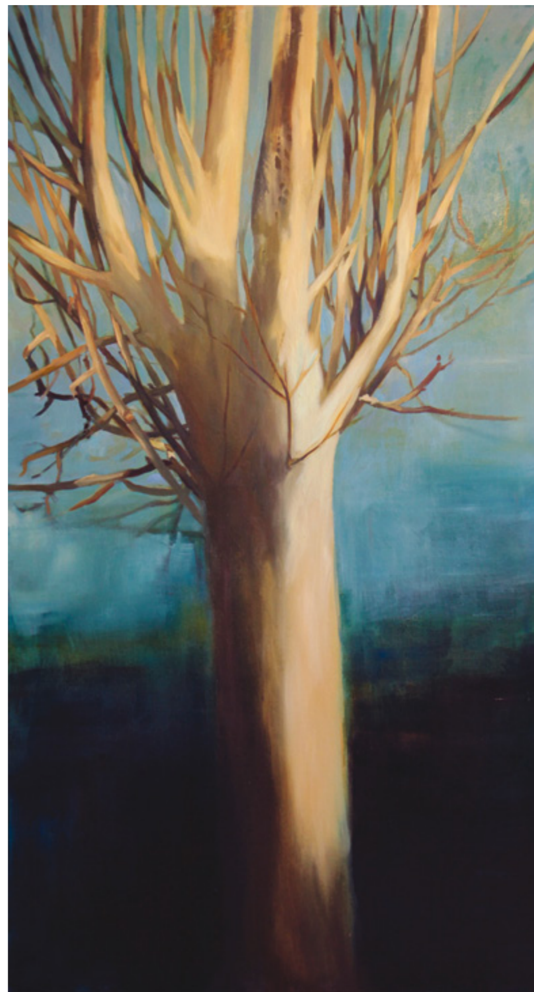
Platán VII. 200x110 cm, olaj, vászon, 2016