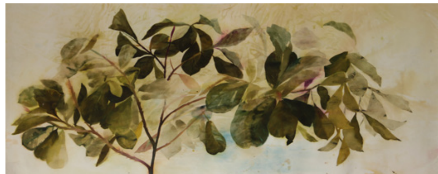
Fríz II. 109x266 cm, papír, akvarell, 2018.