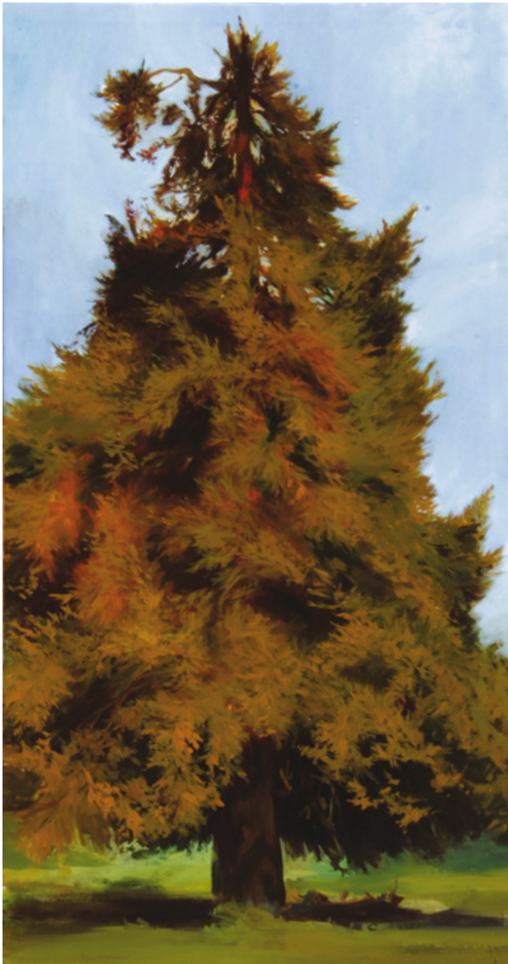
Fenyő II. 200x110 cm, olaj, vászon, 2016.