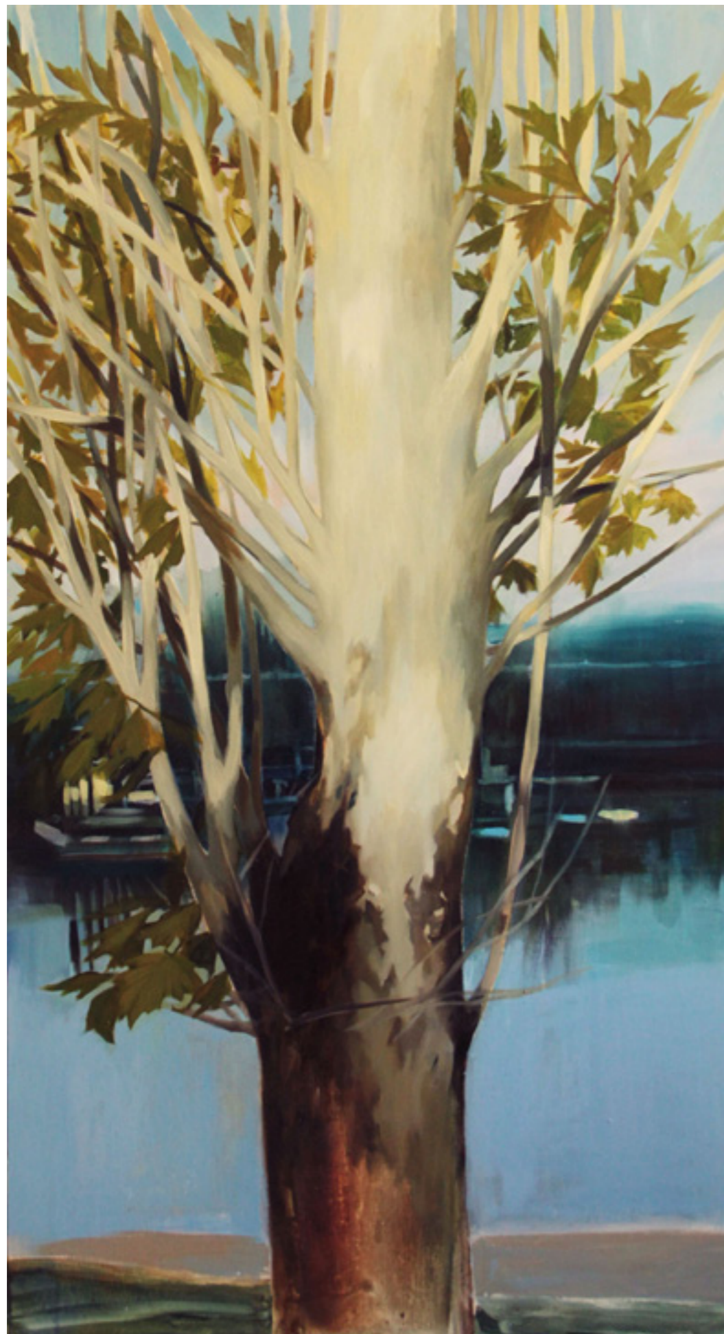
Platán IV. 200x110cm olaj,vászon 2016.