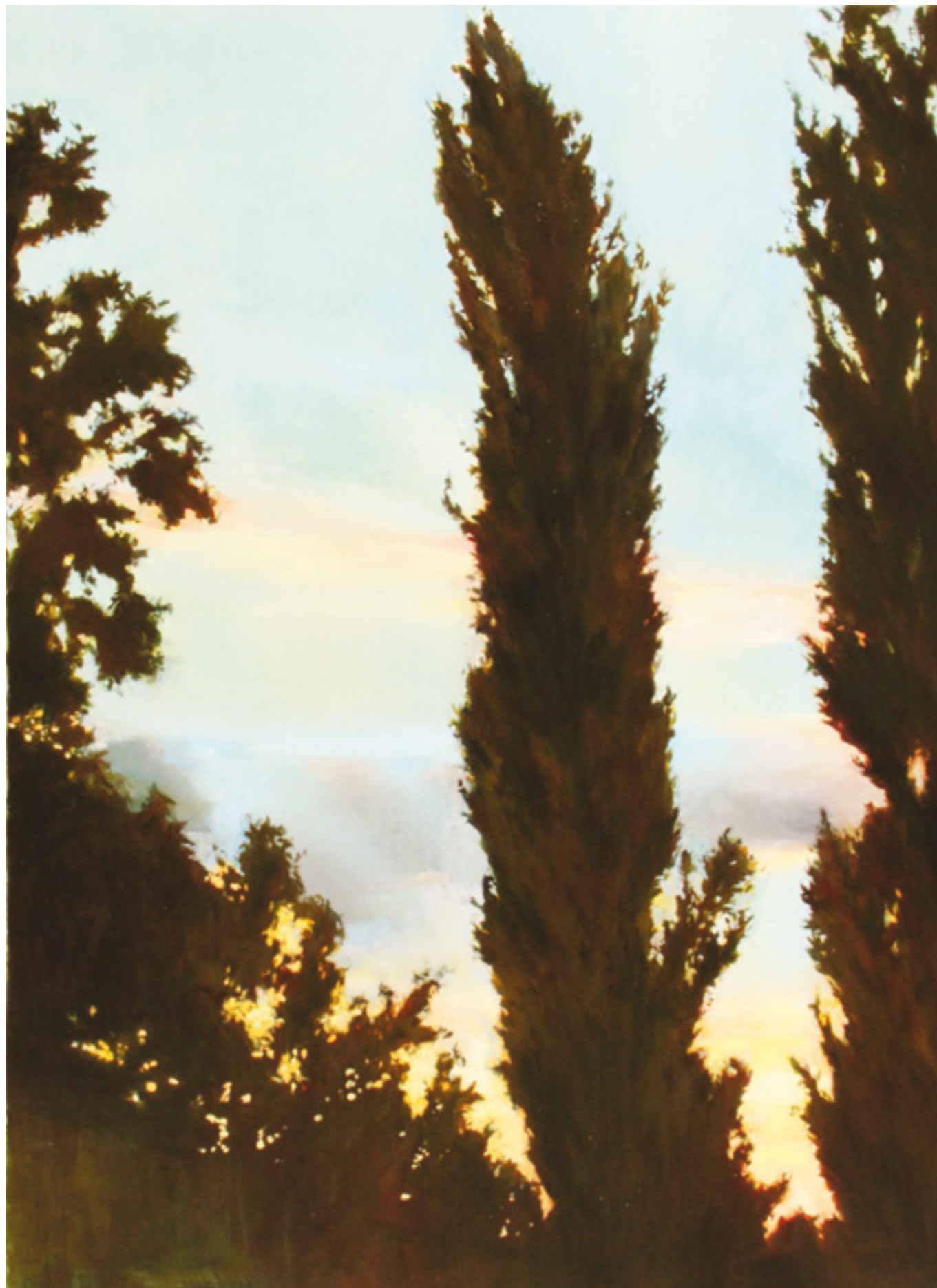
Jegenye 150x110 cm, olaj, vászon, 2016.