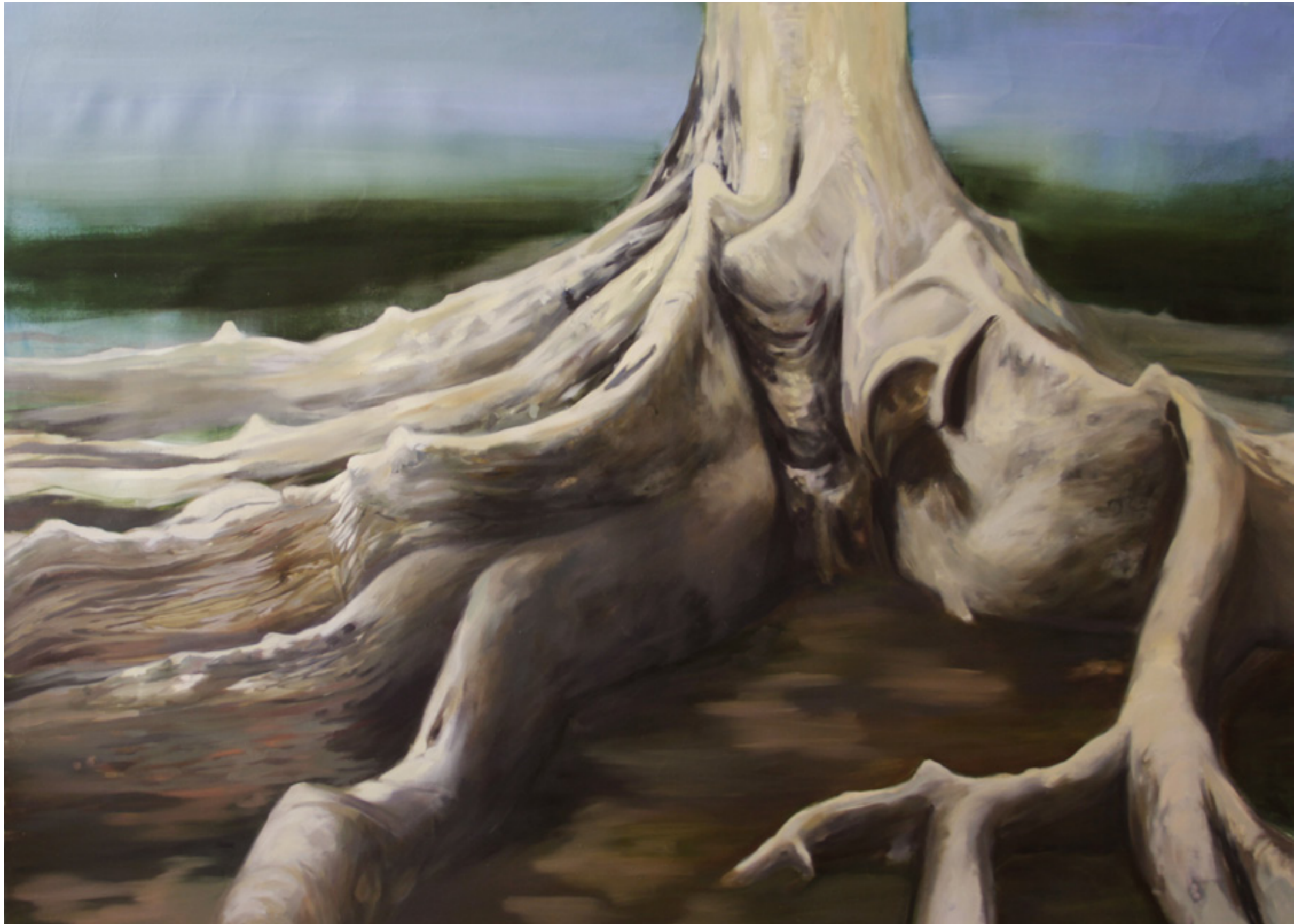
Kalimantan 160x200cm olaj,vászon 2020.