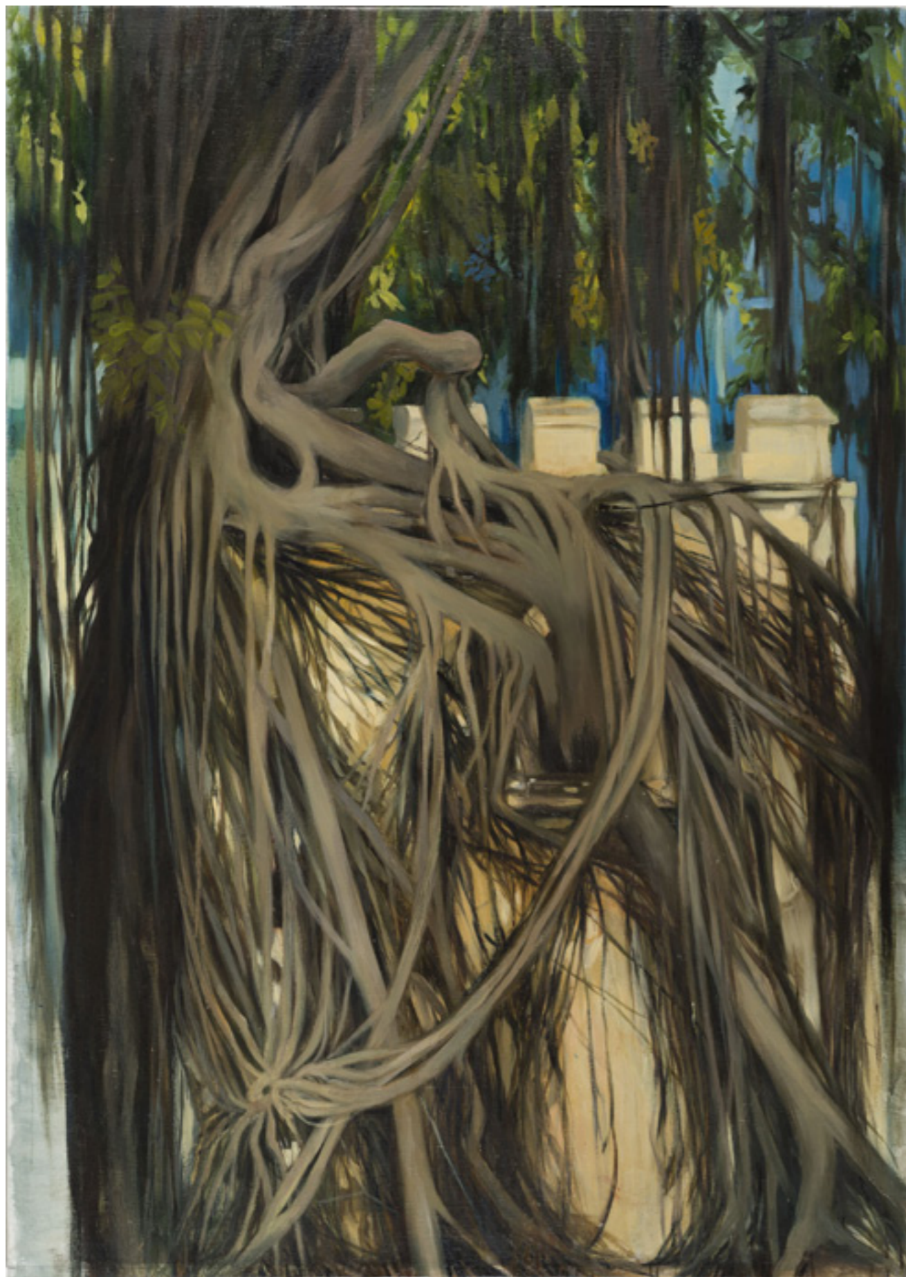
Bástya olaj, vászon 170x120cm 2017.