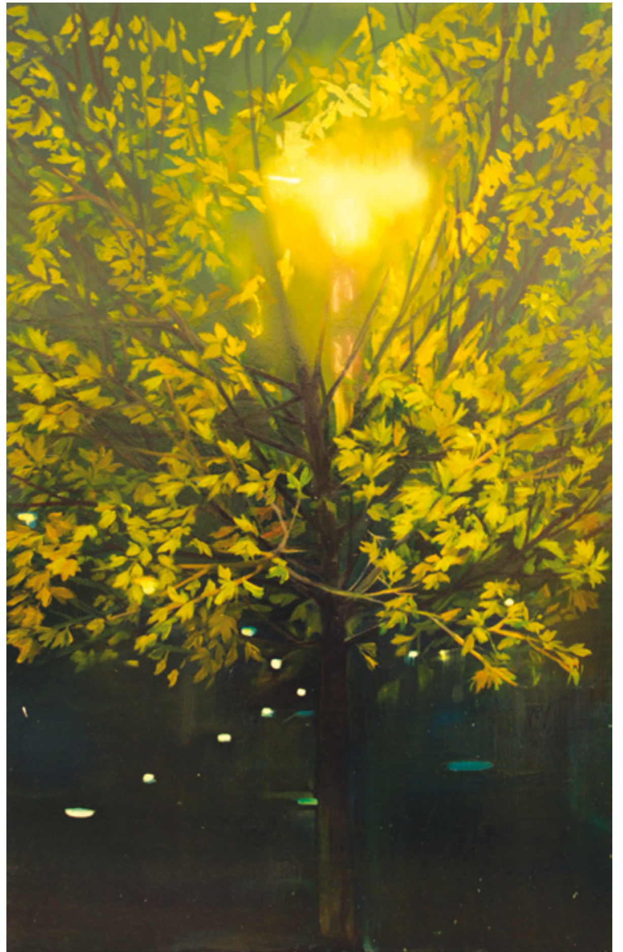
Éjszakai Fa 150x110 cm, olaj, fa, 2015.