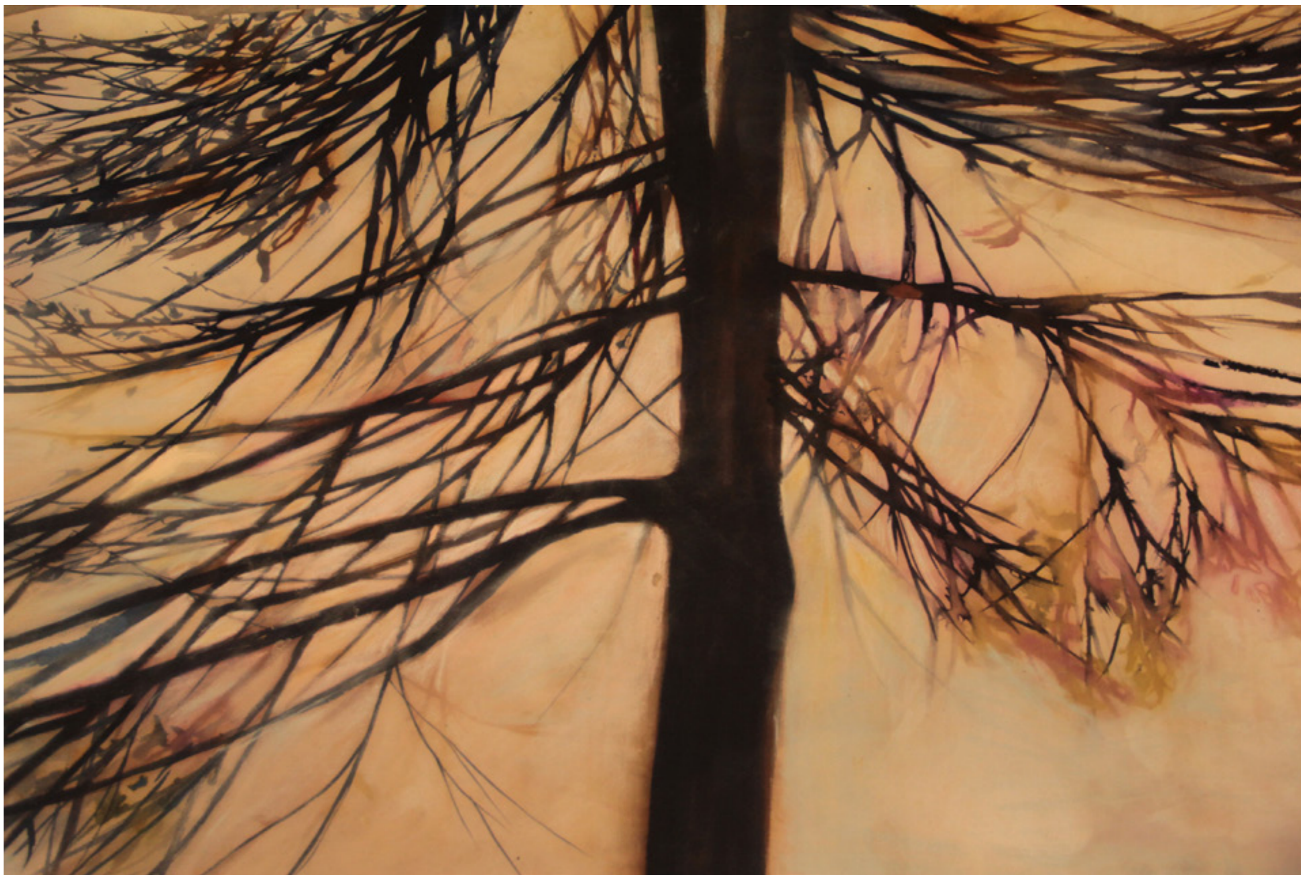
Téli Fa 104x180 cm papír,akvarell, 2016.