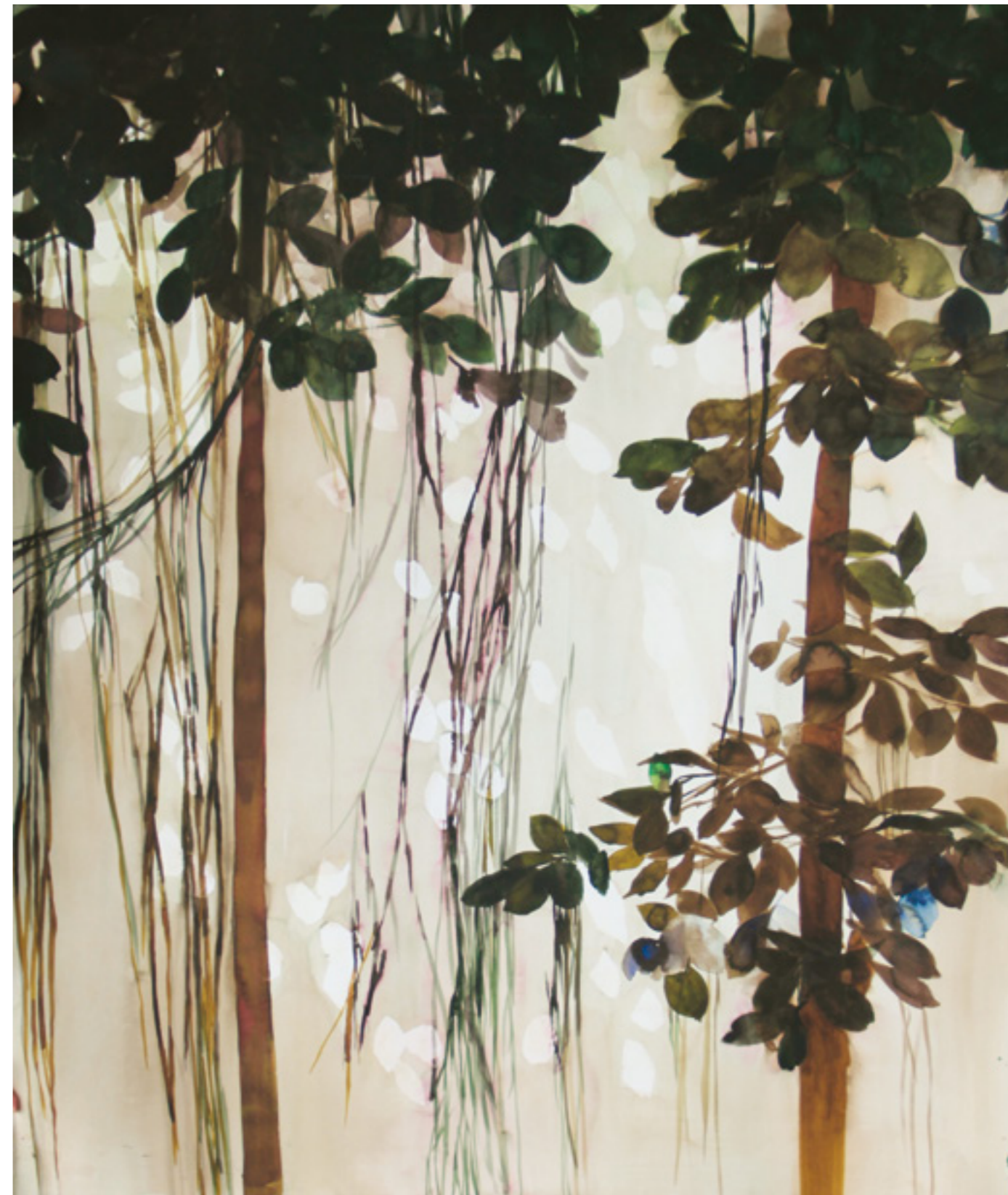
Indás fa 150x110cm papír, akvarell 2017.