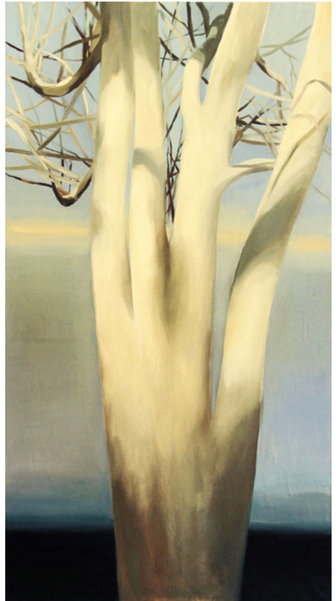
Platán III. 200x110cm olaj,vászon 2016.