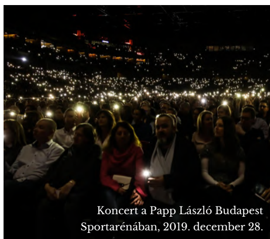
Koncert a Papp László Budapest Sportarénában, 2019. december 28.