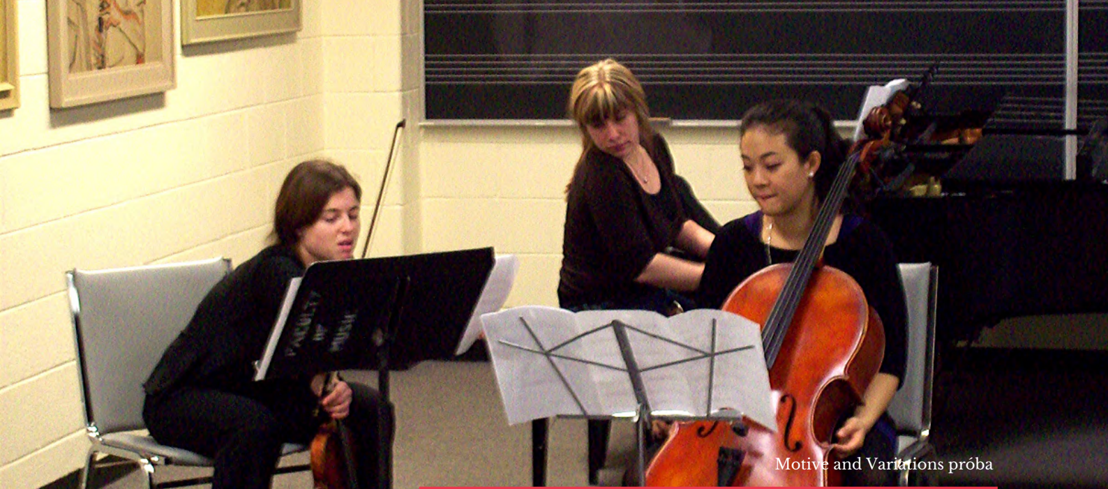
Motive and Variations próba