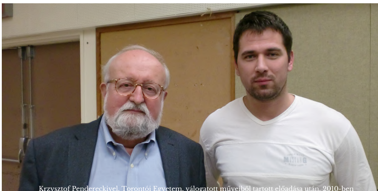
Krzysztof Pendereckivel, Torontói Egyetem, válogatott műveiből tartott előadása után, 2010-ben

Szvit vonószenekarra . Bemutatója a Music Galleryben volt, Torontóban, közreműködött: CCMW vonószenekear.