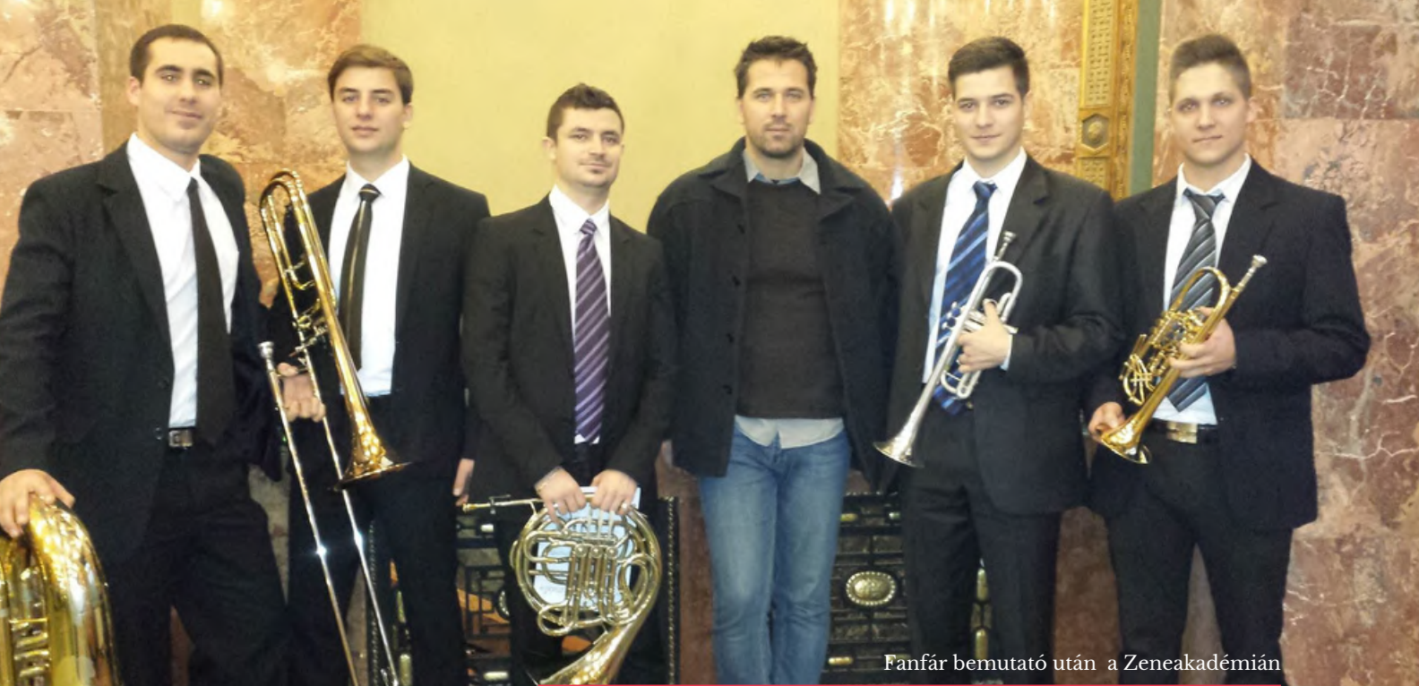
Fanfár bemutató után a Zeneakadémián