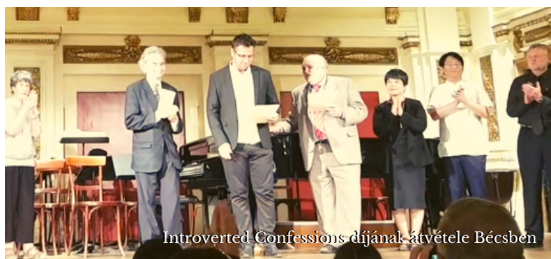
Introverted Confessions díjának átvétele Bécsben