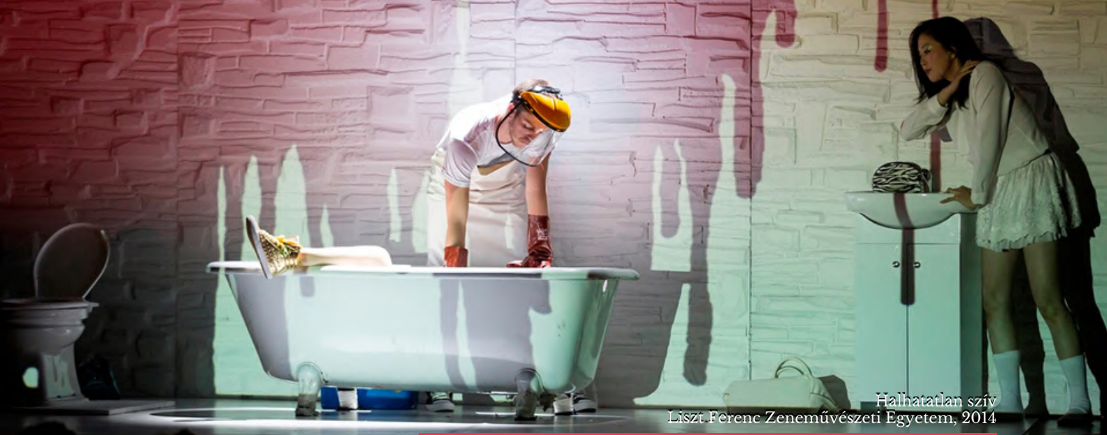
Halhatatlan szív Liszt Ferenc Zeneművészeti Egyetem, 2014