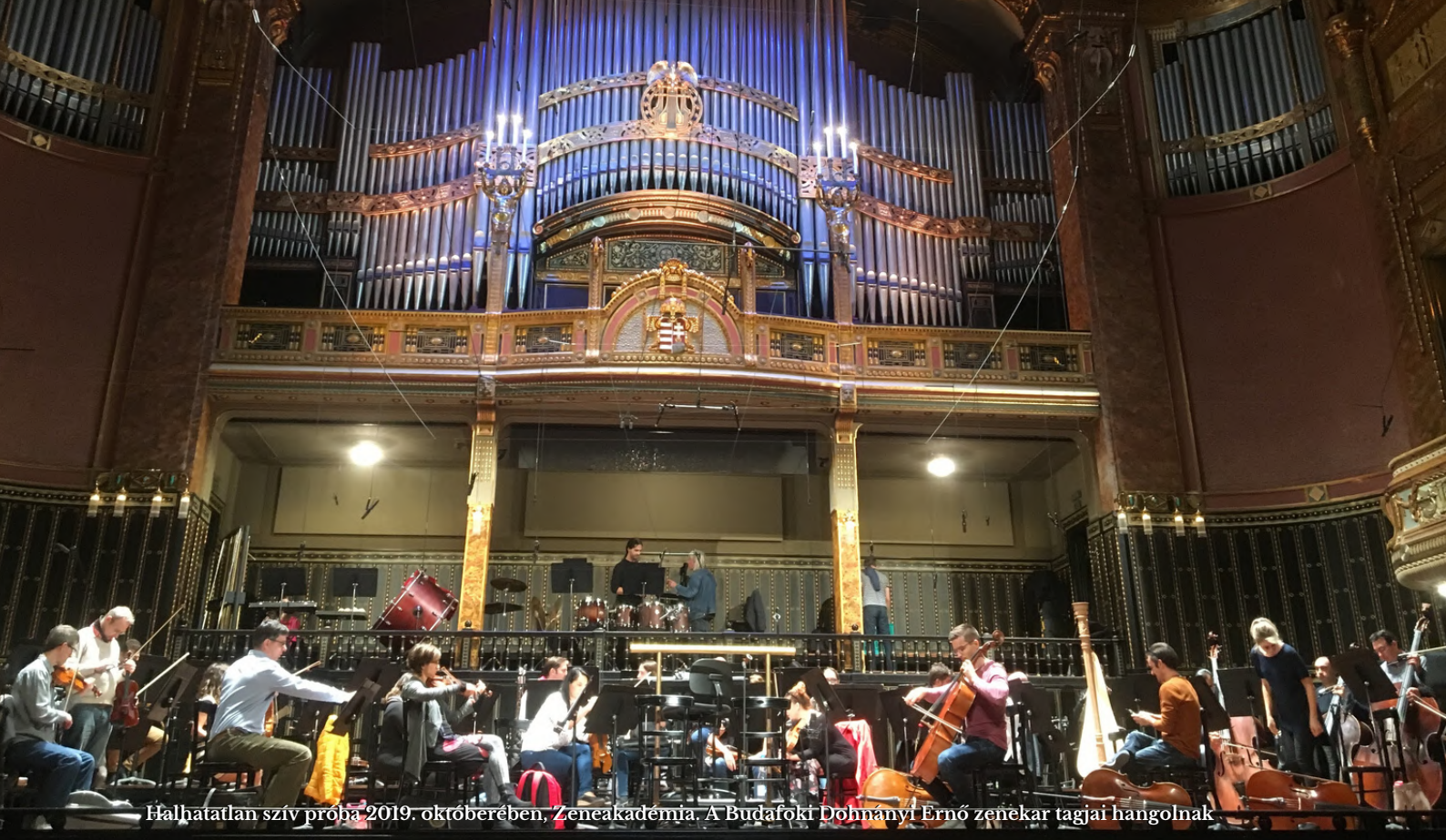
Hálhatatlan szív próba 2019. októberében, Zeneakadémia. A Budafoki Dohnányi Ernő zenekar tagjai hangolnak