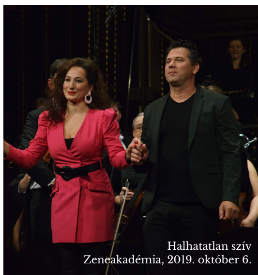
Halhatatlan szív Zeneakadémia, 2019. október 6.