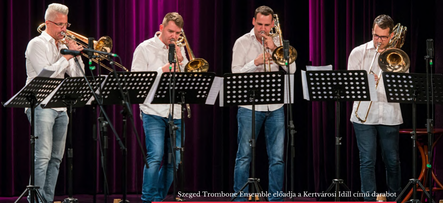
Szeged Trombone Ensemble előadja a Kertvárosi Idill című darabot