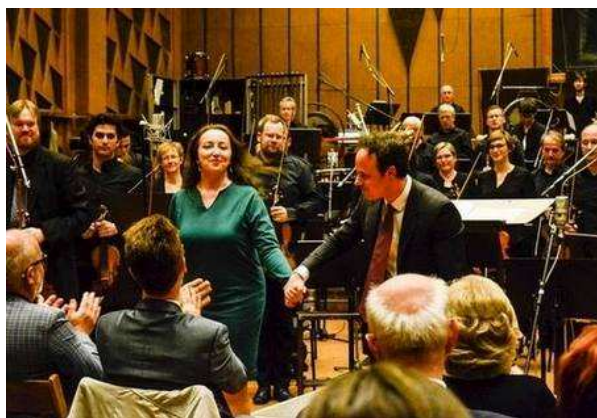
/Crann Bethadh c művem premiere a MagyarRádió szimfonikus zenekarával, vezényelt: Madaras Gergely karmester

Debreceni Lyra Szimfonikus Zenekar /darabommat vezényelte: Balogh József/