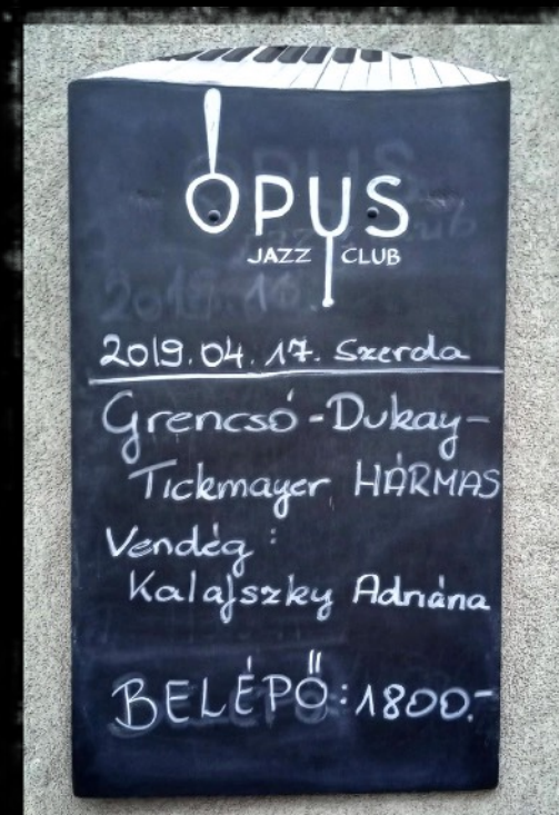
Grencsó-Dukay-Tickmayer HÁRMAS, Opus Jazz Club, 2019