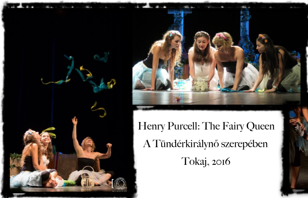
Henry Purcell: The Fairy Queen