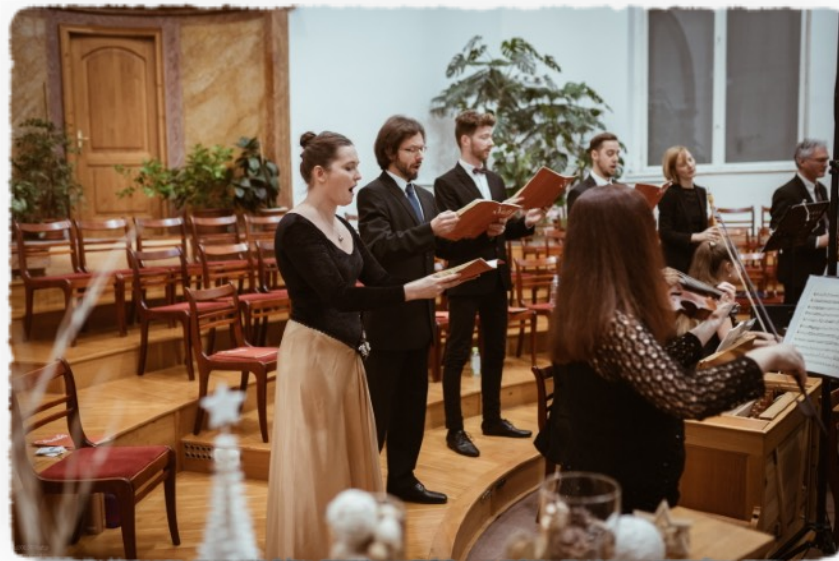
Bach kantáták, Wesselényi utcai Baptista templom, 2017