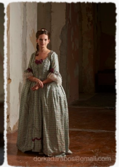
Cantates françaises, 2016

Henry Purcell: Dido and Aeneas, Budavári Aula, 2019