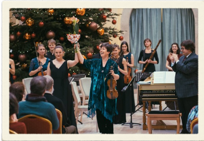
Budapest Bach Consort Academy Debretzeni Katival, 2018