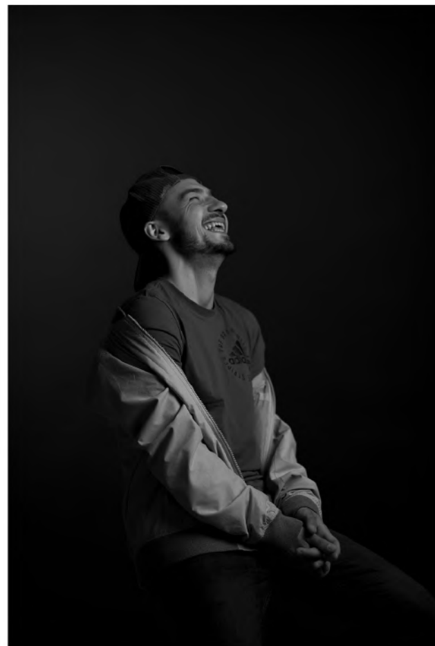
@berta csongor - bongor