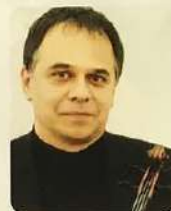
Rónaszéki Tamás hegedűművész