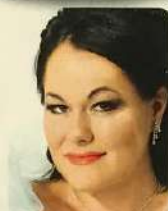
Blaskó Bernadett operaénekes Magyar Állami Operaház Magánénekes