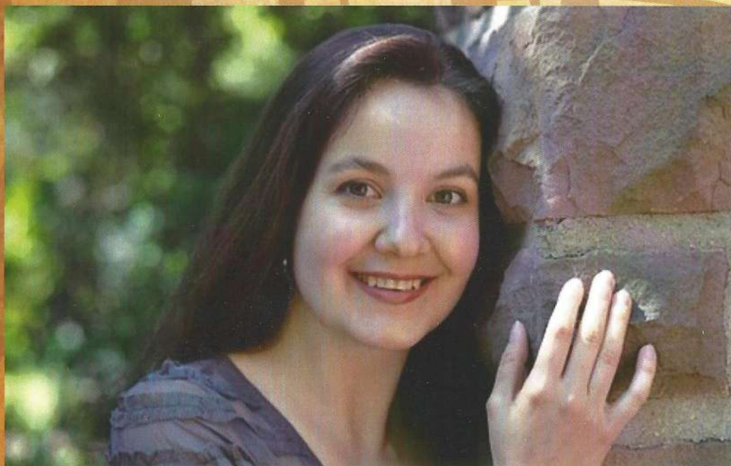
Csővári Csilla operaénekes