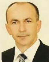
Haszilló Ferenc zongoraművész