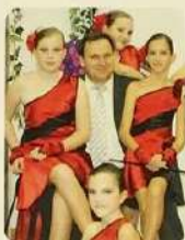
Kiskőrös város mazzorettsportja