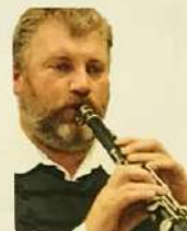
Vesztergám Miklós tárogatóművész