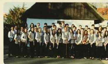
Kiskőrös város fúvószenekara