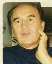
Németh József operaénekes Liszt díjas érdemes művész