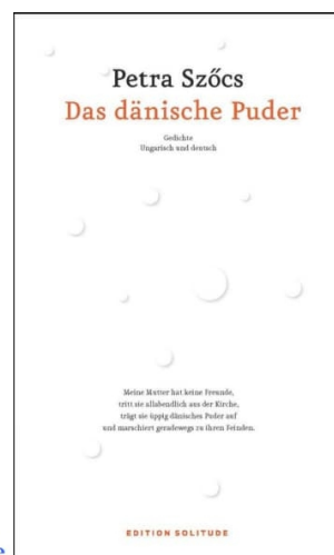
A dán púder/Das dänische Puder, 2017 Solitude