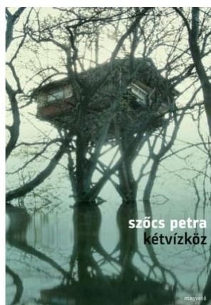
Kétvízköz, 2013 Magvető