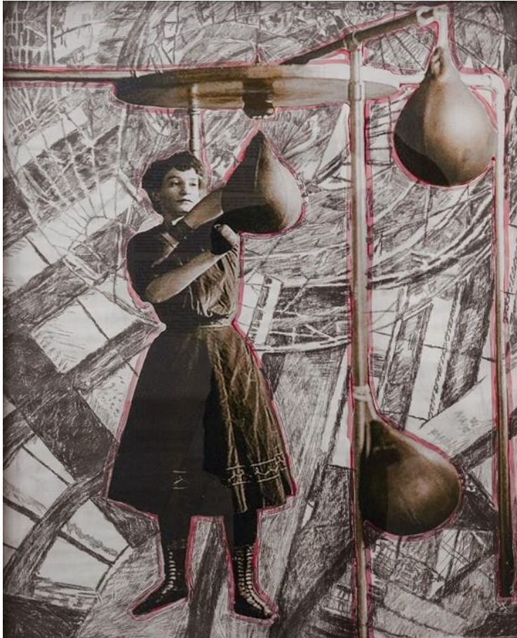
MAXXII. vegyestechnika, fotó, akril, olaj, 80x60 cm, 2019.