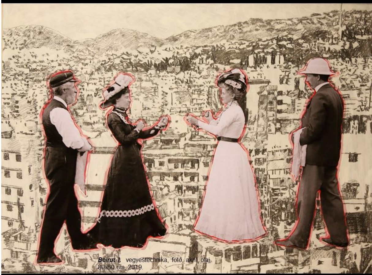
Beirut I vegyestechnika, fotó, akril, olaj, 80x60 cm, 2019.