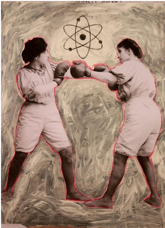
Atom vegyestechnika, fotó, akril, olaj, 80x60 cm, 2019.