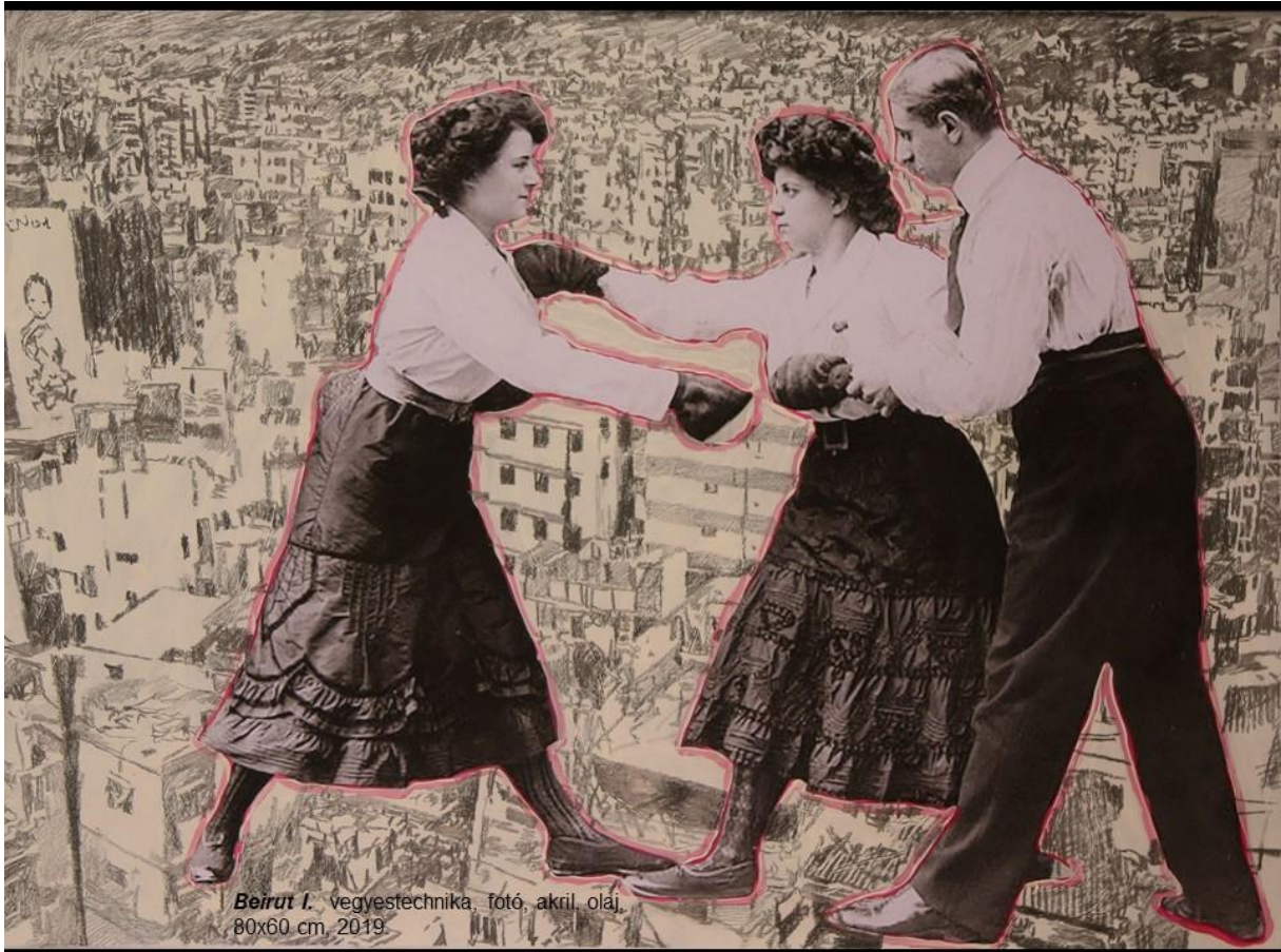
Beirut I. vegyestechnika, fotó, akril olaj, 80x60 cm, 2019.