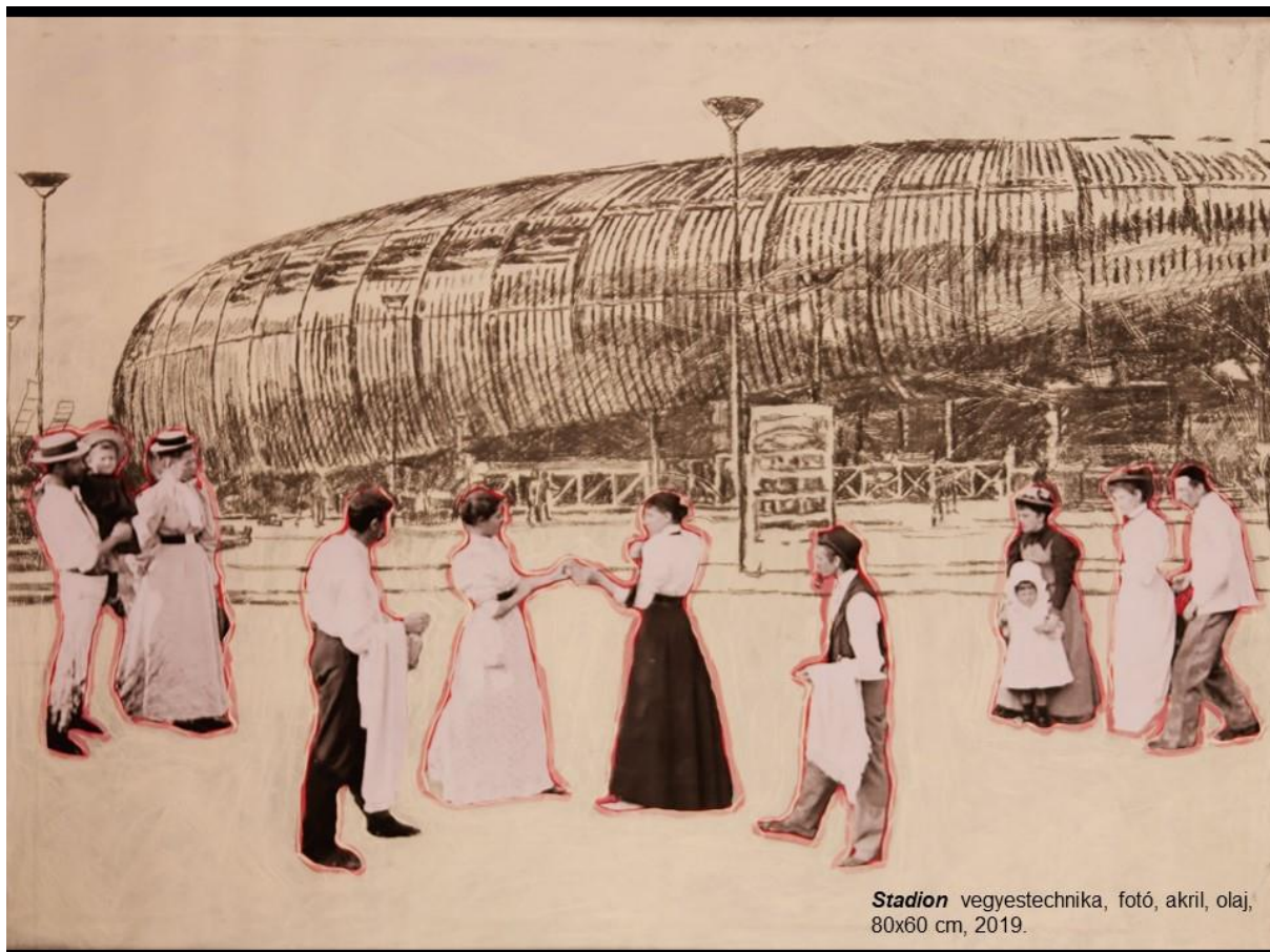
Stadion vegyestechnika, fotó, akril, olaj, 80x60 cm, 2019.