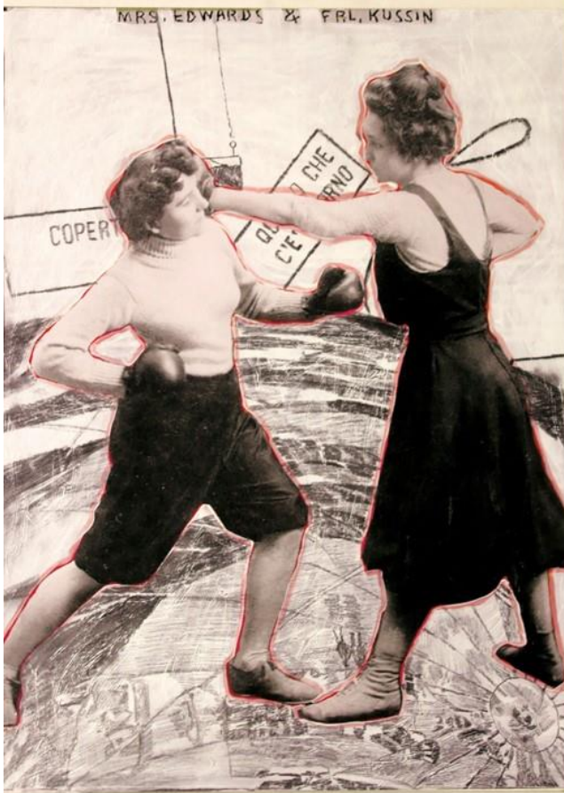
MAXXII. vegyestechnika, fotó, akril, olaj, 80x60 cm, 2019.