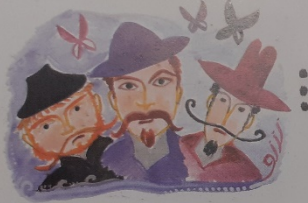
Három szabólegények, mek ...