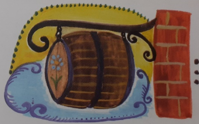
Egy kocsmába betértek, mek ...