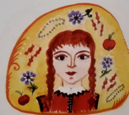
Szép élet a nagy leányé