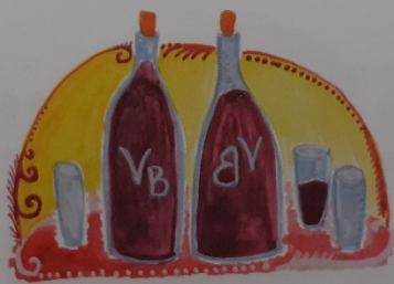
Kértek két liter (deci) bort