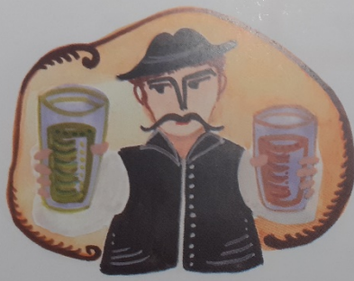
Keserű víz, nem hittem, hogy édes légy