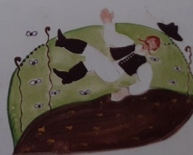
Kivetik a ganyédombra