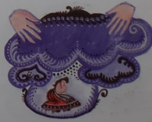
A Jóisten borítsa rád az eget