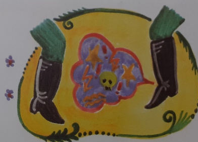
//: Édes lábam jól vigyázz Mert a másik legyaláz ://