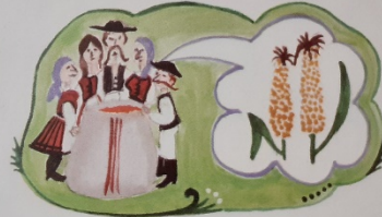
Mind azt mondják törökbúza