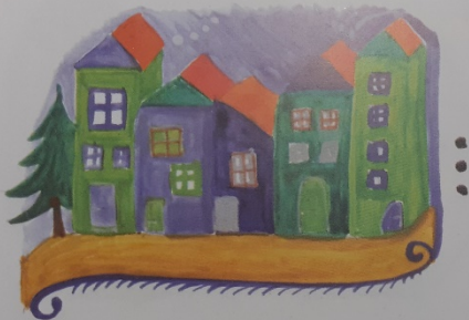
Mikor Micskére értek, mek ...