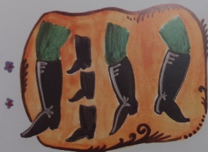
//: Ez a lábam, ez, ez, ez Jobban járja mint emez ://