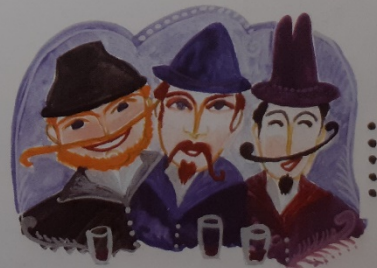
Hogy lemossák az úti port, mek