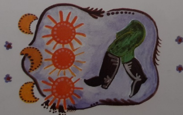
//: Három éjjel, három nap Nem elég a lábamnak ://