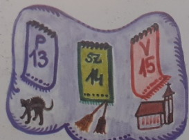
Máma péntek, holnap szombat, vasárnap