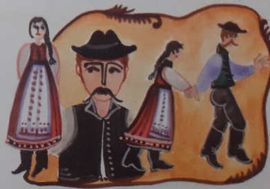
Régi babám, nem hittem, hogy csalfa légy