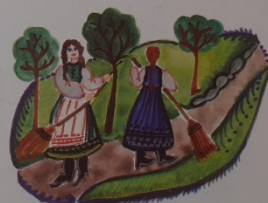
Sepregetnek a visai leányok