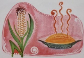
Törökbúza, édes málé