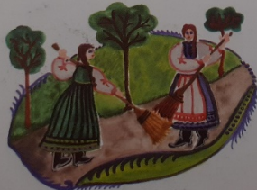
Seperjétek ki az utcát, tisztára