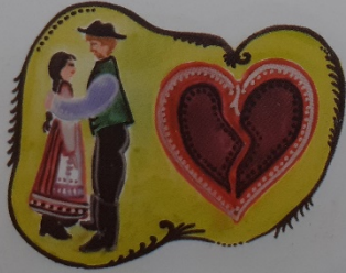
Csalfasággal csaltad meg a szívemet