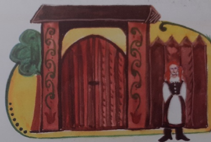
Mind kiteszik a kapuba