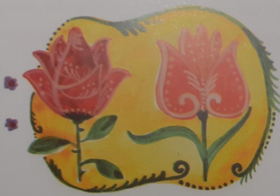
//: Piros rózsza, tulipán