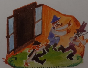
Mint a kecskék kiugráltak, mek

A hegyen s a Gyimeseken átkelve, Felcsíkra érkezünk.