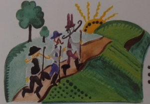
Elindultak szegények, mek ...