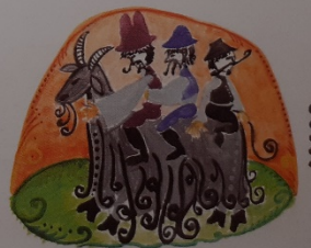
Hárman ültek egy kecskére, mek