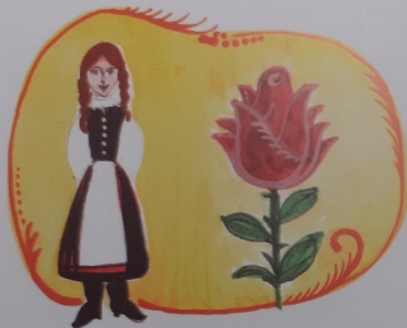
Mert a leány piros rózsza