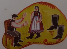
Jön a babám, csikorog a csizmája