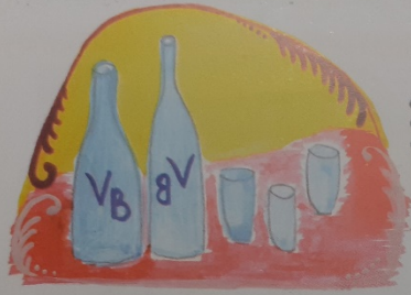
Mikor fizetni kellett, mek