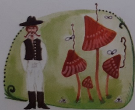
De a legény bűdös gomba