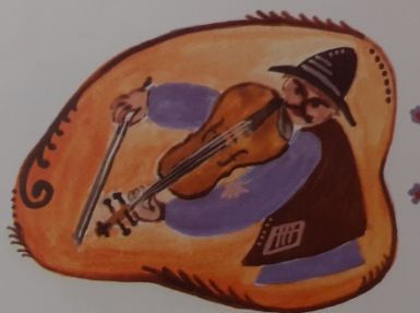
Húzd a nótám te cigány ://