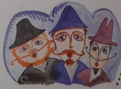
Megjédtek szegények, mek