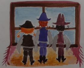
Az ablakhoz álltak