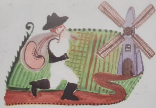
Babot vittem a malomba