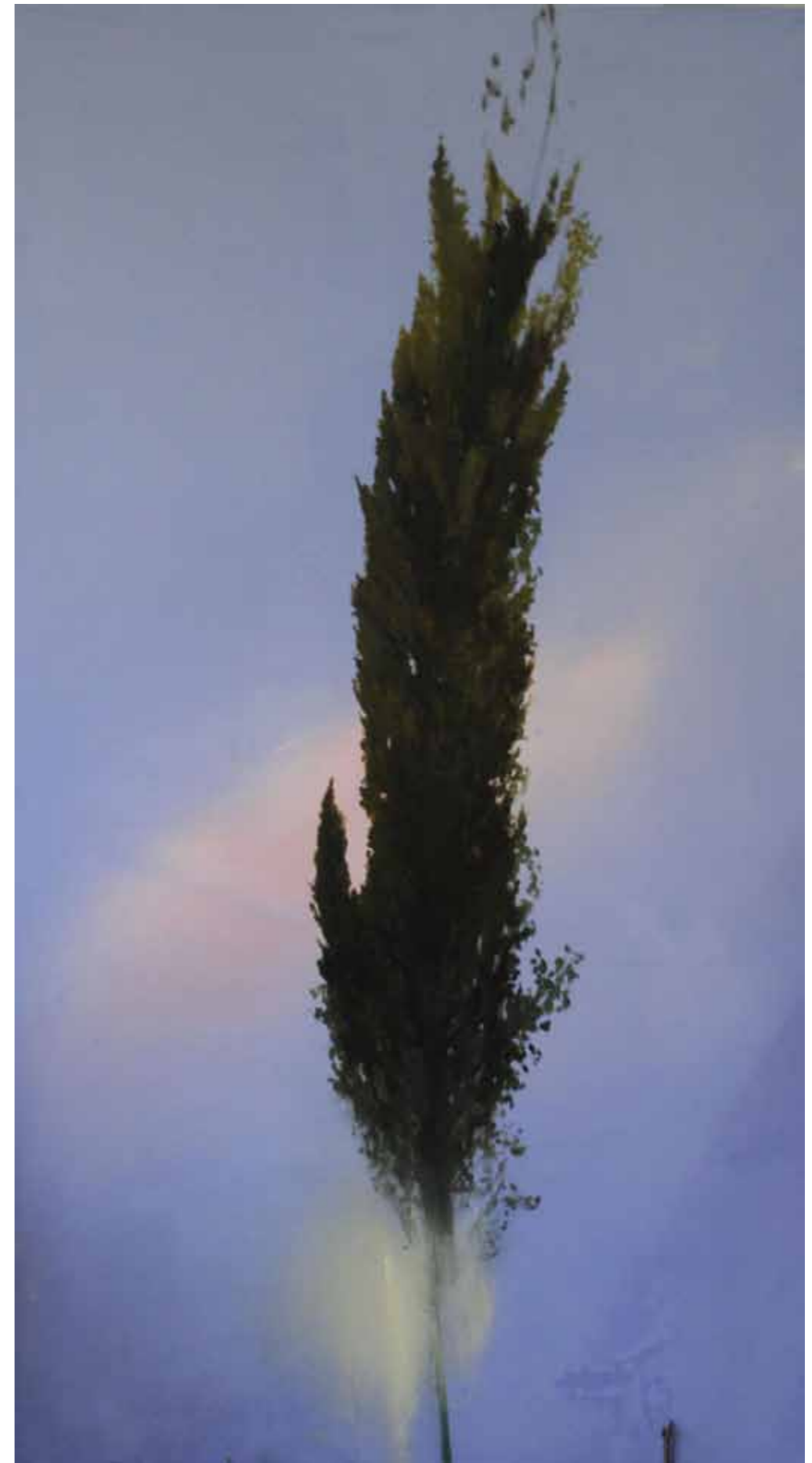
Jegenye sorozat tervezett képe. 200x110cm olaj,vászon 2020.