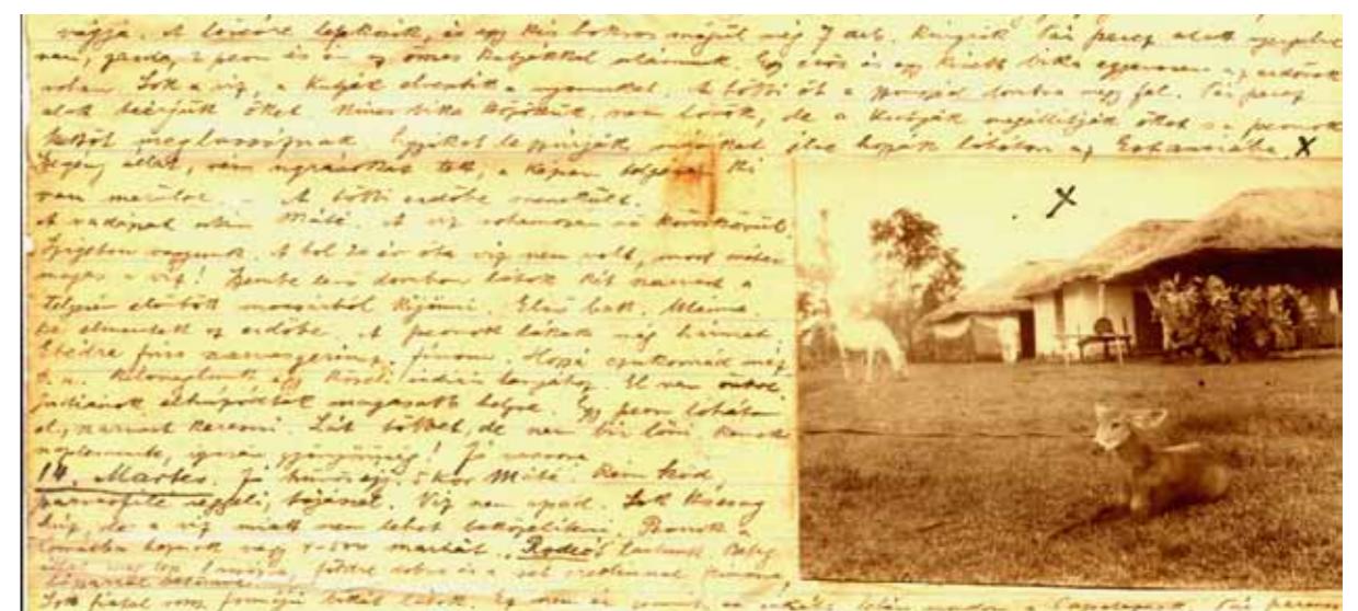
Az öryök honfoglalásának emlékei