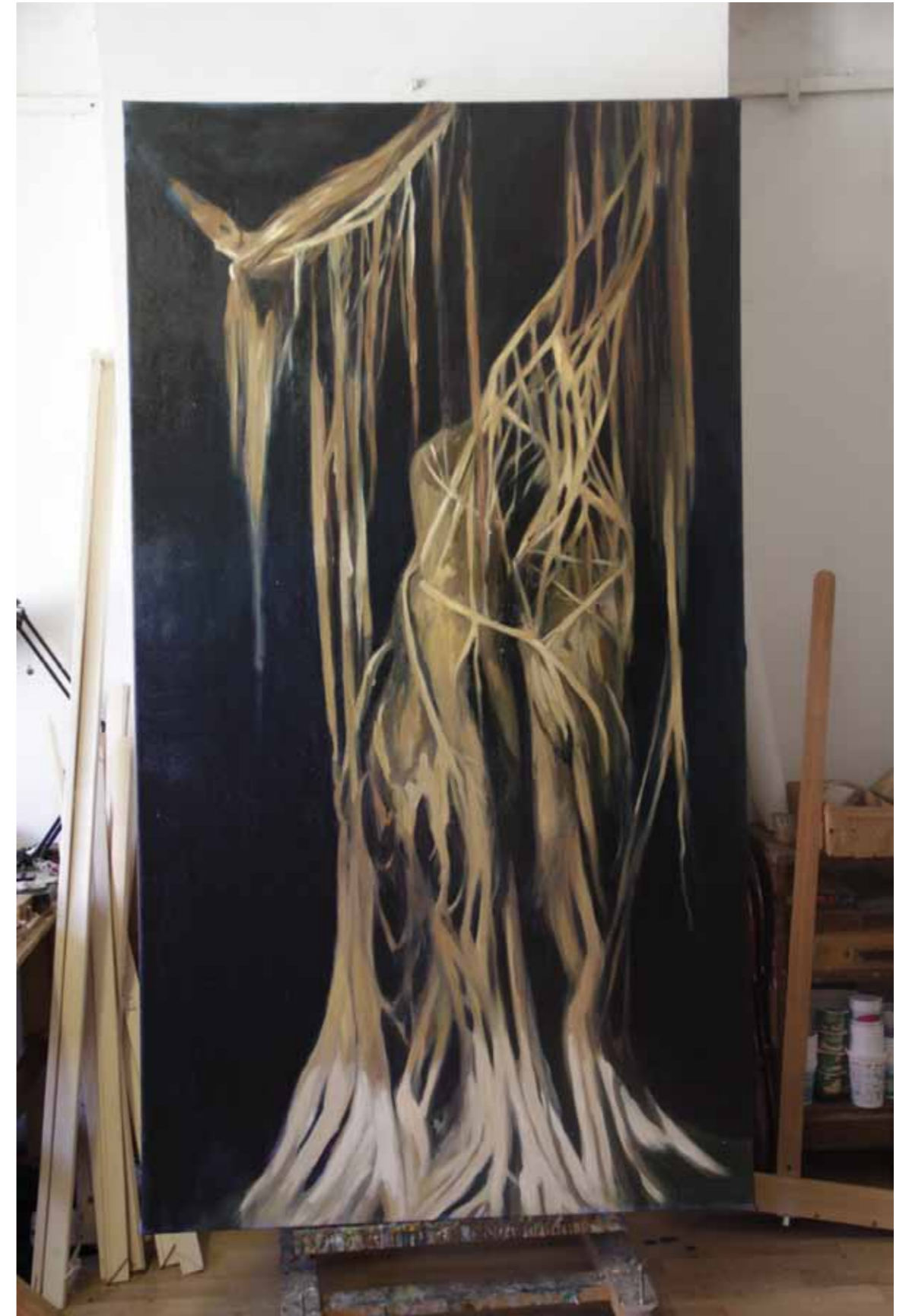
Éjszakai fa vázlatok