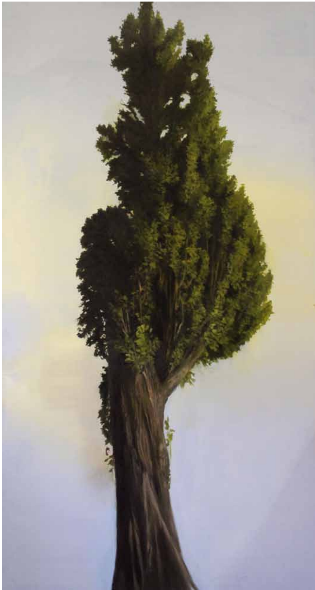
Jegenye II. 200x110cm olaj, vászon, 2019.