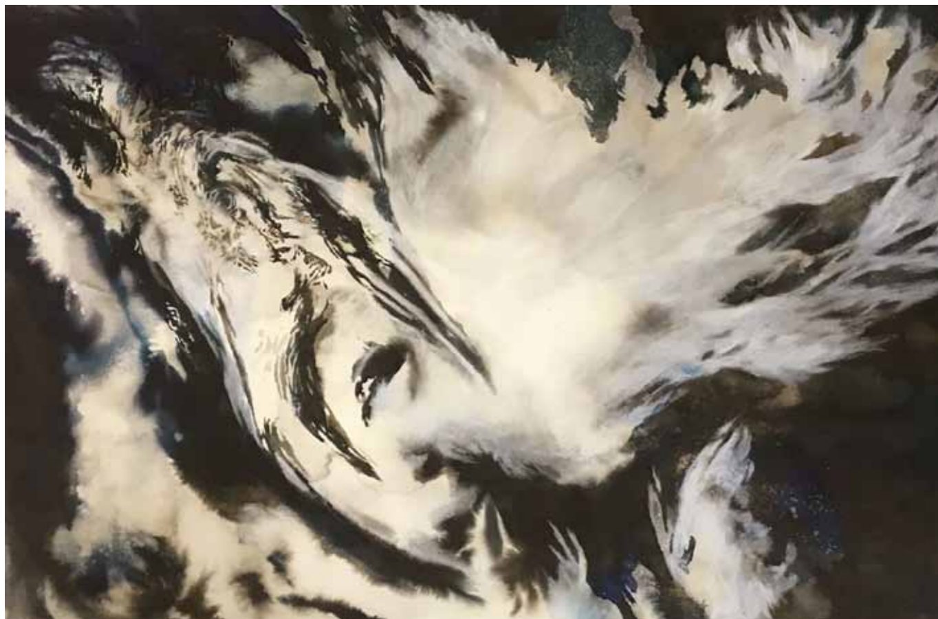
Sárkányok I. papír akvarell 2021.