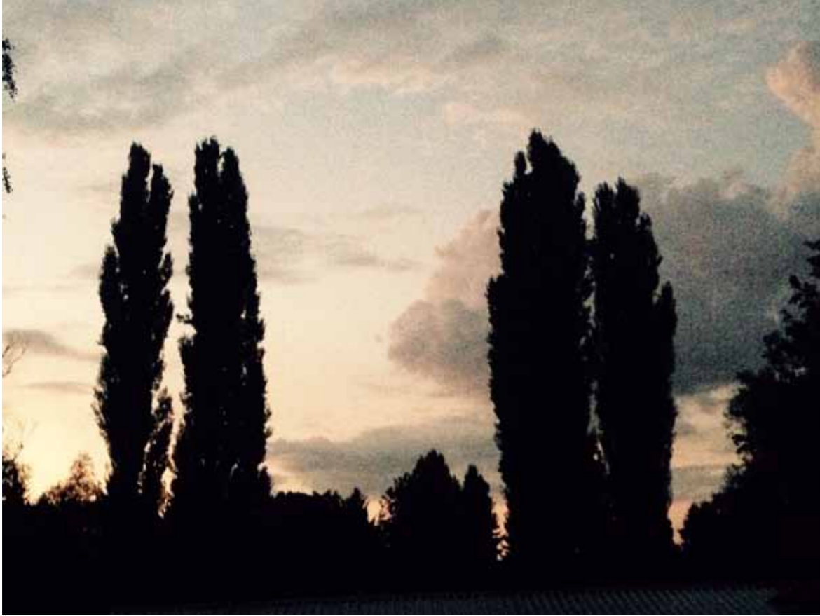
Fotó vázlatok a jegenye sorozathoz.