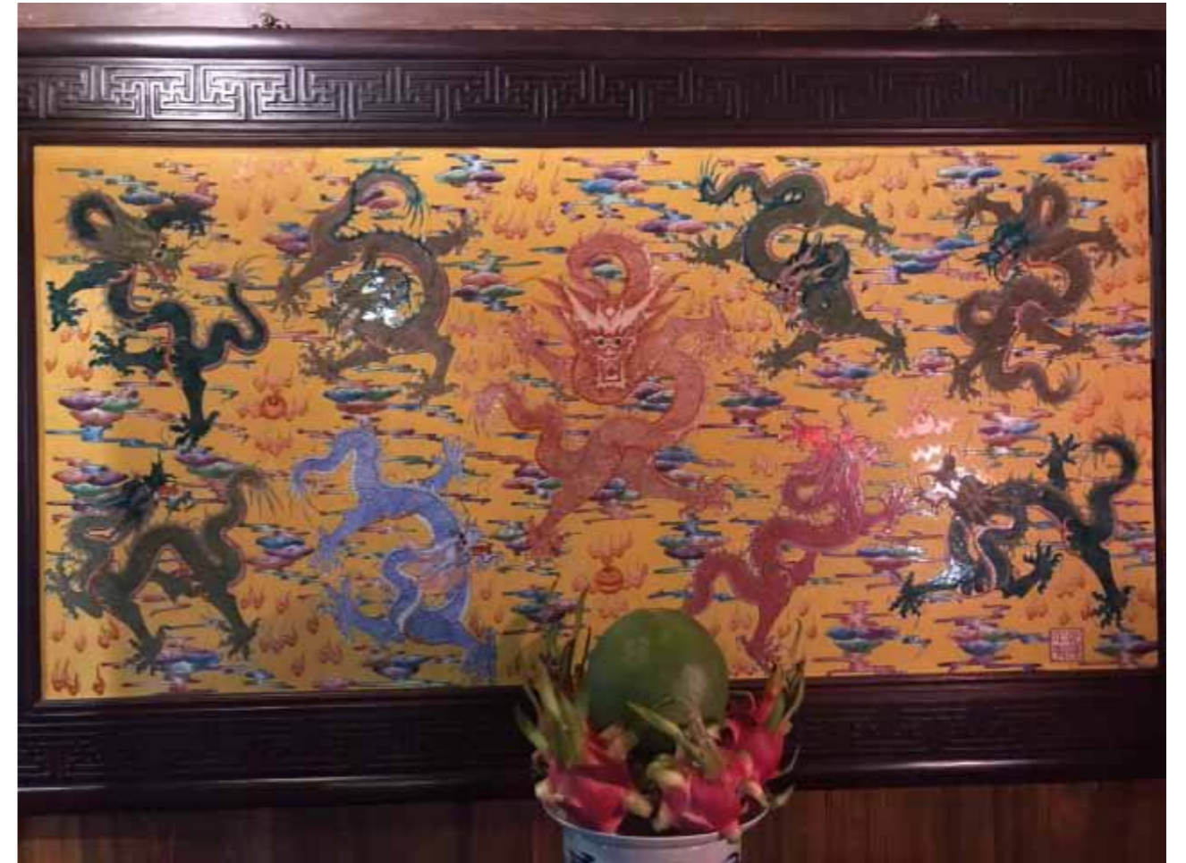
Sárkányokat ábrázoló berakásos oltár. Ninh Binh Vietnam.

Műhold felvételek felhasználásával sárkány- Tájfun képek készítése. Papír ,tus ,akvarell. Méret, kb 150x90cm Különböző színekben.