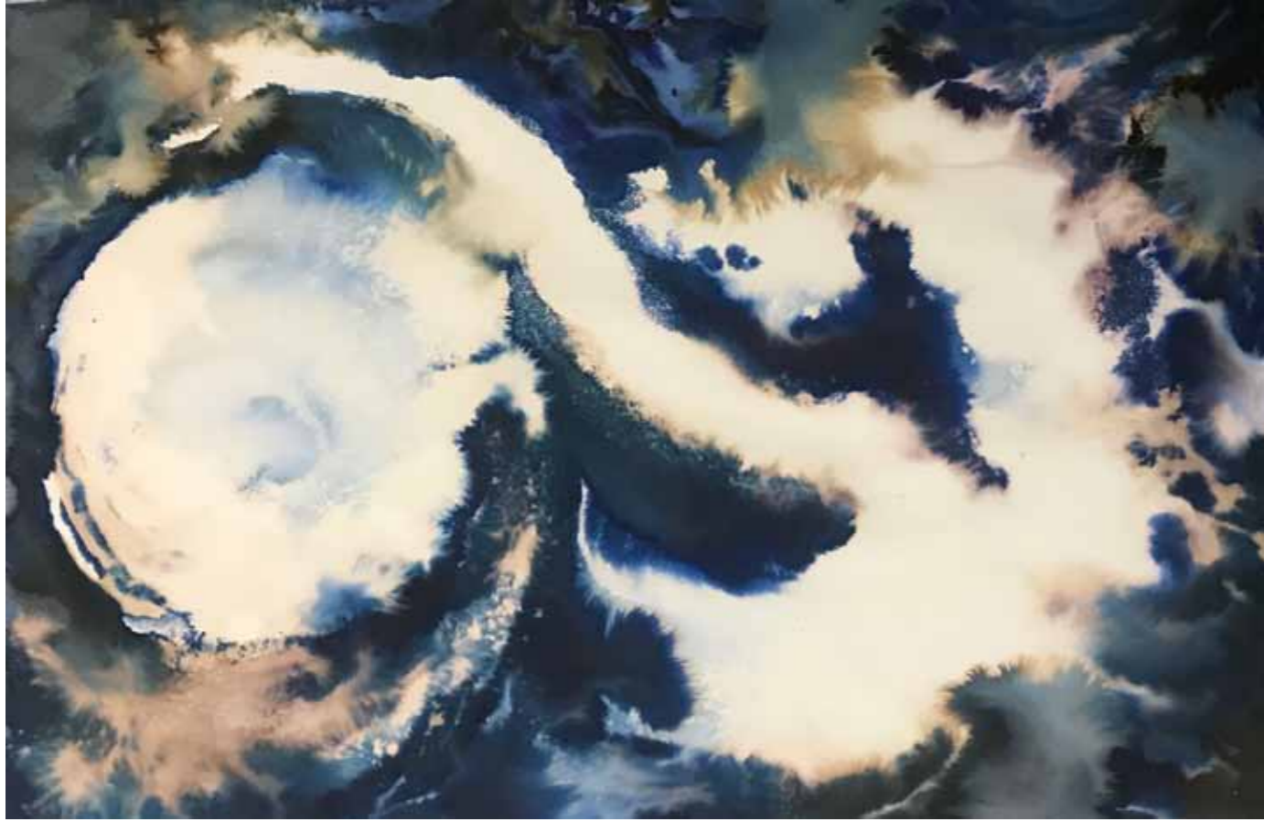
Sárkányok II.Papír, akvarell 2021.