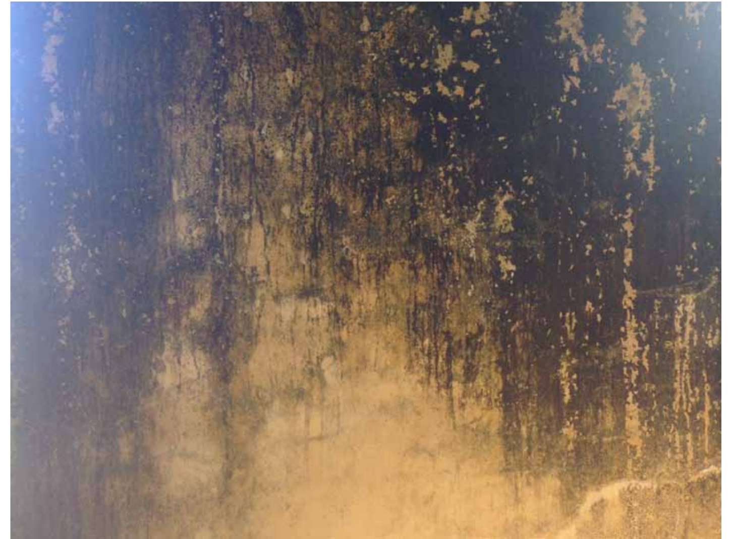
Fal felületek gyűjtés, további munkákhoz..