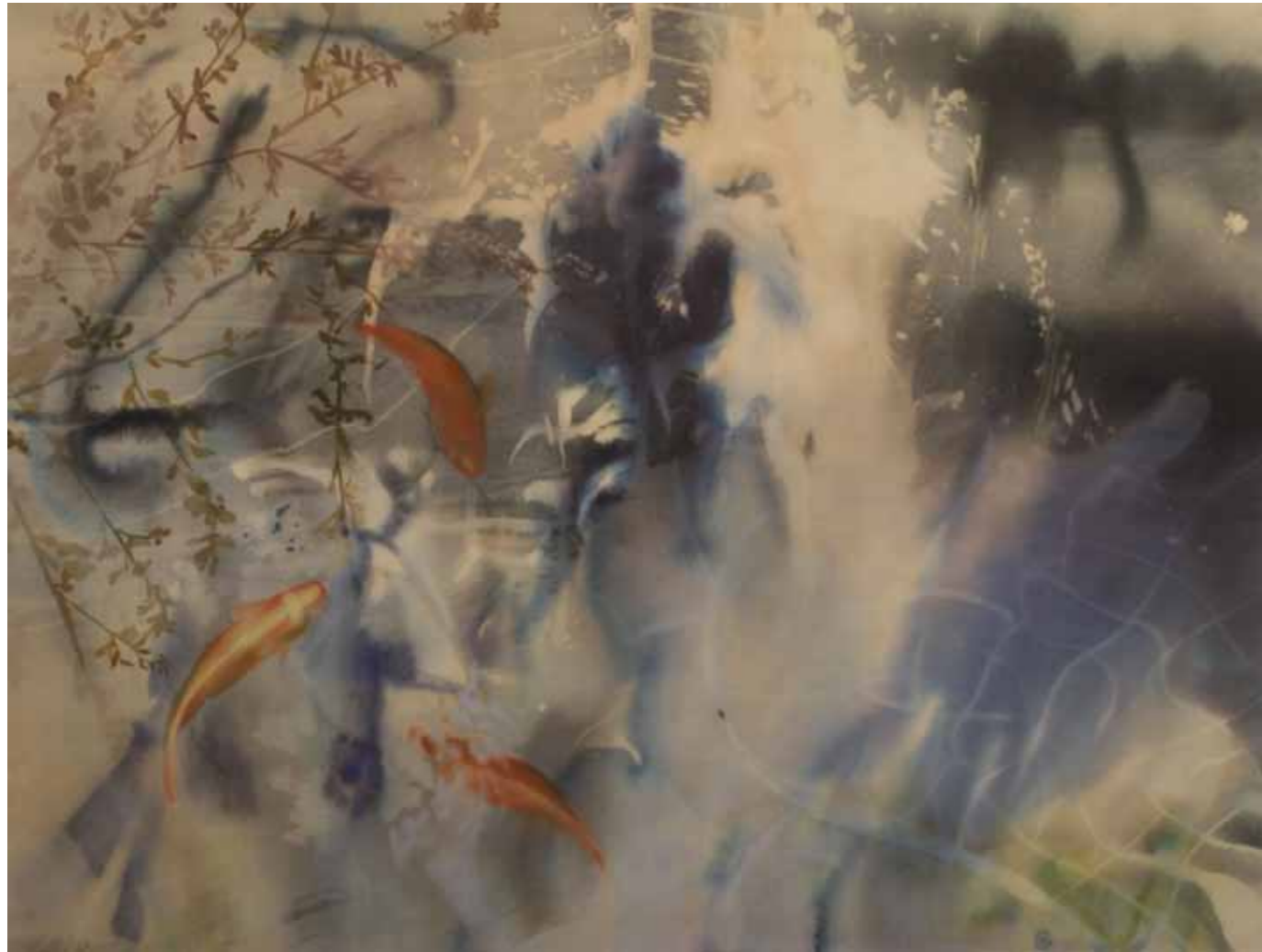
Folyók I. papír, akvarell, 2021.

Folyók- tükröződő felületek, fotók, rajzok felhasználásával. Személyes emberi történeteket, Óry Aladár rajzait, leveleit, használnám fel a folyó képek készítésénél. Át tükröződnének pl fotók, vagy tárgyak amiket hordoz a víz, vagy csak egy -egy levél részlet által inspirált képek.