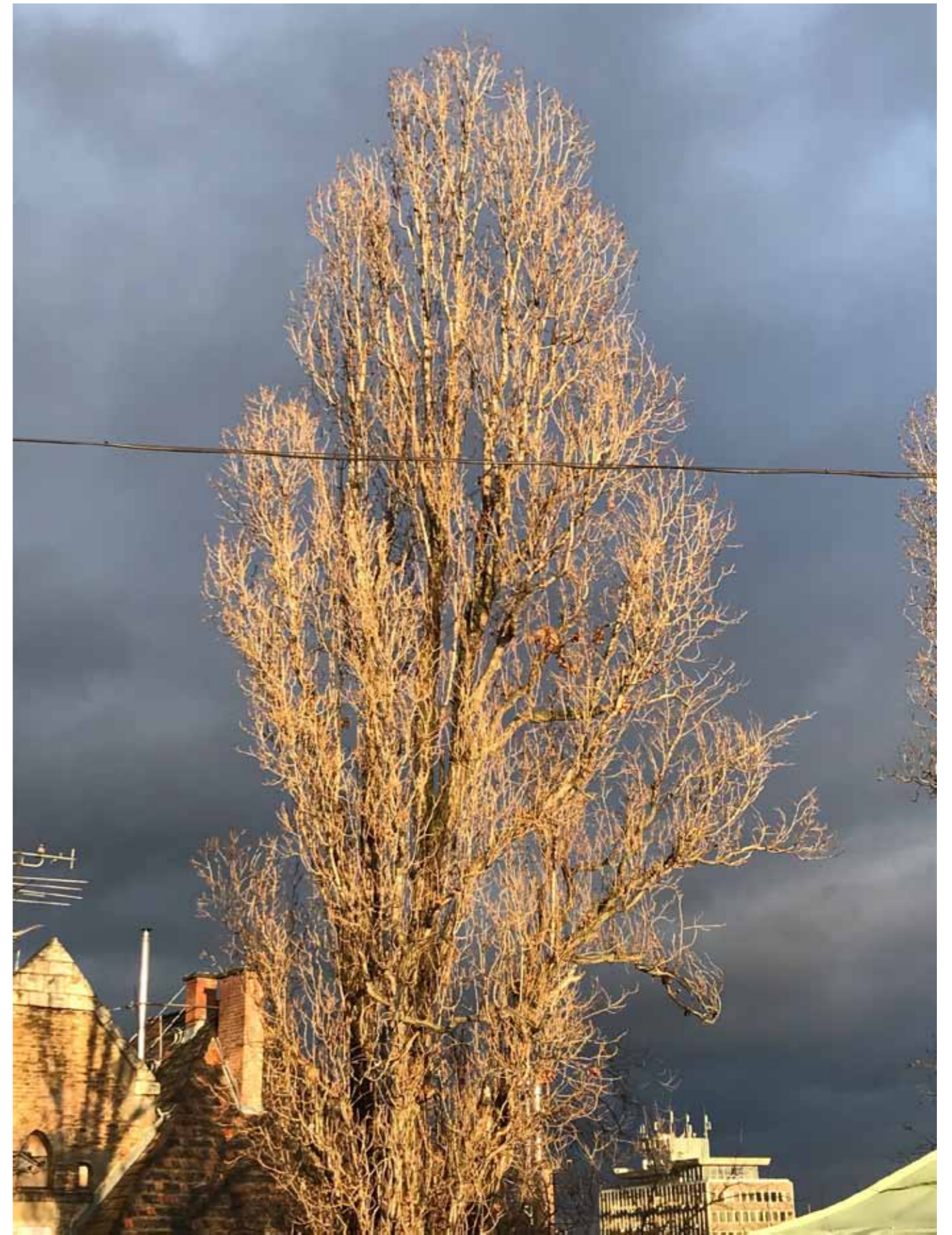
Fotó vázlatok a jegenye sorozathoz.