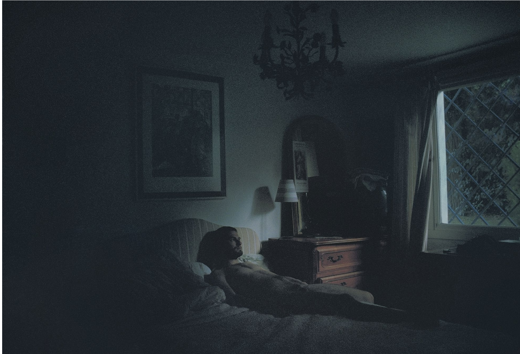
Bleu - chambre