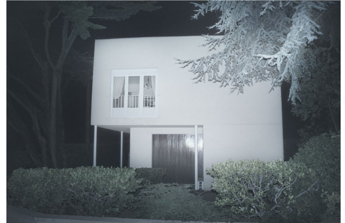
Bleu - maison