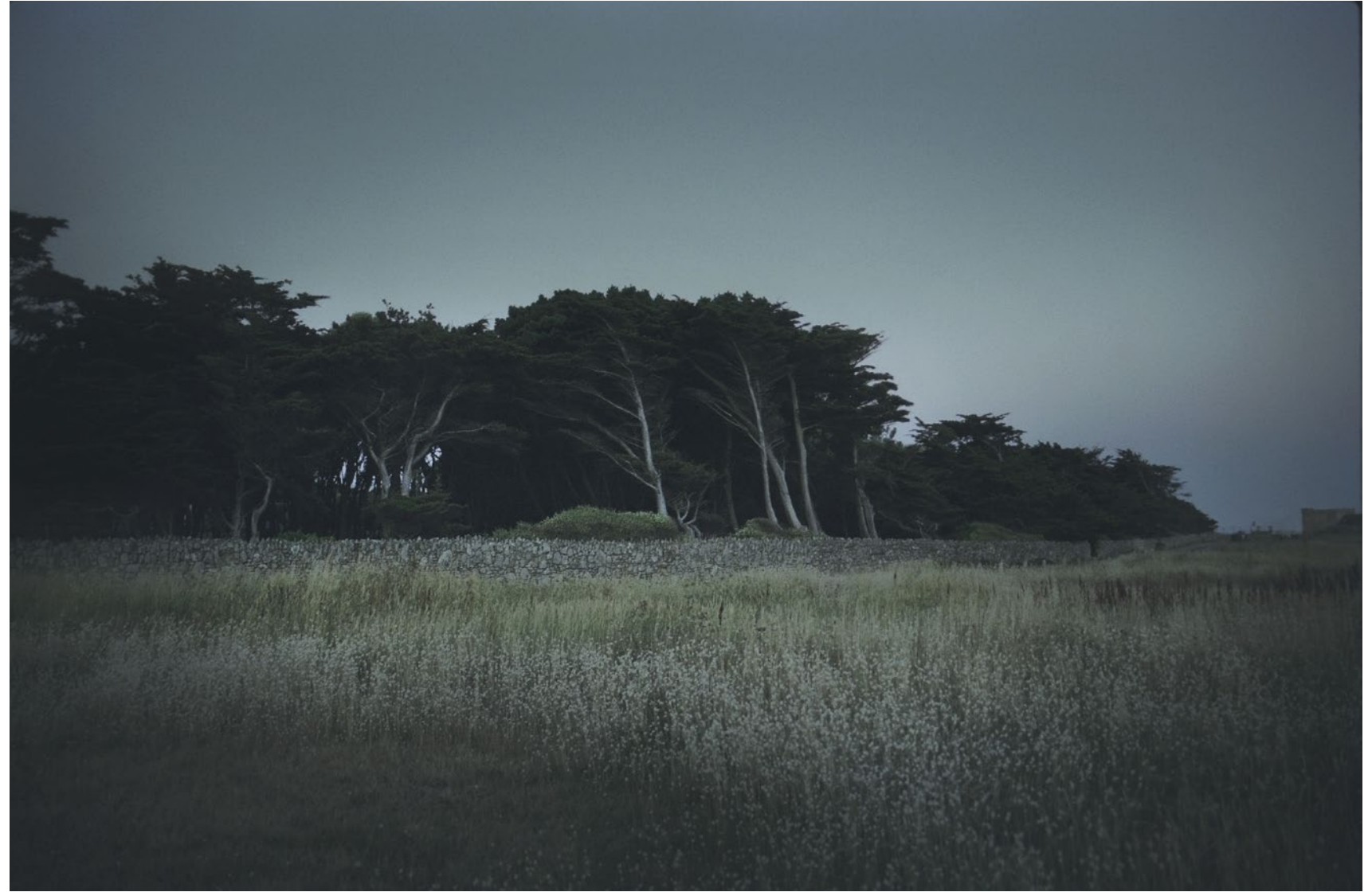
Bleu - côte sauvage