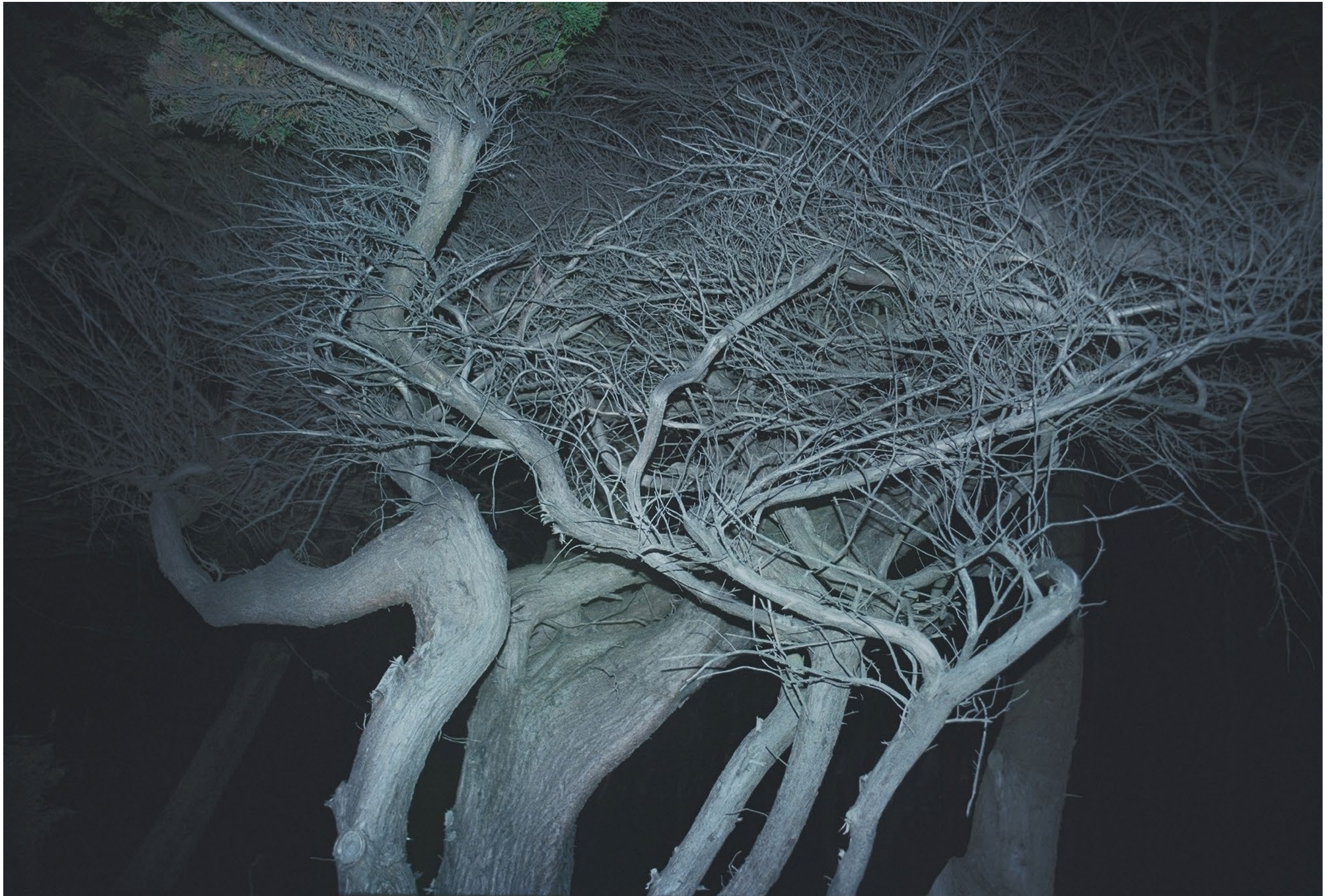
Bleu - arbre