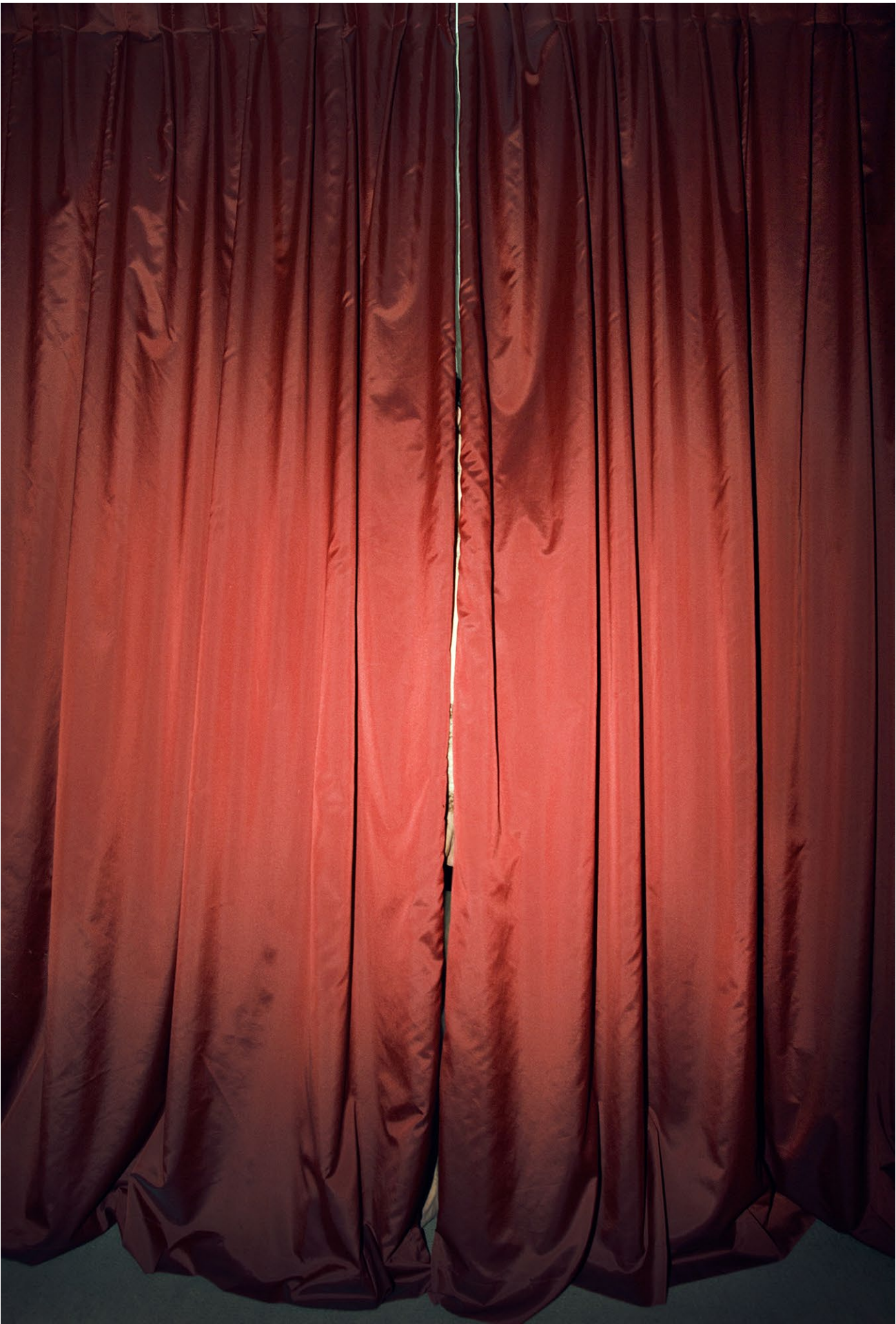
Bleu - rouge