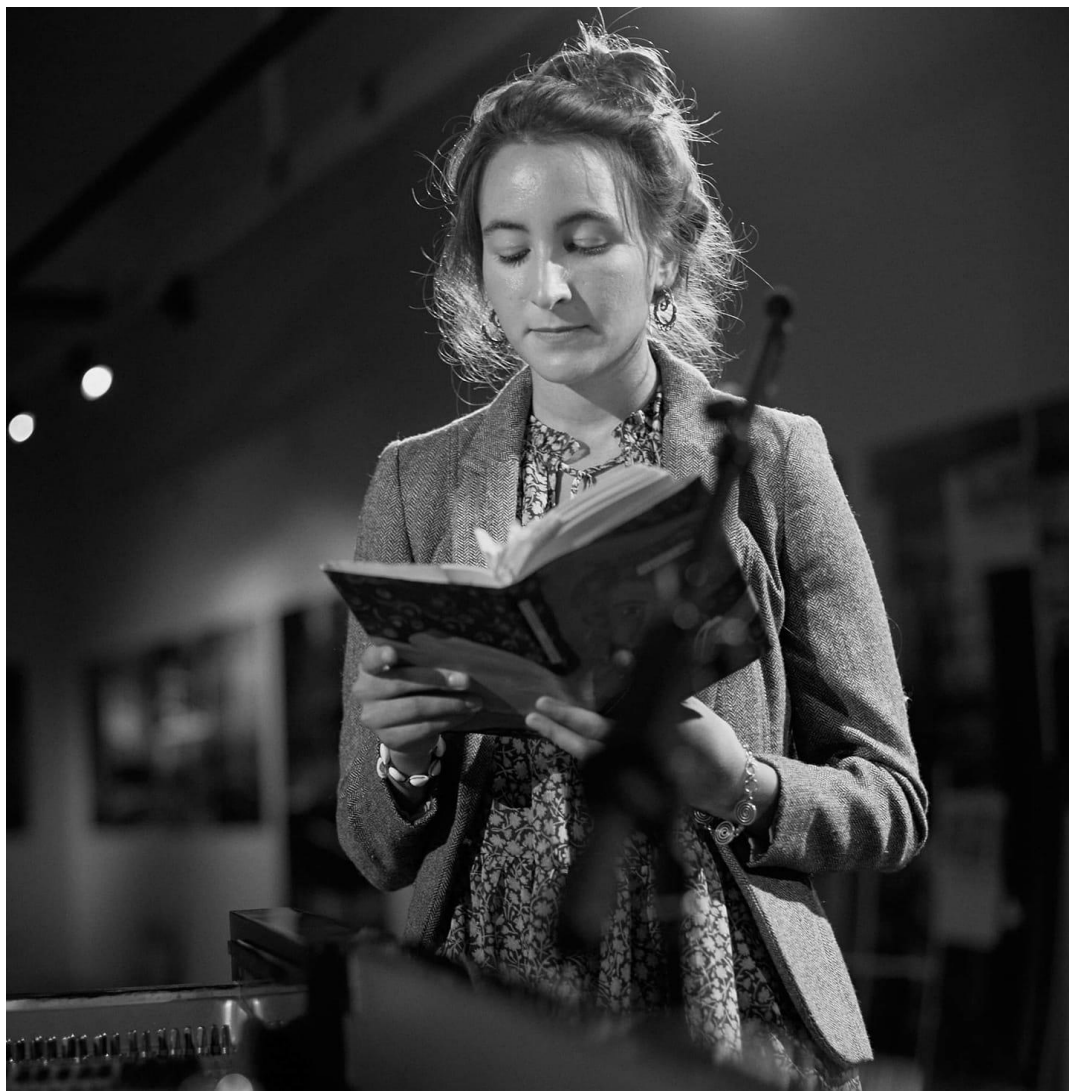
(FUGA, fellépés közben, 2020)