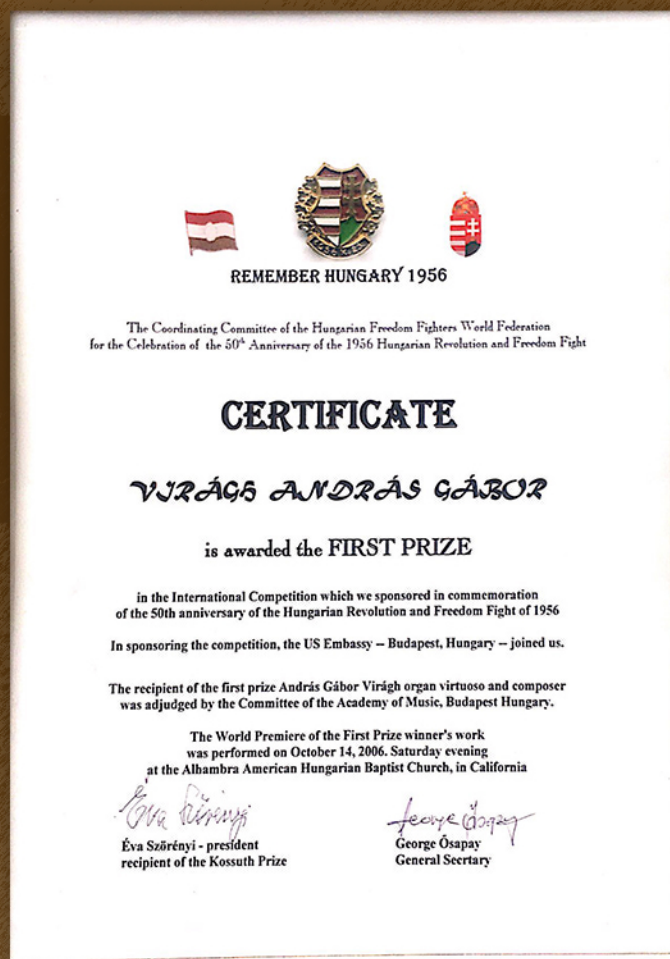
Nemzetközi zeneszerző Verseny, Los Angeles 2006.