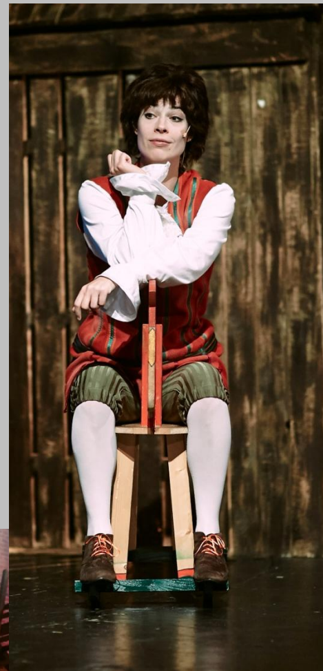
A PADLÁS Kölyök