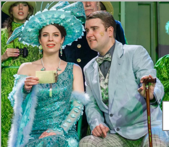
MY FAIR LADY Eliza Doolittle