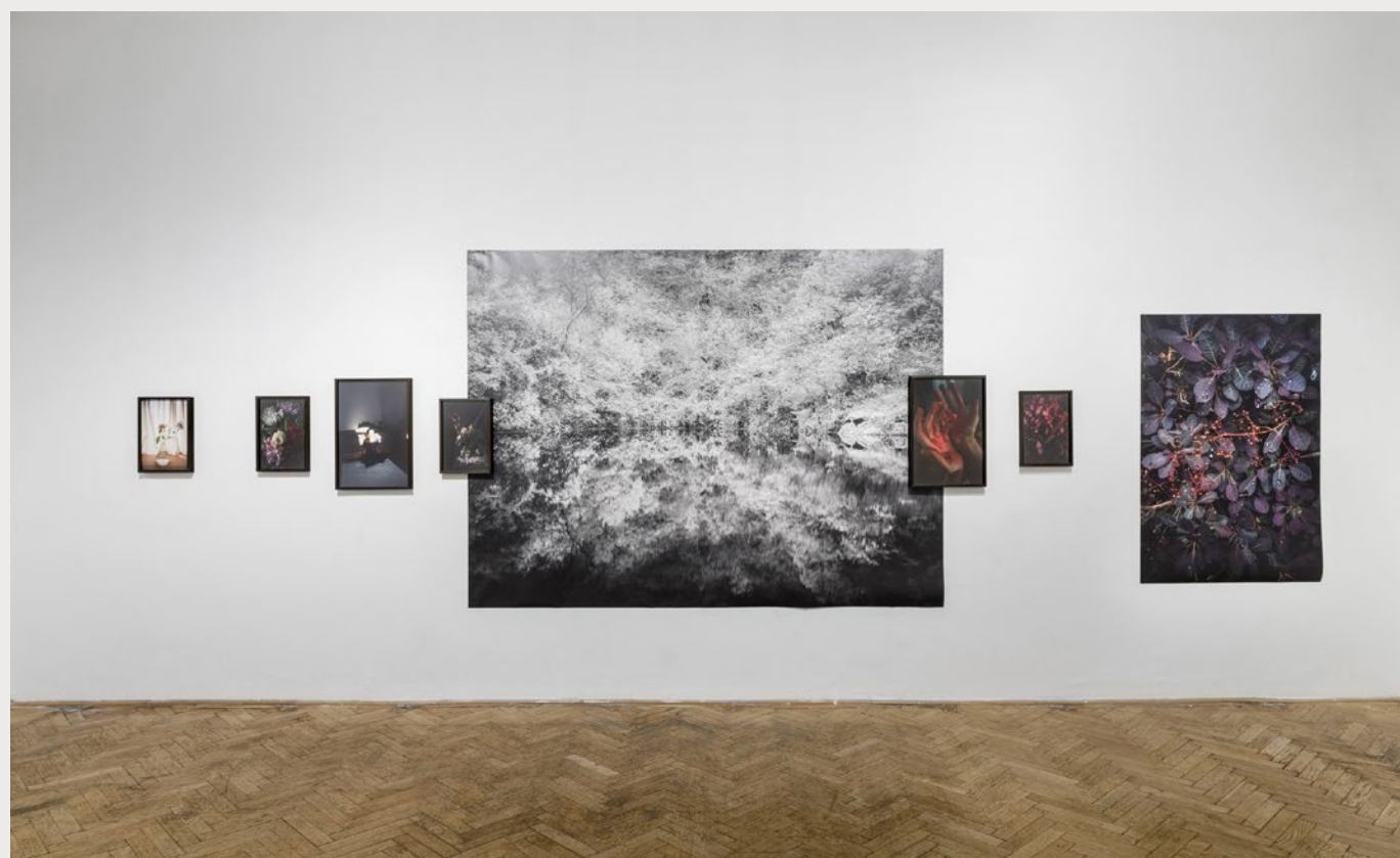
Fotó: Capa Center, Gyógyír című kiállításról

A sorozat tájképei és növénytextúrái a megélt külső és belső utazások lenyomatai, a természet-ember kontextusában adják meg a keretet és utalnak az erőviszonyokra is. A virágokat a szüleim kertjéből gyűjtöttem, ezeket vittem magammal a külvilágból és ebben a tudatállapotban tudtam rácsodálkozni a szépségükre és a működésükre. A sorozatban a természetes virágzási idejükhöz igazodva sorrendben jelennek meg, ezáltal válnak az idő útjelzőivé. Az önarcképek az önmagammal való (újra)találkozást, az önvizsgálatot, valamint a problémáimmal való szembenézést és a komfortzónából való kilépést jelentették.