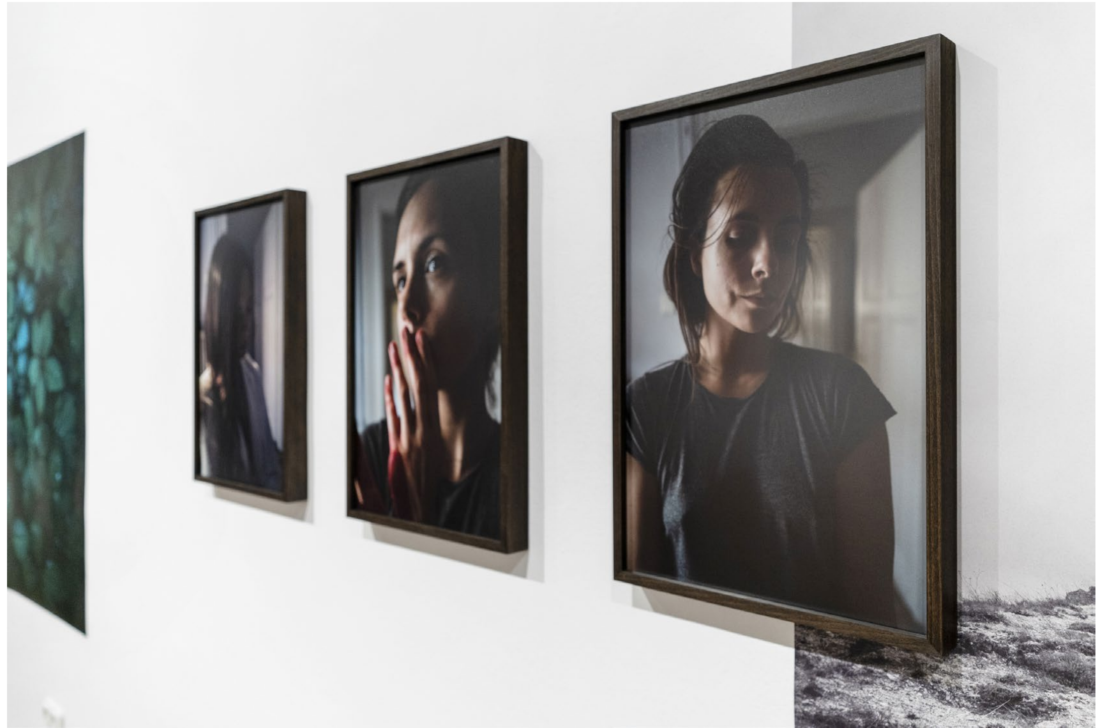
Gyógyír című kiállításról