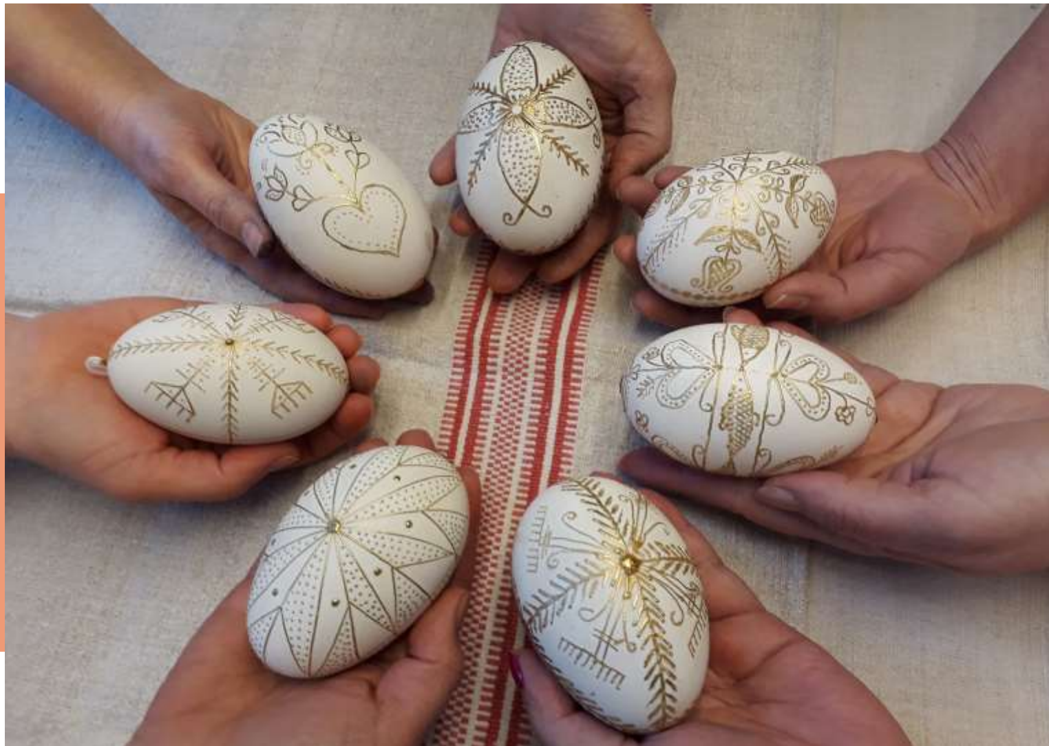
Kárpát-medencei tojásíró kaláka, 2021. (Online fórum, a Hagyományok Házával együttműködésben, koncepció és előadások: JGB)