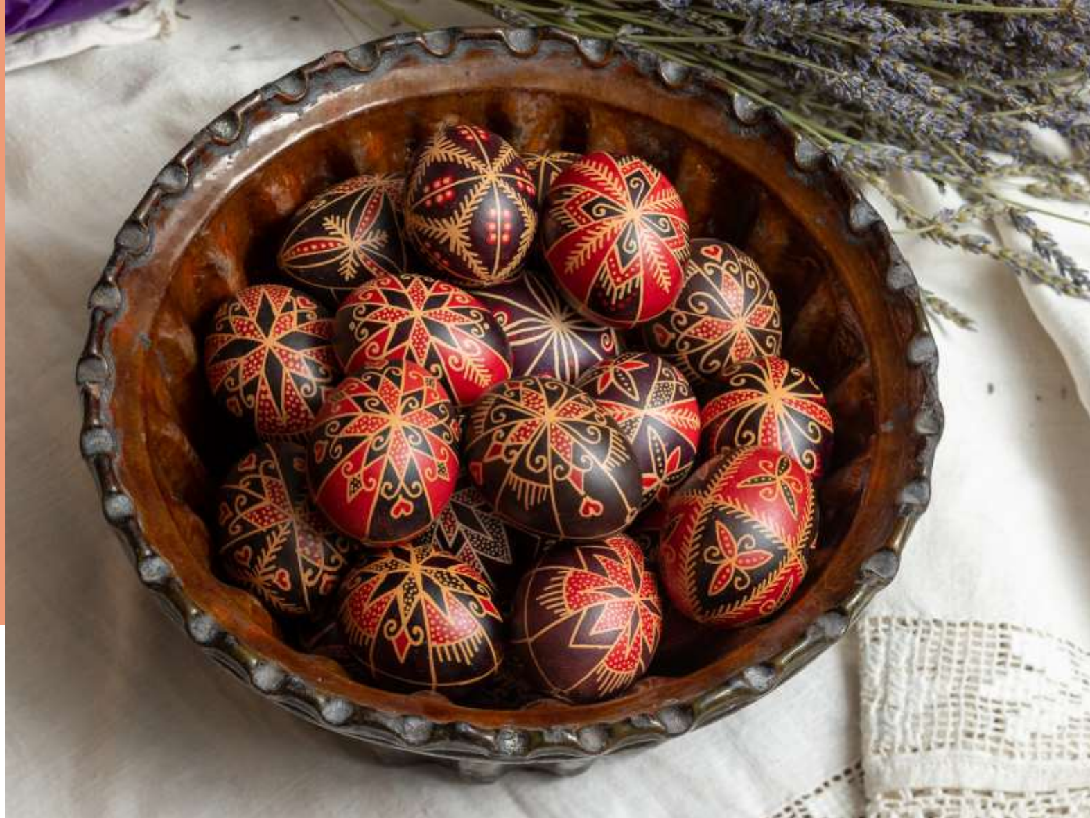
Virtuális hímestojás kiállítás pályázat, Szlovénia, Dobronak 2021.