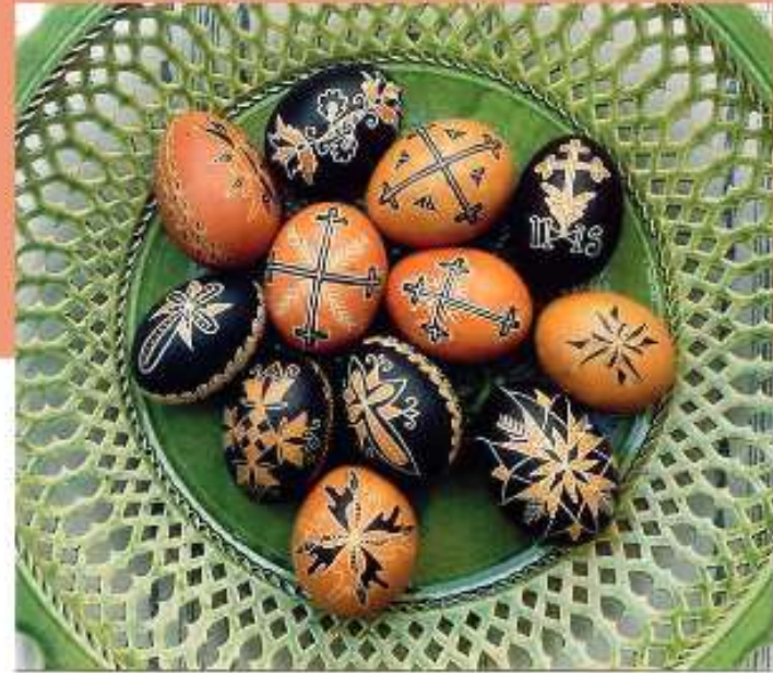
Vallási szimbólumok feldolgozása