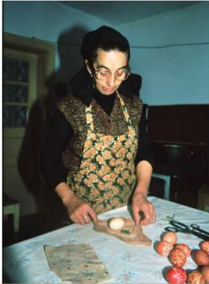
2000-2002 Gyimesbükki és gyimesfelsőloki néprajzi gyűjtések