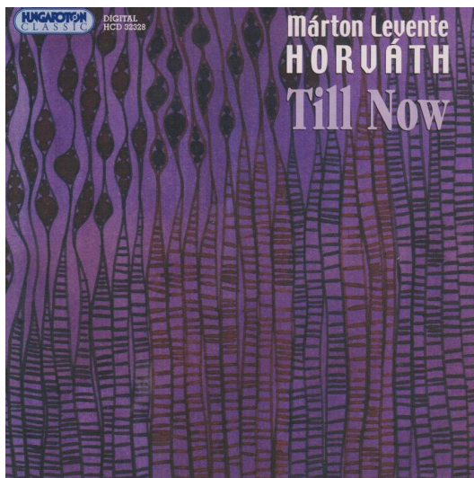
Till Now (2005-HUNGAROTON) Horváth Márton Levente szerzői lemeze

Népdalok Erotic Contaminations Pieces pour MI Interludes Mária-énekek