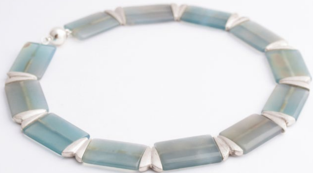
I/9 TAVASZI ÉGBOLT nyakék ezüst, achát 190x190x5mm