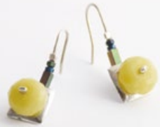
L/3 SZŐLŐSZEM fülbevaló ezüst, jade, hematit 30x14x10mm L/3 GRAPE earring silver, jade, hematite 30x14x10mm