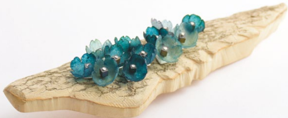
H/34 NAGY TÚLÉLŐ brooch No.1 ezüst, buxus, pergamen, hematit 120x32x20mm H/34 BIG SURVIVAL brooch No.1 silver, buxus, parchment, hematite 120x32x20mm