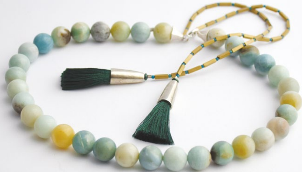
L/4 SZŐLŐSZEM nyakék ezüst, jade, hematit, türkiz, viszkózszelyem, üveg 400x16x12mm+300mm+bojtok:80x12x12mm L/4 GRAPE necklet silver, jade, turquoise, hematite, viscose, glass 400x16x12mm+300mm+ tassels:80x12x12mm L/5 TENGERSZEM nyakék ezüst, amazonit, hematit, viszkózszelyem, üveg 400x12x12mm+300mm+bojtok:80x10x10mm L/5 TARN necklet silver, amazonit, hematite, viscose, glass 400x12x12mm+300mm+ tassels:80x10x10mm