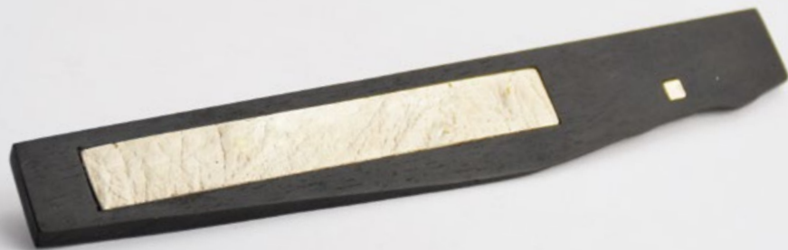
I/15 EZÜSTKOR bross édesapám bőrlenomatával ezüst, ébenfa 130x20x10mm I/15 SILVER AGE brooch with my father imprint silver ebony 130x20x10mm