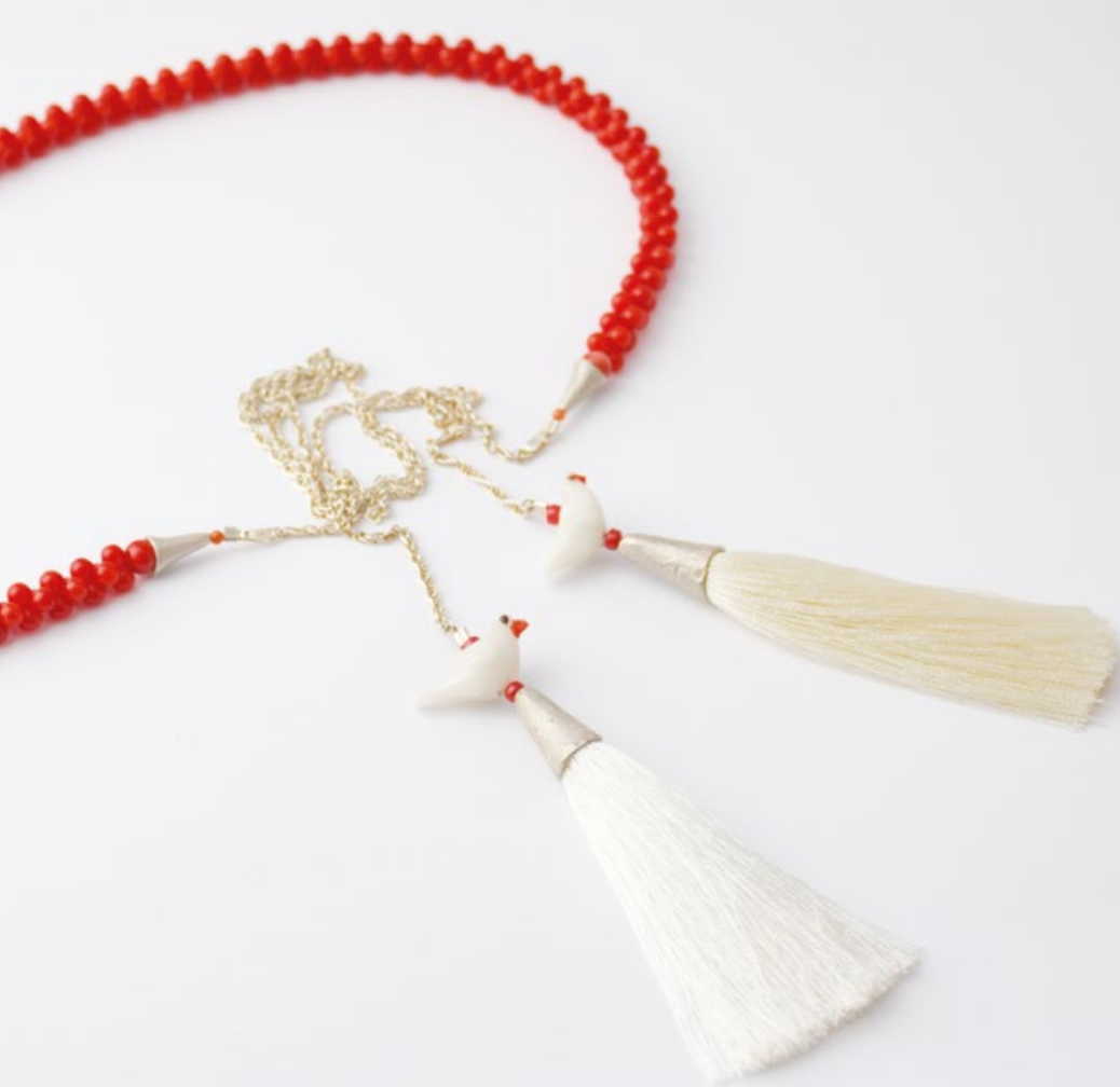
L/6 MADÁRKÁS nyakék ezüst, korall, üveg, viszkózszelyem 400x8x8mm+550mm+bojtok:80x12x12mm