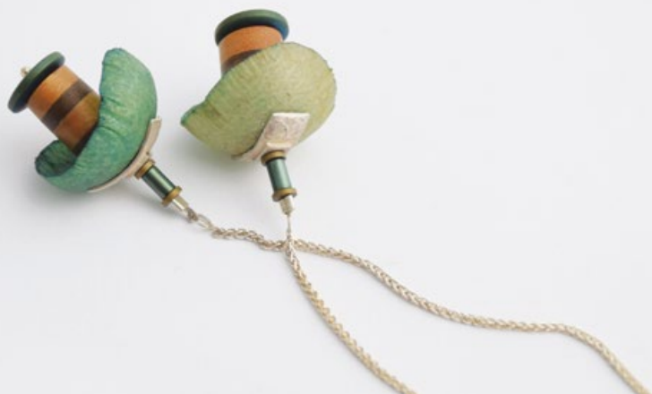
H/22 KÉTELEMES TÖRPEBORS nyakék ezüst, pergamen, hematit, ébenfa, olajfa 30x25x20mm/600mm H/22 TWIN PEPPEROMIA pendant silver, parchment, hematite, ebony, olive wood 30x25x20mm/600mm H/23 TÖRPEBORS fülbevaló ezüst, pergamen, hematit, jáde, körtefa vagy pálmafa 55x25x25mm H/23 PEPPEROMIA earring silver, parchment, hematite, jade, pear wood or palm wood 55x25x25mm