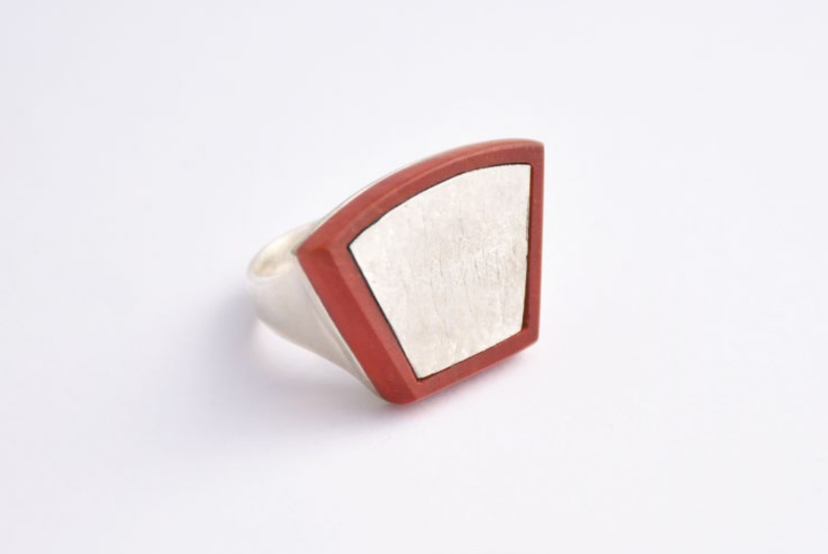
1/16 EZÜSTKOR gyűrű édesanyám bőrlenomatával ezüst, rózsaszín elefántcsontfa 30x30x20mm 1/16 SILVERAGE ring with my mother imprint silver, pink ivorywood 30x30x20mm