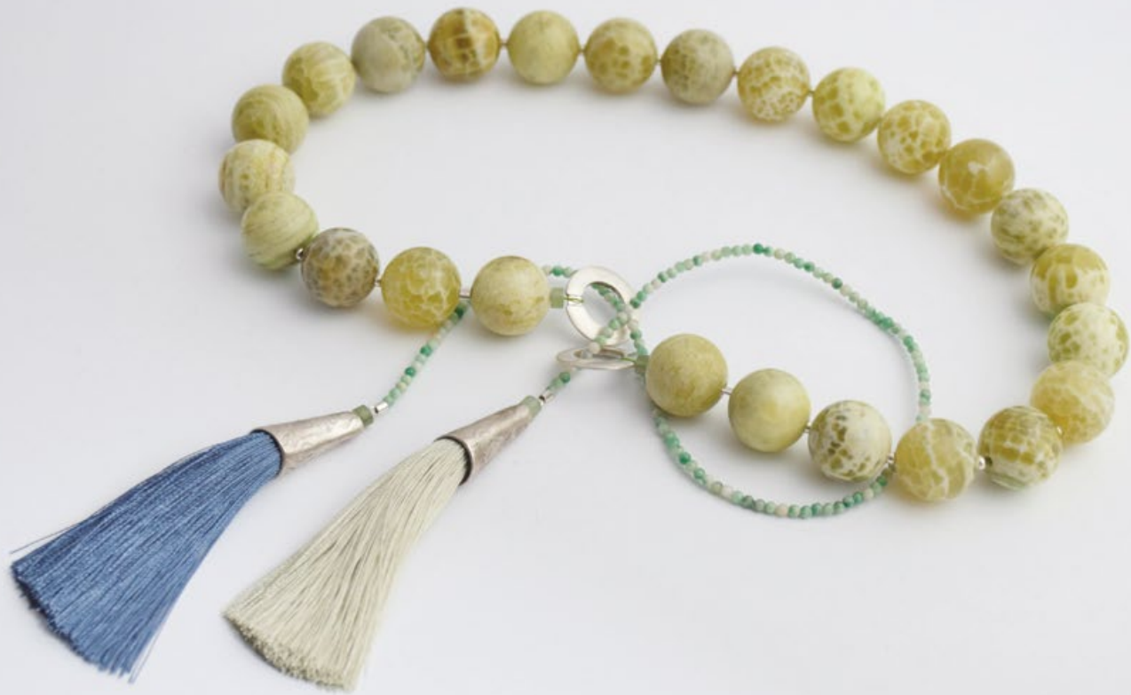
L/12 LEGUÁN nyakék ezüst, achát, türkiz, viszkózszelyem, üveg 400x16x16mm+300mm+bojtok:80x12x12mm L/12 IGUANA necklet silver, jade, turquoise, viscose, glass 400x16x16mm+300mm+tassels:80x12x12mm