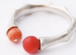
L/11 BAMBOO ring silver, coral 25x22x5mm