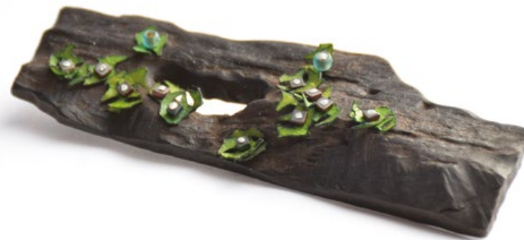
H/35 NAGY TÚLÉLŐ brooch No.2 ezüst, ébenfa, pergamen, hematit 90x35x15mm H/35 BIG SURVIVAL brooch No.2 silver, ebony, parchment, hematite 90x35x15mm

A két ékszer a 2018-as Ékszerek Éjszakája Budapest Szimbiózis pályázatára készült. A zuzmófélék a növényvilág legismertebb – szimbiózisban élő- társulásai. A fonalas alga és gombafélék alkotta telepek jelenthetik a tönkretett Föld élővilágának túlélését. Megélnék talaj nélkül, képesek fejlődni élettelen tárgyakon, köveken, sivatagban, gleccserek jege alá szorulva. Brosztűimmal e kölcsönösen hasznos együttélés, és reménytelen vitalitás szimbólumát, a zuzmók világát szeretném megidézni, melyet viselve –titokban-mi is túlélőnek érezhetjük magunkat.