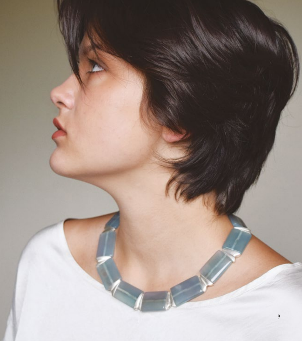
I/9 SPRING SKY necklace silver, achat 190x190x5mm