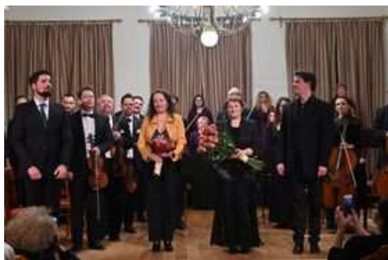
Liszt Ferenc Kamarazenekar és a Szolnoki Bartók Béla Kamarakórus 2020. jan. 15-én adta elő az Estharangok c. kantátámat Cser Ádám vezényletével.