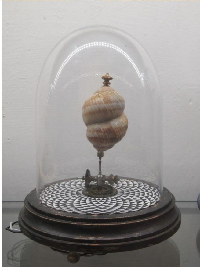
Zárt csigák (2020) (Két- és egytengelyű változatok)