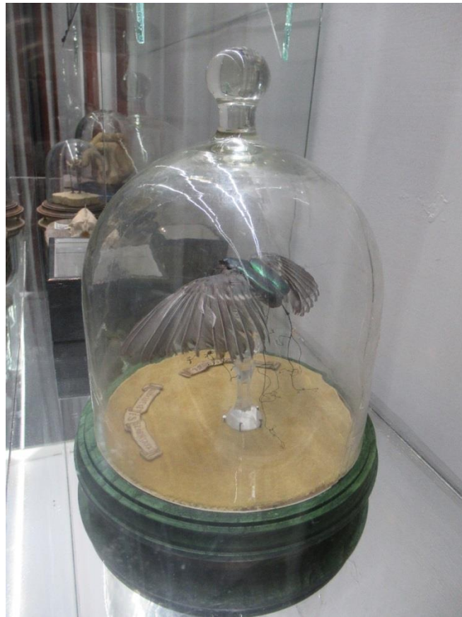
Madárszárnyú rózsabogár. (2020) Felirata: „Gyökereket és szárnyakat”

Mennyiben iparművészeti tárgyak? A felhasznált technikák nagy része iparművészeti (kerámia- ötvös). Ha pontosak akarunk lenni, vegyes technikával dolgozom. Ez sem idegen az iparművészettől. Szintén nem egyedi eset, ha egy-egy tárgy létrehozása nagyon sok idő- és munkát igényel. Az ötvösség és az üvegművesség terén (az anyagból, anyaghoz kapcsolódó technológiákból eredően) gyakoriak az ilyen tárgyak. Szinte minden tárgyam alkalmas arra, hogy kis változtatással küsszerűben készíthető tárgyakat készítsünk belőlük.