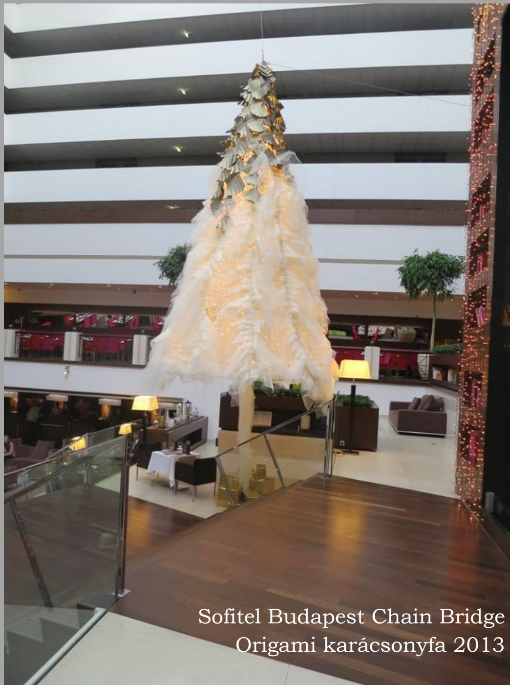
Sofitel Budapest Chain Bridge Origami karácsonyfa 2013