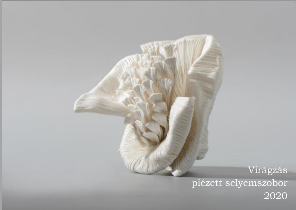
Virágzás piézett selyemszobor 2020