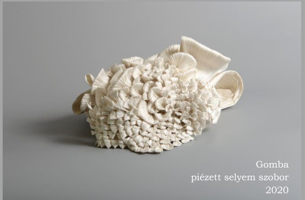
Gomba piézett selyem szobor 2020