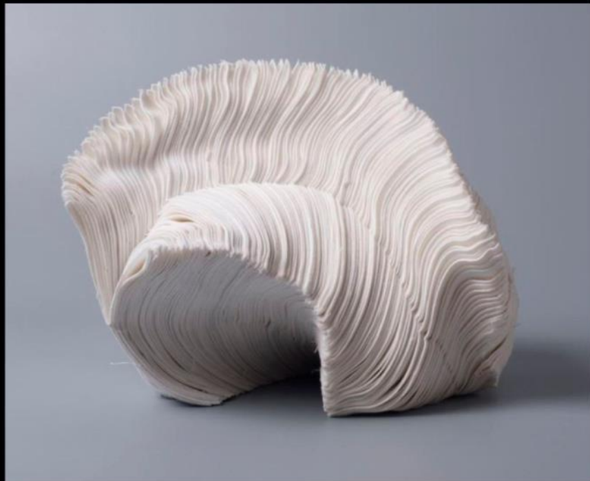
"Vortex No.1" - Földi Kinga (HU)

National and international textile artists from 13 countries