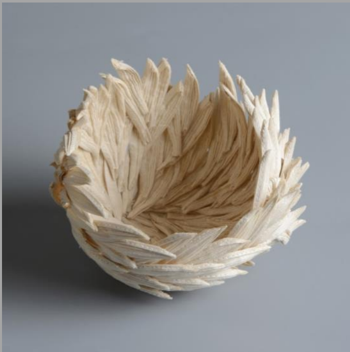
Egyensúlyozó kehely piézett selyemszobor 2021