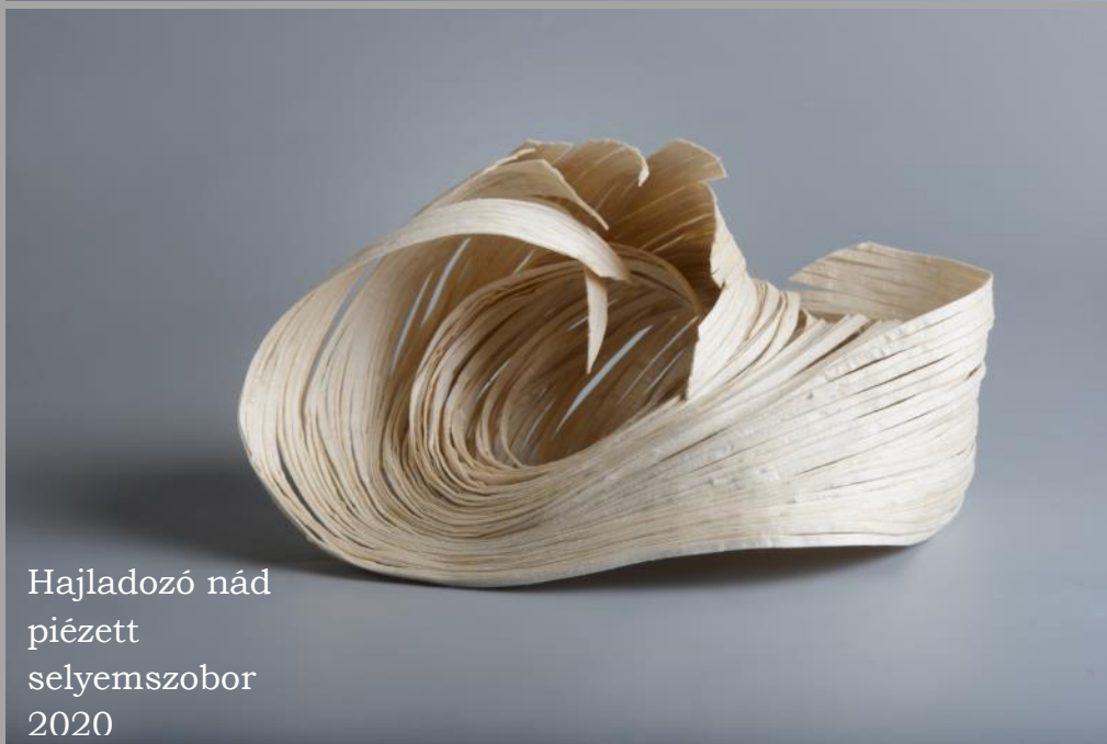
Hajladozó nád piézett selyemszobor 2020