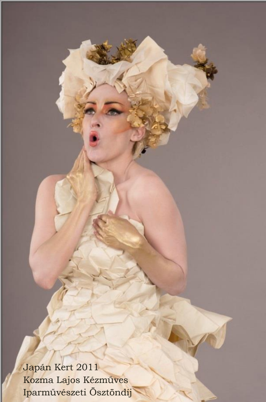
Japán Kert 2011 Kozma Lajos Kézműves Iparművészeti Ösztöndíj