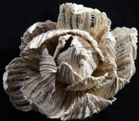
Nyitott lótosz virág piézett lótosz selyem 2021