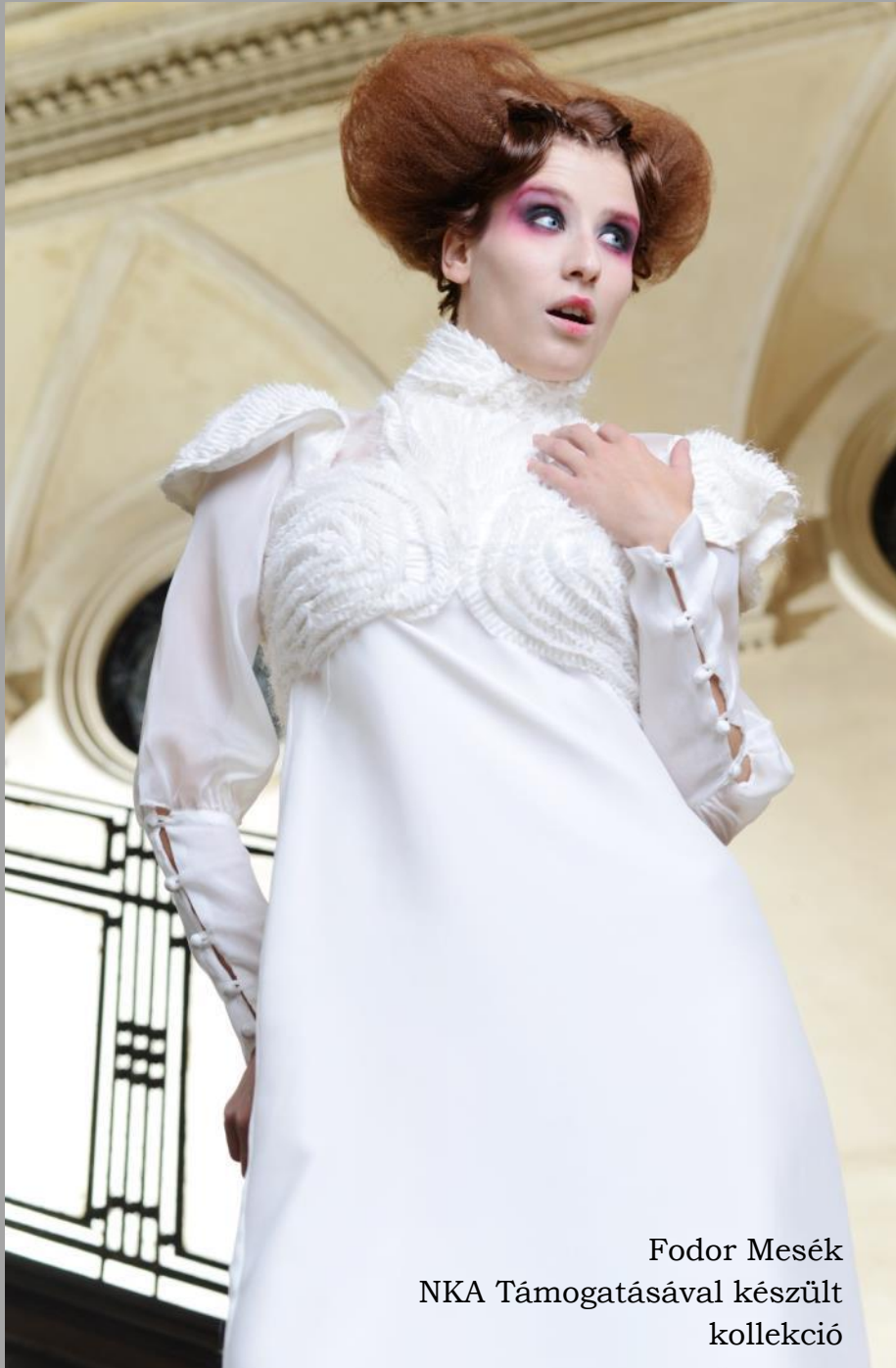
Fodor Mesék NKA Támogatásával készült kollekcio