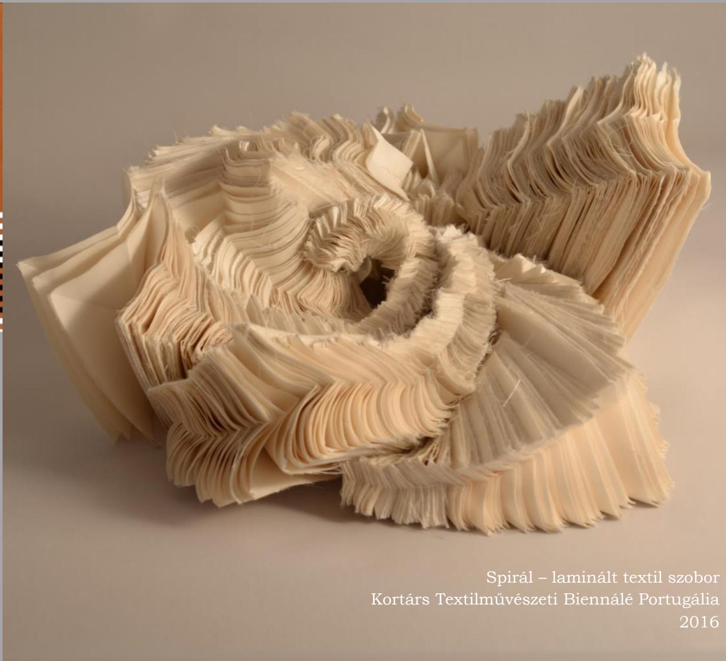
Spirál – laminált textil szobor Kortárs Textilművészeti Biennálé Portugália 2016