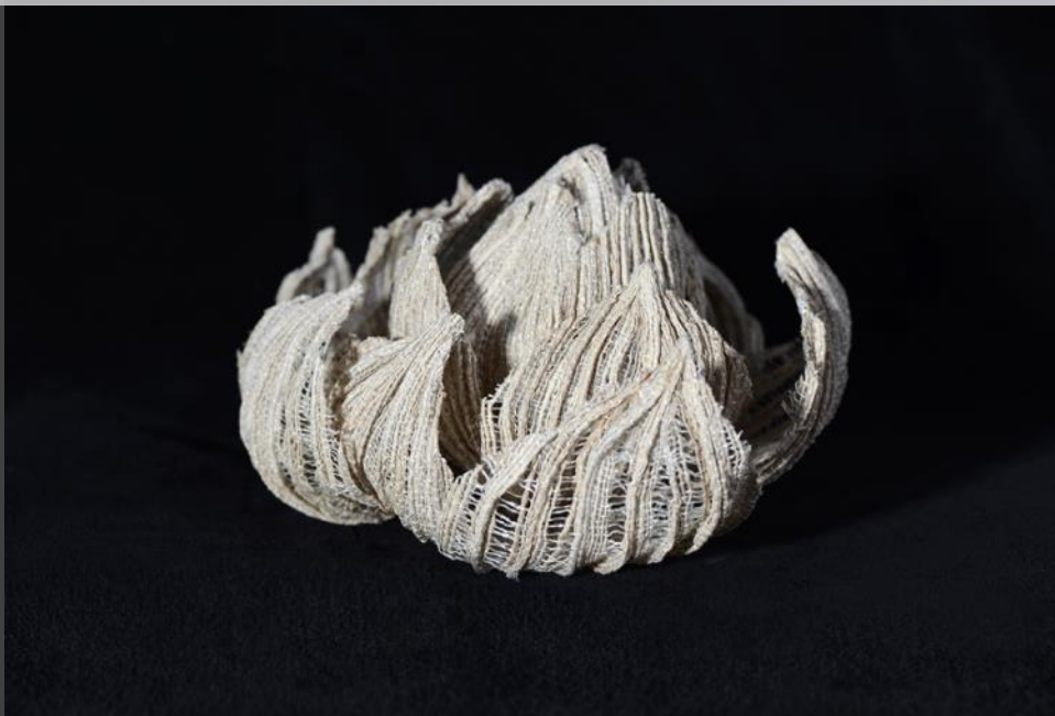
Nyitott lótusz virág piézett lótusz selyem 2021