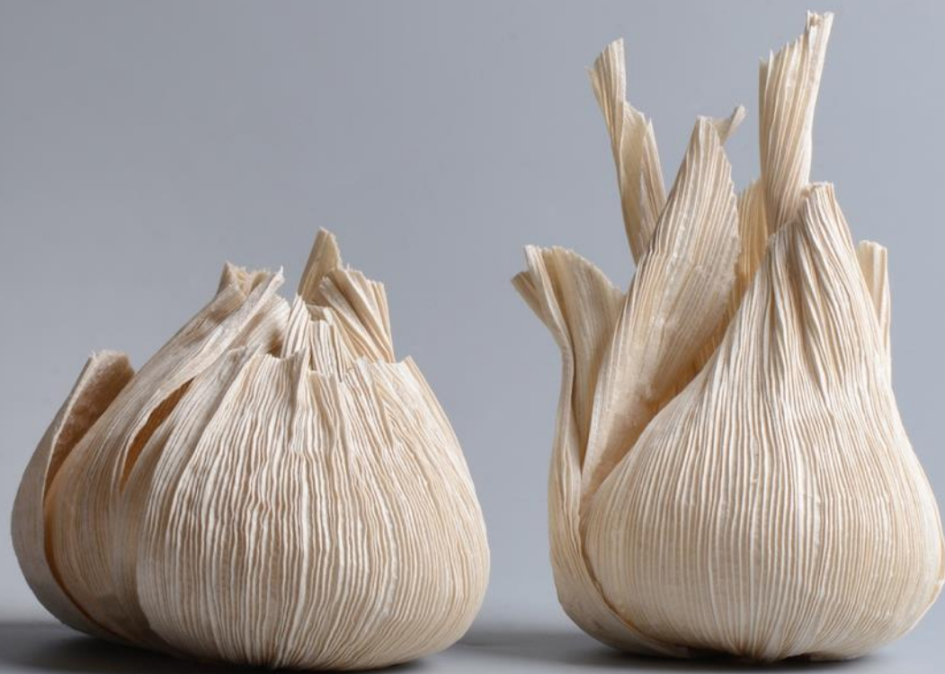
Hagymák piézett selyem szobor 2021