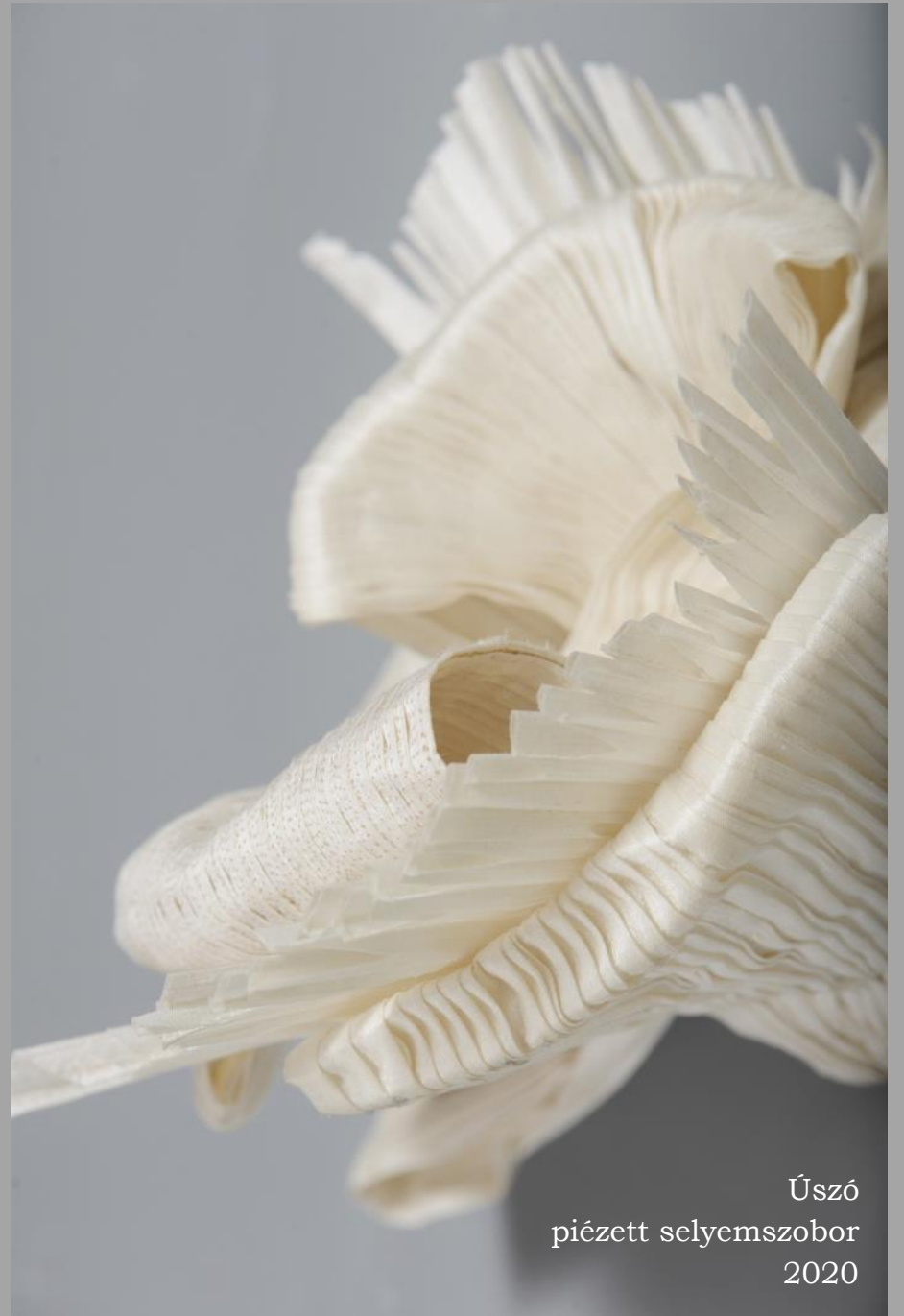
Úszó piézett selyemszobor 2020