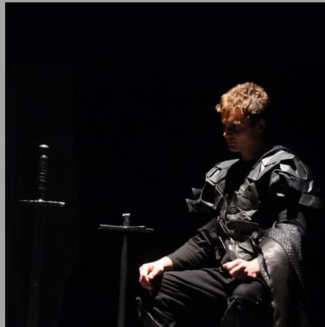
Zöld Kígyó és Szép Liliom Debrecen, Csokonai Színház 2011