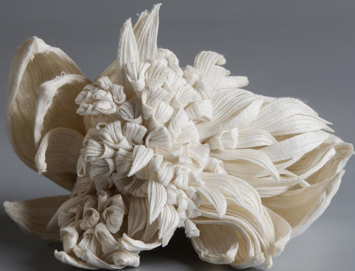
Krizantém piézett selyemszobor 2021