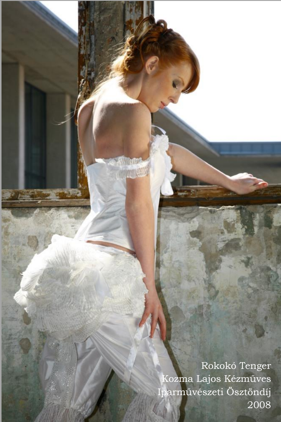
Rokokó Tenger Kozma Lajos Kézműves Iparművészeti Ösztöndíj 2008