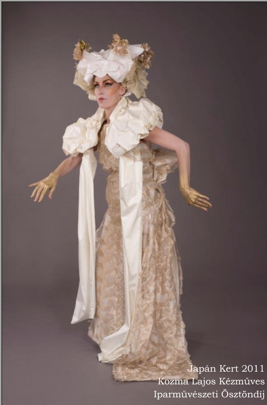
Japán Kert 2011 Kozma Lajos Kézműves Iparművészeti Ösztöndíj