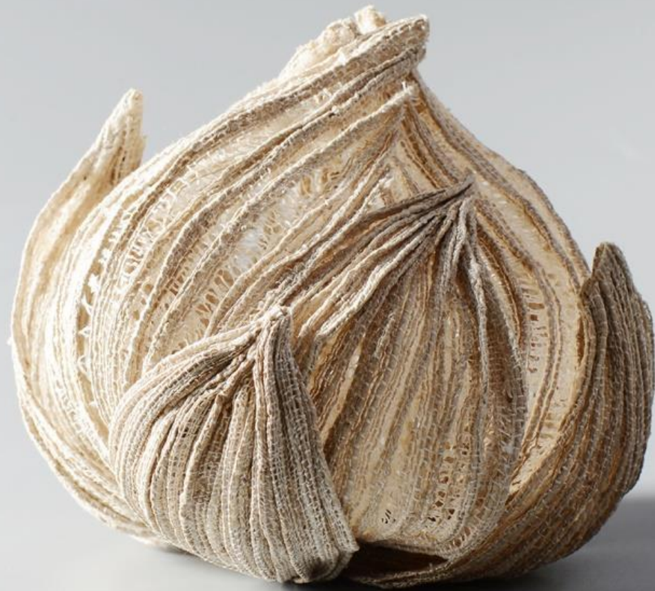
Zárt lótuusz virág piézett lótuusz selyem 2021