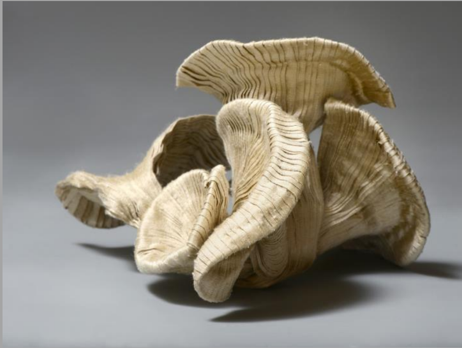
Ginkgo piézett selyem szobor 2020