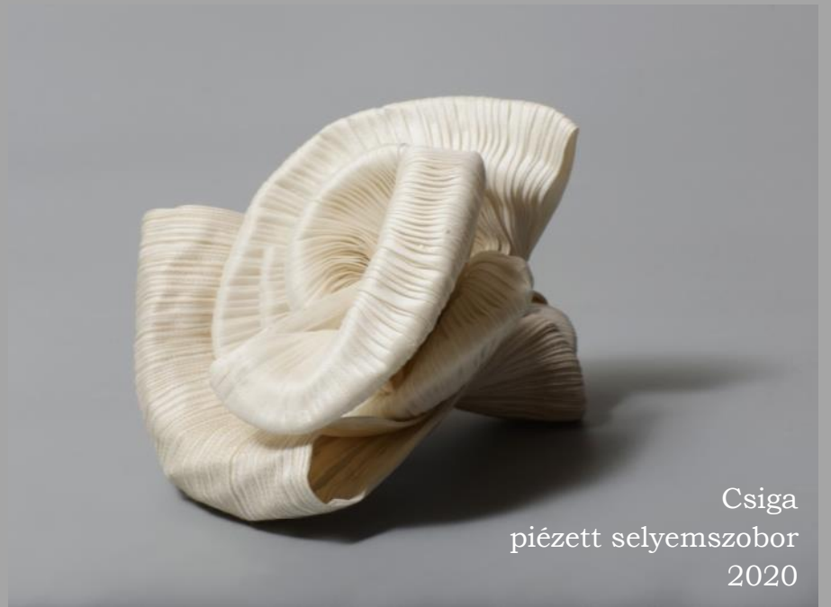
Csiga piézett selyemszobor 2020