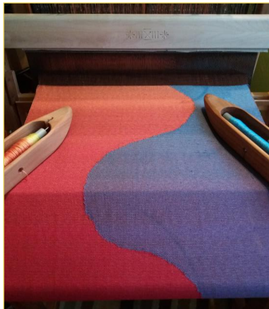
Különbéle technikák tanulmányozása