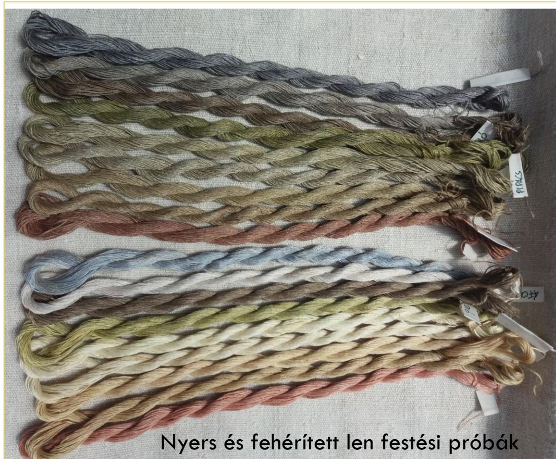
Nyers és fehérített len festési próbák