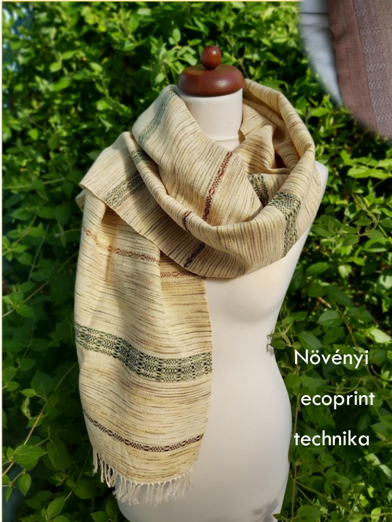
Növényi ecoprint technika