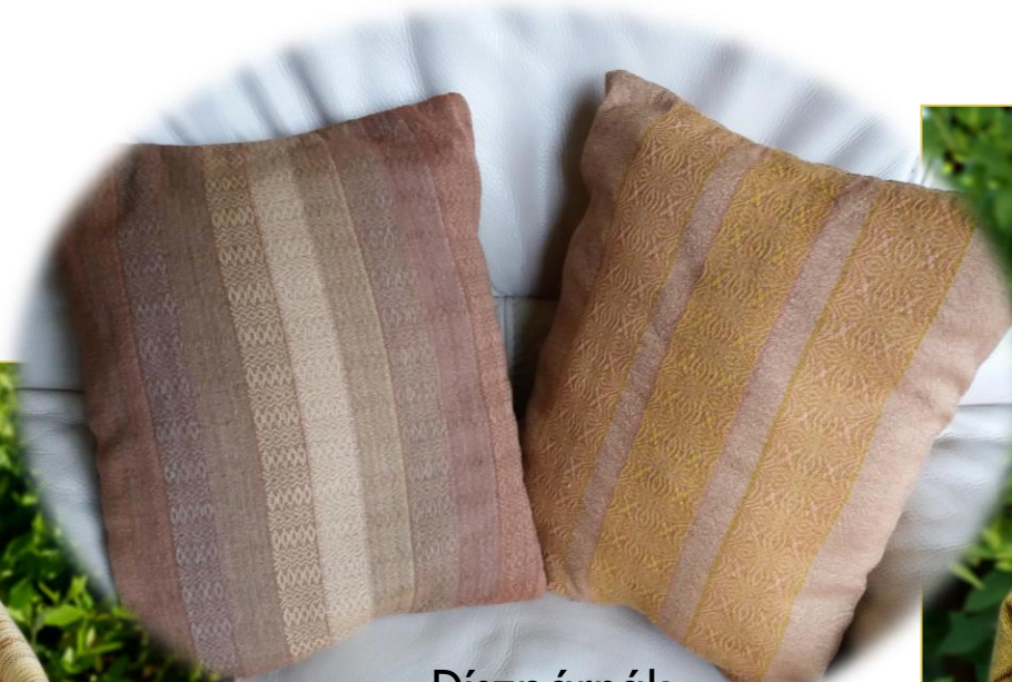
Díszpárnák növényi festett gyapjúból