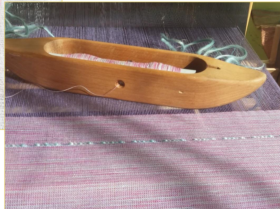
Len előfonal felhasználása szövésben