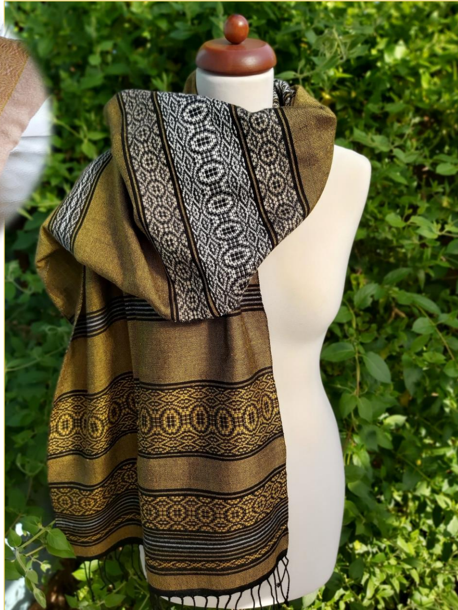
Mintázás növényi festett és természetes színű selyem szálakkal