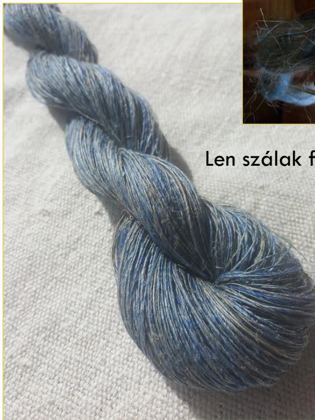
Len szálak fonása rokkán