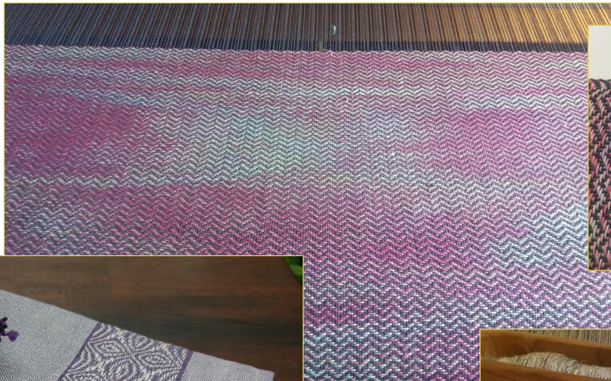
Len kéztörő sávolymintával