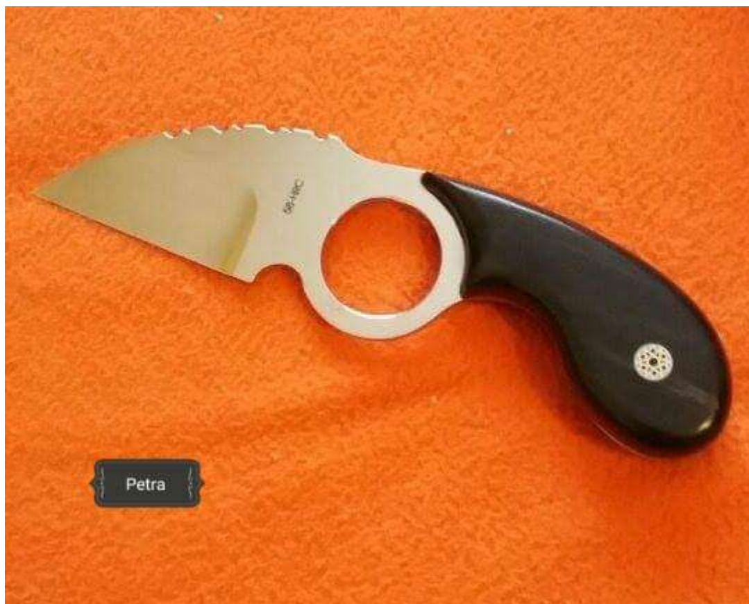
Medve karom, önvédelmi kés