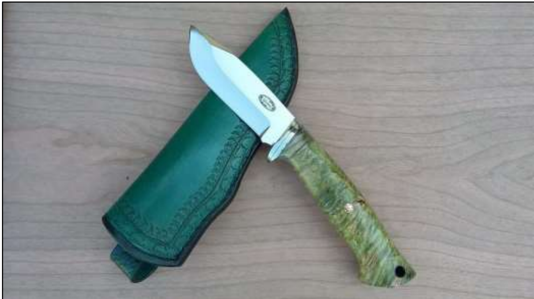
Zsigerelő Vadász kés