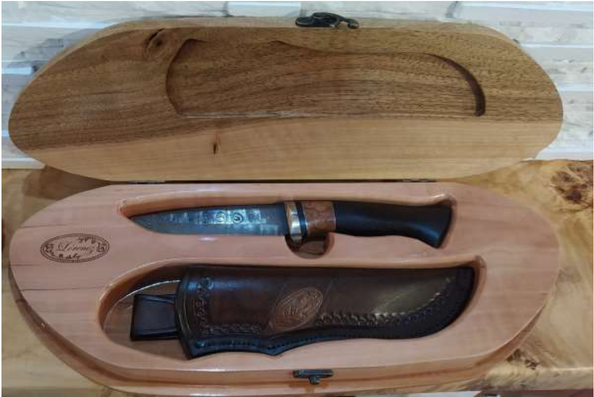
2021 Magyar Kézműves Remek Remeke Díj nyertes késem