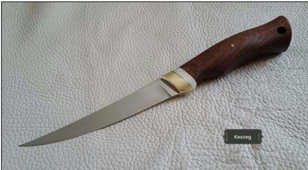
Hal filéző kés