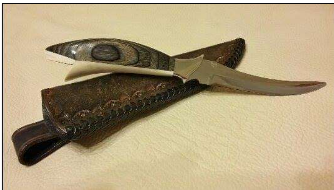
Cápa filéző kés