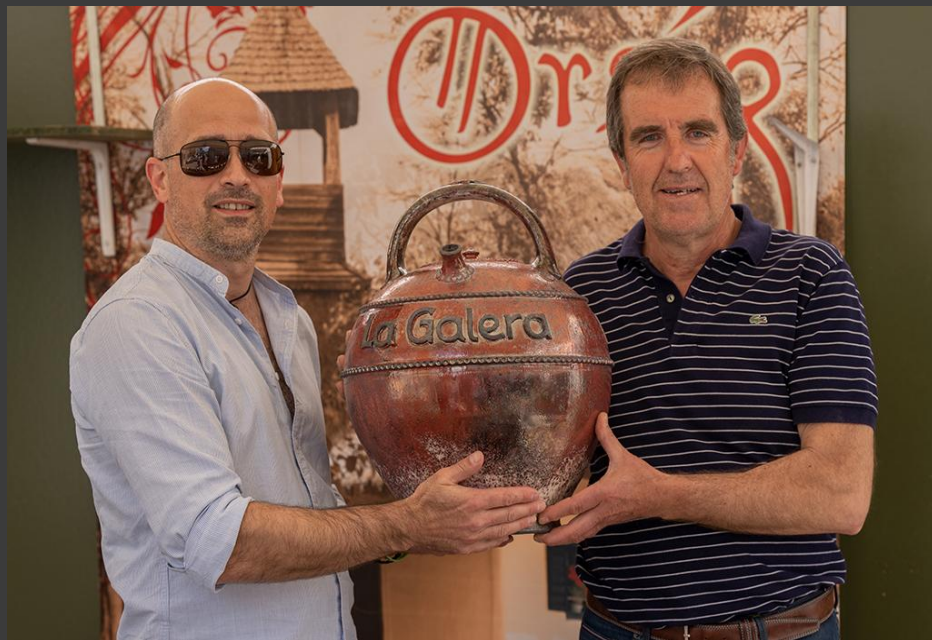
La Galera – Katalónia, Látványégetés 2022

2015-től folyamatos résztvevője vagyok spanyol, francia, olasz rendezvényeknek, ahol saját tapasztalataimat próbálom bővíteni.