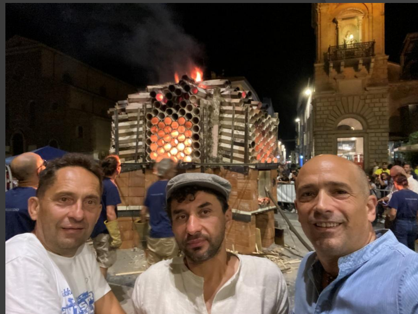
Faenza – Argilla Italia 2022

2015 óta vagyok résztvevője a találkozóknak, ahol az előző évben egy látványégetést is megvalósítottunk magyar kollégáimmal. A képen látható alkotásom azóta a helyi múzeum állandó kiállítási tárgyaként őrzi az esemény emlékét.